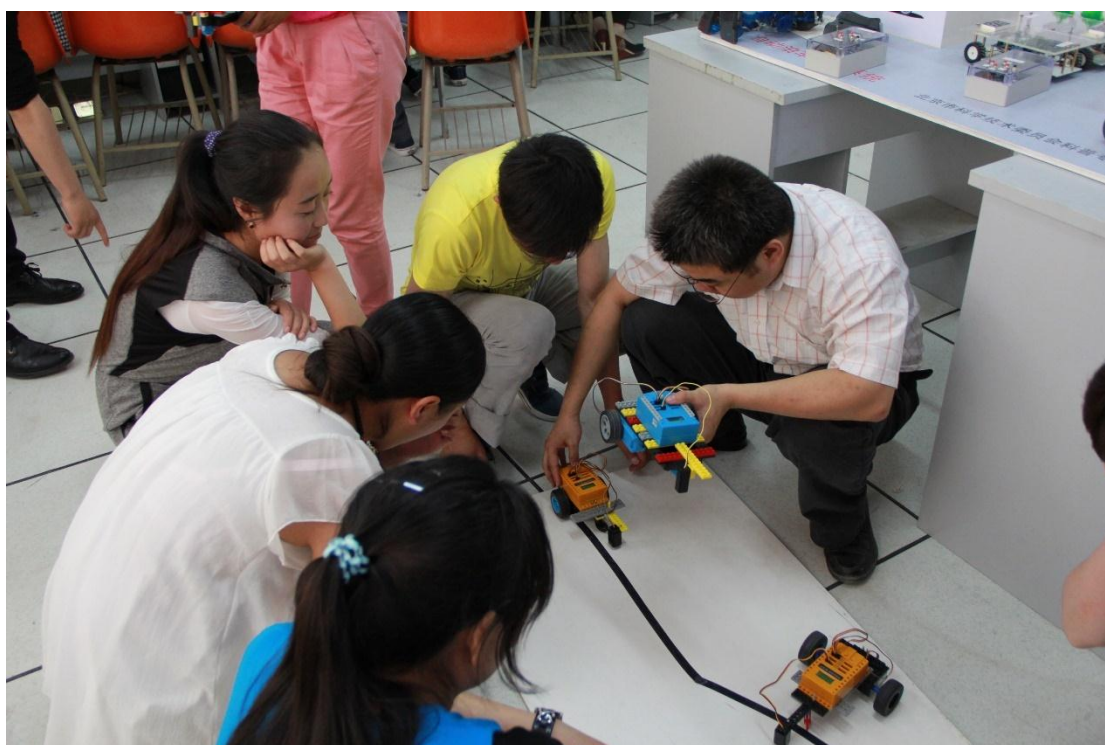
学员们动手实践，从机器人的搭建到编程，再到调试