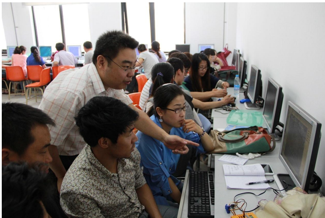
律原老师对学员们悉心地进行编程指导