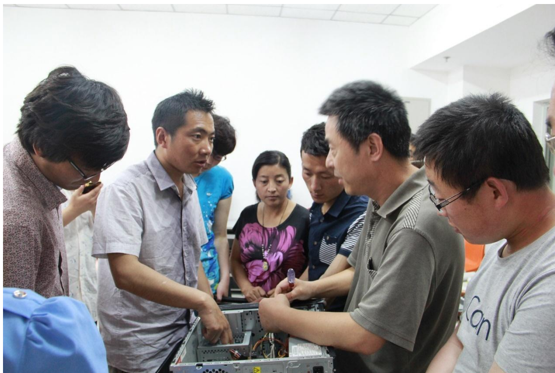
诸立尚老师辅导学生进行实践操作