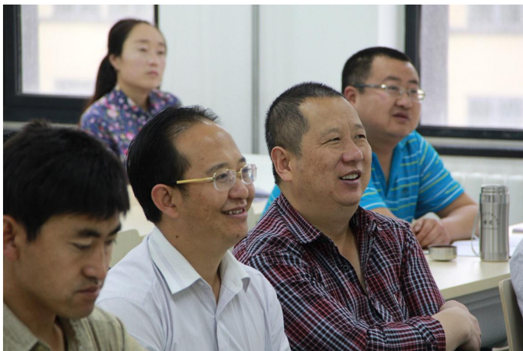
学员们听得津津有味