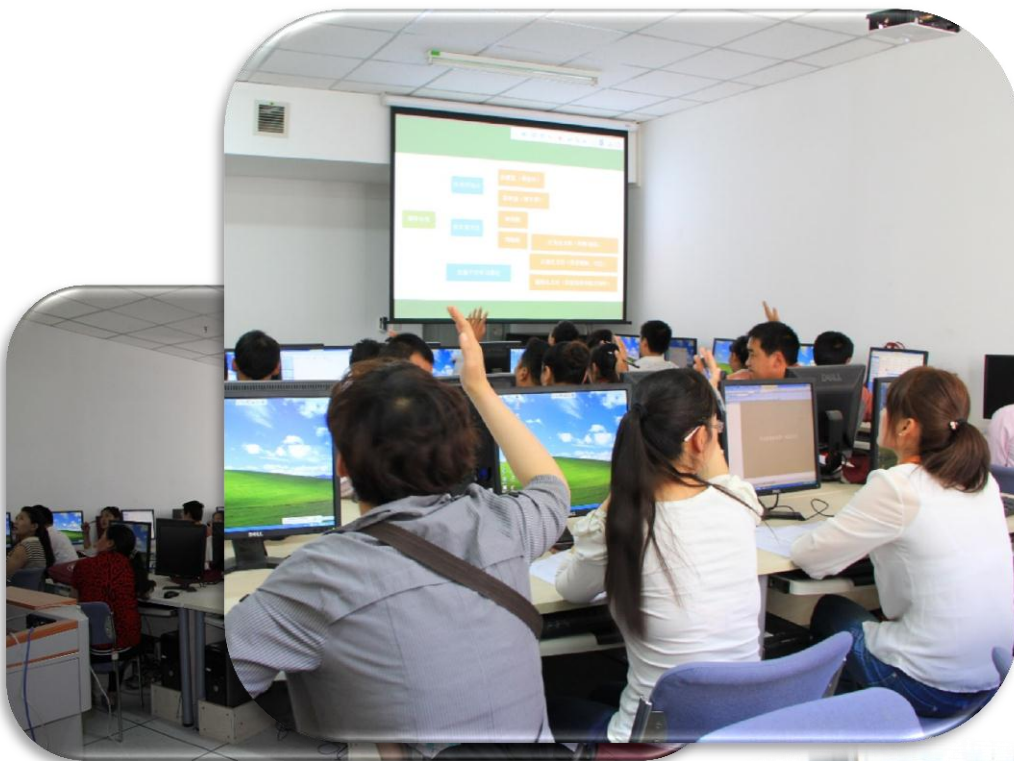
学员们上课积极讨论，踊跃举 手回答问题