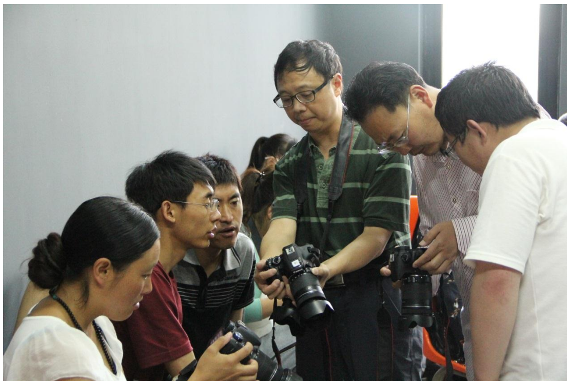
学员认真学习操作兴趣浓厚