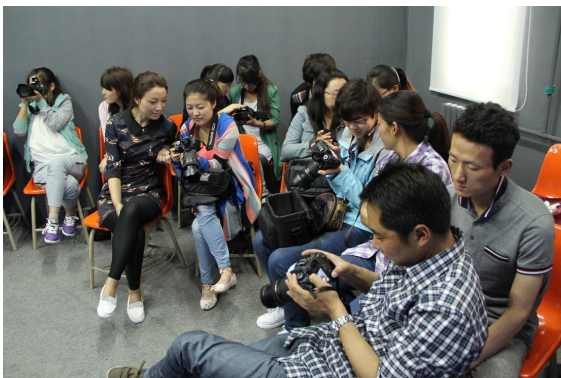
学员体验相机设置与操作