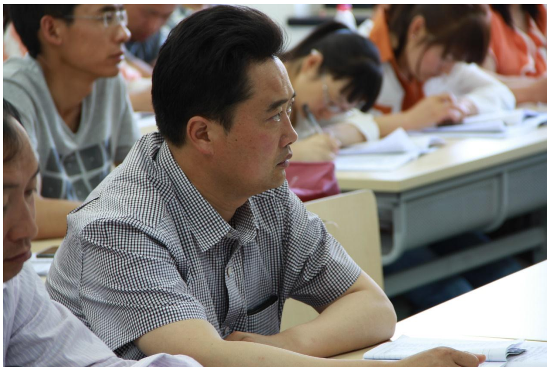
学员们认真听讲并记笔记