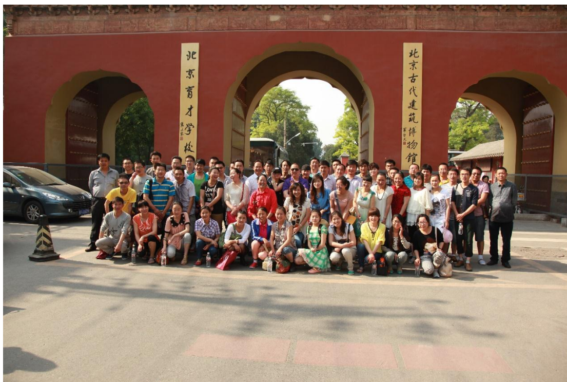
全体学员在育才学校前合影留念