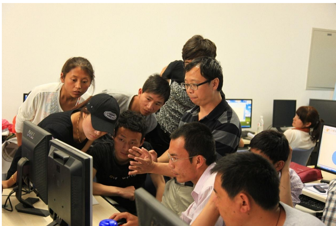
课堂中与学员们展开深入地交流与探讨