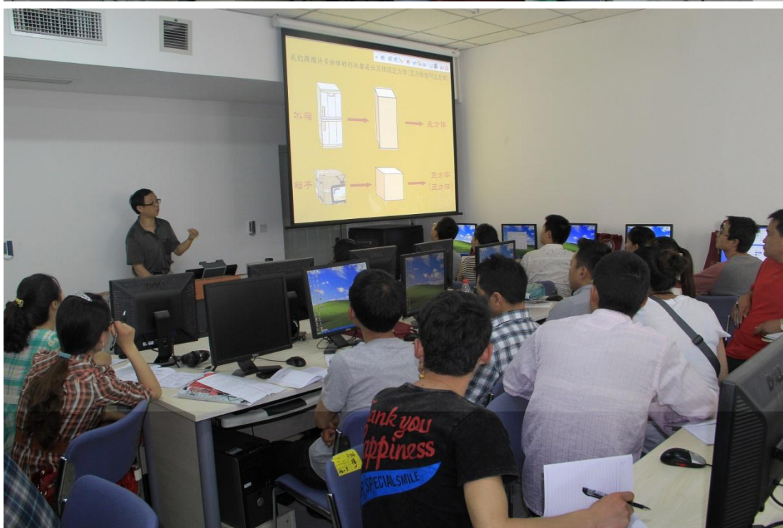
给学员们提供充分自主练习和动手实践的机会，并进行细致地指导