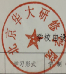
学校自设培训招生专业一览表