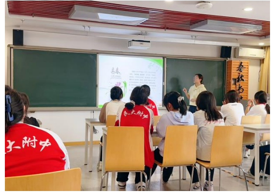
中央民族大学附属中学 举办诗词诵读活动