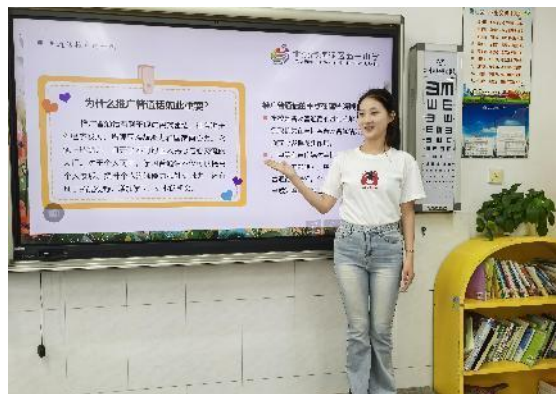
五一小学推普周主题班会