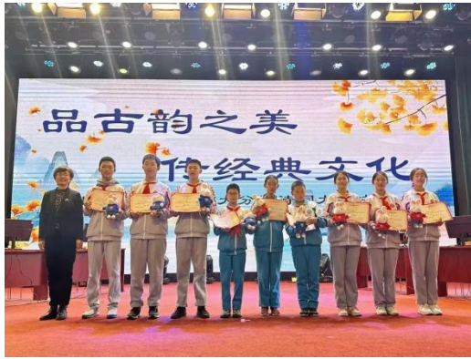
北京一零一中矿大分校古诗词大赛