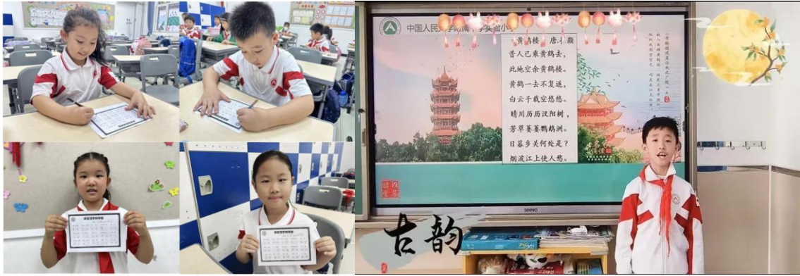
人大附中实验小学组织制作推普宣传手抄报 “词卡对对碰”、“拼音对对碰”、经典诵读活动