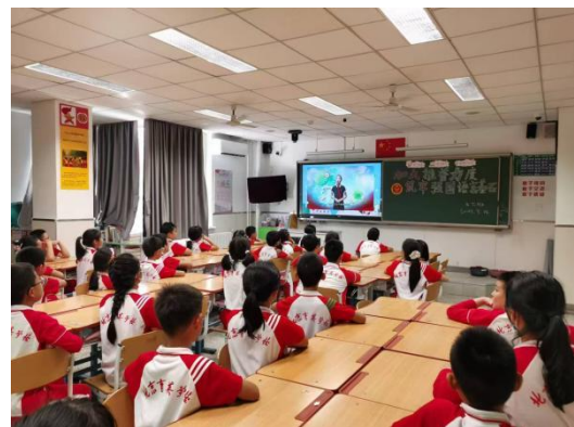
育英学校“呼唤未来，放飞梦想” 推普周主题活动