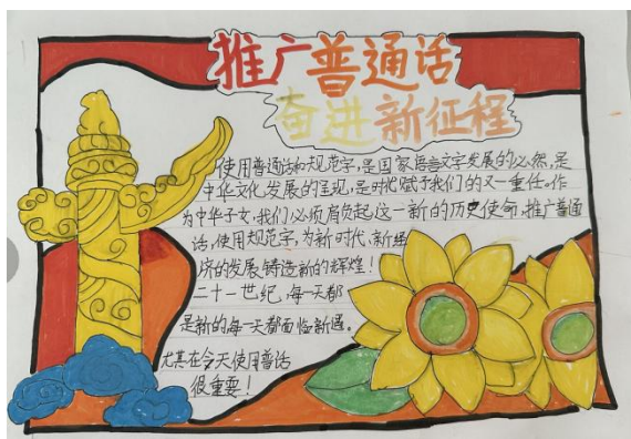
北京石油学院附属实验小学 手抄报活动