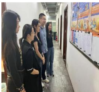
北京海工控股集团 有限责任公司的宣传栏

全区各街镇、单位纷纷行动，通过发布公益广告、张贴宣传画、悬挂宣传横幅、制作手抄报、布置宣传栏、电子屏等多种形式，积极开展宣传活动，营造浓郁的宣传氛围。