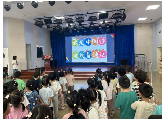
恩济里体大幼儿园国旗下讲话