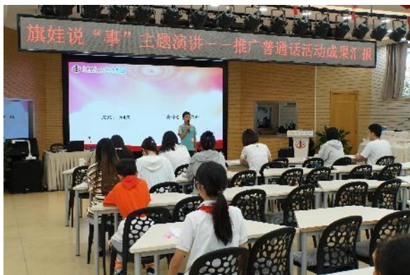
中关村第一小学西二旗分校 旗娃说“事”主题演讲