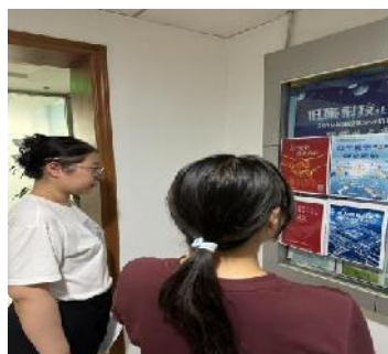
海淀审计局宣传栏