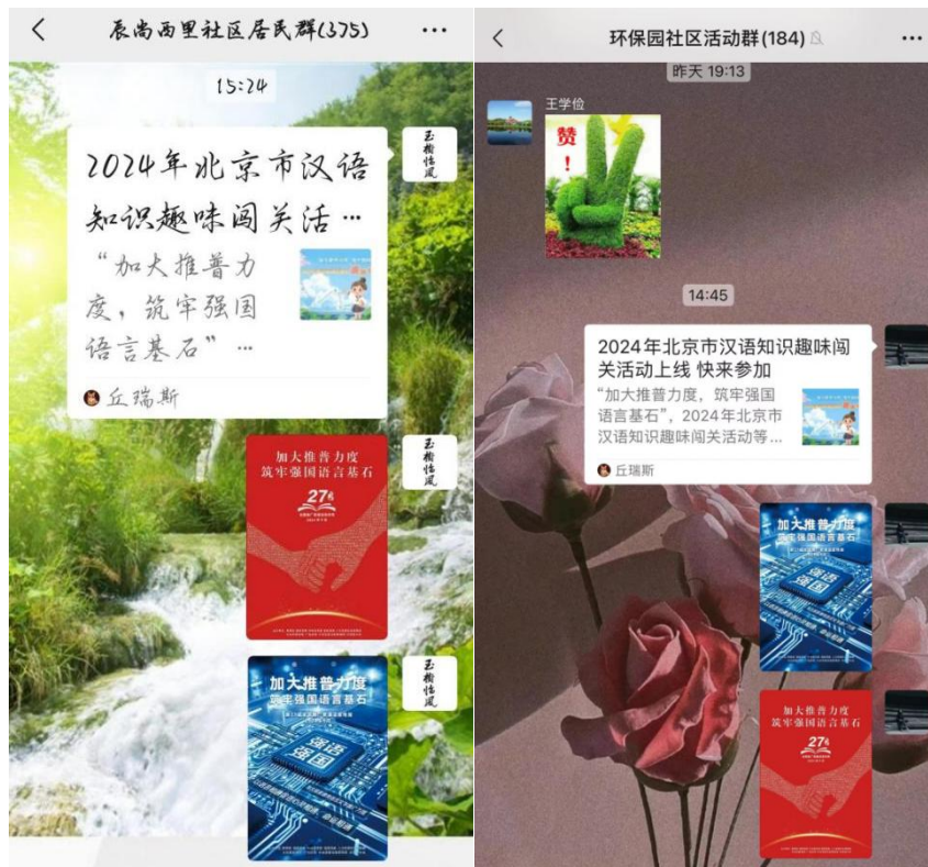
温泉镇人民政府组织居民参加北京市汉语知识趣味闯关线上活动

为扩大宣传效果，海淀区各单位充分利用主流媒体、新媒体以及社区公告、微信群等渠道，广泛宣传推普周活动。如通过模拟购物、问路、就医等情境对话活动，让居民们在日常生活中更好地运用普通话进行交流，提高了推普工作的实效性。