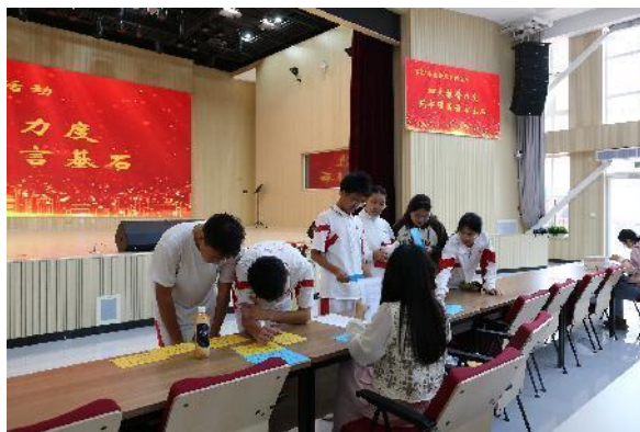
中国人民大学附属中学第二分校 普通话闯关活动