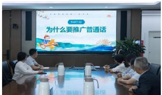
海淀城管执法局、海开控股集团积极开展宣传工作