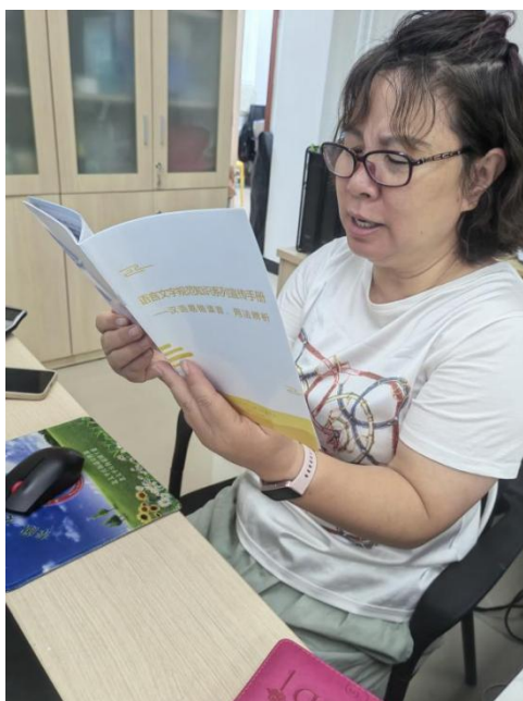
北太平庄街道组织居民学习 语言文字规范知识系列宣传手册