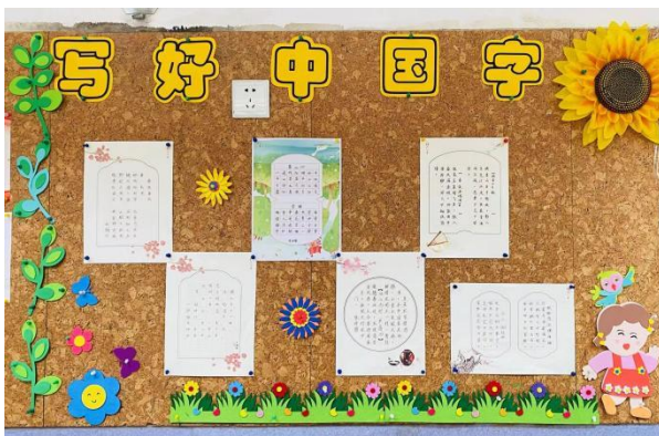
枫丹实验小学写好中国字活动