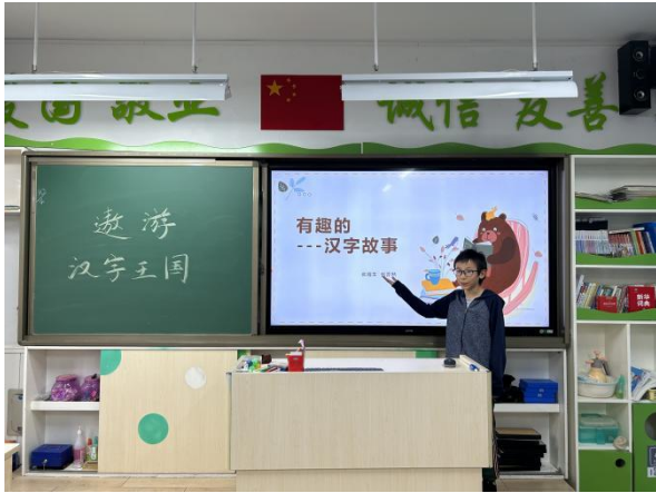
北京林业大学附属小学 “遨游汉字王国”主题班级活动