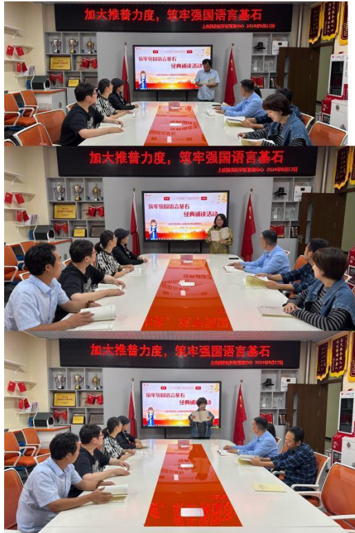
上庄西北旺学区推普周经典诵读活动