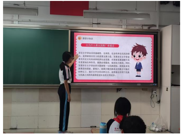
首都师范大学附属小学 推广普通话主题活动