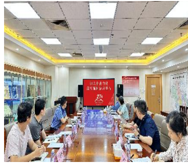
海淀区教育人才服务中心利用电子屏学习

学校是国家通用语言文字教育基础阵地。各中小学校通过开展国旗下讲话、主题班会队会等形式多样的推普宣传活动，传承弘扬以语言文字为载体的中华优秀传统文化，增强学生自觉规范使用国家通用语言文字的意识，提高文化自觉，增强文化自信。