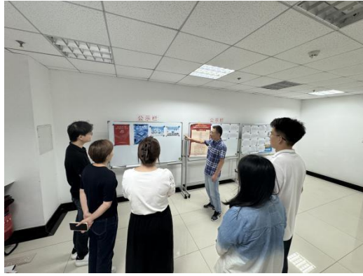
海淀区应急管理局积极开展推普宣传工作

为扩大宣传效果，海淀区各单位充分利用主流媒体、新媒体以及社区公告、微信群等渠道，广泛宣传推普周活动。如通过模拟购物、问路、就医等情境对话活动，让居民们在日常生活中更好地运用普通话进行交流，提高了推普工作的实效性。