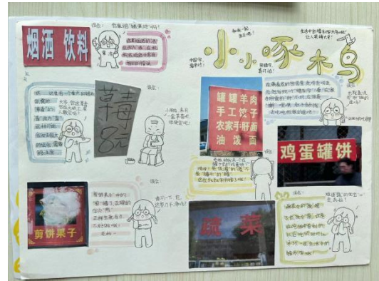
尚丽外国语学校 “啄木鸟纠错”活动