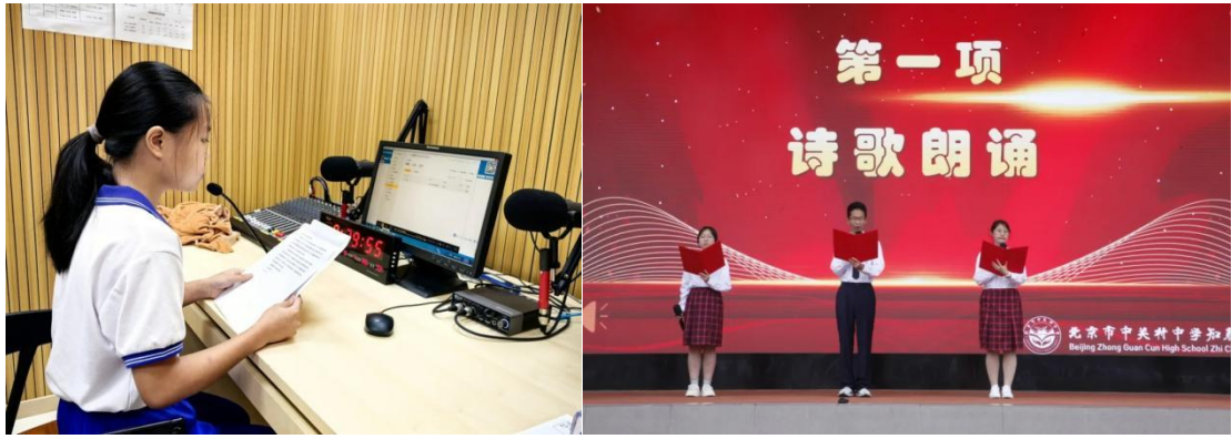
中关村中学知春分校 校内晨间广播站《加大推普力度 筑牢强国语言基石》 中秋诗词歌赋活动