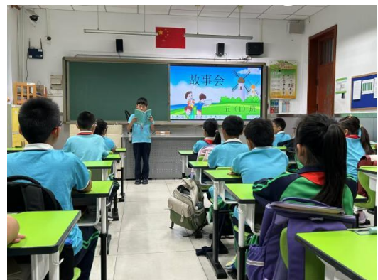
北安河小学故事会