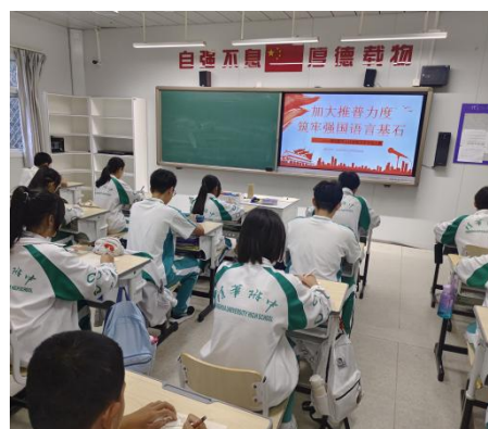
清华附中上庄学校举办汉字书写比赛