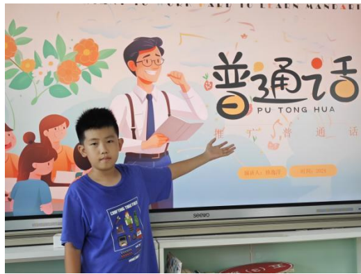
中国人民大学附属小学亮甲店分校 推普周主题班会