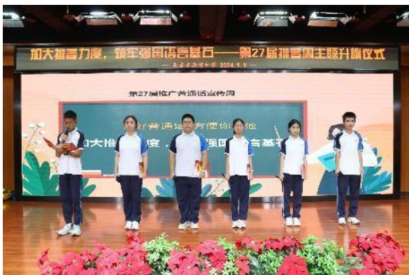
清河中学推普周主题升旗仪式