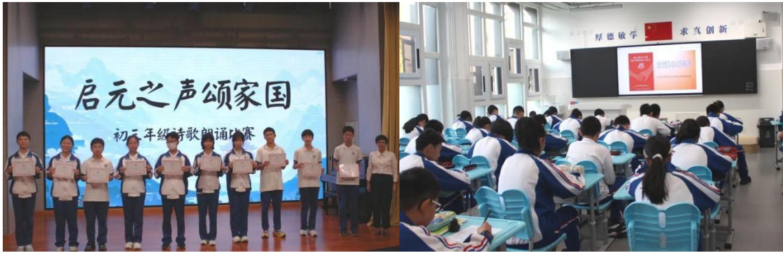
中科启元学校初中部“启元之声颂家国”朗诵比赛和语言纠错比拼活动