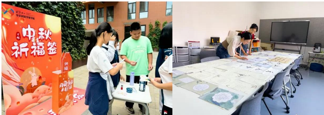
北京十一中关村科学城学校组织“普通话不普通”绕口令挑战赛、 中秋节传统文化日、“笔墨丹青”书法比拼活动

普通话和规范汉字是国家通用语言文字，它承载着传承与发展中华优秀传统文化的使命，是维护民族团结、促进社会经济发展、加强国家软实力的重要手段。普通话教育不仅是语言教育，