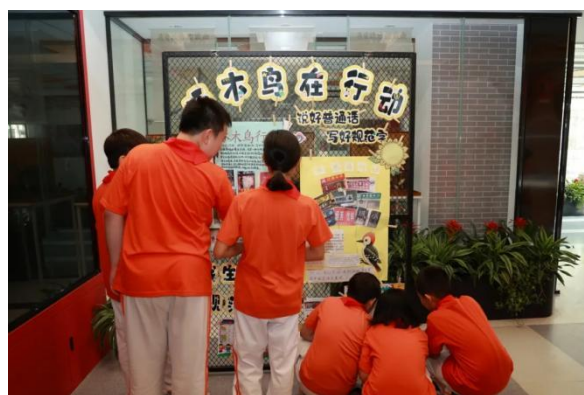
中关村第一小学组织学生开展葵园“绕口令”挑战赛、葵园“啄木鸟”小队活动