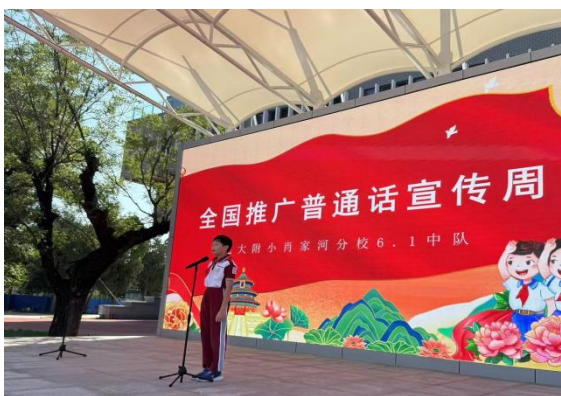
北京大学附属小学肖家河分校 国旗下讲话