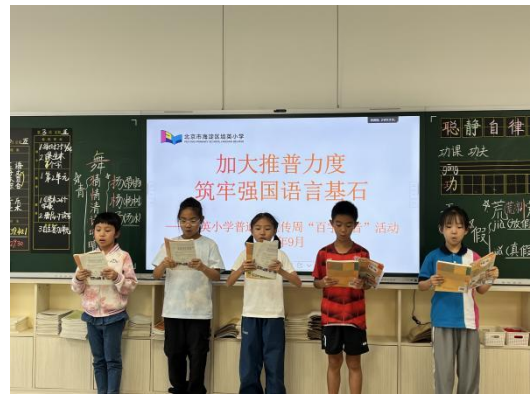
培英小学“百字百音”朗诵挑战活动