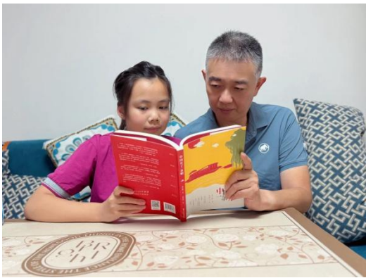
航天图强小学亲子共读一本书