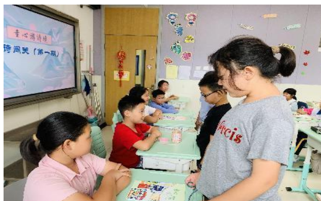
北京石油学院附属小学 “童心游诗境”古诗考级闯关活动