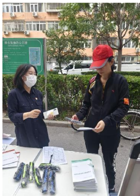
紫竹院街道向居民普及 普通话、规范字知识