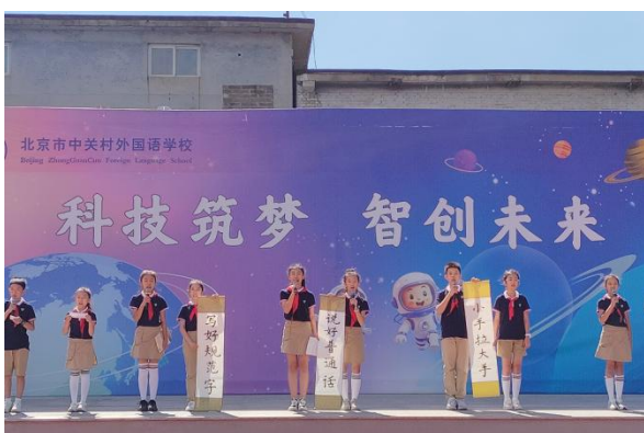
中关村外国语学校举办诗歌创作比赛