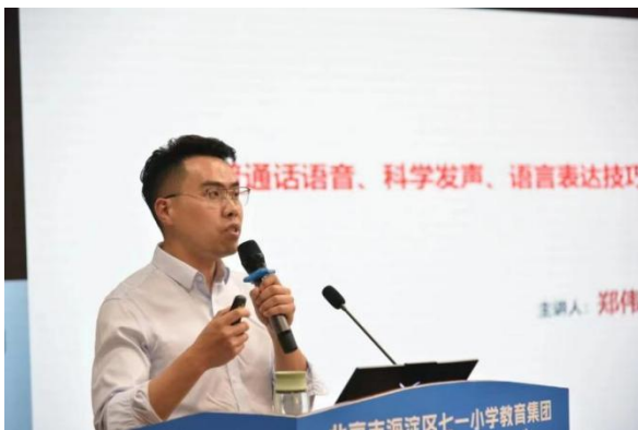
七一小学推广普通话专家讲座