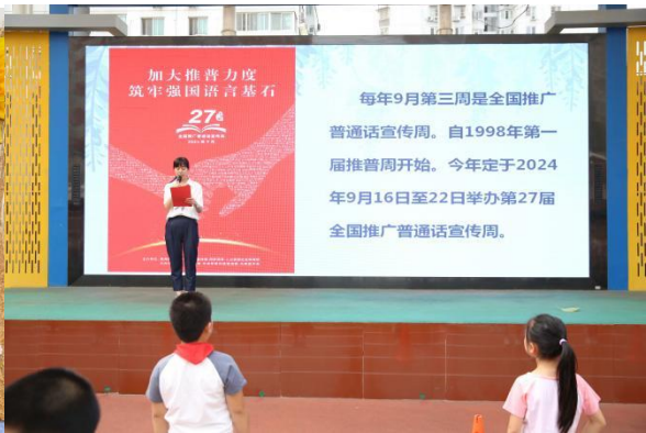
前进小学国旗下讲话