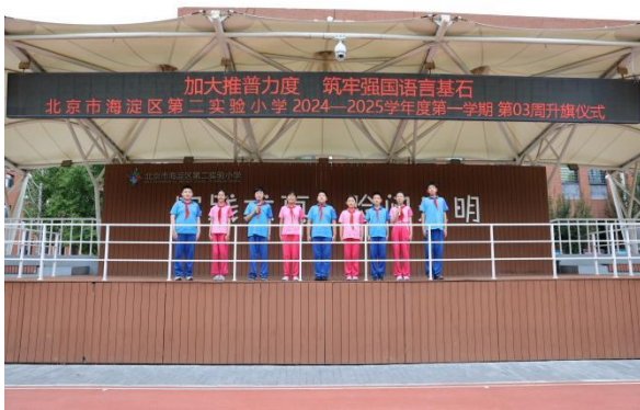
海淀区第二实验小学 国旗下讲话