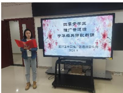
四季青学区管理中心 推广普通话中华经典诗歌诵读活动

海淀区部分学区管理中心、直属单位组织干部教师开展了诗歌诵读、教师正音比赛等一系列丰富的推普宣传活动。