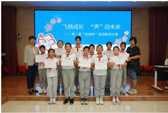
海淀区第四实验小学 第一届“思晓杯”校园演讲比赛