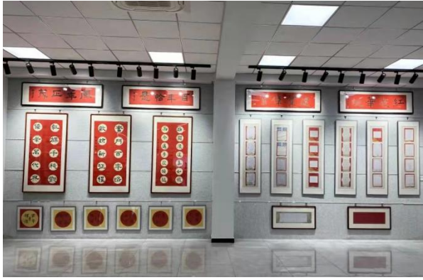
玉渊潭中学举办经典作品展演活动