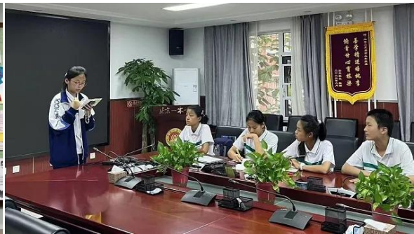
北京一零一中双榆树校区 赏读《西游记》手抄报和七年级演讲比赛