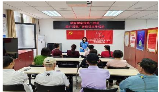
北下关街道、清河街道各社区组织居民集中学习