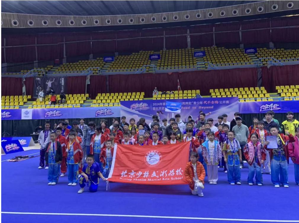
图 15：学生比赛 1

(2) 参加由北京市体育局、北京市教育委员会主办的 2024 年北京市青少年武术套路锦标赛，获得第一名 2 人，第二名 1 人，第三名 2 人。