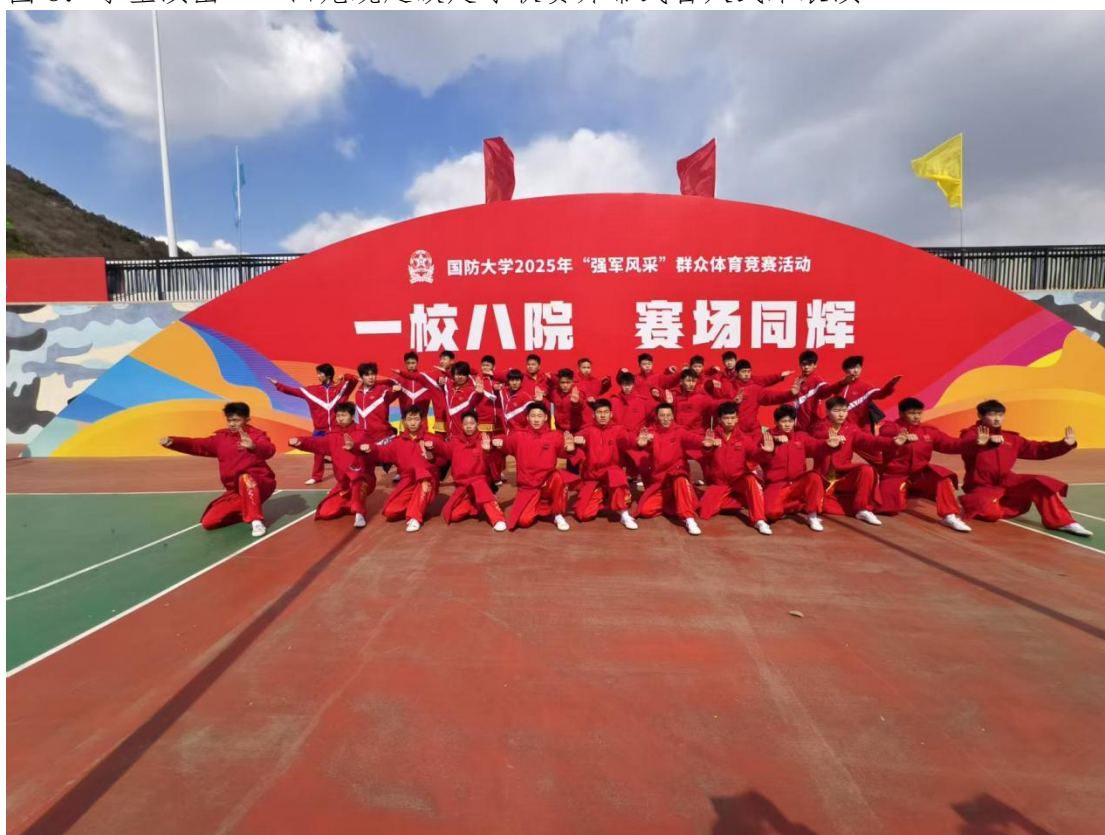
图 9：学生演出——中国人民解放军国防大学校运会表演