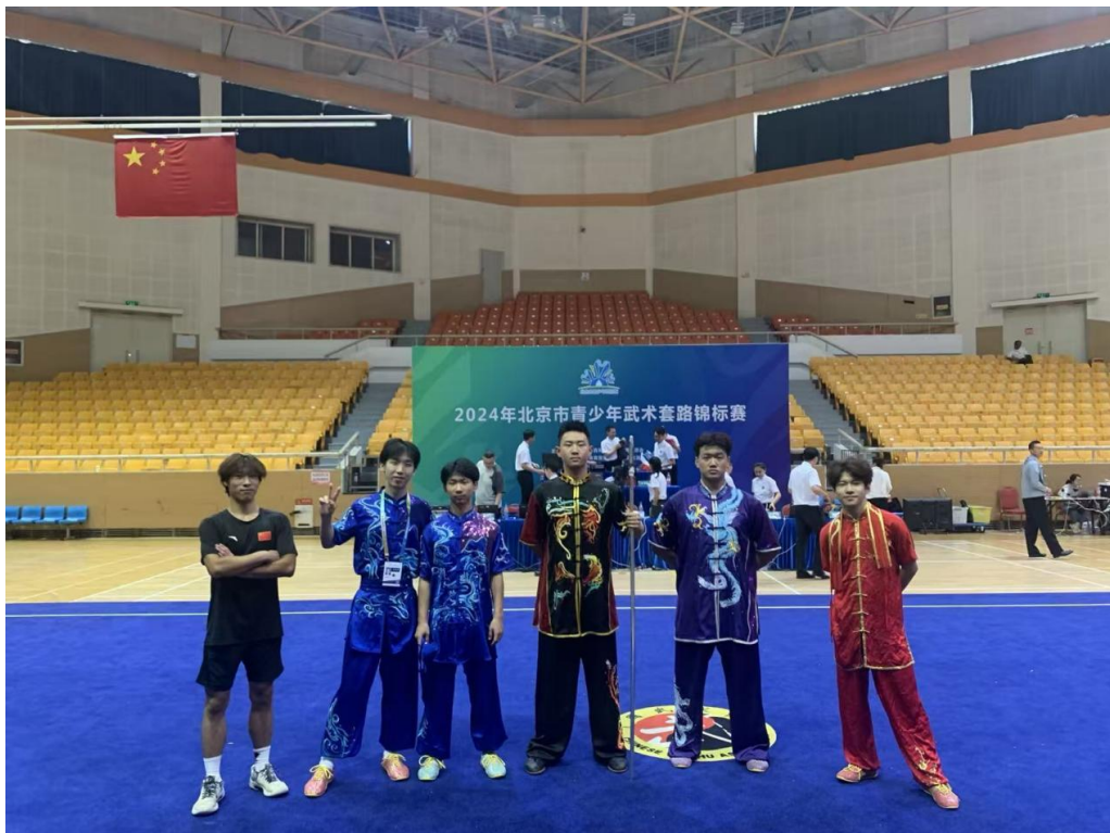
图 16：学生比赛 2

(2) 参加由北京市体育局、北京市教育委员会主办的 2024 年北京市青少年武术套路锦标赛，获得第一名 2 人，第二名 1 人，第三名 2 人。