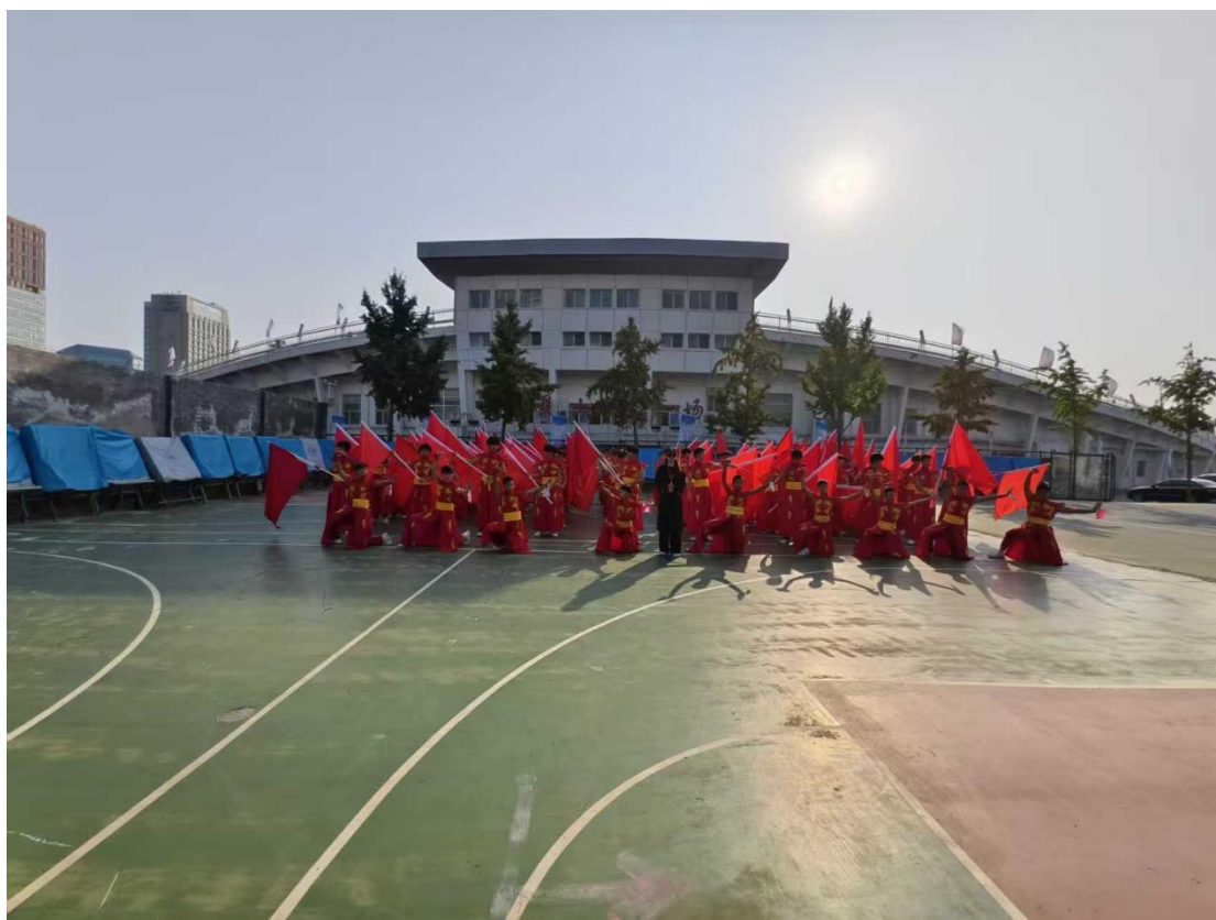
图 7：学生演出——石景山区秋运动盛会开幕

典型案例：学校武术社团定期组织武术表演和比赛活动。学生自愿参与武术协会的排练和表演工作，积极参与北京市各类武术比赛。通过这些活动，学生不仅提高了自己的武术技艺和表演能力，还培养了他们的领导能力、团队协作能力和创新能力等综合素质。同时，武术表演也成为了学校对外展示形象的重要窗口。