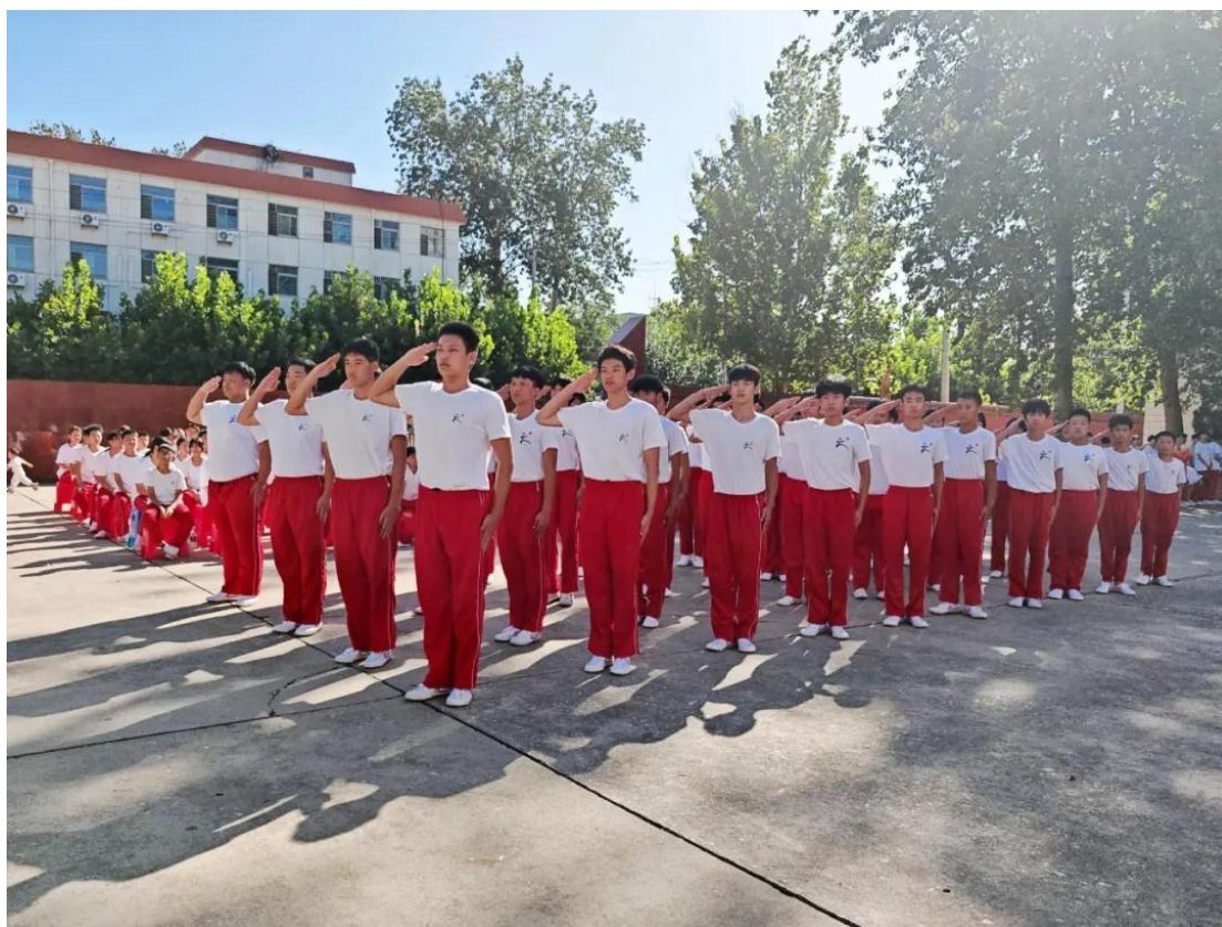
图 23: 军训 1

学校在传承武术技能的同时,也注重红色传统的发扬。在文、武课堂教学中,教师教练将革命历史故事、英雄事迹等融入课堂教学和校园文化建设中,让学生在潜移默化中受到红色传统的熏陶。此外,学校还组织学生观看革命题材的电影,开展周一主题升旗仪式、主题班会、黑板报、绘画、手抄报比赛演讲比赛、文艺演出等形式,让学生深入了解红色传统,增强他们的历史使命感和责任感。在校园文化建设中,学校设置红色文化宣传栏、张贴革命历史图片等,营造浓厚的红色文化氛围。通过课堂教学和校园文化建设,将红色传统融入学生的日常学习生活中。