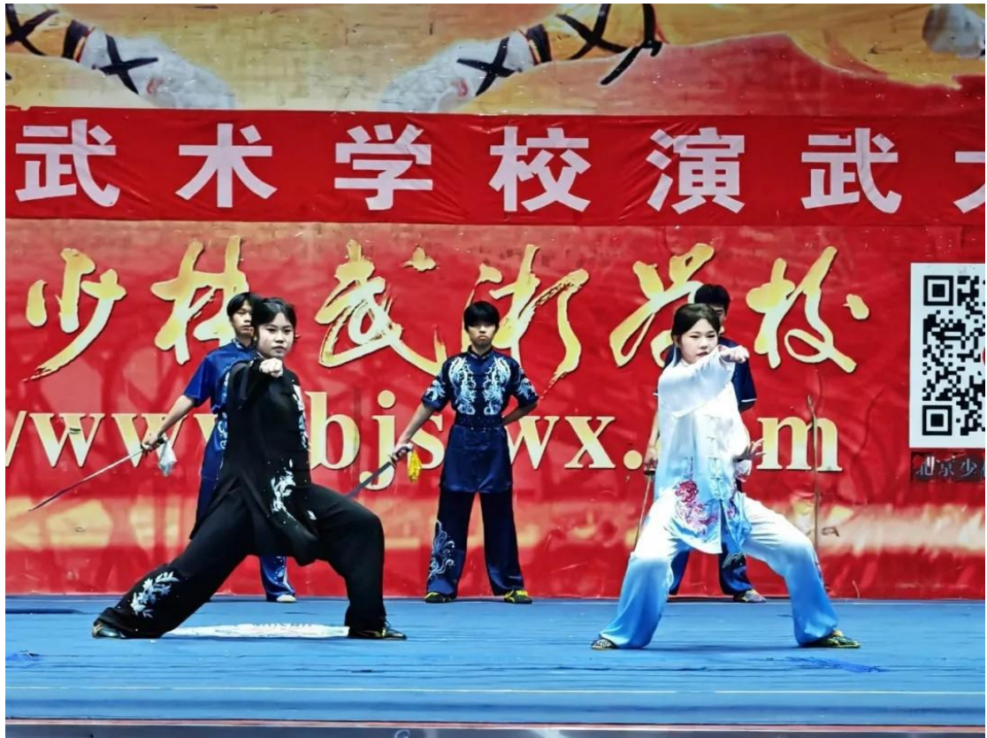
图 5：演武大会 2