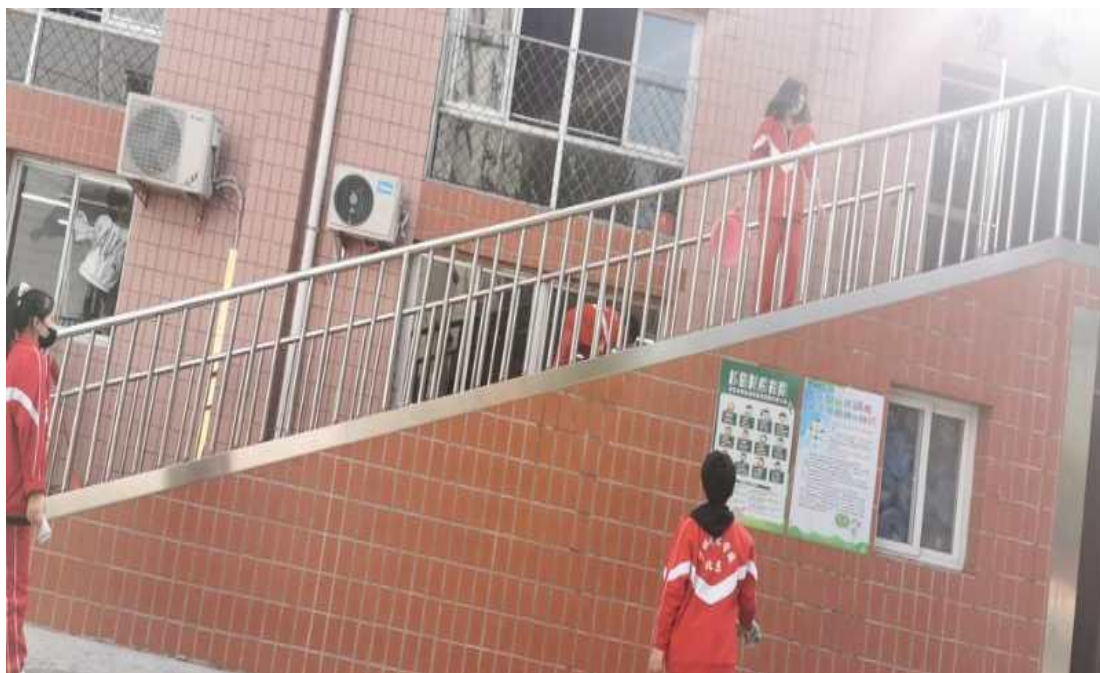
图 2：学生课余活动 2