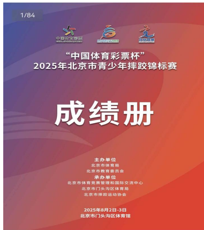
图 22：学生比赛 8

(7) 参加由北京市体育局、北京市教育委员主办“中国体育彩票杯“2025年北京市青少年摔跤锦标赛，获得自由式摔跤男子 80 公斤级第三名 1 人。