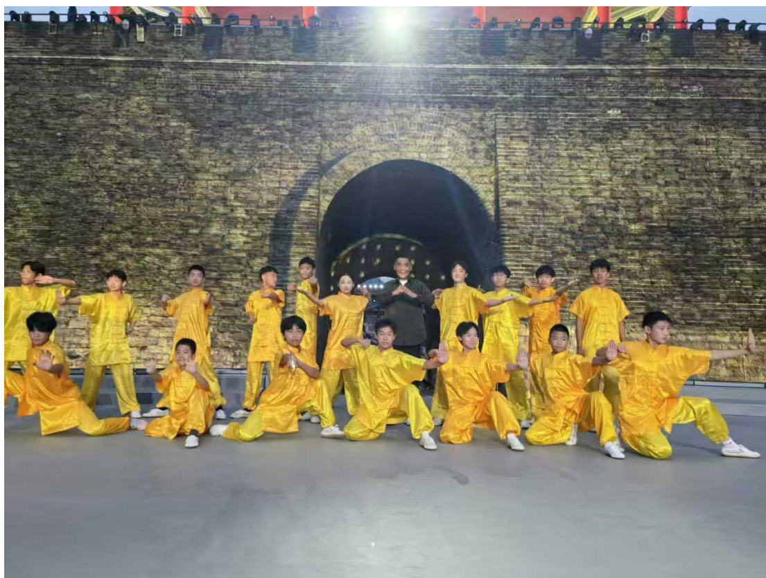
图 12：2024 年第五届“居庸山月”中秋晚会《精忠报国》 3、学校学生参加中央电视台“2024 蓝月亮经典之夜”