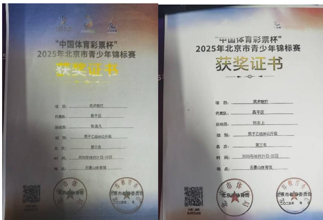
图 20：学生比赛 6

(5) 参加由北京市体育局、北京市教育委员主办的 2025 年“中国体育彩票杯”北京市青少年武术散打锦标赛，获得第三名 3 人，第五名 2 人。