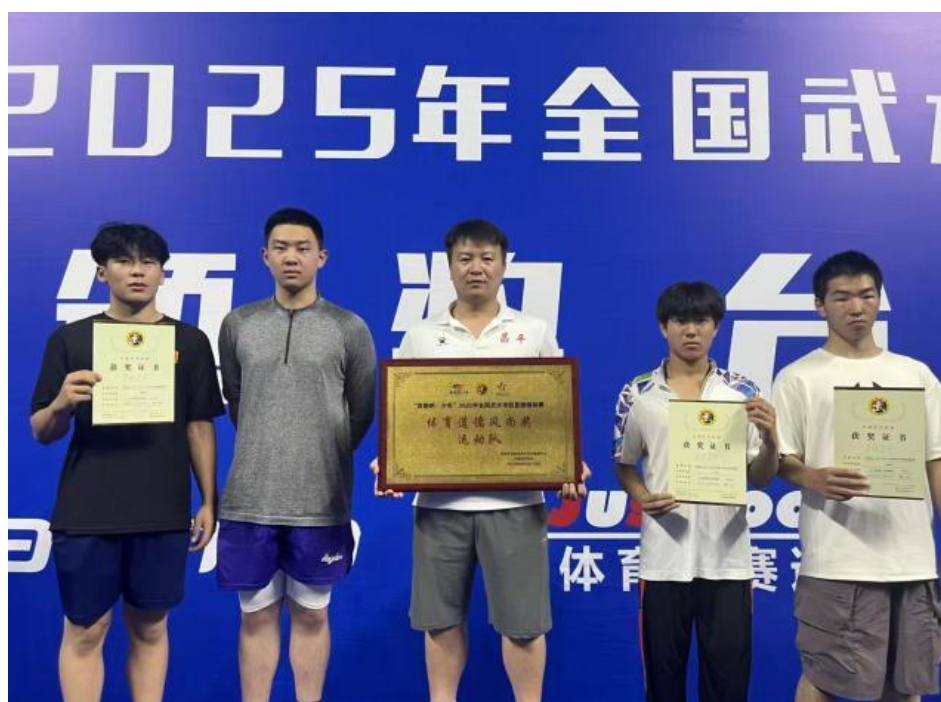
图 18：学生比赛 4

(4) 参加由北京市体育局、北京市教育委员主办的 2025 年“中国体育彩票杯”北京市青少年武术散打冠军赛，获得第三名 1 人，第五名 2 人。