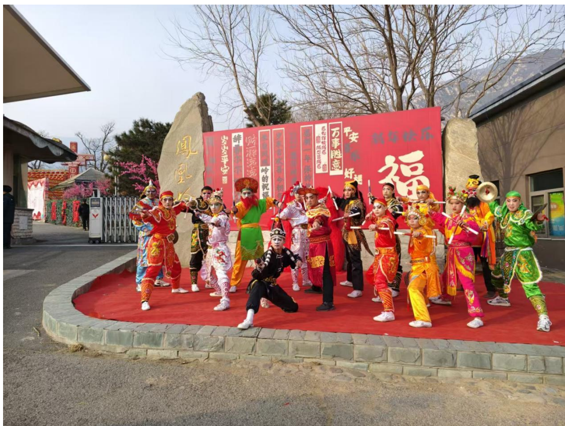
图 10：学生演出——凤凰岭 2025 春节民宿活动 1