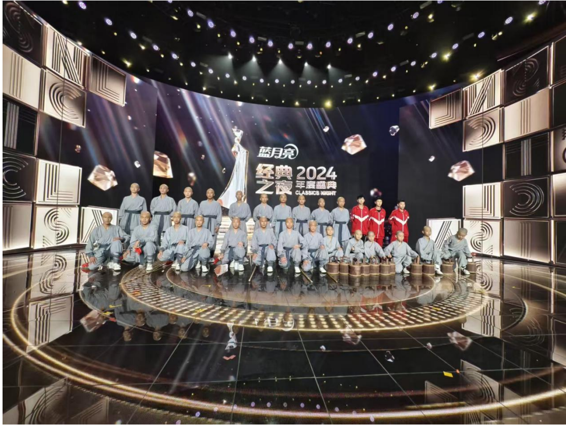
图 14：2024 蓝月亮经典之夜