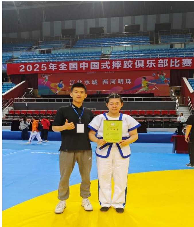
图 21：学生比赛 7

(7) 参加由北京市体育局、北京市教育委员主办“中国体育彩票杯“2025年北京市青少年摔跤锦标赛，获得自由式摔跤男子 80 公斤级第三名 1 人。