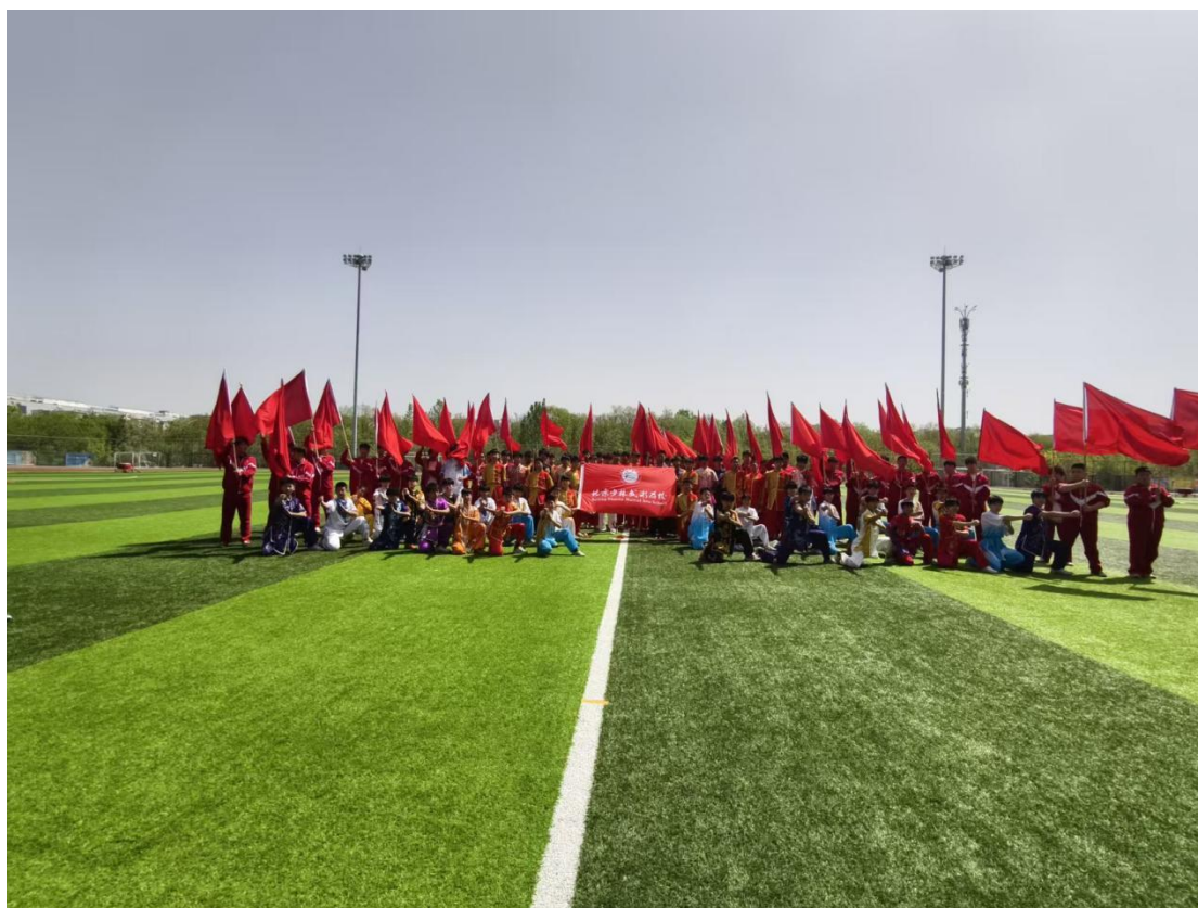
图 8：学生演出——回龙观超级足球联赛开幕式百人武术表演