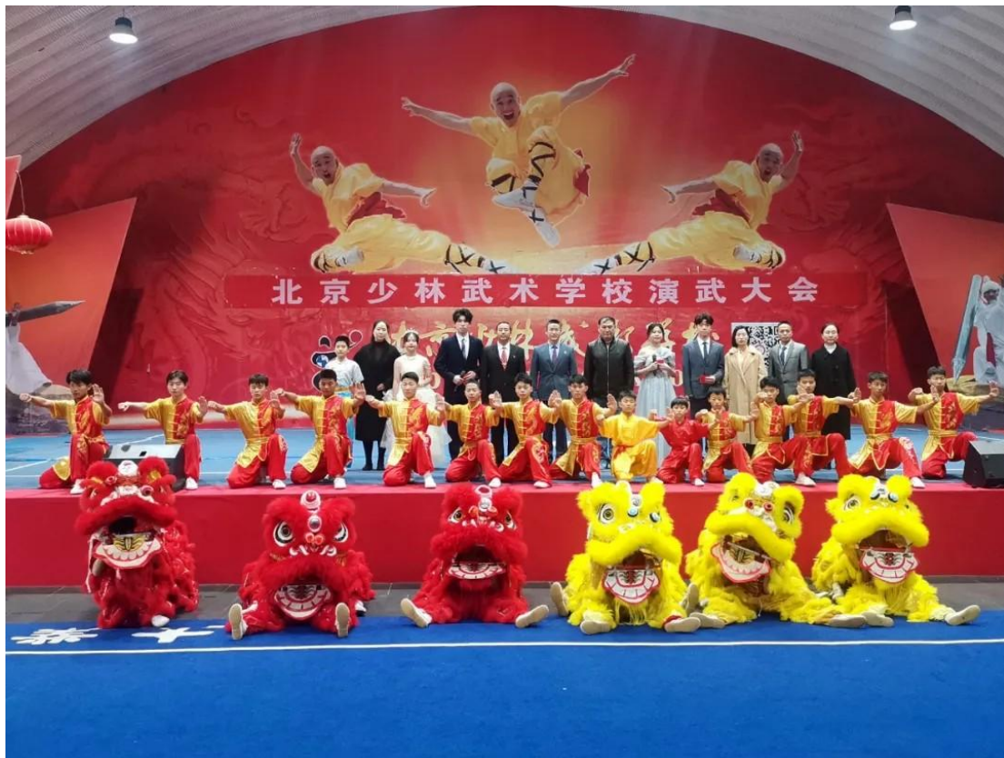
图 4：演武大会 1