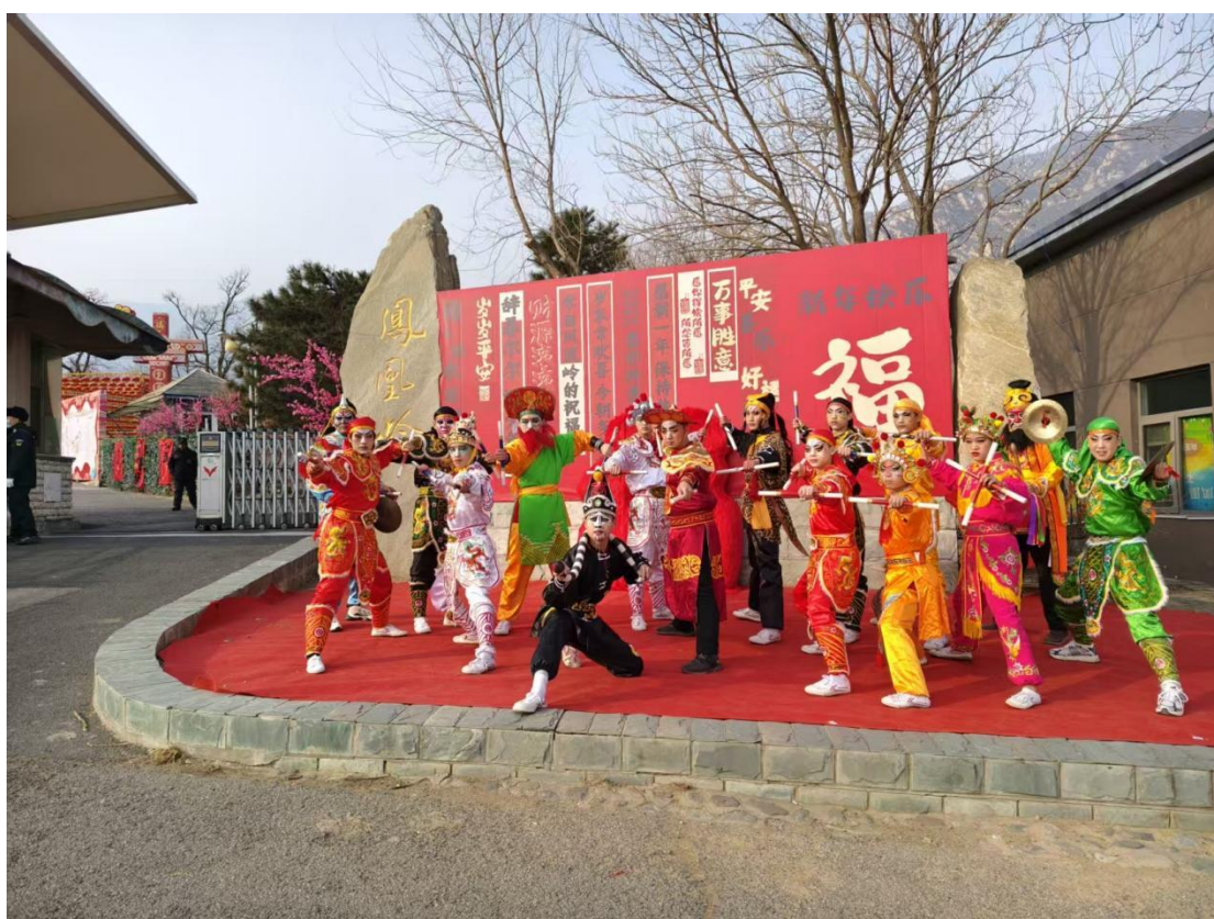
图 11：学生演出——凤凰岭 2025 春节民宿活动 2