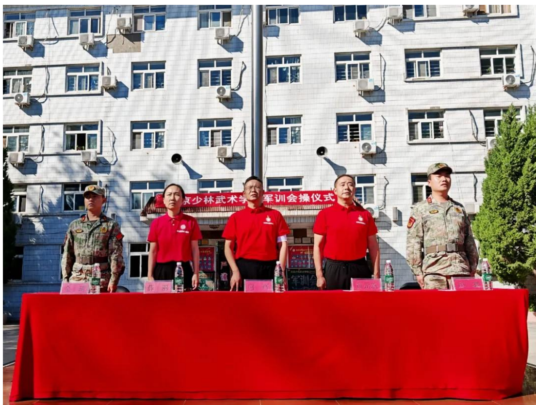
图 24：军训 2