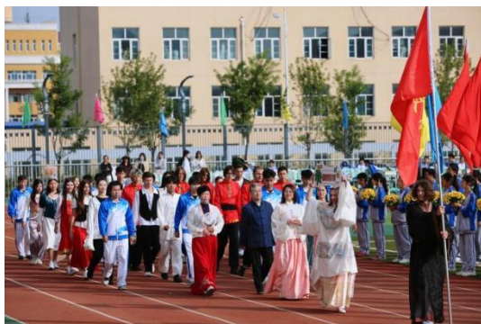
图—43 体育节开幕式上国际教育特色方阵

学校共招收来自“一带一路”俄罗斯、哈萨克斯坦、塔吉克斯坦、泰国和意大利等五个国家 42 名留学生，学习国际中文和数字媒体专业。坚持国际化战略，“中文+职业技能>2”育人模式助力国际教育新发展；为国际学生开设口语、听力、阅读、写作等国际中文课程和数字媒体专业体验课程、以及中国文化、地理、手工、书法、民乐等课程，使留学生增长国际中文知识、强化职业技能、提高综合素养，引领他们成为中国文化的传播者、践行者。