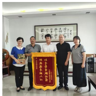
图—61 千家店镇赠送锦旗