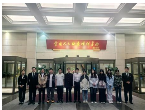
图—4 烹饪专业学生到全国人大北京培训基地进行工学交替

烹饪专业以“服务区域发展、培育烹饪匠心”为核心，构建了“产教融合、实训导向、多元赋能”的建设体系，实现“教学-实训-就业”无缝衔接，共同打造沉浸式实训场景。与大董烤鸭、冬奥村、皇冠假日酒店等 30 多家知名企业开展长期合作。在学生工学交替、企业实习实践中深度融合，共同育人。