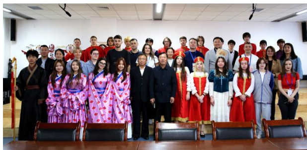
图—46 国际学生接待俄罗斯教育代表团