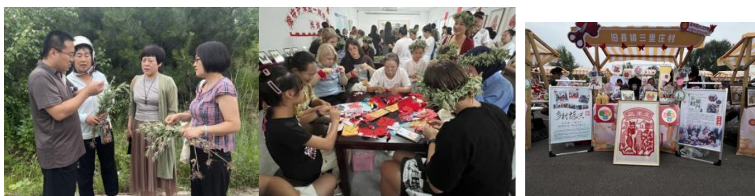
图-30 邀请专家助农调研图-31 开班授课助农开发产品图-32 助农产品在农民丰收节精彩亮相

学校三里庄文艺中专班紧扣《农村资源开发与利用》课程实践，以本地艾草为原料，开启特色产品开发之路。端午前后学员们抢抓时机采收新鲜艾草，在专业老师指导下开启“全株利用”模式：鲜嫩艾叶制成清香馥郁的艾草茶，兼具祛湿散寒之效；剩余叶片提炼成驱蚊止痒的艾草纯露；晒干后的艾草梗填充成安神助眠的艾草枕头。这些创新做法，打破了学员们对艾草“煮水泡脚”的单一认知。大家主动搬出家中囤积的陈艾草寻求开发方案，师生合力将陈艾草搓制成艾绒，进一步研发出艾绒坐垫、鞋垫、艾柱及艾草香囊等产品。新鲜艾草、陈年艾草分类开发，催生出品类丰富的艾草产品。带着浓郁艾叶香的特色好物，在延庆农民丰收节上惊艳亮相。