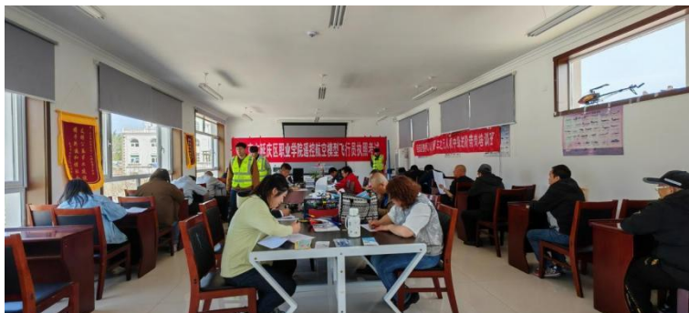
图—26 残联飞行员执照考试

型飞行员取证培训，20名残疾人学员全员通过。开展涵盖视距内与超视距操作的低空CAAC无人机驾驶员培训，提升实操能力。联合承办第三届全国技能大赛北京市选拔赛无人机驾驶（植保）赛项及“国彩杯”京津冀青少年无人机足球联赛，推动竞技无人机普及与区域协同发展。为延庆低空经济可持续发展注入了专业动能。