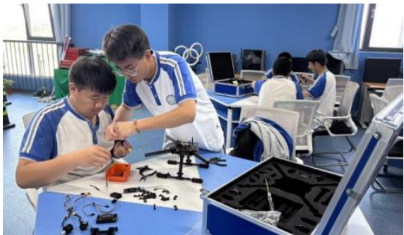
图—50 无人机组装与维修课

信息技术系无人机操控与维护专业立足延庆区域发展，构建了“校企协同、育训结合”的特色发展模式。依托合作企业实训基地，通过“企业文化进课堂”、“工学交替”、“顶岗实习”三年阶梯式校企共育，搭建人才成长桥梁。企业将中国民航局（CAAC）无人机驾驶执照考证课程与学校现有无人机基础、模拟飞行课程整合，进行课程共建；企业专家利用实训基地进行无人机检修课程讲授及指导，提升学生的核心技能与就业竞争力。校企共育模式精准对接企业需求，为行业输送高素质的无人机应用、运维与管理的技术技能人才。