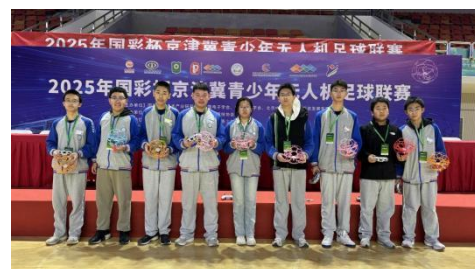
图-22 “国彩杯”裁判合照