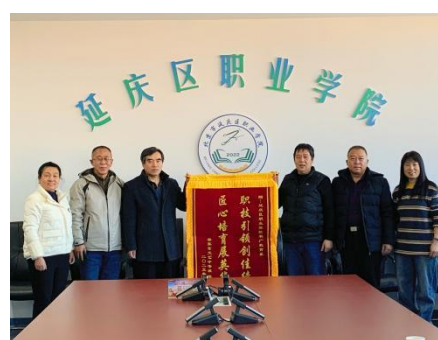
图—59 延庆镇赠送锦旗