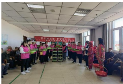
图-33 到敬老院向老人推介芽苗菜种植技术

终身学习”双向赋能为核心，开展了系列志愿服务活动，赋能乡村振兴。自2018年起累计开展各类活动200余场次，受益人群22800人次。累计发展注册志愿者905人，开展服务项目37个，形成45万小时的服务实践网络，成为区域乡村振兴战略实施的关键社会支持力量。