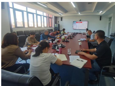
图-12 专家全流程督导教研工作

助现代智能工具梳理文献提升效率。课题成果落地成效显著，议题式教学融入思政课堂后，有效调动学生参与度、强化价值认同，落实立德树人任务，切实破解教学难题，助推课堂提质增效，赋能师生成长成才。