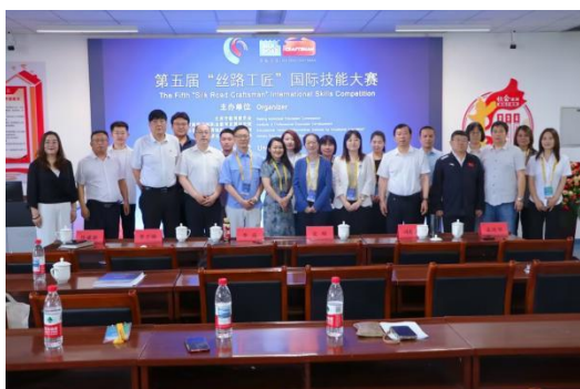
图—47 承办第五届“丝路工匠”国际技能大赛

学校依托职业教育优势，实施“中文+职业技能”国际中文教学实践研究，旨在培养具有“工匠精神”的国际学生，为推动中国与“一带一路”沿线国家的经济合作发挥作用。6月承办第五届“丝路工匠”国际技能大赛教师汉语教学能力赛项，学校两个参赛团队六名教师分别荣获一、三等奖；组织师生参加语合中心主办的“汉字的99种写法”等视频大赛，取得23项个人单项奖和“优秀活动参与单位奖”。学校为国际学生搭建学习、交流、比赛的平台，旨在“讲好中国故事”，传播中国文化。