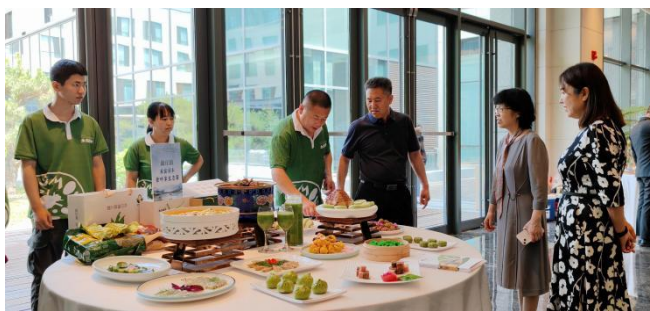
图-27 指导康庄镇打造“食叶草生态宴”

学校构建了“政校行企”四方协同合作机制，有效整合乡镇民俗村、学校、饮食服务行业协会和典型乡村餐饮经营户各自的资源与优势，通过产教融合与校地合作，切实提升餐饮品牌建设实效。采用“需求调研--文化挖掘--菜品研发--技能培训--品牌推广--跟踪指导”的推进模式，系统化开展乡村餐饮品牌建设工作。2025年，学校先后助力打造了康庄镇“食叶草生态宴”、千家店镇下湾村“画廊知青餐”、康庄镇小丰营村“丰收宴”、张山营镇“金玉宴”等特色餐饮品牌，有力推动了延庆“一镇一桌菜”乡村旅游餐饮格局的形成，展现了良好的示范效应和社会影响力。