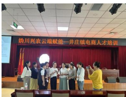
图-28 井庄镇电商人才培训

直播团队受到了中华人民共和国农业农村部、北京市农业农村局、延庆区人民政府、辽宁省农业农村厅等官网、国内三大门户网站新浪搜狐网易以及其他各类媒体报道或者转载。真正实现“培育一人、带动一片、致富一方”的目标，为乡村振兴注入持久数字动力。