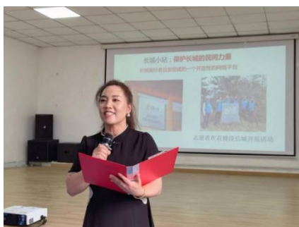
图—37 长城文化主题教育课程

将葫芦画手工艺作品推向市场促进农民增收 19 万元，让长城精神成为推动家乡发展的持久动力，增收致富的“金字招牌”。