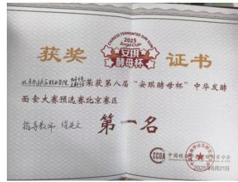
图—18 学生参加“安琪酵母杯技能比赛” 图—19 学生获得“安琪酵母杯技能比赛”一等奖