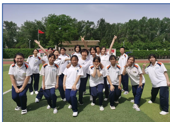
图—57 积极乐观的班集体