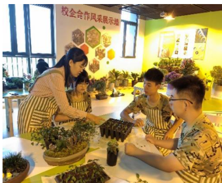
图—2 企业专家进课堂

学校园林技术专业围绕区域绿色发展大事，推进专业建设与区域经济紧密结合。与北京世园公园、北京名木成森古树名木养护工程有限公司等企业深度合作，通过企业文化进校园、企业技术进课堂、认知实习、工学交替、顶岗实习等形式，校企共同培育学生，为学生成才共建平台，为服务区域经济建设贡献力量。