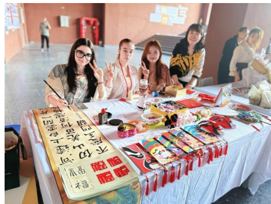
图—44 中国传统文化课业展示