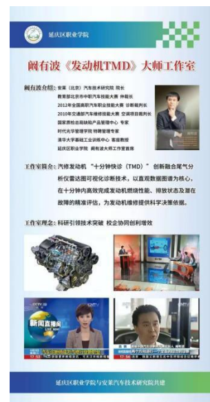
图—25 汽修专业大师工作室宣传图