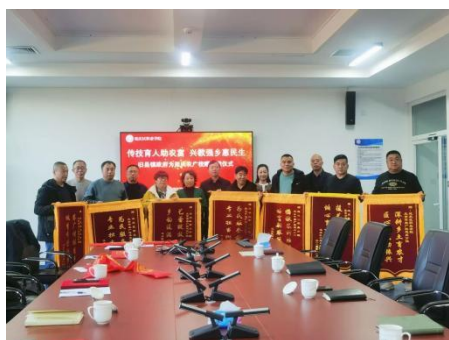
图—58 旧县镇赠送锦旗

学校以“培育工匠的摇篮、服务社会的基地”作为工作目标，按照《北京市职业院校教学管理通则》规范管理教育教学工作作为空天地一体化遥感行业产教融合共同体常务理事单位、全国智慧建造行业产教融合共同体副理事长单位、中国数智园艺行业产教融合共同体理事单位、北京市家长教育工作委员会基地、北京市残疾人培训基地、首都工匠学院、国际教育 AFS 国际文化交流金牌学校、延庆区（餐饮、无人机、汽车修理等）培训取证基地，发挥职业教育资源为区域社会经济发展和人才培养做出了突出贡献。立德树人是学校的根本任务，教育教学为学校中心工作。学校严格遵照《延庆区第一职业学校教学管理规范》，推进教学管理规范化、科学化建设，确保各专业人才培养目标精准落地。同时，学校严格执行《延庆区第一职业学校内部控制工作方案》与《延庆区第一职业学校内部控制制度》，持续强化内部控制建设，推动内控体系系统化、常态化运行，构建“以预算管理为主线、以资金管控为核心”的内部控制体系，为学校高质量发展提供坚实保障。