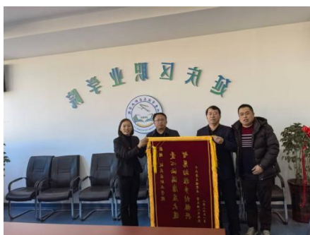
图—60 康庄镇赠送锦旗