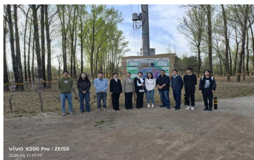
图—52 北信科大到沈家营林场实地调研