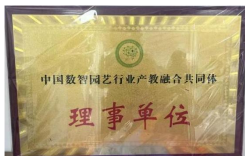
图—53 成为“中国数智园艺行业产教融合共同体”理事单位

学校在市域产教联合体建设中成为“中国数智园艺行业产教融合共同体”理事单位。该共同体由学校与北京市西郊农场有限公司、北京农学院共同牵头，集合了全国27个省、自治区、直辖市151家知名企业、院校及科研院所，是共商数智园艺未来发展的重要平台。共同体在未来建设中将深化与