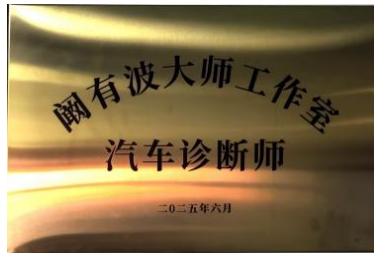
图—24 校企共建汽修专业大师工作室