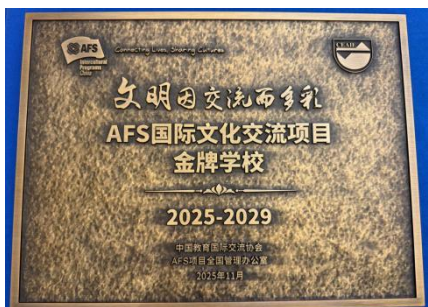
图—45 AFS 国际文化交流项目金牌学校