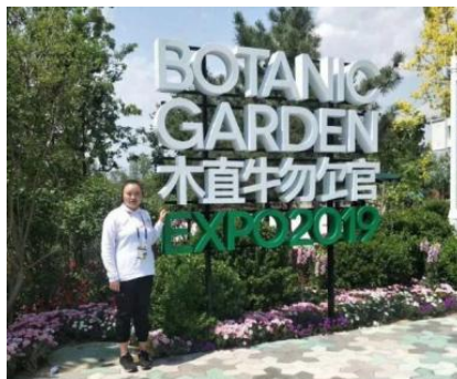
图—3 园林专业学生到世园公司实习