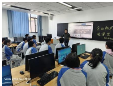
图—39 北京亿世合文化传媒有限公司韩总为学生亲自授课

为深化产教融合、推进“企业文化进校园、企业技术进课堂”工作，知名企业北京亿世合文化传媒有限公司多名高管和业务骨干走进数字媒体技术专业，他们宣讲企业文化，介绍企业优秀职工的劳模精神；他们结合行业真实项目案例，深入浅出地讲解数字媒体制作的核心技术与实操技巧，将抽象的专业知识转化为生动易懂的实操演示。学生们近距离观摩学习、积极提问互动，课堂氛围格外热烈。