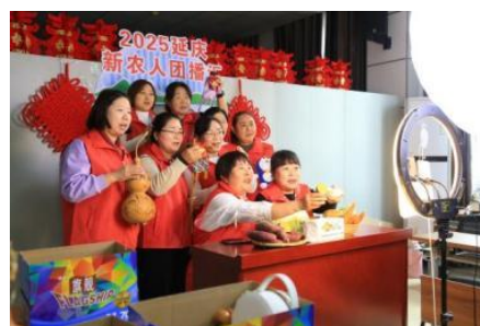
图-29 井庄镇电商人才培训教学成果展示