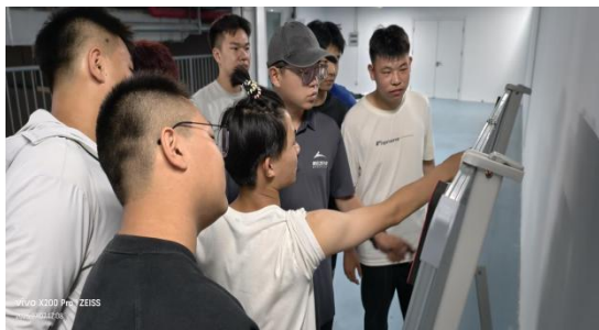
图—54 企业入校无人机专业理论培训现场

2025 年，学校与北京灵云智飞智能科技有限公司正式签约合作，双方以无人机专业为核心抓手，精准对接行业人才需求，扎实推进校企双元育人的人才培养模式。学校为企业提供实训区域，搭建起“校中厂”无人机专业产教融合基地，让企业的技术设备与教学场景深度融合。企业发挥技术与产业优势，组建专业教学团队，每周为学生系统讲授无人机组装与维修核心课程，将行业前沿技术标准、岗位实操规范与课堂教学内容紧密结合，形成了稳步的教学节奏，夯实了学生的理论基础与实践操作能力。企业为高三学生量身定制 CAAC 证书专项培训与考核方案，全程负责课程教学、实操指导与认证考试等环节，12 名参训高三学生全部顺利通过认证，彰显了产教融合模式在高素质技术技能人才培养上的实效。