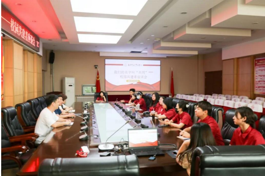
【图 6-1-2】学生代表参与座谈会

改善等 12 项议题建言献策。校领导对学生提出的“延长专业排练时长”“改善教室音响效果”等合理建议现场回应，其中教室音响升级问题 24 小时内完成解决方案制定，一周内落地见效。此次座谈会搭建了师生民主沟通的坚实桥梁，彰显了党建引领下“以生为本”的治理理念，为学校高质量发展凝聚了广泛共识与强大合力。