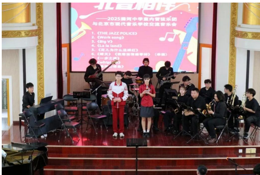
【图 1-6】职普两校主持人主持交流音乐会

这场交流音乐会，不仅是一次音乐技艺的展示，更是两校学生心灵的交流与碰撞。通过音乐，他们跨越了学校的界限，共同创造了一段美好的回忆。在未来，两校在艺术教育领域将继续加强交流与合作，培养出更多优秀的艺术人才，让艺术的梦想在更多学生心中生根发芽，绽放出绚丽的光彩。