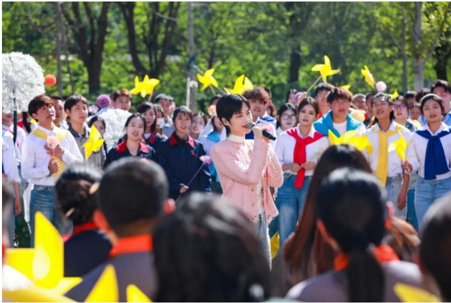
【图 2-1】五一国际劳动节特别节目现场录制

学校不仅精心打磨校内艺术实践平台，同时积极整合社会资源，为学生创造丰富多元的校外实践机会。通过参与大型文艺演出、艺术赛事、公益文化服务等活动，学生得以在真实的艺术场景中淬炼技艺、积累经验。校内外实践活动相互补充、协同发展，共同构建起立体化、全方位的艺术实践教育生态，为培养德艺双馨的艺术人才奠定坚实基础。