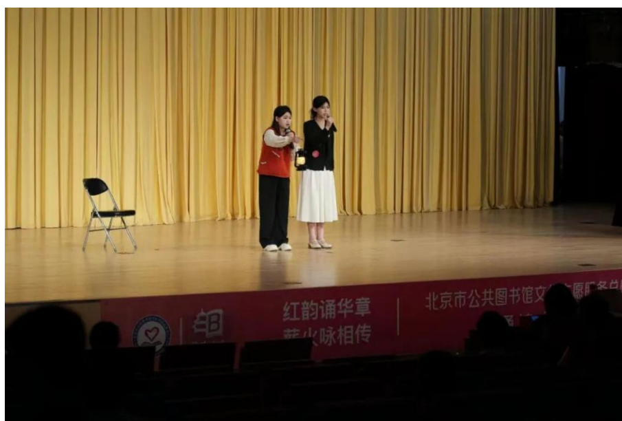
【图 3-3】 我校学生在 2025 年北京市诵读大赛朗诵《灯祭》

学生参加“红韵诵华章 薪火咏相传”2025 年北京市诵读大赛，是学校红色文化传承成效的直观彰显，为质量年报相关板块提供了鲜活实践支撑。活动以实践育人为核心，让学子在红色经典诵读中沉浸式感悟革命精神与家国情怀，实现红色基因的内化传承，践行立德树人根本任务。同时打破课堂局限，将红色文化与语言艺术实践深度融合，创新了红色教育载体，丰富了学校红色育人体系内涵。学子在市级赛事中的表现，既展现了学校红色文化教育的扎实实效，也扩大了红色育人品牌的影响力，全面印证了学校红色文化传承工作的实践价值。