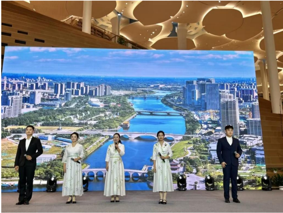
【图 3-1】 我校学生参加大运河文化阅读行展演

我校学子以朗诵的形式演绎运河古今风貌，既锤炼了专业技能，也直观彰显了学校“产学研创”教学成果。同时，这种年轻化表达为千年运河文化注入青春活力，创新了传统文化传承方式。作为扎根通州的高校，此次参与也是服务地方文化建设的举措，助力大运河文旅融合与文化带建设，为北京城市副中心文化软实力提升贡献了职业学校的力量。