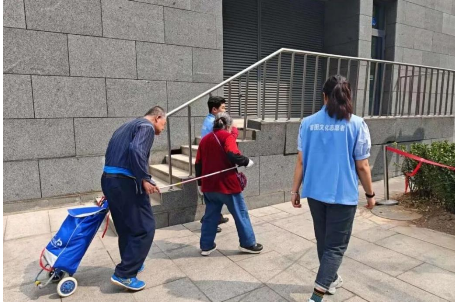
【图 2-3】 首图志愿者服务——为老人和盲人指引

学校组织学生参与龙鼎园社区“践行首都义务植树职责，助力花园城市建设”活动，学生们挥锹铲土、扶苗浇水，与社区志愿者亲切交流，为城市增添绿色；4月11日，10余名学生志愿者走进首都图书馆，协助盲人及行动不便老人观看无障碍口述电影《长津湖之水门桥》，通过搀扶引导、轻声解说、无声问答等方式，让特殊群体感受光影魅力。全年累计开展社区志愿服务12次，参与学生200余人次，彰显了学校服务地方社区的责任担当。