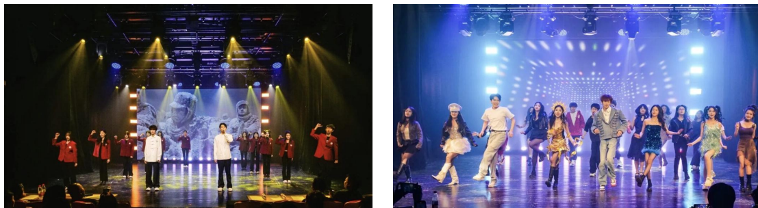
【图 1-2-2】“乘着歌声的翅膀”歌舞晚会现场

这场汇聚声乐、舞蹈、表演、音乐剧专业学生的综合歌舞晚会，为双方专业群建设提供了优质实战载体。一方面检验专业群实战教学与分层训练效果，助力教师反向优化跨专业实训重点；另一方面以多专业融合演出打破学科壁垒，推动一体化课程开发，依托校际合作实现资源互通共享，还能根据学生舞台表现细化专业群个性化培养方案，深挖学生艺术潜力，让专业群教学更具实践力、协同力与专业性。