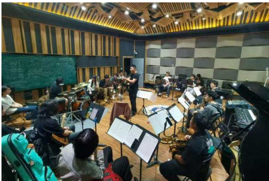
【图 1-3-2】爵士乐工作坊课堂