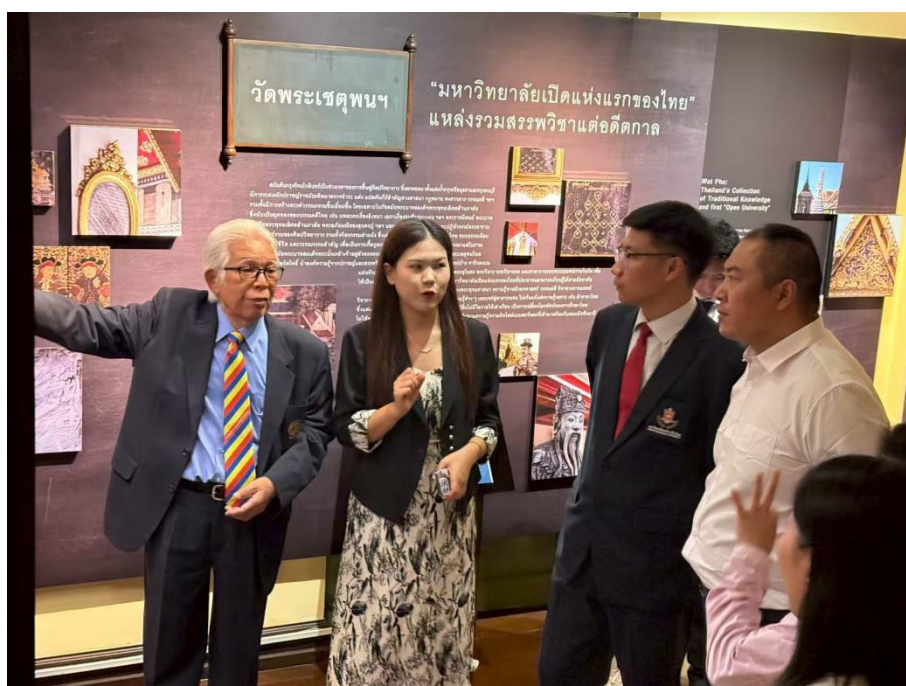
【图 4】 参观泰国国家教育展览馆

通过“安全筑基、教学赋能、语言搭桥”，培养兼具文化自信、国际视野与实践能力的复合型人才，为泰中民心相通与“一带一路”共建注入持久教育动力。