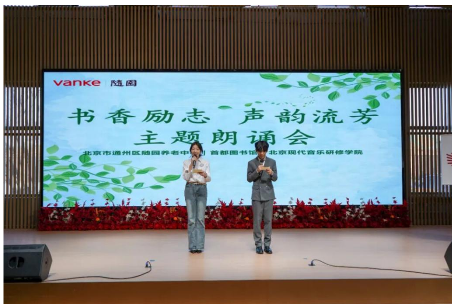
【图 1-1-1】“书香励志·声韵流芳”主题诵读会