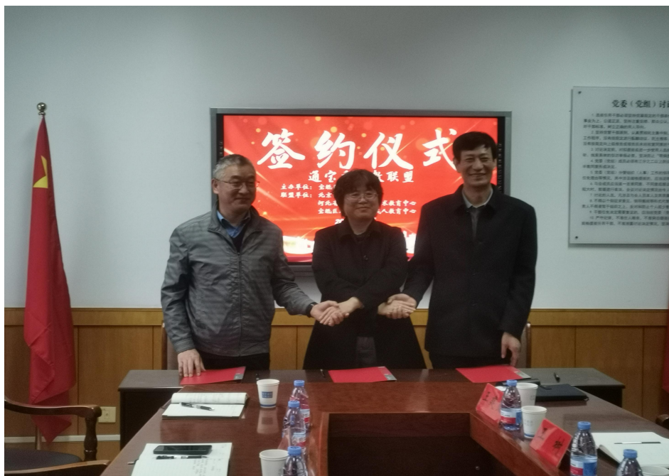
图 5-2-2 “通宝香”职教联盟签约现场

联盟将成为京津冀地区职业教育高质量发展的重要引擎，翻开京津冀职业教育发展的崭新篇章。三所学校将按照产业、行业、企业、职业与专业的“五业联动”大思路，共同搭建职业教育平台，打造职业教育综合体，探索三地在产教融合、校企合作、师资培训、课程建设、职教资源、联合招生、合作办学等方面的合作交流机制，推进通宝香三地职业教育与产业发展深度融合、校企深度合作、职业教育联动发展。