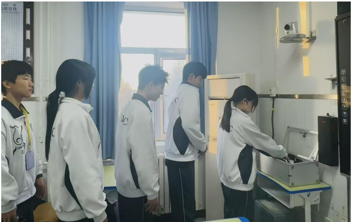
图 6-3-2 【行为养成】学生自觉有序存放手机