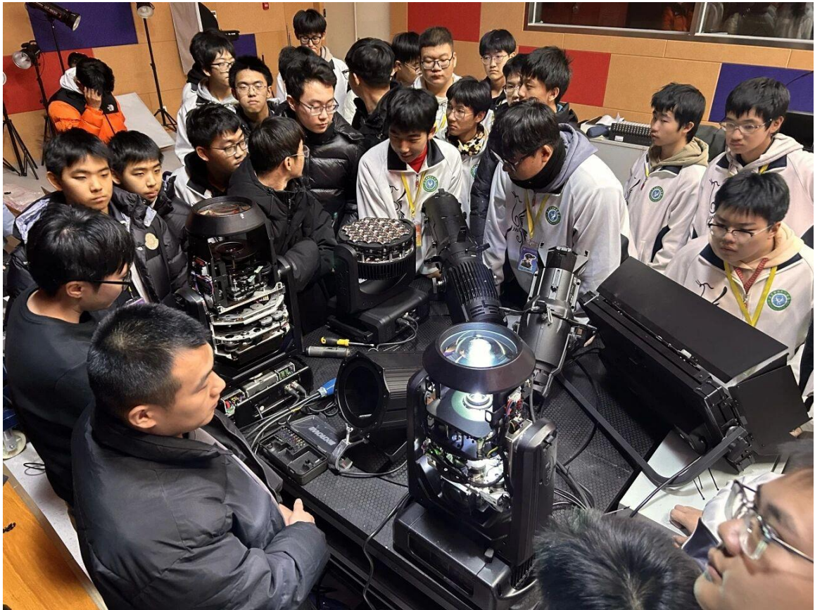
图 3-2-1 国家大剧院与浩洋电子专家为舞美专业学生授课