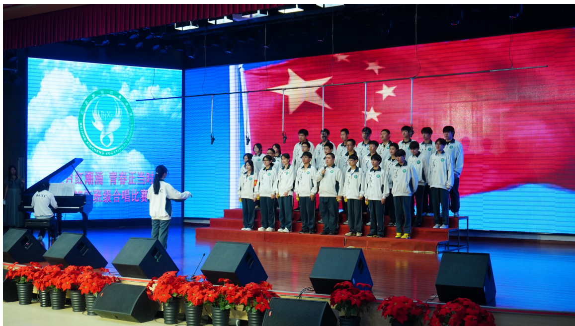
图 3-3-1 “红五月”合唱比赛

开设“红色故事宣讲社”，邀请退役军人开展国防教育讲座。建立“活动参与+精神践行+技能输出”三维评价体系，将红色素养纳入综合素质考核。学生在愉悦的氛围中获得知识、增长才华、锻炼自身，更好地促进学校“红色”德育目标的实现。