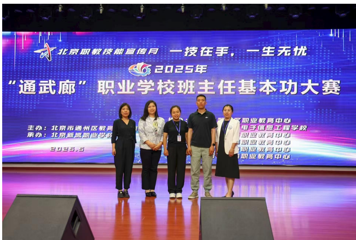
图 6-5-1 【以赛赋能】“通武廊”班主任基本功大赛现场

通过“三环”体系的持续赋能，学校班主任队伍的专业素养与实战能力得到系统性锤炼，一支“能打硬仗、善育新人”的班主任劲旅正成为推动学校德育工作高质量发展的坚实支柱。