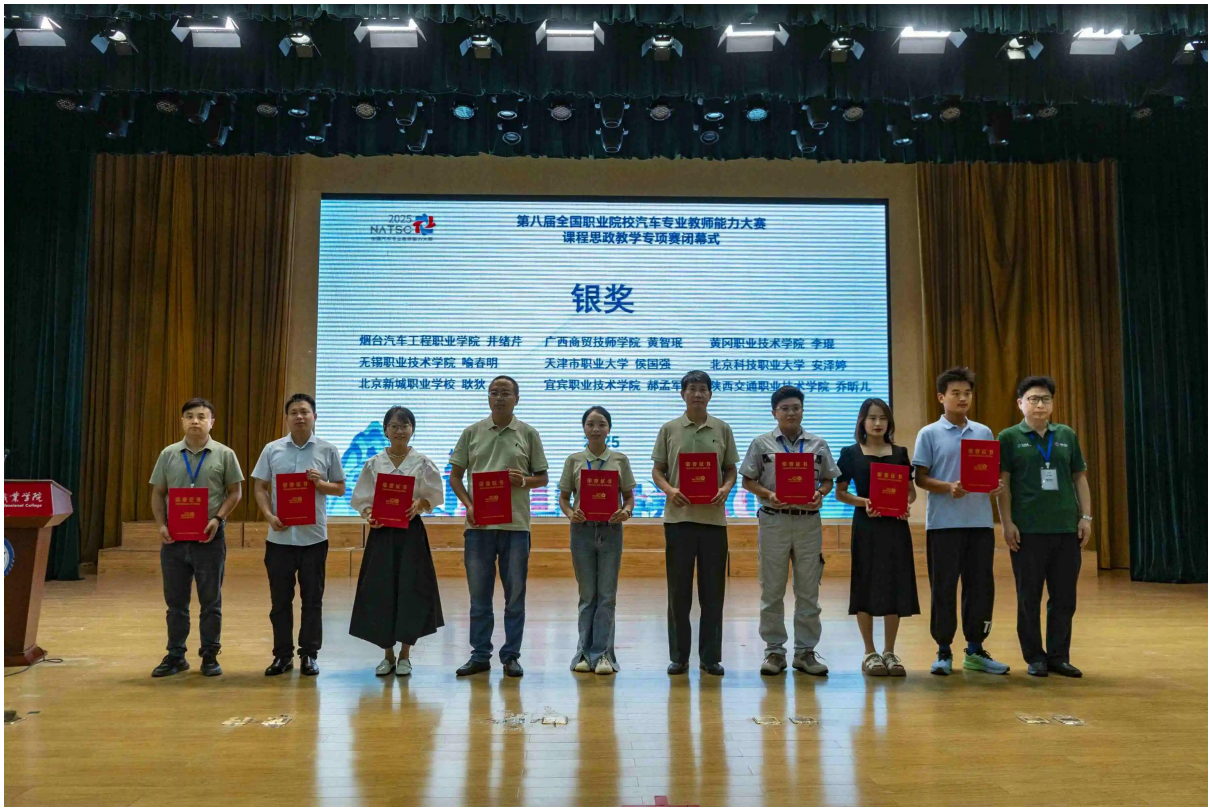
图 6-5-2 第八届全国职业院校汽车专业教师教学能力大赛课程思政专项赛银奖