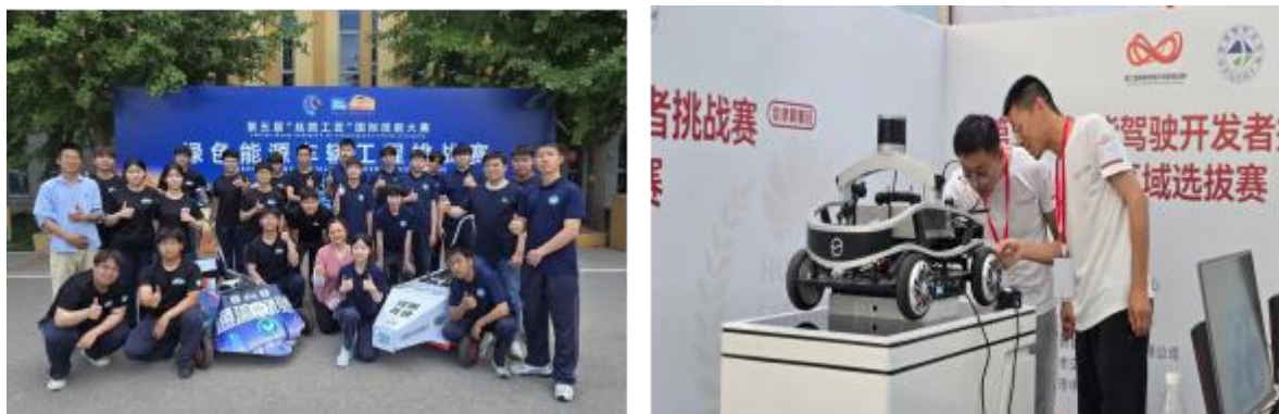
图 1-9-1 汽修团队参加第五届“丝路工匠”国际技能大赛

北京新城职业学校汽修专业教师自入职以来，便满足双师型要求。近几年，教师技术水平更是稳步提升，目前四位专业课教师中，1 位是高级技师，2 位为技师，1 位是高级工。每学期，学校都会积极组织专业课教师开展企业实践。目前汽修专业老师们完成了 3 期共 336 学时的实践。同时，每学期组织教师参加各类培训，次数不少于 2 次，全力打造终身学习型教师队伍。