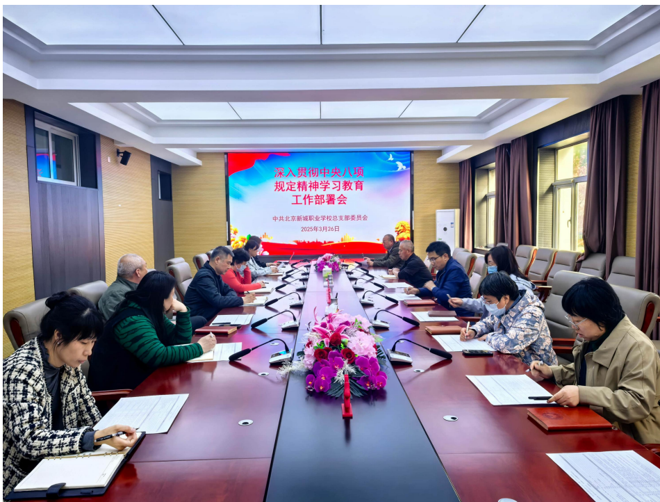
图 6-1-2 深入贯彻中央八项规定精神学习教育工作部署会