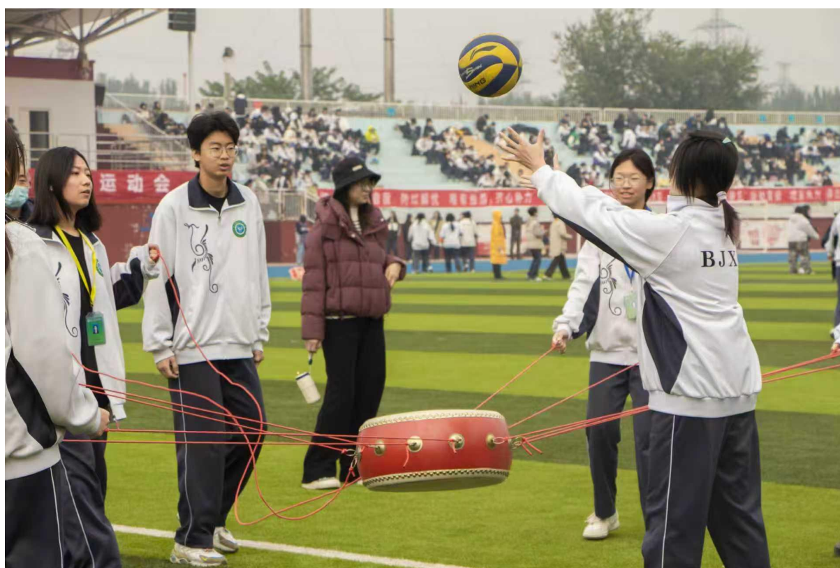
图 6-2-3 【团队协作】趣味运动会-同心鼓项目学生默契配合