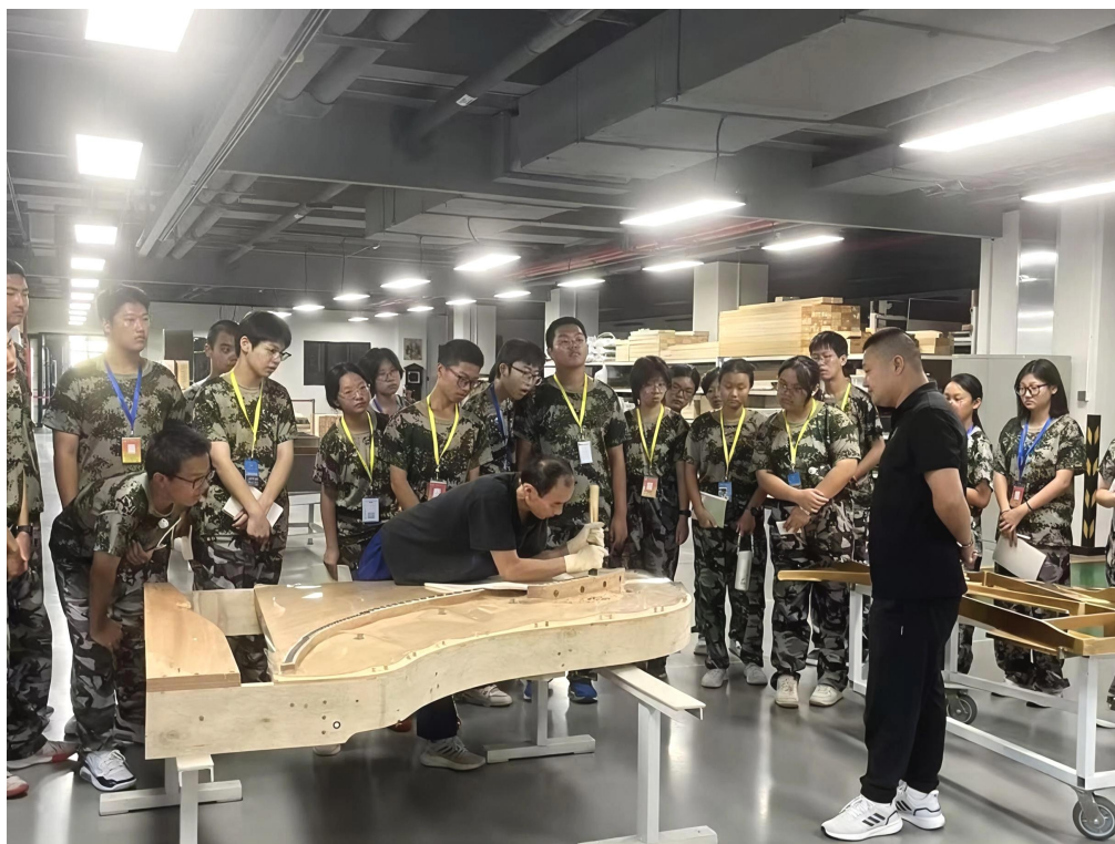
图 1-2-1 学生走进星海钢琴集团实践学习

通过将课堂延伸至工厂、把产业标准融入教学，该专业正打造从“校园琴房”到“行业岗位”的直通车道，为北京音乐文化市场培育急需的“钢琴健康守护者”。