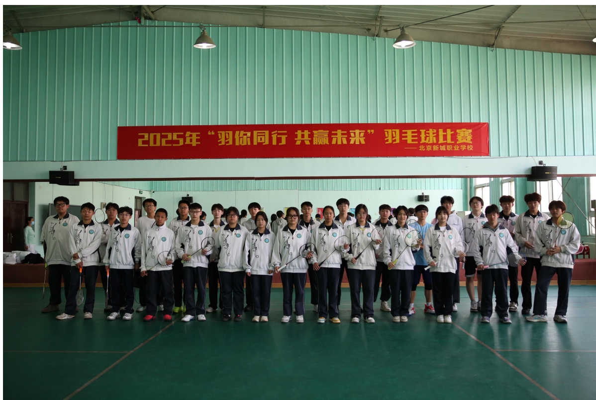
图 6-2-2 【全员风采】羽毛球联赛参赛队员精神饱满合影