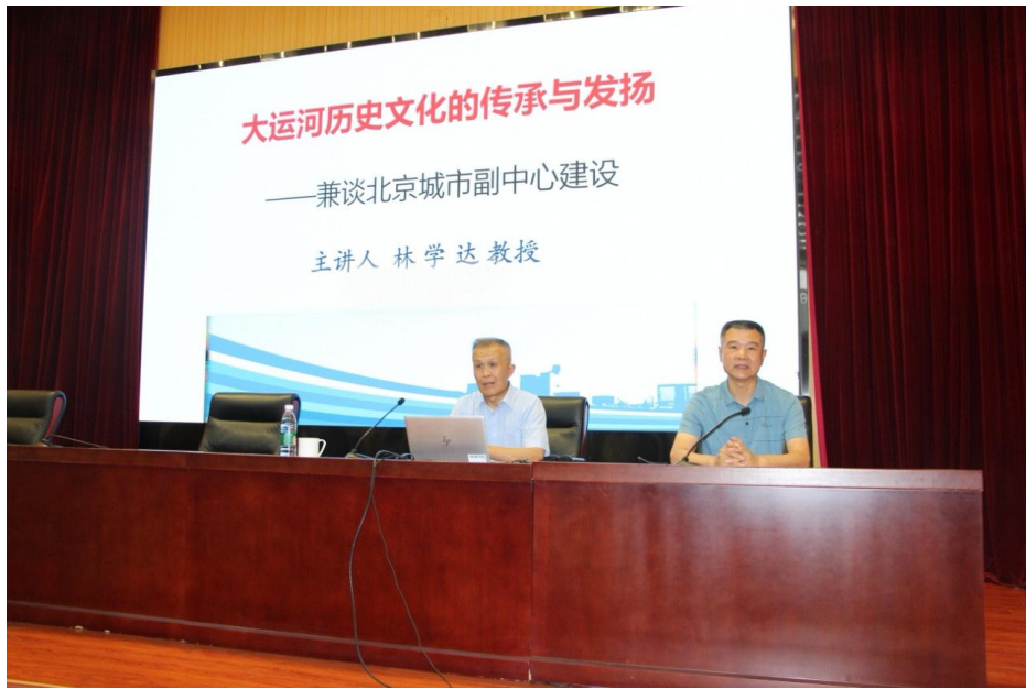
图 6-1-1 开展党课学习