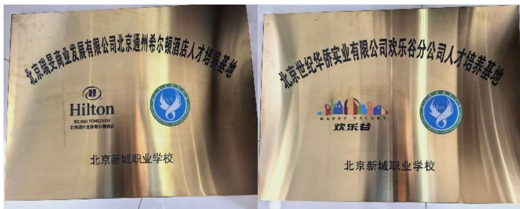
图 5-4-1 学校被授予“希尔顿酒店”人才培养基地、“北京欢乐谷”人才培养基地