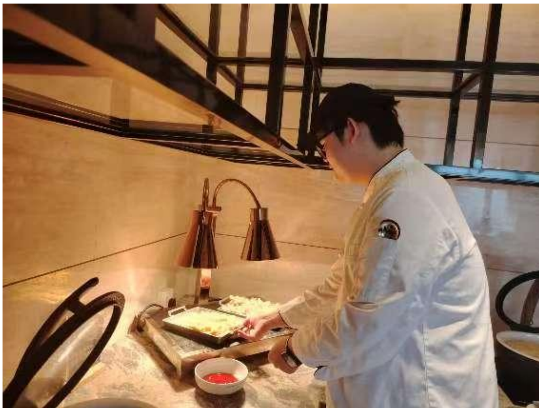
图 5-1-1 学生在希尔顿酒店实习

除了烹旅专业，学校其他各专业实习实践均在合作企业顺利推进。学生们通过在真实职业环境中的锤炼，有效提升了专业技能与综合职业素养，实现了从学习到应用、从生手到准职业人的重要跨越。