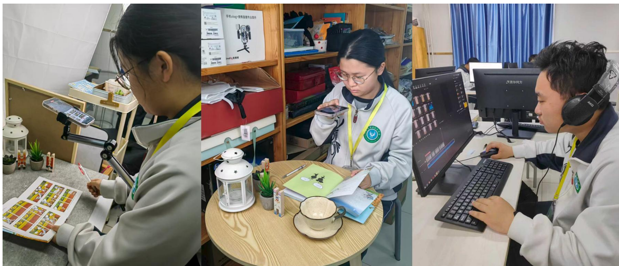
图 1-7-1 跨专业学生团队实战运营“剪阅荐书社”抖音账号

这一实践项目将专业课程所学直接应用于真实市场环境，使学生不仅掌握了新媒体运营与电商直播的具体技能，更在选品分析、用户沟通、数据反馈和团队协作中提升了综合职业素养。项目成果体现了学校通过“工作室+真实项目”模式，有效推动跨专业融合与创新创业能力培养的落地成效。