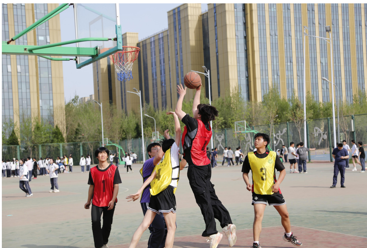
图 6-2-1 【竞技风采】校园篮球争霸赛一球员精彩对抗瞬间

城职业学校以教育部体育育人新政为指引，积极探索，创新构建了“全员参与+特长培养”双轨并进的体育育人新模式。学校系统设计“趣味运动会”、“羽毛球联赛”、“篮球争霸赛”三级赛事体系，其中趣味运动会设置拔河、同心鼓等集体项目，实现学生100%全员参与，重在激发兴趣、凝聚团队；羽毛球与篮球联赛则采用分级淘汰制，聚焦竞技特长培养，实现“培优”与“竞技”目标。为固化育人成效，学校将赛事参与及表现纳入学生综合素质评价，形成制度牵引；同时通过公众号、宣传栏等载体开展全景宣传，积极塑造“爱运动、强体魄、育品德”的校园体育文化。经过一学年实践，该模式成效显著：学生运动兴趣与体质普遍增强，在活动中强化了协作、规则、拼搏等素养；构建“全员参与+特长培养”体育育人模式，为中职校落实体育新政提供了可复制、可推广的实践范本，实现体育与德育、智育协同赋能。