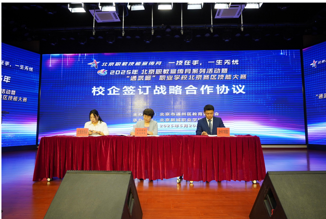
图 2-1-1 与北投希尔顿酒店签署合作协议