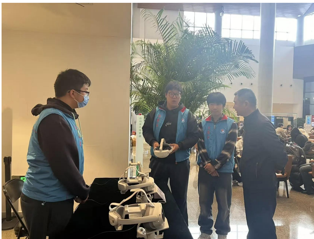
图 2-2-1 学生在台湖舞美艺术中心参加志愿服务

通过系列化、专业化的志愿服务，学校不仅将社会服务打造为实践育人的重要平台，更使“剧光灯”成为一张展示职业学校学生专业能力与社会担当的生动名片，真正实现了“在服务中学习，在奉献中成长”。