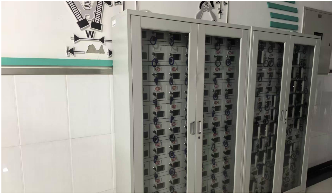
图 6-3-1 【设施保障】实训楼内整齐划一的手机存储柜