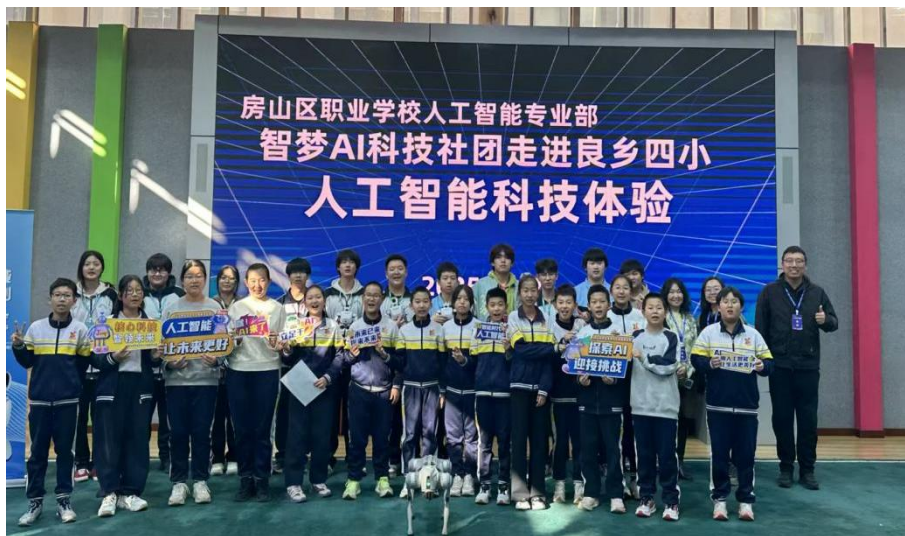
【图 1-6-1】房山区职业学校学生社团走进中小学校园科技节开展科技体验活动

学校积极探索职业教育与普通教育相互融通。面向区域内中小学，利用学校专业资源和实训基地，开放提供劳动教育、职业体验、技术技能实践等综合实践活动课程服务，助力中小学生学习综合素质提升。连续多年组织师生团队为房山区中小学生科技节、体育统测、中考体育等大型活动提供专业服务与保障，展示了职业教育的实践价值和社会担当。2025年深入中小学校参与校园科技节，开展人工智能体验项目服务学生1500余人次。代表房山区参加第43届北京学生科技节闭幕式暨科技教育成果展示活动，与会领导和嘉宾对学生扎实的技术应用能力给予高度肯定和称赞。