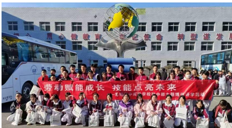
【图 1-1-3】“社区大课堂”师生留影

(4) 每学期开设社会大课堂实践活动，鼓励学生参与创新、创意、发明等创造性实践，营造具有中职特色的教育文化氛围，着力培养学生劳动中的科学态度、规范意识、效率观念与创新精神。2025 年 3 月 28 日，首师附中实验学校 140 名初二学生走进我校参与社会大课堂活动。此次活动不仅深化了两校间的交流联系，更让更多同学直观感受到职业教育的独特魅力。