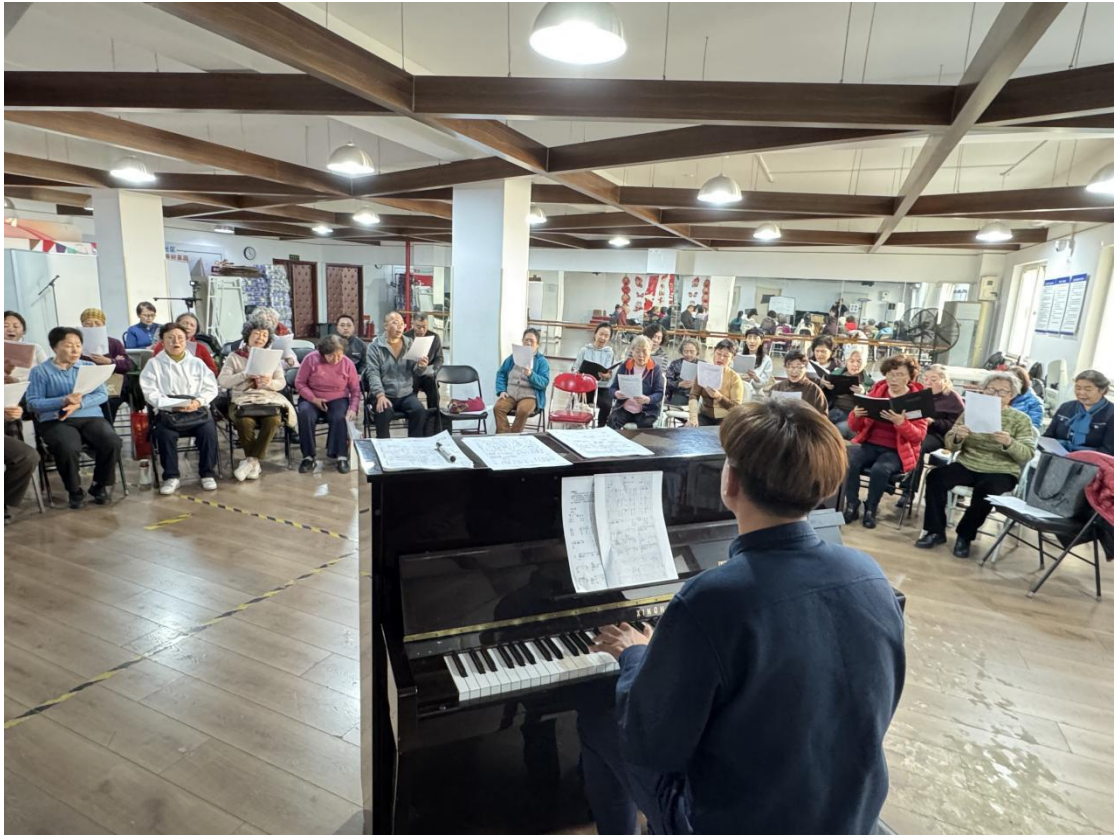
图2-2-1 专业教师进社区辅导合唱团排演