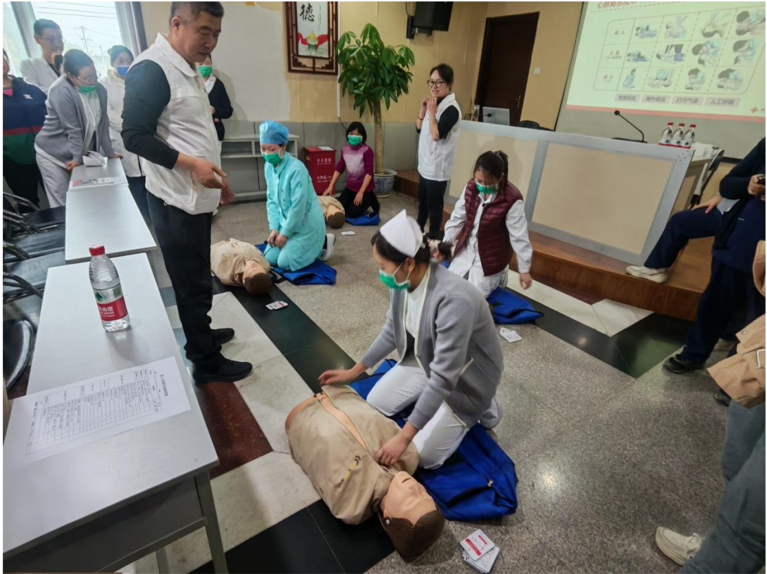
图2-1-1 红十字应急救护培训