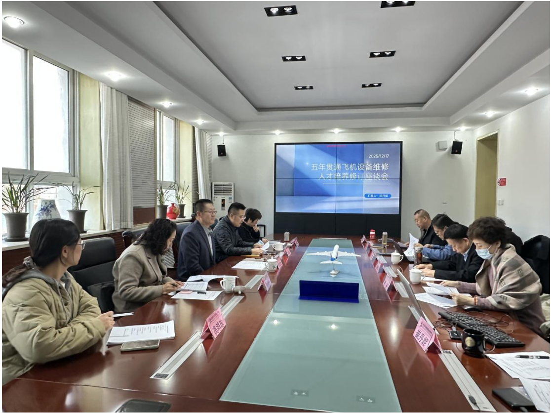
图1-2-5 飞机设备维修五年制人才培养方案研讨会