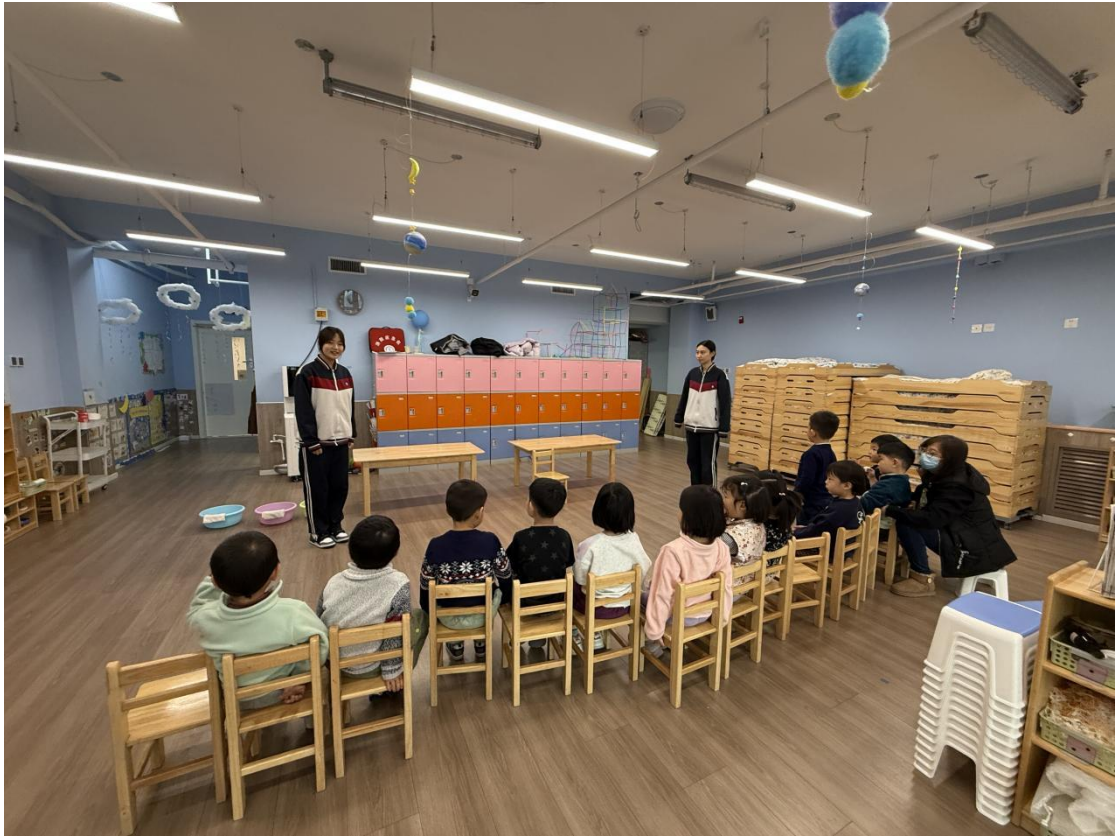
图3-2-1世赛选手在幼儿园真实工作岗位备赛