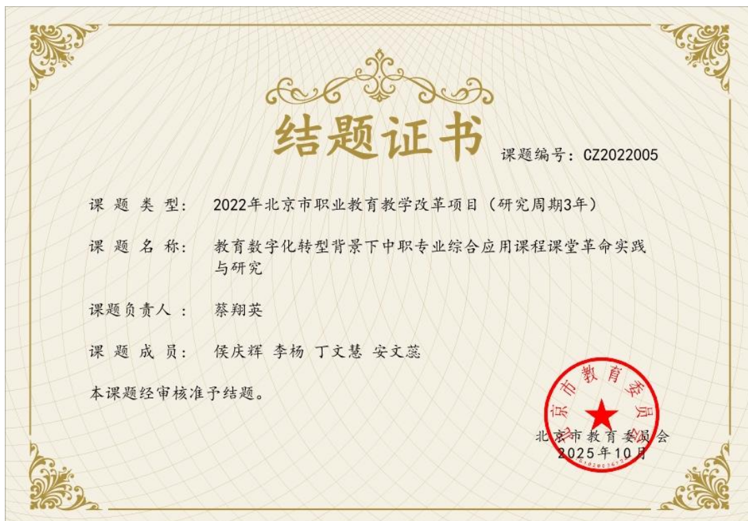
图1-3-1综合应用课程课堂革命实践与研究的教学改革项目结题证书