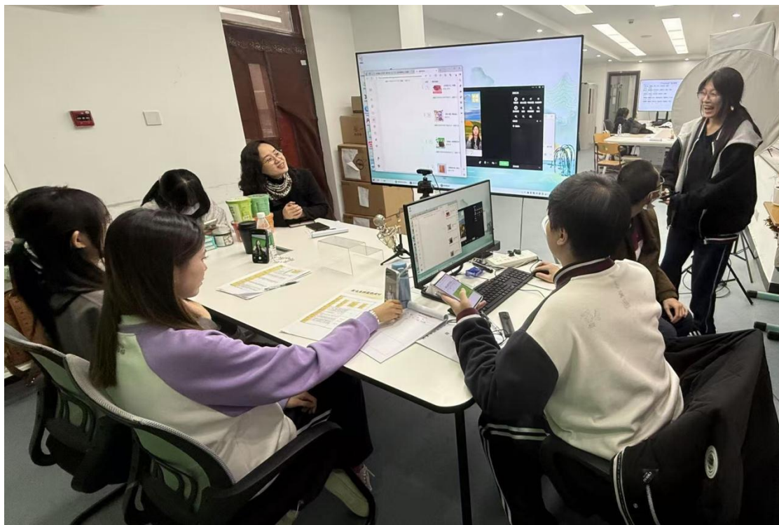
图5-1-1 直播电商专业学生在工学交替中学习实践

行外呼岗位历练成长，电商专业学生在视频制作与咖啡文化传播中展现创新思维。亿人从众文化、鑫源创客财务等企业导师现场点评，肯定学生专业能力与职业品格，并就智能财税系统应用、职业素养提升等提出针对性建议。工学交替作为“产教融合、知行合一”育人模式的核心环节，通过校企双导师协同指导，实现岗位技能锤炼与职业素养启蒙有机统一，为学生职业征程奠定坚实基础。