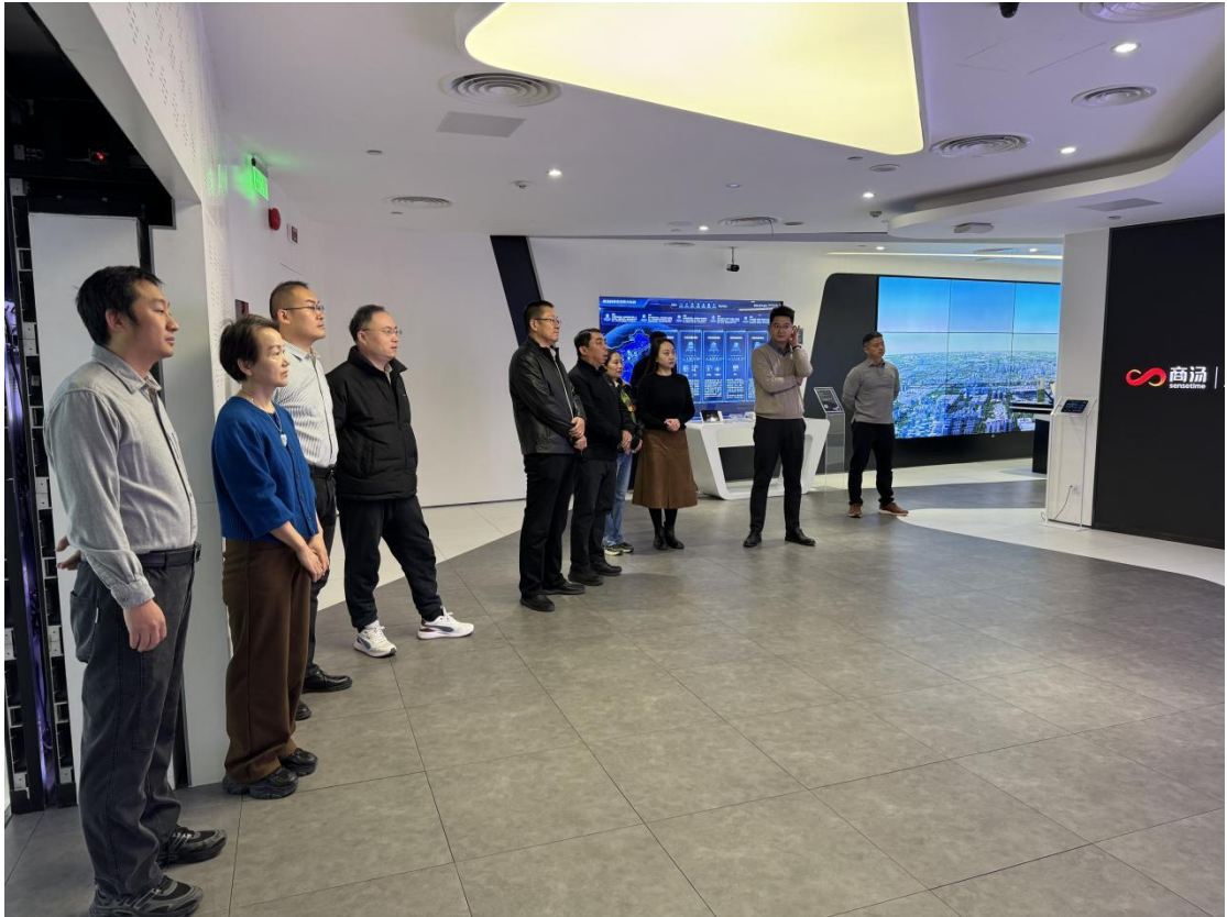
图1-7-1 专业团队到科技企业共研人才培养方案