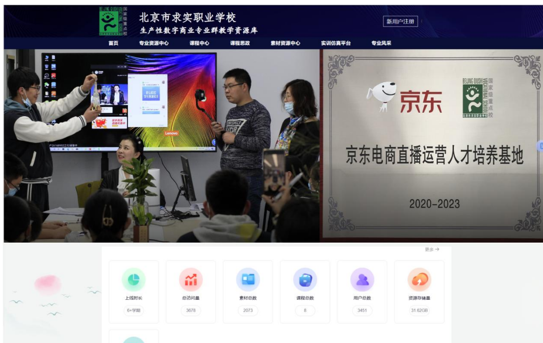
图1-3-3 校企共建数字商业教学资源库