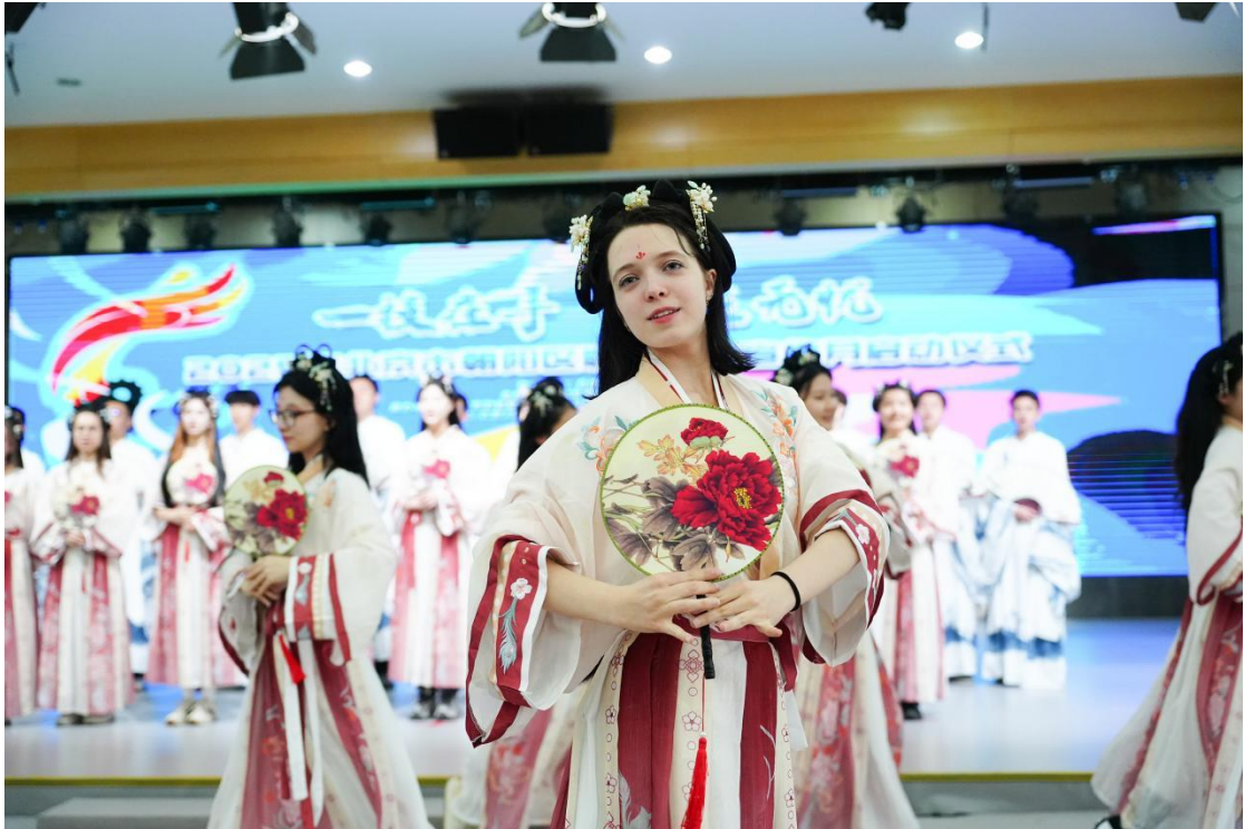
图4-1-1 留学生在2025年朝阳区职教论坛上表演《上春山》