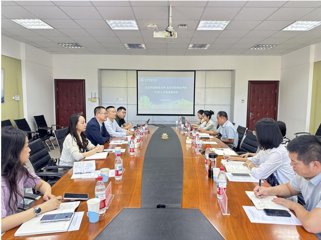
图1-2-2 北京市求实职业学校与北京科技职业大学座谈专业五年制培养模式