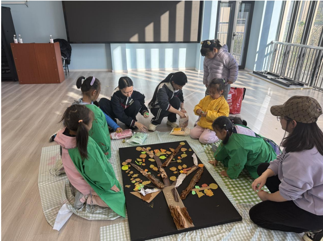
图1-3-2 “趣秋收” 幼儿自主游戏活动