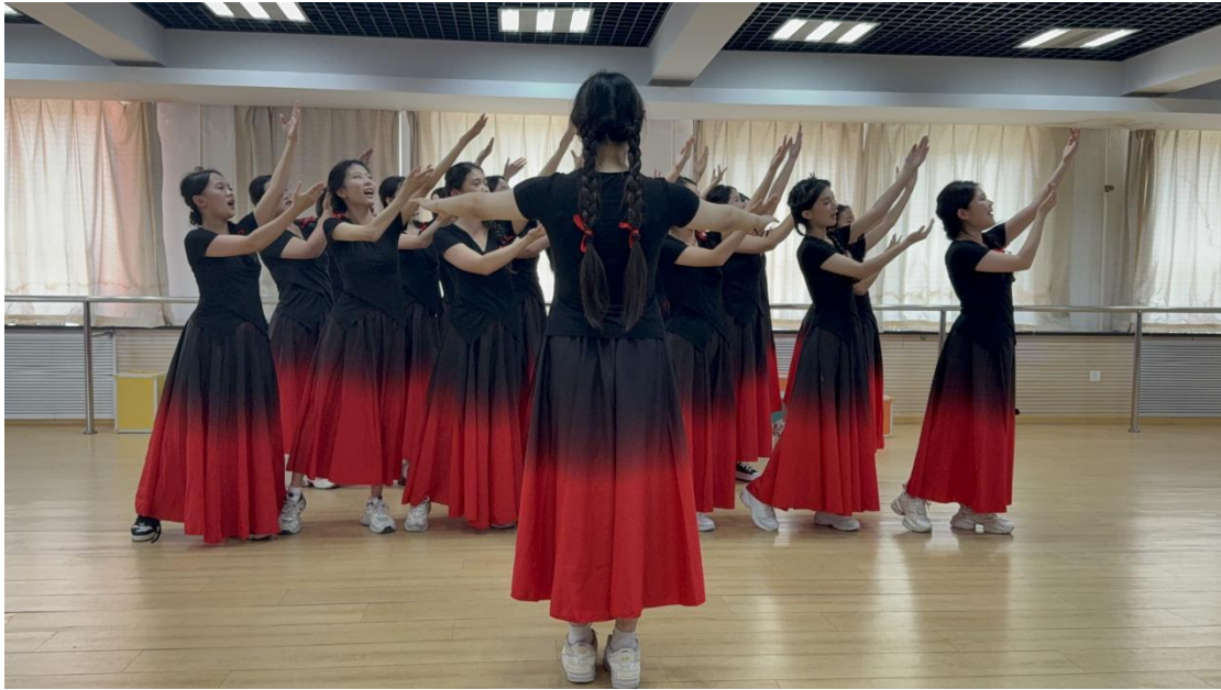
图3-3-1 “强国有我 声颂中华”红五月歌咏比赛