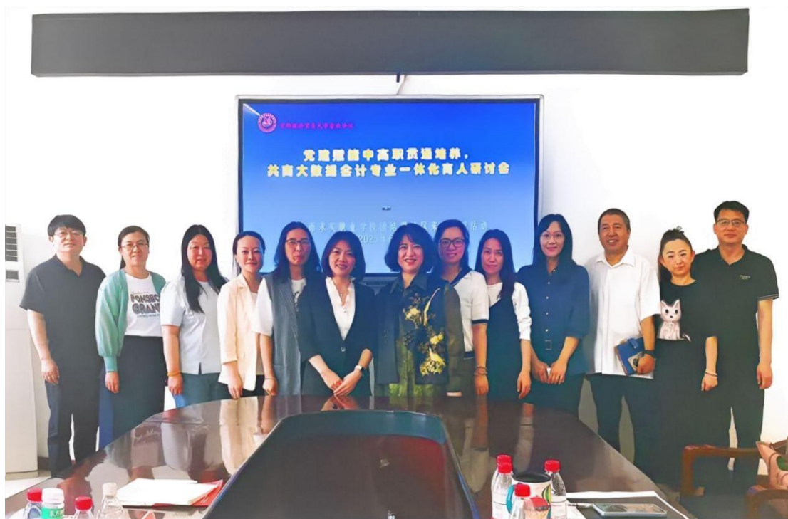
图1-5-1大数据与会计专业中高本贯通培养开展专题研讨会