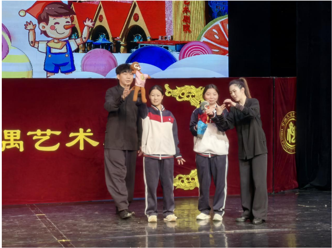
图1-1-2 学生走进中国木偶剧院开展研学活动