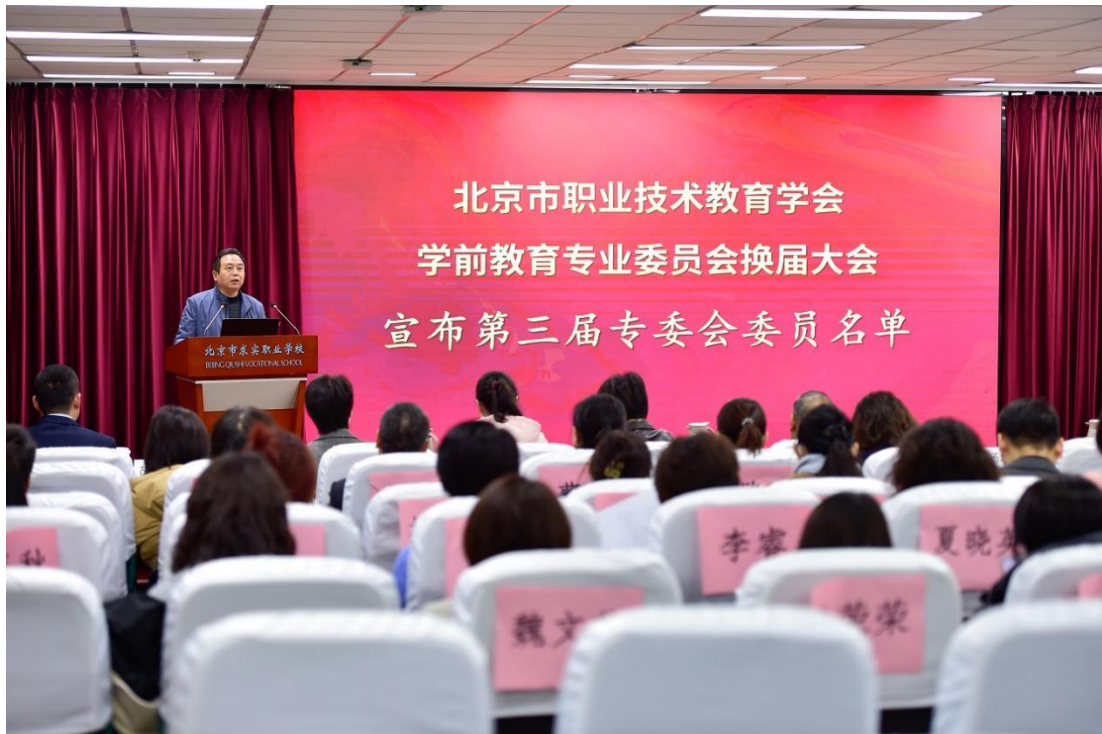
图1-2-4 北京市职业技术教育学会学前教育专业委员会换届大会