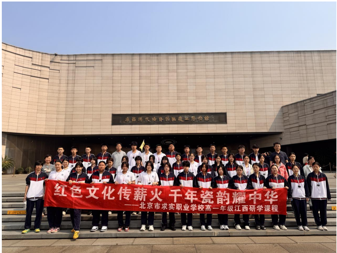
图1-6-2 综合高中班赴江西省研学