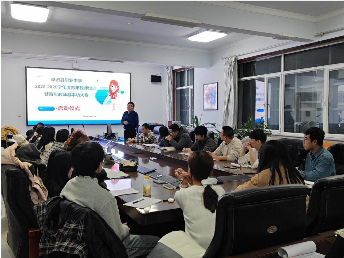
图2-3-1援蒙教师在内蒙古卓资县职业中学指导教科研工作