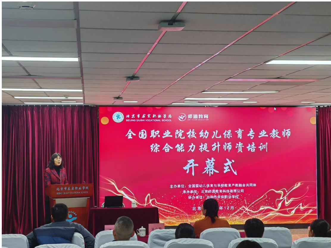
图5-3-1 第三期全国职业院校幼儿保育专业教师综合能力提升师资培训开幕