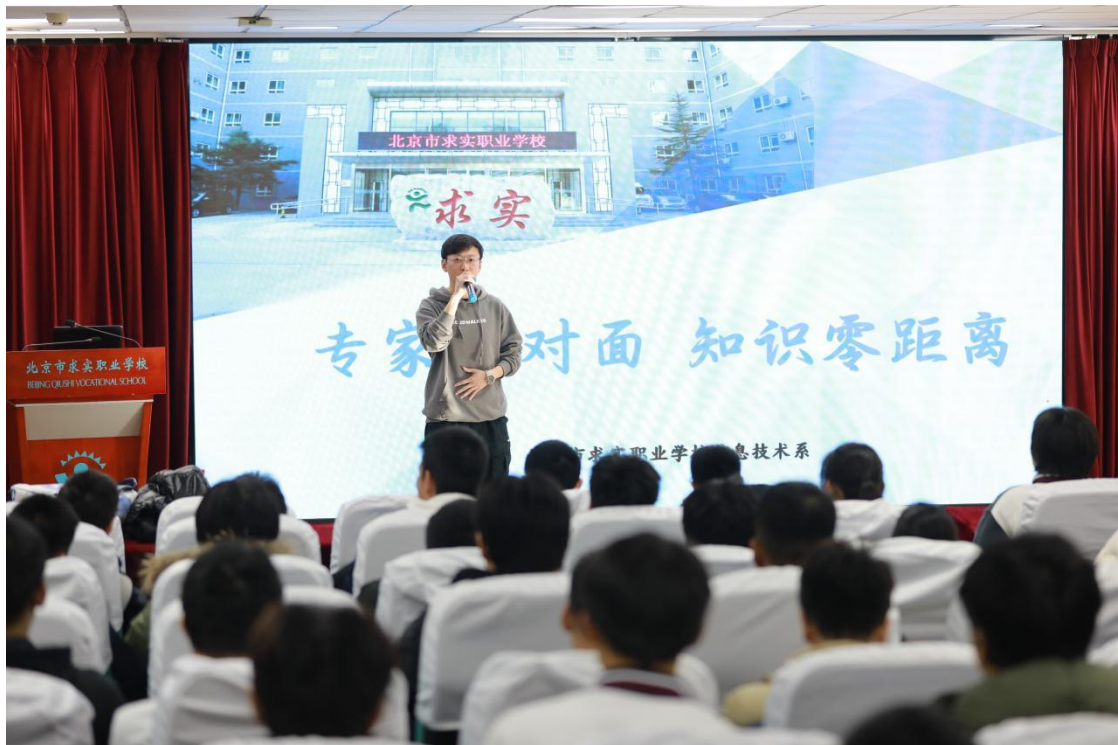
图5-2-1 “小谈网络安全之人才篇”专题讲座