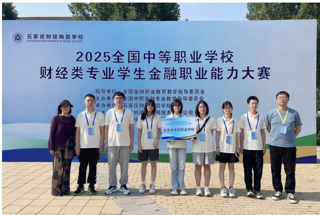
图1-9-2 数字财经系师生参加2025年全国金融职业能力大赛获团体三等奖