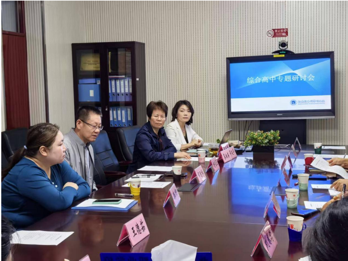
图1-6-1综合高中课程建设专题研讨会