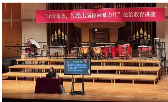
图 2-31 防治校园暴力法制讲座