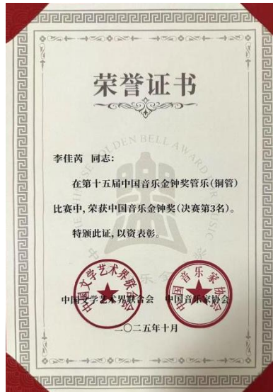
图 1-1 附中学生中国音乐金钟奖获奖证书

附中学生在此成人类比赛中取得优异成绩，源于系统化、科学化的教学体系长期积淀的成果。从教学机制到师生互动，从演出实践到后勤管理，学院构建了一套完整的管乐人才培养生态。