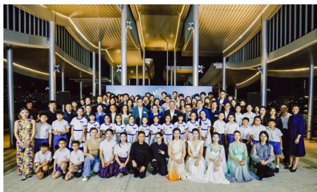
图 2-11 深水埗区音乐会