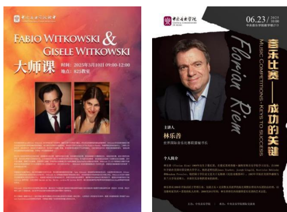
图 2-13 开设大师课、讲座

邀请国际知名专家（法比奥·维特科夫斯基夫妇、拉斐尔·皮杜、弗洛里安·利埃姆、校友朗朗访校等）开设大师课、讲座，提升专业教学视野。与美国巴德音乐学院、美国皮博迪音乐学院、英国切特姆音乐学校、澳门演艺学院音乐学校等国际知名音乐院校建立友好联系。接待天津传媒学院、杭州智力运动中专等院校来访，共商学科建设与协同发展。