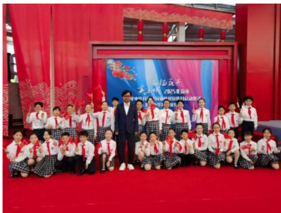
图 2-6 附小合唱团赴园博园参加北京中华民族周开幕式演出