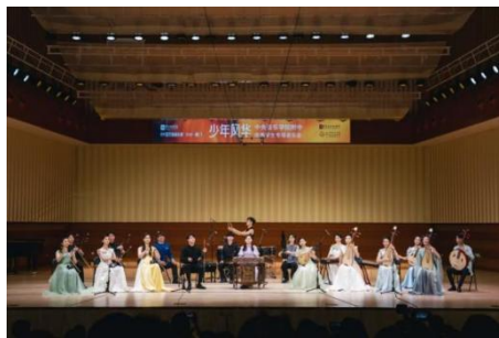
图 2-1 中国民族音乐周音乐会

打造高端艺术实践品牌，成功举办第七届“5.23 音乐节”附中专场音乐会（“我们从附中走来”、“我们走向世界——全球数字发行甄选音乐会”），彰显附中历史传承与创新活力。加强中华优秀传统文化传承建设，师生赴厦门参加中国民族音乐周、澳门参加“青春的旋律”“明日之星庆回归音乐会”、“首都留学人员纪念中国人民抗日战争暨世界反法西斯战争胜利 80 周年‘星海之光’音乐会”、“丰台区中小学生纪念中国人民抗日战争暨世界反法西斯战争胜利 80 周年主题展演·管乐交响音画《卢沟桥》首发式”，拓宽艺术视野。