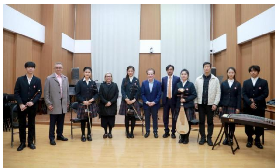
图 2-18 皮博迪音乐学院到访附中