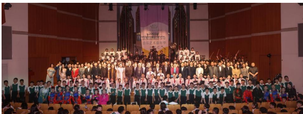
图 2-8 “京蒙港澳台青少年音乐艺术嘉年华”开幕式音乐会