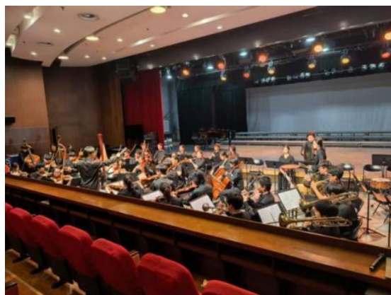
图 2-7 附中学生参与节目审查