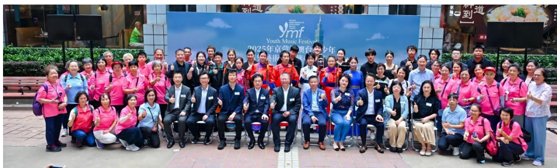
图 2-10 观塘花园大厦玉莲台广场举行社区音乐会