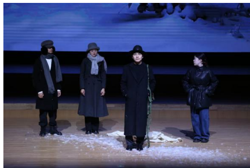
图 2-32 舞台剧《黎明》剧照