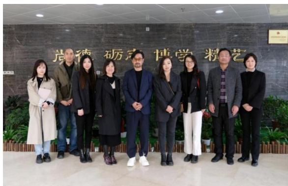
图 2-14 天津传媒学院调研座谈会