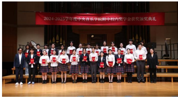
图 2-24 奖学金评选颁奖典礼