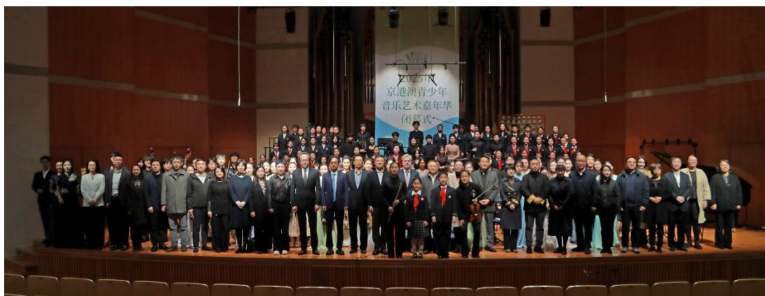
图 2-12 京蒙港澳台青少年音乐艺术嘉年华闭幕式