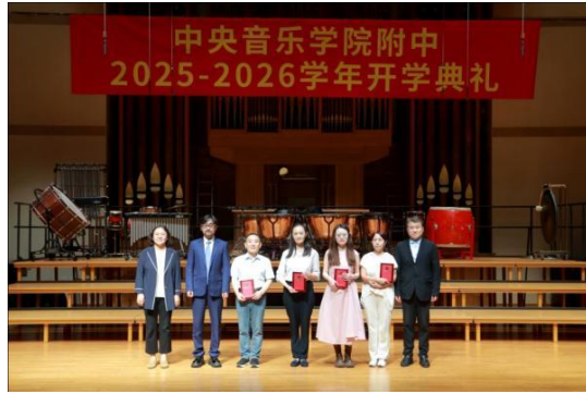
图 2-23 2025-2026 学年度开学典礼