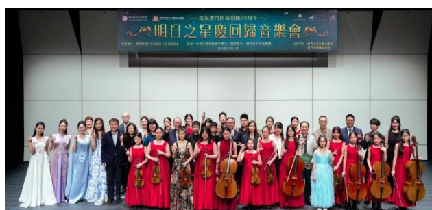
图 2-19 中央音乐学院澳门校友会主办的“明日之星庆回归音乐会”