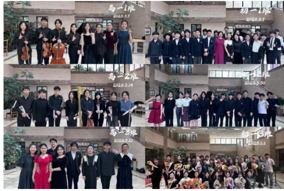
图 2-27 阳光房音乐会