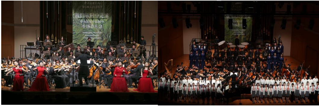
图 2-4 “我们从附中走来”专场音乐会

6月11日“我们走向世界——全球发行甄选音乐会”在中央音乐学院附中音乐厅举办。本场音乐会的表演嘉宾为中央音乐学院教师、在校生、毕业生，他们在音像成果出版、全球数字发行方面硕果累累，通过演绎其音乐专辑中的曲目，呈现中央音乐学院近几年在科研成果转化、教学成果实践、对外交流传播与提升中国音乐国际影响力等方面所作的努力，以音乐践行“增强中华文明传播力影响力”的理念。