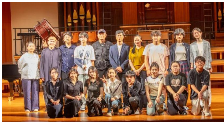
图 2-29 组织学生排练心理剧《送你一颗糖》