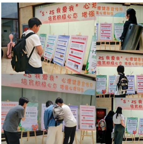
图 2-30 心理健康宣传