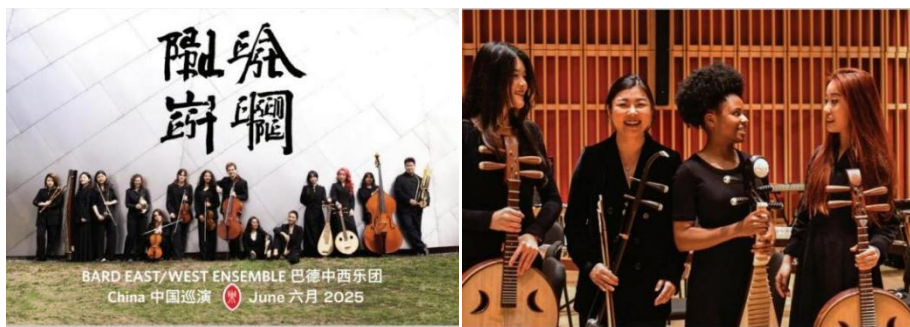
图 2-17 巴德中西乐团来访附中