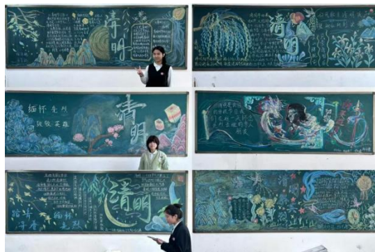
图 2-25 板报比赛