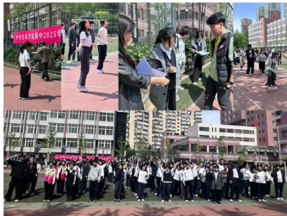
图 2-26 跳绳比赛