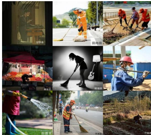
图 2-28 劳动教育用镜头记录劳动者最美瞬间