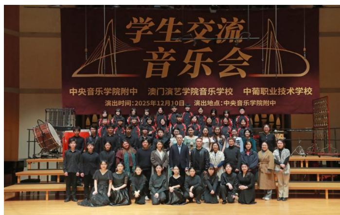
图 2-21 澳门演艺学院音乐学校、中葡职业技术学校师生交流团到访我校