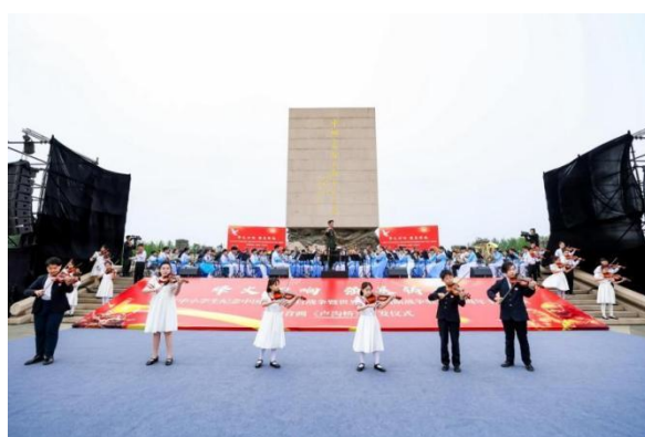
图 2-3 纪念中国人民抗日战争暨世界反法西斯战争胜利 80 周年主题展演·管乐交响音画《卢沟桥》首发式