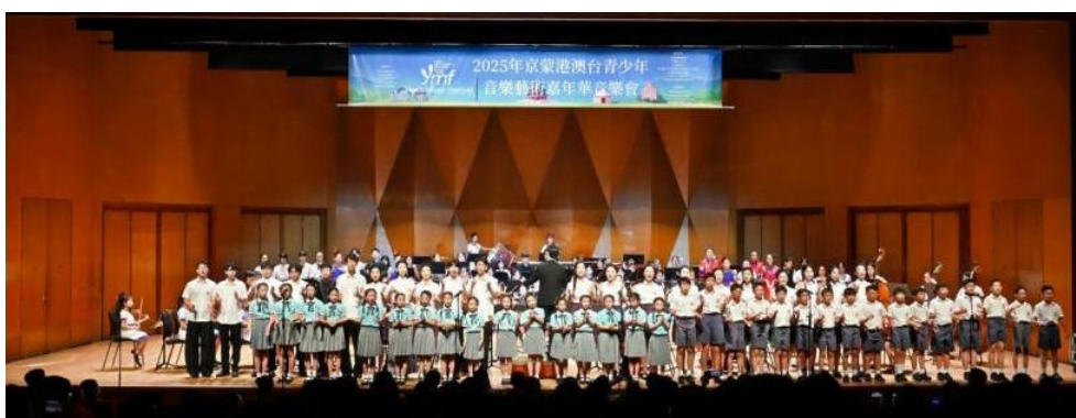
图 2-9 京蒙港澳台青少年合奏共唱《雪花》等