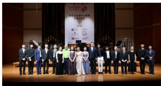
图 2-16 朗朗艺术基金会青年学者汇报演出