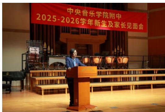
图 2-22 2025 级新生及家长见面会

打造学生科、辅导员、班主任、主科教师四级育人共同体。深化附中特色文化育人功能，以重大活动、重要纪念日、开学典礼和毕业典礼沁润爱国爱校教育，以学生社团活动、班团组织建设为载体，丰富青春向上的校园文化氛围。深化学生积极心理品质的培育，切实有效开展心理咨询、心理危机干预和家校医协同联动工作。打造双实践育人品牌，将劳动教育与校园绿化实践活动相结合，通过生动活泼的劳动体验实践课程，让学生亲自动手、亲身体会、自我感悟，切实把习近平新时代生态文明思想植根于学生的劳动教育实践中。