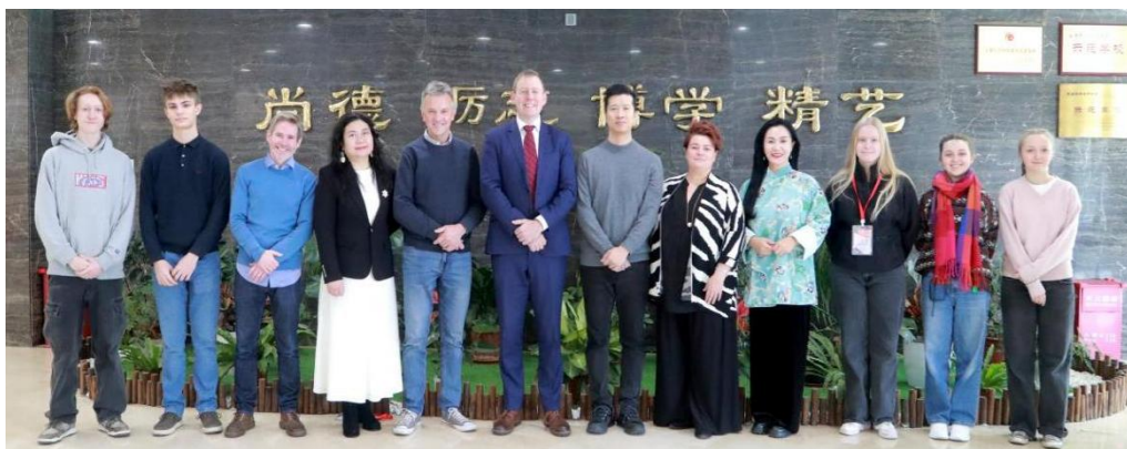
图 2-20 英国切特姆音乐学校来访附中