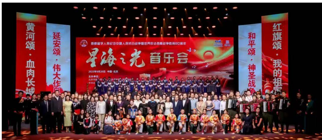
图 2-2 纪念中国人民抗日战争暨世界反法西斯战争胜利 80 周年“星海之光”音乐会