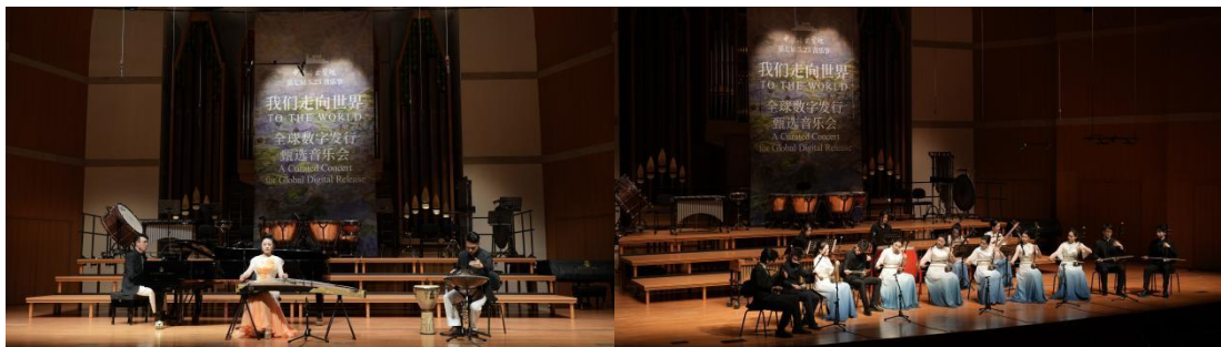
图 2-5 “我们走向世界”——全球发行甄选音乐会

6月11日“我们走向世界——全球发行甄选音乐会”在中央音乐学院附中音乐厅举办。本场音乐会的表演嘉宾为中央音乐学院教师、在校生、毕业生，他们在音像成果出版、全球数字发行方面硕果累累，通过演绎其音乐专辑中的曲目，呈现中央音乐学院近几年在科研成果转化、教学成果实践、对外交流传播与提升中国音乐国际影响力等方面所作的努力，以音乐践行“增强中华文明传播力影响力”的理念。