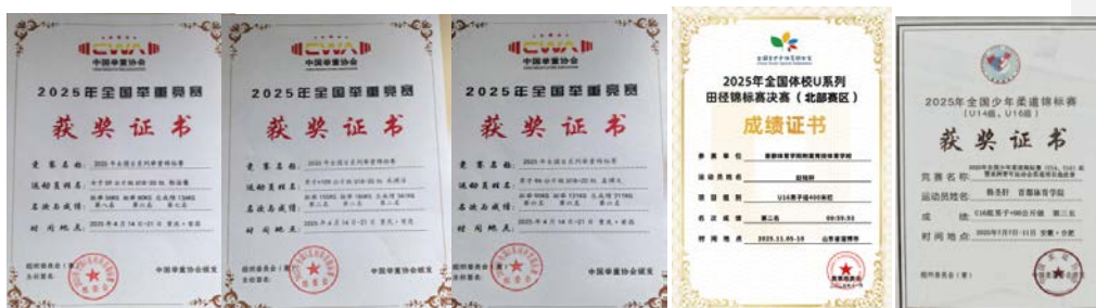
图3 学生获得全国比赛获奖证书