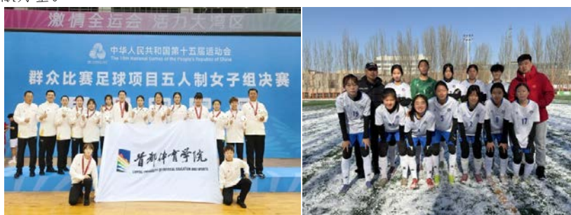
图5 足球队队员获得全运会群众组五人制足球比赛亚军

四、展望未来，砥砺前行再创辉煌。优异成绩的取得，离不开学校的重视支持、教练的辛勤付出和队员的刻苦训练。展望未来，首都体育学院附属竞技体育学校将继续完善训练体系，加大支持力度，为女子足球项目发展创造更好条件。女足队全体人员表示，将继续保持昂扬斗志，刻苦训练，争取在更高水平的赛场上再创佳绩，为学校争光，为首都体育事业发展贡献力量。