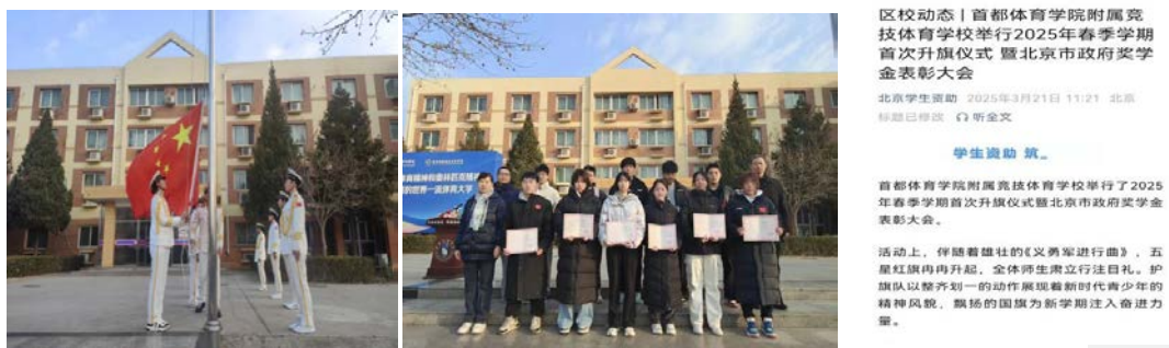
图1 学校举行2025年春季学期首次升旗仪式暨北京市政府奖学金表彰大会