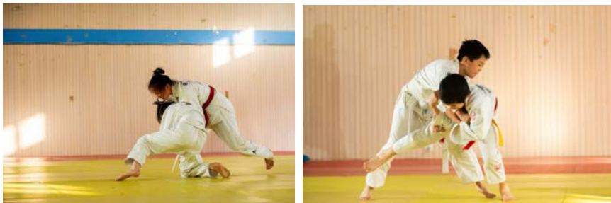
图7 2025年北京市海淀区秋季柔道锦标赛暨京津冀柔道邀请赛现场照片