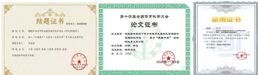
图 2 结题证书和论文录取证书