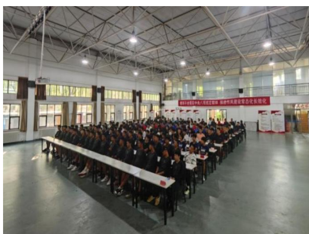
图 3-4 “铭记历史 强国有我”观九三阅兵

9月3日是中国人民抗日战争暨世界反法西斯战争胜利纪念日，学校团委组织开展“铭记历史、强国有我”观九三阅兵盛典活动。全校 160 余名师生、教练齐聚多功能厅观看阅兵直播，现场氛围庄重热烈。当国旗护卫队入场、受阅部队接受检阅及先进武器装备亮相时，全场多次响起雷鸣般掌声。观礼结束后，各训练队随即开展“强军梦·体育梦”主题分享会，学生踊跃发言，纷纷表示将以受阅官兵为榜样，把爱国热情转化为刻苦训练的动力，在训练场锤炼本领、赛场奋勇争先，立志以优异运动成绩为国争光，为体育强国建设贡献青春力量。