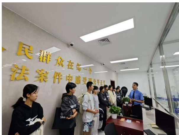
图 1-1 运动员学生代表参观 12309 检察服务中心

一是深化思政协同育人。严格落实市体育局思政课建设要求，强化思政课程核心阵地作用；深挖体育专业课程思政元素，融入爱国主义、体育精神等内容，推动思政课程与课程思政协同发力，筑牢学生思想根基。二是强化班级德育阵地。发挥班主任主导作用，以班级为单元开展校规校纪学习、防欺凌及文明礼仪教育，培育良好行为习惯；依托班会课开展国家安全、消防安全等专题教育，提升学生安全意识与自我保护能力。三是丰富多元德育实践。法治教育方面，2025年9月举办“法治护航青春，运动成就梦想”主题法治宣传周，组织25名学生走进大兴区人民检察院研学，邀请检察官开展专题讲座及家长线上普法直播，10月邀请法制副校长开展防欺凌、反网络陷阱主题演讲；安全教育方面，结合安全教育月开展“开学第一课”、主题班会等活动，普及消防、交通等安全知识，强化风险防范能力。四是落实心理保障。严格执行心理健康“一生一档”要求，组织全体学生测评，建立预警学生追踪机制，通过家校班联动提供个性化辅导；班主任定期与学生座谈，关注思想心理动态，引导树立正确“三观”，夯实心理成长基础。五是强化综合管理与安全防护。健全校园常态化管理与重点区域安全巡查制度，定期检修设施设备；针对体育训练特殊性，规范训练流程防护，配备专业器材与医务保障人员；完善家校协同机制，明确离校返校、外出集训等安全责任，构建全方位安全保障体系。