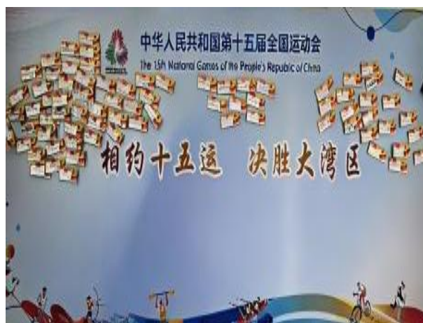
图 3-2 优化宣传阵地，强化教育熏陶

学校党委系统规划校园文化阵地，重新设计校园文化、楼道文化、训练场馆标语等内容，突出“红色基因”、“体育精神”与“历史沿革”主线，精心打造“红色长廊”、“全运倒计时”等特色文化场景，累计更新宣传展板 44 块，悬挂标语条幅 41 条，更新宣传视频 37 次，让校园文化“旧貌换新颜”，此举不仅传承了优秀传统文化中蕴含的精神内涵，更在新时代背景下，为师生提供了丰富的精神滋养，为校园文化和精神风貌提升注入了强大动力。