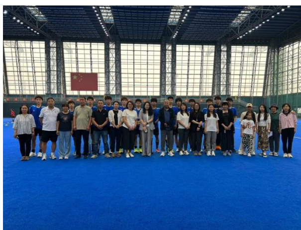
图 6-2 校园开放日家长观摩训练课合影

2025年5月1日至6月15日，学校开展“技能点亮未来，运动成就梦想”主题职业教育宣传月活动。活动期间，学校组织关于职教发展及“双优”培养计划的深度研讨，加快北京新型青训体系建设，落实市体育局全生命周期人才梯队建设方案，推进合作办学与“双元”发展路径构建，拓宽运动员发展空间与职业规划路径；组织校园开放日，向普教中小学师生及家长宣传体育职业教育特色与价值。开放日当天，68位家长到校观摩训练课、参观运动场馆、参加家长会，充分展示运动员学生技能风采，深化家校协同育人；开展职普融通体验活动，激发中小学生对曲棍球运动的兴趣，夯实项目后备人才基础；组织志愿者裁判员服务，弘扬劳动光荣的时代风尚，培育学生职业荣誉感与责任感。此次活动充分展示了学校职业教育办学成果，彰显体育职业教育魅力，营造了全社会关心支持职业教育的良好氛围。