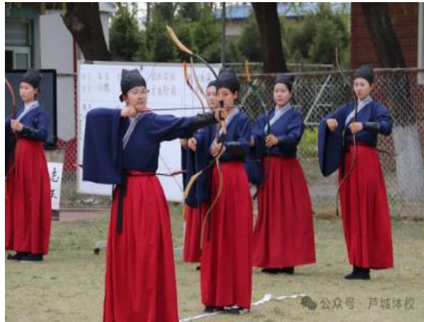
图 3-1 学生复原乡射礼

4月23日至25日，北京市第五届“子曰”中华优秀传统文化教育讲坛举行，活动以“人工智能时代的传统文化教育”为主题，线上线下联动直播，吸引北京十三区专家与教师参与。学校许卓凡、陈洪伟老师的《承千年射礼，砺今朝锋芒》公开课例在“幼教、职教、社会课例展示与点评”单元亮相并获好评。该课创新融合儒家礼射精神与中职语文、政治、历史等学科，借李佳蔓冠军叙事传递“反求诸己”理念，实现多学科融合与隐性德育课程化，为中职传统文化育人及课程思政建设提供了优秀范例。