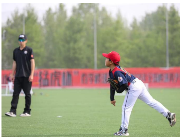
图 5-1 “猛虎杯”棒球比赛现场

学校在3月至6月组织北京市体育大会“猛虎杯”棒球比赛，赛事历时4个月、覆盖16个周末共15个比赛日，吸引学校组、俱乐部组共计300支队伍报名参赛，超2500名U7至U15年龄段青少年运动员同台竞技。赛事期间，全体运动员学生历经数百场激烈角逐，在赛场中披荆斩棘、锤炼技艺，既积累了实战经验，更收获了并肩同行的深厚友谊。运动员们以汗水诠释拼搏，用奋进书写热爱，为现场呈现了一场场精彩绝伦的竞技盛宴。