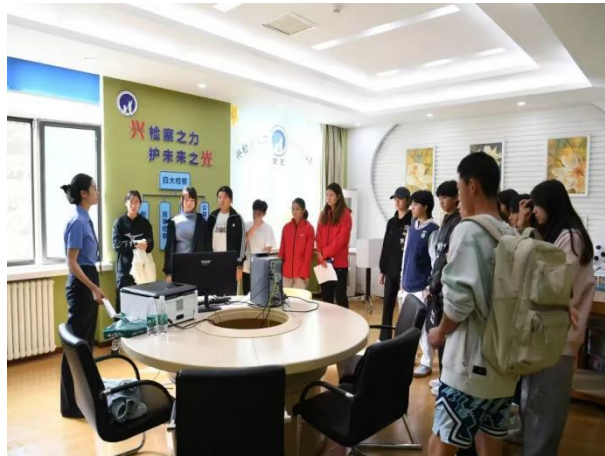
图 1-2 运动员学生到大兴区人民检察院参观