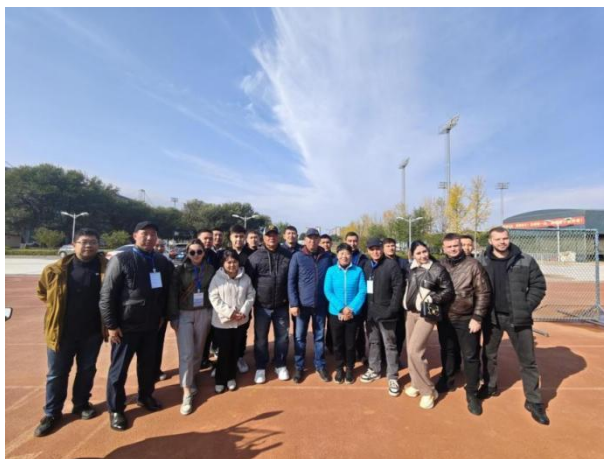
图 4-1 中亚五国青少年体育官员到校交流

2025年10月18日，学校成功承办中亚五国青少年体育交流促进研修班接待任务，来自摩尔多瓦、吉尔吉斯斯坦、乌兹别克斯坦的18名体育官员到校交流。活动期间，研修班学员观摩北京曲棍球青少年锦标赛，实地参观曲棍球、垒球等专业训练场馆，与教练员就场地设施标准、运营维护及青少年训练方法深入探讨，教练团队现场演示专业训练设备使用。此次交流充分展示了学校先进场地设施与训练理念，建立了与中亚国家体育部门在青少年人才培养领域的互信合作基础，为后续跨国联合训练营开展奠定坚实基础。