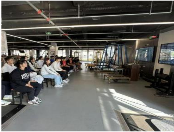
图 1-4 赛艇、皮划艇专项运动员学生在线上课