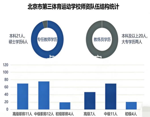
图 6-3 学校师资队伍结构统计图

学校师资队伍建设扎实推进，人员配置科学合理，梯队结构优良完善。现有专任教师 27 人，全员具备本科及以上学历，其中硕士及以上学历 6 人；教师职称分布均衡，高级职称人员占比优势突出，高级职称 11 人，中级职称 12 人，初级职称 4 人。学校配备二线教练员 22 人（含专任教师 5 人），教练员队伍学历层次较高，仅 2 人持大专学历，其余均为本科及以上学历，职称结构梯度分明，其中高级教练 7 人、中级教练 11 人、初级教练 4 人，为学校体育人才培养与梯队建设提供了坚实的师资保障。为适配新时代教体事业发展需求，学校构建“一主体、两翼、多支撑”联动培训新格局，以提升教师综合育人能力为核心，依托线上研修、体育局引领、校内教研实践及师德师风、信息技术应用等五大类专题培训精准赋能，全面提升师资专业素养，为高质量教学训练提供坚实人才支撑。