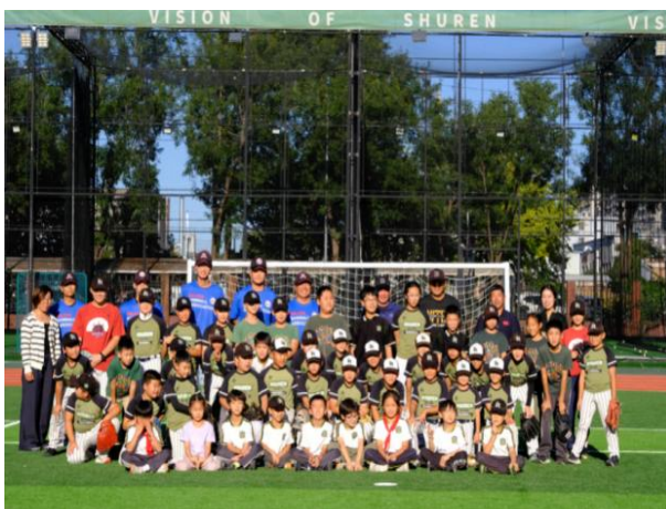
图 2-3 棒球队教练赴树人学校开展技术指导

为响应北京市体育事业发展号召、备战 2026 年市运会，2025 年 9 月 23 日，学校棒球二线队领队及教练团队专程到访通州区树人学校，开展棒球专业技术指导与区队队员选拔工作，既为地方学校提供专业体育教学支持，也为市级赛事储备优质后备力量，助力区域棒球运动规范化发展与人才梯队建设。在此基础上，10 月 30 日，北京猛虎棒球队队员化身导师再度到访，为该校社团小队员开展技术指导，搭建起冠军与未来的连接桥梁。活动中，猛虎队队员还赠送纪念棒球，以承载期许的珍贵礼物，为孩子们追逐棒球梦想筑牢起点，形成了专业培育与精神传承衔接的人才培养合力。