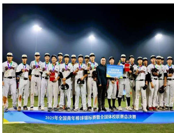
图 1-9 全国青年棒球锦标赛冠军合影

2025 年 10 月 10-19 日，学校棒球二线队征战全国青年棒球锦标赛暨全国体校联赛总决赛，凭借扎实的训练功底与默契的团队协作勇夺冠军。此外，学校棒球队 9 名运动员成功获评运动健将称号，为个人后续发展拓宽路径，充分彰显学校高水平竞技体育后备人才培养成效。