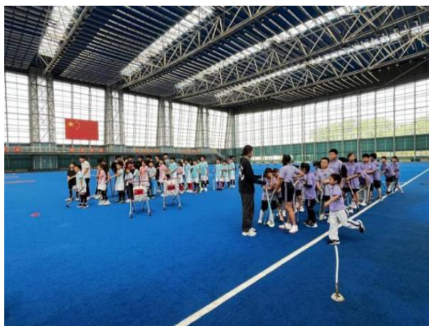
图 2-1 大兴七中、军庄小学师生来校交流

2025 年 6 月，学校开展体教融合实践活动，邀请大兴七中、门头沟军庄小学师生走进校园，开启曲棍球主题参观体验之旅。活动中，师生们实地参观先进的曲棍球训练场馆与专业器材，教练全面讲解项目起源、发展历程、比赛规则及国内推广现状；女曲队员一对一开展战术配合指导，助力同学们深刻领悟团队协作的重要性。此次活动不仅有效激发了中小学生对曲棍球运动的兴趣，更夯实了校际体教融合合作基础，为推动项目校园普及、培育优质体育后备人才筑牢根基。