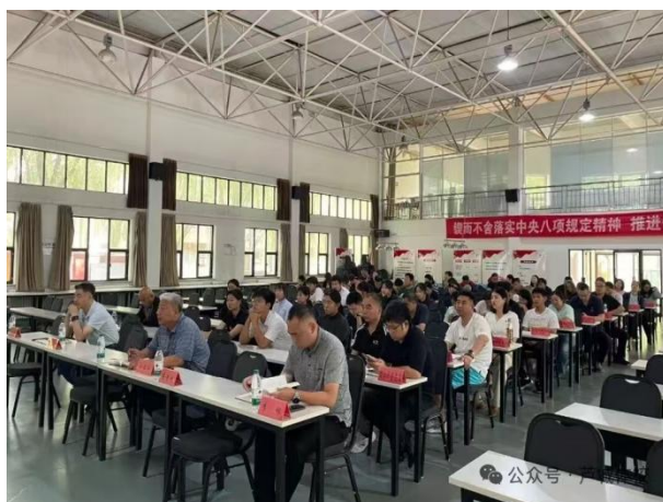
图 6-1 学校组织全体党员学习中央八项规定精神

学校以“三级责任链条”“五学联动”机制推进中央八项规定精神学习教育，制定专项计划，多次专题部署学习。为党员配发学习资料，领导班子讲授专题党课。组织党员赴京西山区中共第一党支部纪念馆开展主题党日活动，党委书记讲授专题党课，召开警示教育大会通报典型案例、观看警示片。各党支部累计开展学习实践活动 42 次，实现党员教育全覆盖，切实提升学习教育实效。