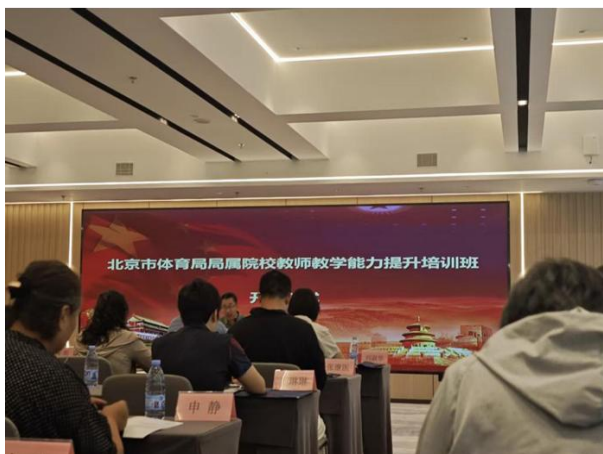
图 6-4 2025 年体育局局属院校教师专项培训