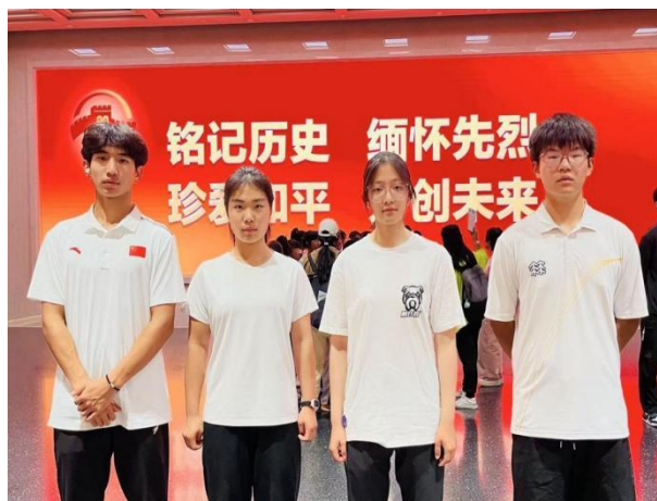
图 1-3 运动员学生参加讲思政课活动

学校组织多名运动员学生参加北京市教委主办的“赓续红色血脉，激扬奋进力量——纪念中国人民抗日战争暨世界反法西斯战争胜利 80 周年 2025 年职业学校学生讲思政课展示活动”，我校陈洪伟、胡琴两位老师创新实践“研学+思政”模式，带领运动员学生走进中国抗日战争纪念馆、中国奥运博物馆开展沉浸式学习。活动融合抗战精神与体育精神，引导运动员学生在实践中悟思政、讲思政。最终，两位老师指导申报的两项作品均斩获三等奖，充分彰显学校体教融合思政教育创新成效，为同类思政实践提供了可借鉴的优秀范例。