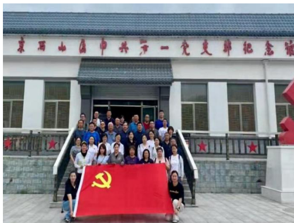
图 3-3 党员赴京西山区红色教育基地

体党员庄严重温入党誓词，铿锵誓言彰显对党的无限忠诚与奋斗决心。党员们纷纷表示，将以此次活动为契机，把红色精神转化为实际行动，立足本职、担当作为，为学校发展和党的事业贡献力量。