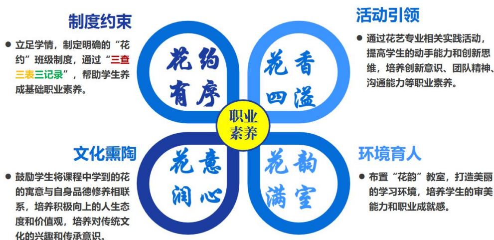
图 1-4：花艺设计与制作班级育人模式

化的专业化实训成果展示空间；构建“班级-校级-市级”三级递进的实践平台，将职业素养培育融入日常管理、课堂教学等多元活动中。该模式实施以来，学生行为规范持续向好，在各级技能大赛中累计获奖 10 余项。三年级学生全员通过“插花花艺师”职业技能等级认证。在社区服务与职业体验中，学生展现出“懂文化、有担当”的良好素养，班级凝聚力与社会认可度提升。