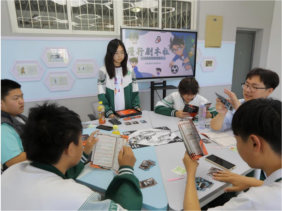
图 1-8：社团嘉年华漫行剧本社沉浸式剧本围读