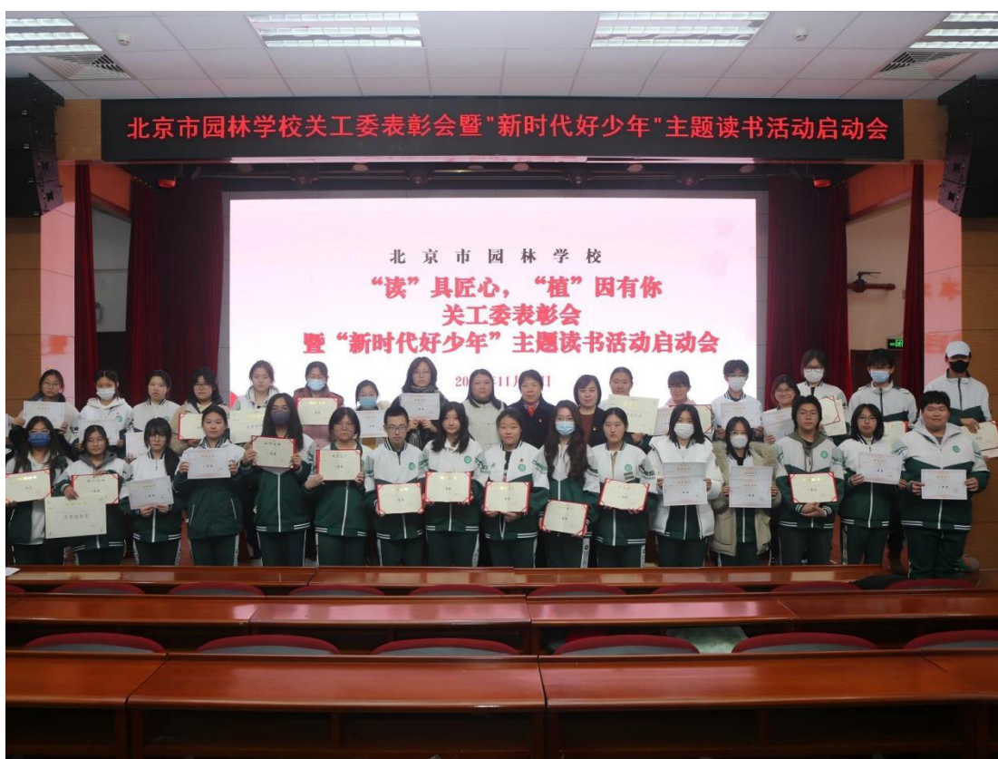
图 1-5：新时代好少年读书活动

线上与线下载体融合破解难题、提升实效；以贯通第一课堂（主阵地）、第二课堂（社团实践）、第三课堂（社会延伸）拓宽路径、知行合一，系统化推进读书行动走深走实。实施以来，学生思想素养与专业能力同步提升，在各类竞赛中屡获佳绩，志愿服务参与率显著增长；教师思政素养与教学水平持续提高，形成了“爱读书、读好书、善读书”的育人生态。