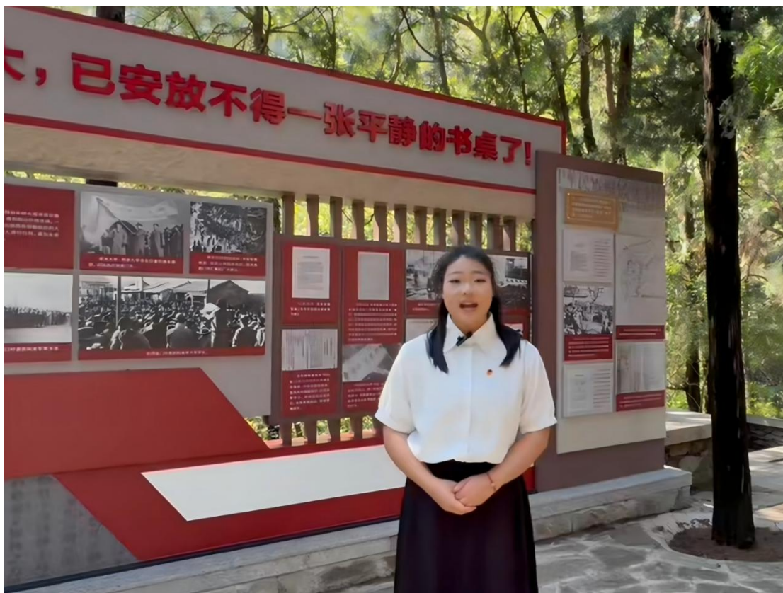
图 3-3：学生在樱桃沟讲思政课

课堂互动，形成了“实践—反思—反哺”的教学闭环，推动思政小课堂与社会大课堂深度融合。