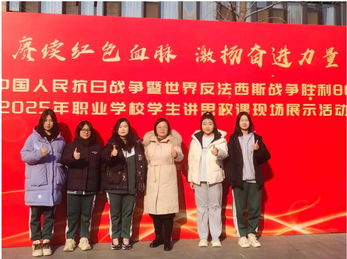
图 1-1：师生参加 2025 年职业学校学生讲思政课现场展示活动