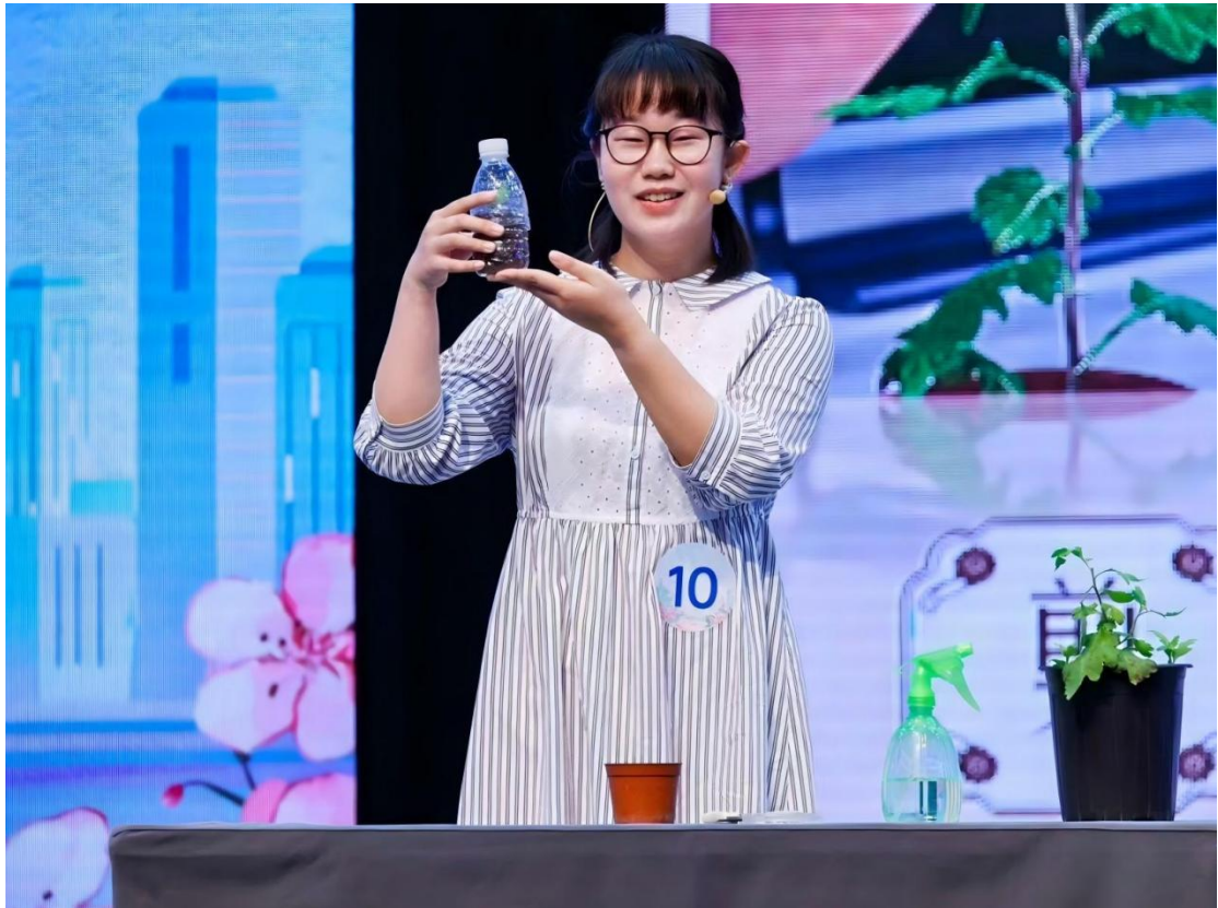
图 1-17：学生在 2025 年“我心中的花园北京”科普讲解大赛现场讲解

学校以科普讲解大赛为科教融汇重要载体，构建“校赛选拔+市赛培育”模式。组织校内10余名学生参加校内选拔，推荐5名学生参加北京市园林绿化局举办的2025年“我心中的花园北京”科普讲解大赛，组建行业导师与教研室专业老师联合指导团队，提供全程选题与技能指导。最终斩获二等奖2项、三等奖1项，学校获优秀组织奖，1名学生获评最佳选题奖。获奖学生后续积极参与文明风采征文、讲思政课等活动并屡获佳绩，通过教师节职业成长故事演讲发挥正向引领作用，在实践历练中涵养了严谨务实、担当奉献的专业品格。