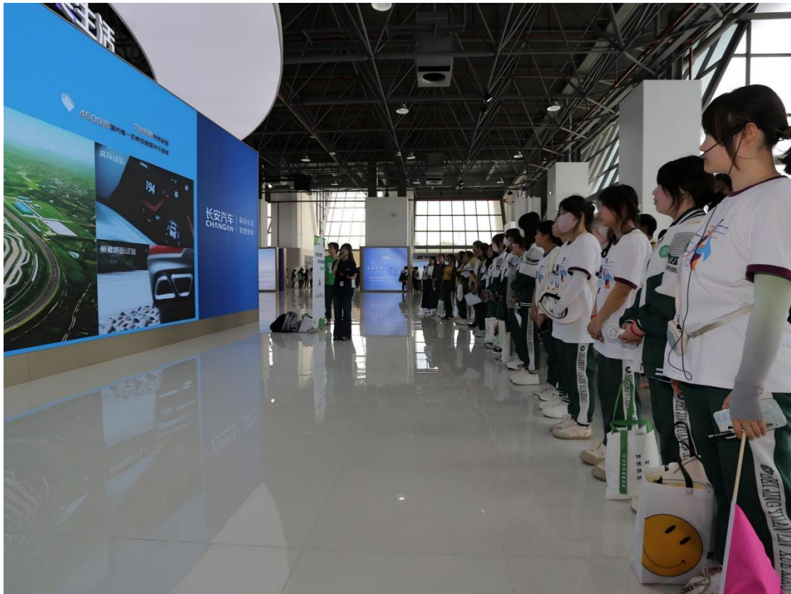
图 3-1：长安汽车厂研学活动

为深化企业文化传播与实践育人融合，2025 年我校依托旅游专业特色优势，以长安汽车宴店工厂为研学阵地，开展了一场沉浸式企业文化学习活动。活动前期，旅游专业师生深入工厂调研，全面挖掘其现代化生产线、标准化管理模式背后的企业文化内核，精心编制研学学案与手册，构建起“调研—设计—实践”的闭环育人链条。随后，我校组织 600 余名学生走进工厂，实地观摩智能制造流程，近距离感受规范高效的管理文化，直观体悟企业精益求精的匠心精神与创新进取的发展理念。此次研学实践，将抽象的企业文化转化为可感可知的实景课堂，既让学生领略了现代企业的发展活力，更推动企业文化基因与校园育人深度融合，为培养兼具职业素养与文化底蕴的应用型人才注入了鲜活力量。