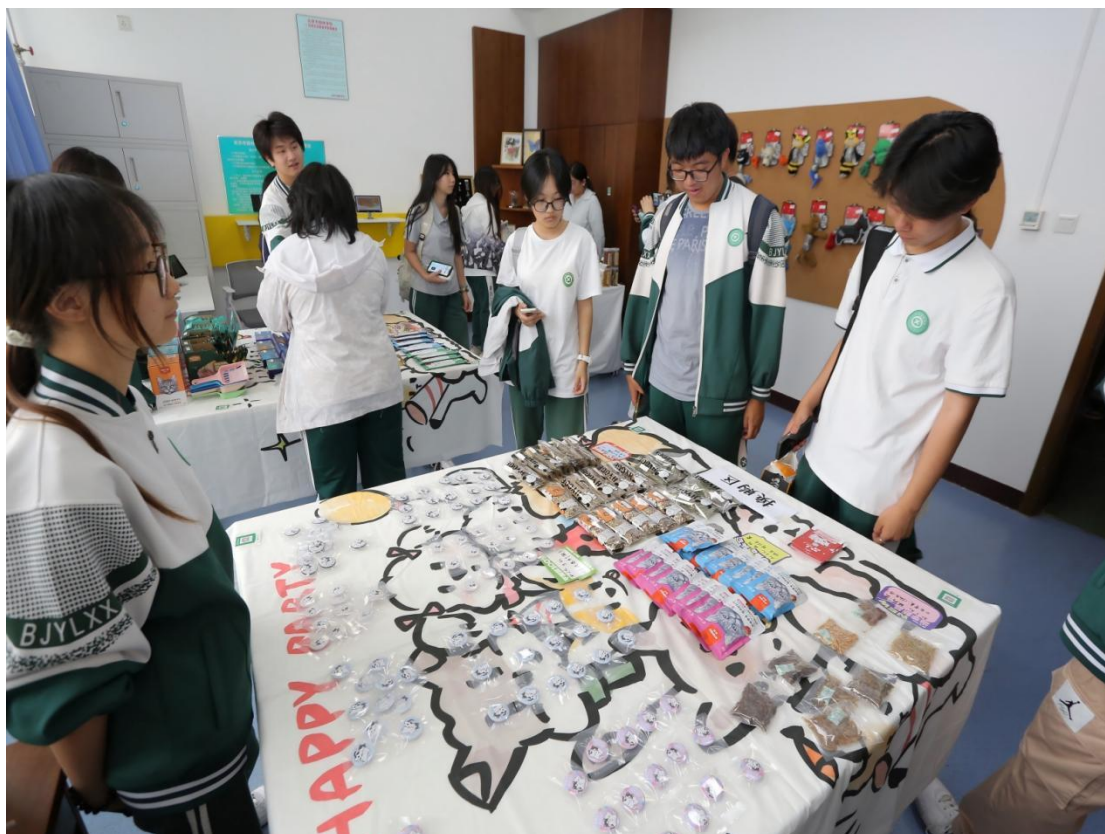
图 1-13：“公益宠物市集”现场活动