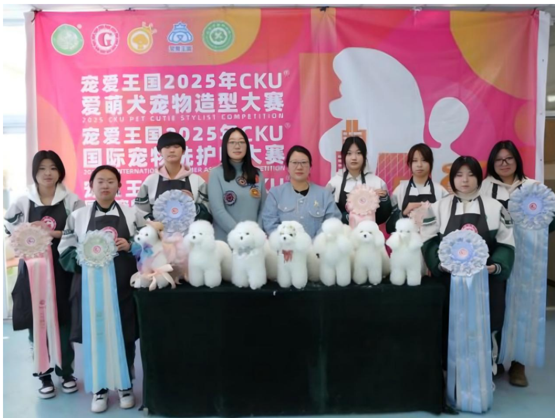
图 1-12: CKU 爱萌宠宠物造型大赛参赛师生及作品