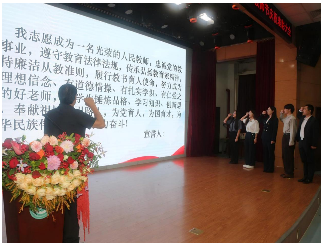
图 6-4：教师节新入职教师集体宣誓