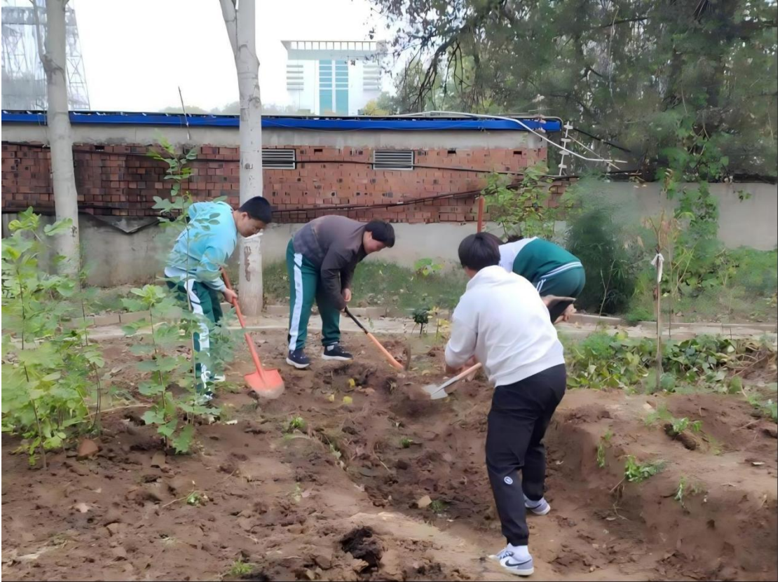
图 1-3：劳动周学生进行校园绿化建设

突出专业性，加强及时性考核评价，实施“每日任务差异化”设计，提升实践针对性与趣味性。岗前开展专项培训，打破专业壁垒，实行“专业混合”分组，每组配备 1-2 名园林/花卉专业学生任“小导师”，助力技能传递。改革成效显著，学生平均出勤率超 99%，一线指导人员正面评语占比超 93%。学生在技能应用、责任意识、协作能力与劳动素养等方面全面提升，深化“校园共建”认知，营造“以劳践德、以绿育人”良好氛围。