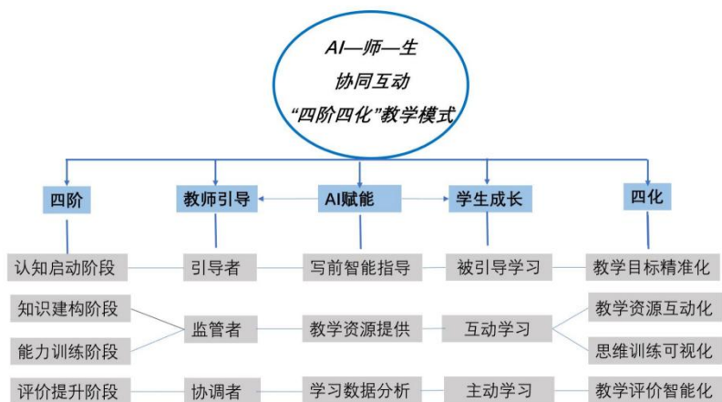
图 1-15：“四阶四化”人工智能辅助写作教学模式

化、思维训练可视化、教学评价智能化。经过改革，学生提交的文章语言表达更准确流畅，整体质量大幅提高，在北京市文明风采征文比赛中，1人获得一等奖，3人获二等奖，2人获得三等奖。