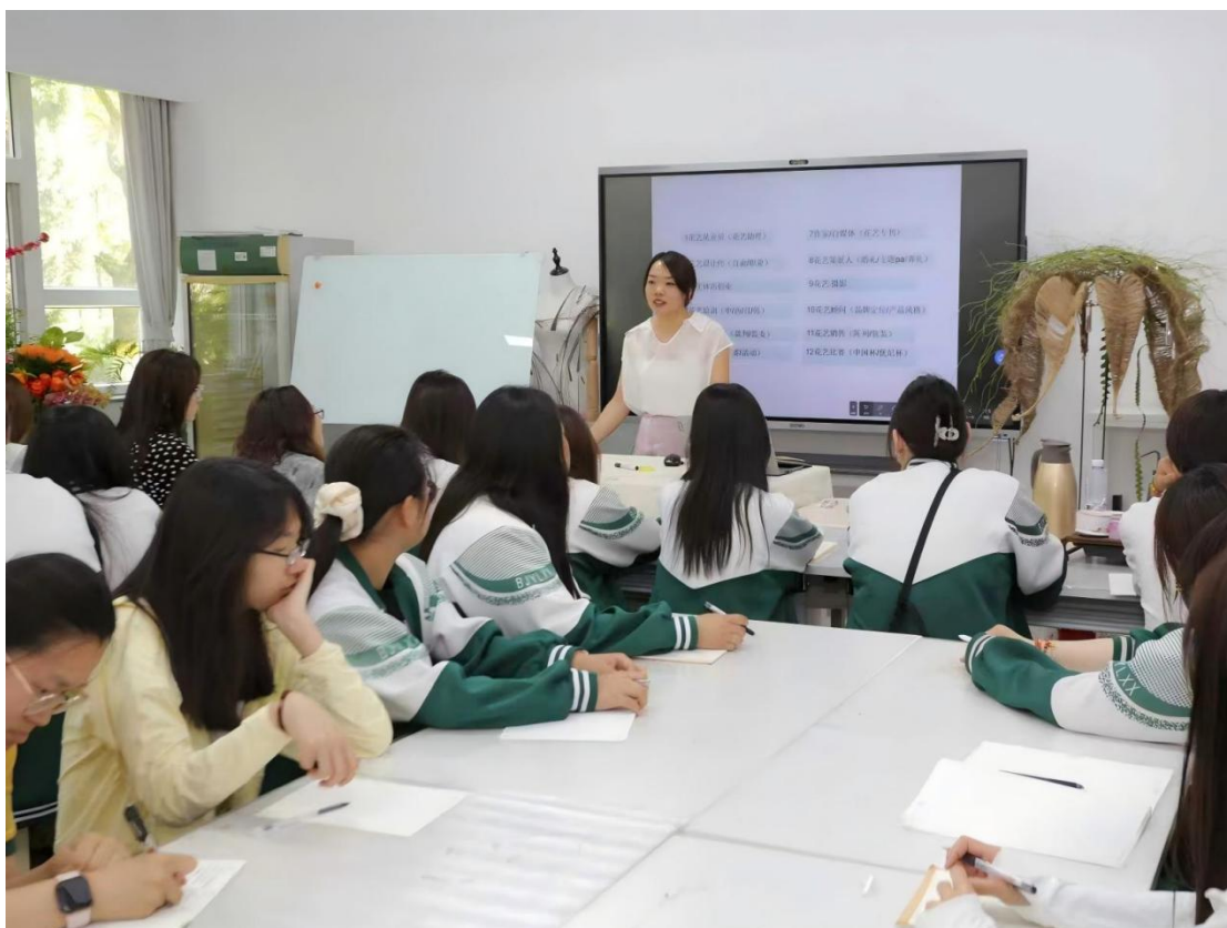
图 1-6：师生聆听“花艺之美”讲座