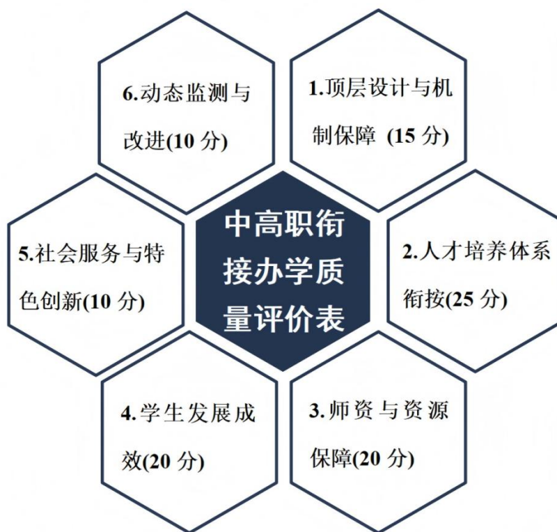
图 6-2: 中高职衔接项目办学质量评价六级指标