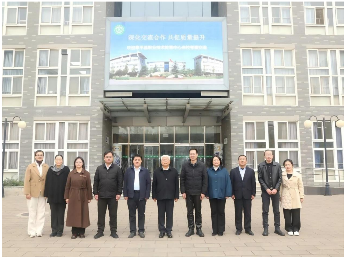
图 2-2：阜平县职业技术教育中心交流团队参观校企合作单位

学校以校际交流为纽带，构建了“展示-交流-共享”区域职教协作模式。阜平县职业技术教育中心来校交流期间，园林系展示了学校特色高水平骨干专业及工程师学院建设情况。园艺技术、花艺设计与制作等专业围绕人才培养核心环节，从贴合行业需求的课程体系构建、“双师型”师资队伍梯队化培养，实训基地的标准化建设、校企联动的深度融合模式等方面，交流了专业建设成果。通过展示交流，实现了“岗课赛证”一体化育人实践经验共享。