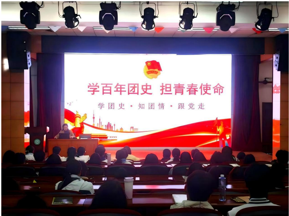
图 1-7：入团积极分子听团课