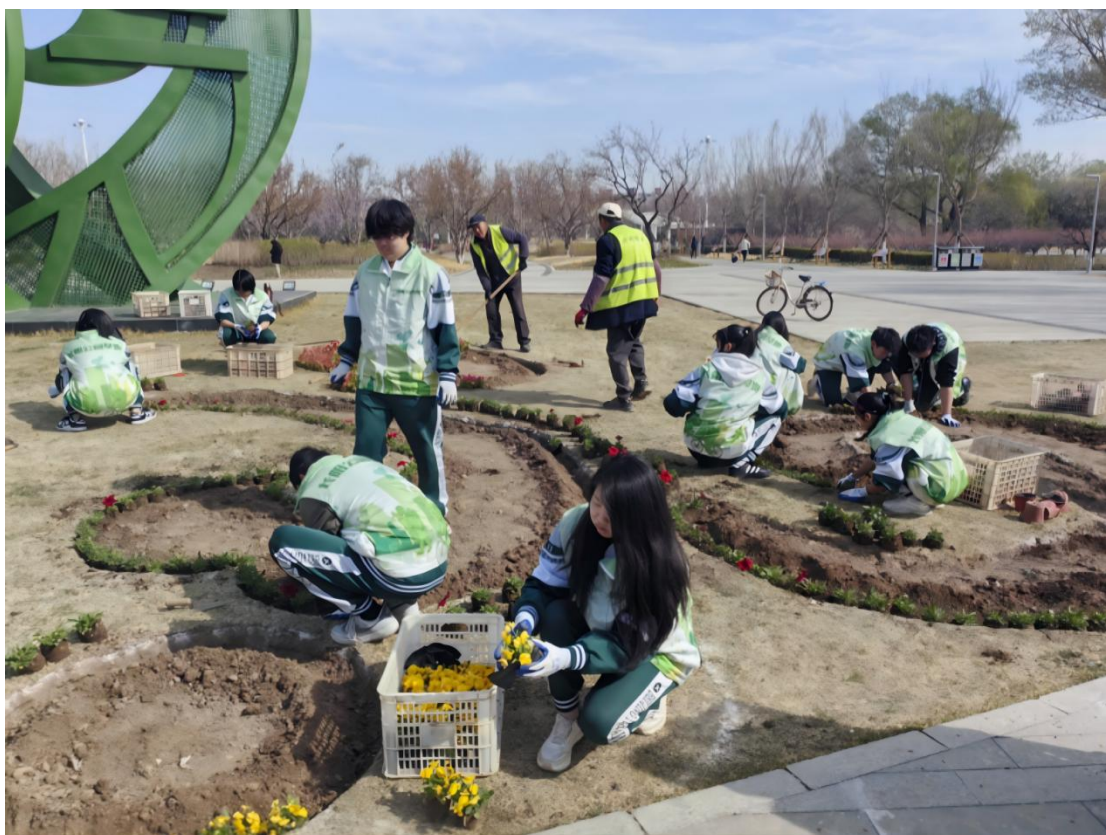
图 2-1：师生齐力为长阳公园增色添彩

学校以“三融三促”为路径，为地方社区提供多元化服务。专业与项目深度融合，推动成果转化。以长阳公园景观改造提升等项目为载体，师生将园林植物应用、工程施工等核心课程知识转化为实践成果，优化公共空间景观效果。学校与社区紧密融合，促进协同发展。联合房山富燕新村社区、万科幸福汇社区打造“社区微花园”，带领居民改造闲置角落为绿色空间，既改善人居环境，又培育社区绿色文明风尚。短期与长效有机融合，推动服务升级。在完成服务项目的同时，建立常态化服务机制，2位教师受聘为“社区园艺师”，搭建技术咨询网络，持续为社区解决绿植养护难题。系列举措彰显了职业院校服务区域发展的责任担当。