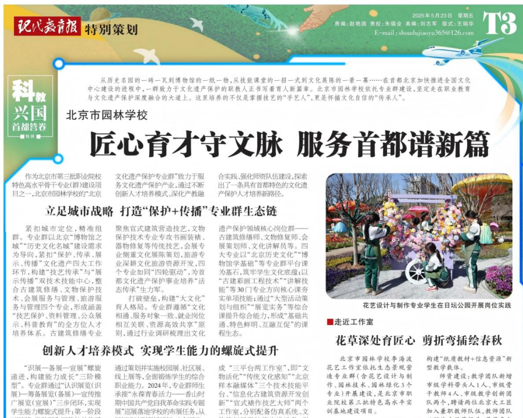
图 6-1：《现代教育报》报道学校特高项目建设成果

学校以党建为引领，统筹推进宣传思想与舆情管理工作，构建全方位、立体化工作格局。在正面宣传上，依托自媒体平台发布招生、实践、大赛等内容，相关成果获《现代教育报》深度报道。在舆情管控上，完善突发事件新闻应对、舆情应急处置等预案，安排专人值守网络平台。在阵地管理上，将校内展板、海报等纳入意识形态排查范围并审核备案；细化自媒体发布“三审三校”流程，完成 5 个微信公众号、1 个视频号备案及运营指导。同时，围绕接诉即办、师德师风等热点加强研判，摸排师生思想动态，确保校园思想稳定。