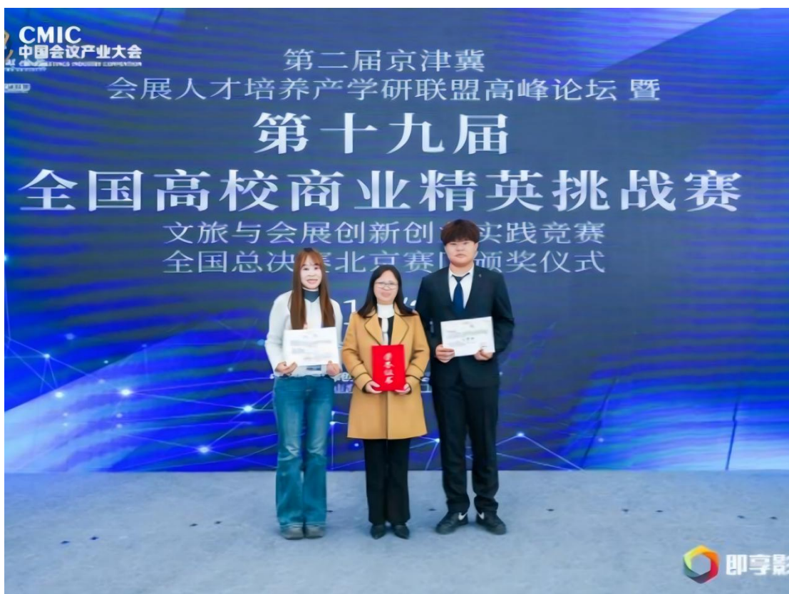
图 1-18：教师与学生代表参加第十九届全国高校商业精英挑战赛颁奖仪式

会展专业秉持“以赛促教、以赛促学”理念，聚焦会展行业核心能力与新兴数字技能，2025 年组织学生角逐全国高校商业精英挑战赛两大赛道。师生团队深耕真实项目需求，对会展文案策划案、执行案多轮打磨，对短视频作品反复优化叙事与视觉表达，最终斩获文案赛道全国一、三等奖，短视频赛道市赛一等奖、国赛二等奖。赛事检验并提升了《展览实务》等核心课程教学成效，高强度锤炼了学生的创新思维、策划执行与数字技术应用能力，也为课程内容对接行业前沿需求锚定了方向。