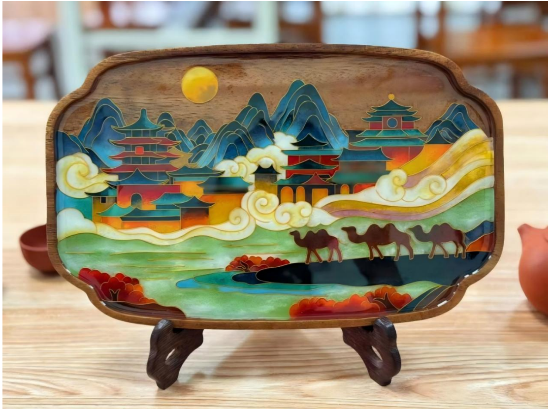
图 4-1: 学生作品《丝路驼铃·敦煌掐丝珐琅茶盘》获“丝路工匠”大赛一等奖