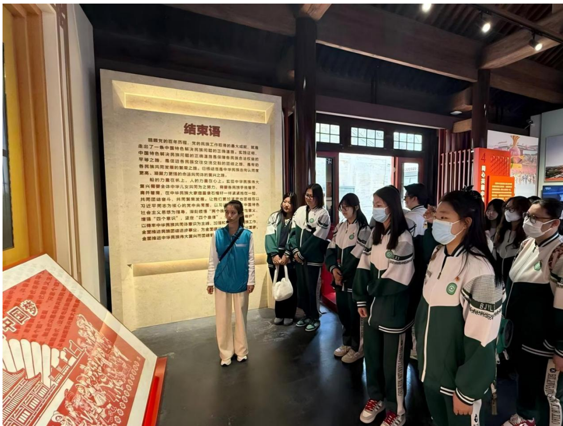
图 3-2：22、23 级团员赴蒙藏学校开展主题参观

以红色资源为育人纽带，深化团员思想引领，传承红色基因，铸牢中华民族共同体意识，通过沉浸式教育赋能团员成长。学校团委组织 22、23 级团员赴蒙藏学校开展主题参观活动，采用“史料研读+情景感悟+团员宣誓+实地体验”模式，开展同伴互助讲解，设置“组队划龙舟”互动环节，引导团员重温革命岁月、强化责任担当、凝聚协作力量。团员思想觉悟全面提升，深刻领悟民族团结内涵；先锋意识显著增强，主动发起红色故事分享；集体凝聚力持续升温，形成青春合力，为共青团工作与中职德育融合提供生动实践。