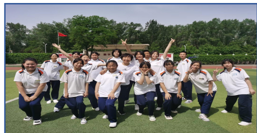
图—57 积极乐观的班集体