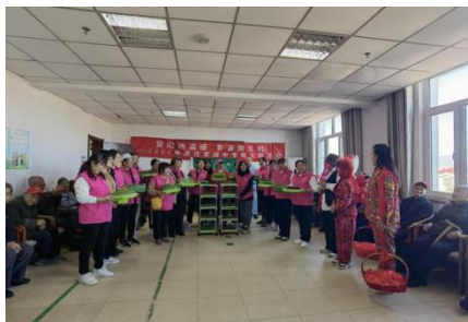
图-33 到敬老院向老人推介芽苗菜种植技术

职业学院依托康庄镇志愿服务实践载体，打造“康大姐社会服务坊”项目，以“公益实践+终身学习”双向赋能为核心，开展了系列志愿服务活动，赋能乡村振兴。自 2018 年起累计开展各类活动 200 余场次，受益人群 22800 人次。累计发展注册志愿者 905 人，开展服务项目 37 个，形成 45 万小时的服务实践网络，成为区域乡村振兴战略实施的关键社会支持力量。