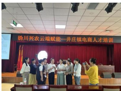
图-28 井庄镇电商人才培训

职业学院在井庄镇开办了第一个“妫川兴农云端赋能—井庄镇电商人才培训”班。本次培训历时 8 个月，聚焦抖音平台农产品电商实操技能，采用“理论+实操+实战”相结合的教学模式。课程内容涵盖直播电商全流程，旨在通过系统化训练，帮助学员掌握电商运营核心技能，为地区农产品上行开辟新渠道。为井庄镇培养出了“北京市第一个新农人直播团队”次直播团队受到了中华人民共和国农业农村部、北京市农业农村局、延庆区人民政府、辽宁省农业农村厅等官网、国内三大门户网站新浪搜狐网易以及其他各类媒体报道或者转载。真正实现“培育一人、带动一片、致富一方”的目标，为乡村振兴注入持久数字动力。