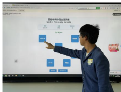
图—6 腾讯元宝 AI 生成情景化单词游戏——“单词消消乐”

英语教研组以“AI 赋能，提质增效”为核心目标，探索 AI 技术与英语教研教学的深度融合，明确了 AI 技术应用需以课标为导向，以学情为基础，服务于学生语言能力、文化意识与思维品质的协同发展。实践探索中构建了“AI+教研教学”多维应用体系：在教学方面利用腾讯元宝 AI 生成情景化单词游戏（如“单词消消乐”），