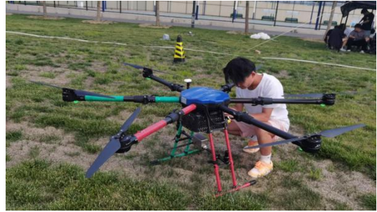
图—54 企业入校无人机专业理论培训现场