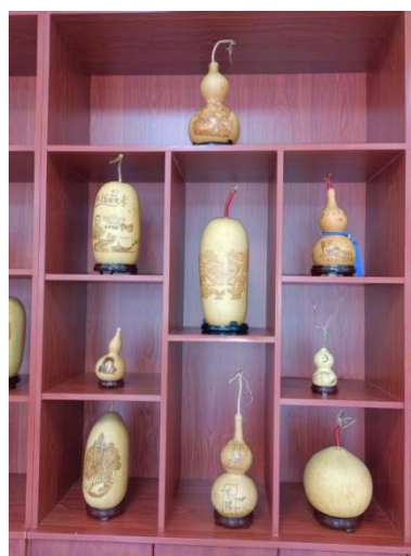
图—38 葫芦画手工艺作品图片