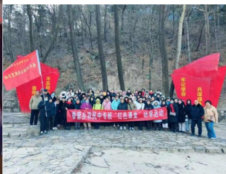
图—42 红色课堂研学活动