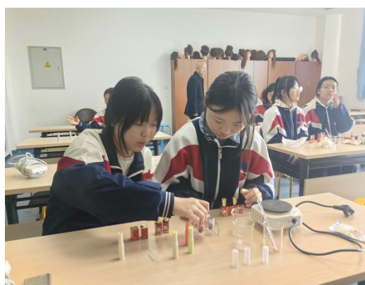
图—36 协同校学生职业体验