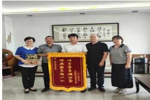
图—61 千家店镇赠送锦旗