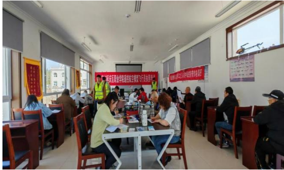
图—26 残联飞行员执照考试

职业学院与杰翱飞行、国彩低空经济产业研究院等企业合作，共建无人机培训基地，共同开展从业人员培训、转岗再就业培训，承办行业技能竞赛，构建起涵盖无人机构造、操控、维护的全产业链人才培养模式。累计开展无人机培训 1362 人次，其中 41 人取得遥控航空模型飞行员执照，118 人获得轻型民用无人驾驶航空器理论合格证明。与区残联合作开展遥控模型飞行员取证培训，20 名残疾人学员全员通过。开展涵盖视距内与超视距操作的低空 CAAC 无人机驾驶员培训，提升实操能力联合承办第三届全国技能大赛北京市选拔赛无人机驾驶（植保）赛项及“国彩杯京津冀青少年无人机足球联赛，推动竞技无人机普及与区域协同发展。为延庆低空经济可持续发展注入了专业动能。