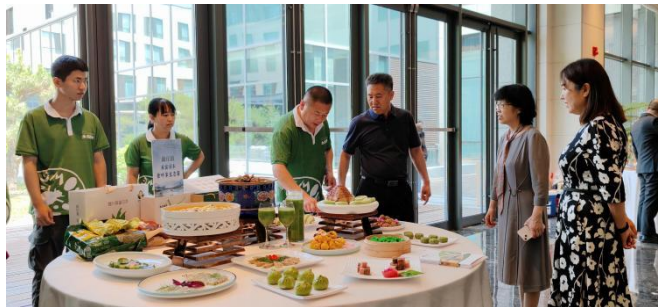
图-27 指导康庄镇打造“食叶草生态宴”

职业学院构建了“政校行企”四方协同合作机制，有效整合乡镇民俗村、学校、饮食服务行业协会和典型乡村餐饮经营户各自的资源与优势，通过产教融合与校地合作，切实提升餐饮品牌建设实效。采用“需求调研--文化挖掘--菜品研发--技能培训--品牌推广--跟踪指导”的推进模式，系统化开展乡村餐饮品牌建设。2025 年，学校先后助力打造了康庄镇“食叶草生态宴”、千家店镇下湾村“画廊知青餐”、康庄镇小丰营村“丰收宴”、张山营镇“金玉宴”等特色餐饮品牌，有力推动了延庆“一镇一桌菜”乡村旅游餐饮格局的形成，展现了良好的示范效应和社会影响力。