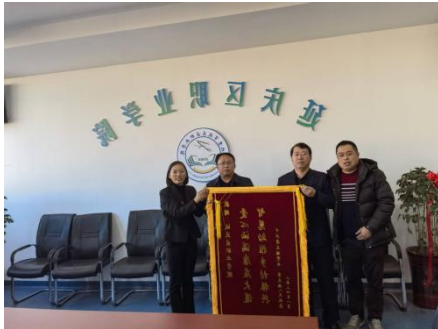
图—58 旧县镇赠送锦旗