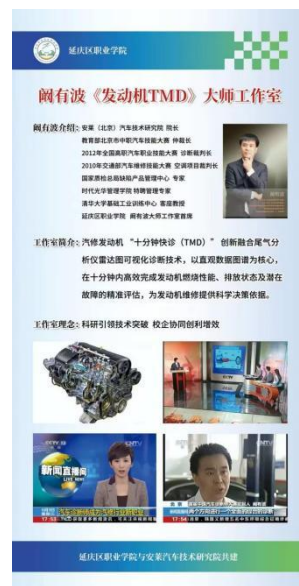
图—25 汽修专业大师工作室宣传图