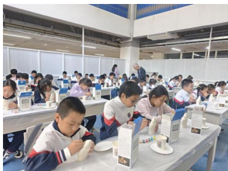
图—10 小学生到学校体验北京兔爷制作

职业学院面向全区中小学校开展劳动教育与职业体验课程，2025 年服务学生达 6622 人，获得了广泛好评。为持续完善课程体系，学校陆续开发了 54 门劳动教育与职业体验课。包括北京兔爷制作、非遗宋锦头饰等融合非遗传承与劳动教育的特色课程；围绕区域无人机、园林园艺等重点产业开设了无人机操控技术、植物画手工制作、盆景制作等劳动体验课程；围绕家庭生活开设了糕点制作、口红制作、废物再利用等课程。丰富的劳动教育的课程内容，增强了课程在不同学段的适应性与教学实效性。