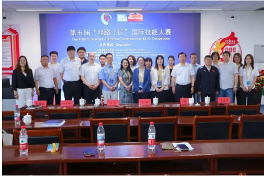
图—47 承办第五届“丝路工匠”国际技能大赛