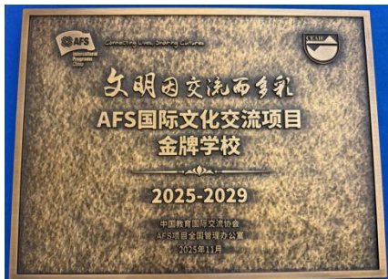
图—45 AFS 国际文化交流项目金牌学校

以北京世园、冬奥为契机，依托长城文化，职业学院自 2006 年招收外国学生至今，不断摸索，积累经验，在北京市国际合作办学队伍中走在前列。与中国教育国际交流协会 AFS 国际文化交流项目合作，成为“全国项目金牌校”；作为北京市教育学会中小学国际教育专业委员会常务理事校，学校加入“丝路工匠”国际职业院校合作联盟，被欧陆国际授予“职业院校国际联盟合作贡献奖”；与俄罗斯伊尔库茨克经济服务旅游学院签订友好校合作协议；成为中巴国际产教合作发起单位。