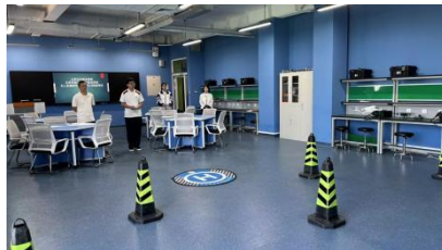
图—8 无人机专业实操转段考试