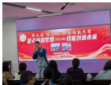
图—17 学校组织“匠心杯”技能比赛

职业学院以技能竞赛为育人抓手，每周二晚 5:30 至 8:30 开展特招生专项培养，各项目以 15 人左右小班精准指导。每年 6 月，学子先征战延庆区职业技能大赛，再冲击更高级别赛事，屡获佳绩。微视频《数字校园》获北京市师生信息素养实践活动最佳创意奖；北京市职业院校技能大赛中，婴幼儿保育团体赛及多项目共摘 13 奖。第三届“丝路工匠”大赛揽 39 项荣誉，全国行业职业技能竞赛收获 17 项奖项，以赛促学培育匠心人才。