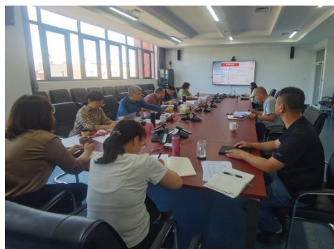
图-12 专家全流程督导教研工作

借助现代智能工具梳理文献提升效率。课题成果落地成效显著，议题式教学融入思政课堂后，有效调动学生参与度、强化价值认同，落实立德树人任务，切实破解教学难题，助推课堂提质增效，赋能师生成长成才。