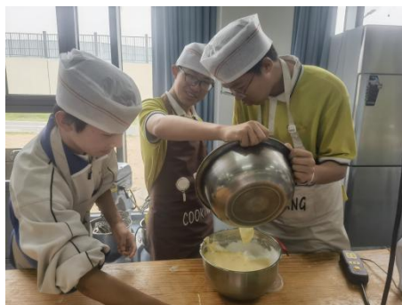
图—11 中学生到学校体验蛋糕制作