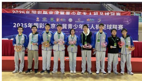
图-23 “国彩杯”京津冀青少年无人机足球联赛