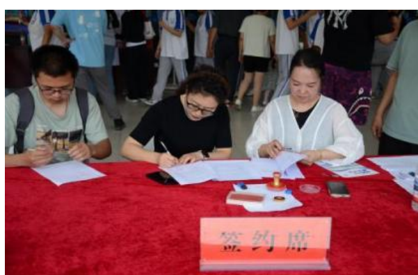
图—14 校园就业推介会现场签约