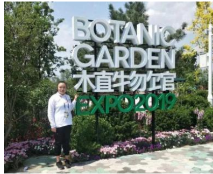
图—3 园林专业学生到世园公司实习