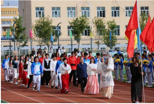
图—43 体育节开幕式上国际教育特色方阵