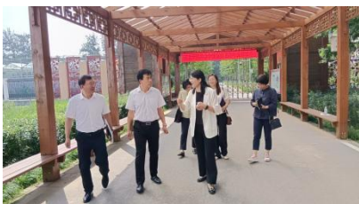
图—7 学校领导与农职院领导对接合作办学

职业学院无人机操控与维护专业与北京农业职业学院无人机技术应用专业开展“3+2”中高职衔接人才培养。两校共同制定人才培养方案，系统设计“中职-高职”衔接课程体系，避免内容重复与断层，确保学生五年内实现从基础技能到高端应用的能力递进；中职阶段组织学生进入高校和企业沉浸式体验高职教学氛围，帮助他们建立对高职院校和职业的认同感，高职教师进入中职课堂授课，将前沿技术、行业标准融入中职教学。中职教师赴高职院校进修，与高职院校教师结对，更新教育理念与技术能力。为学生可持续发展奠定了坚实基础。