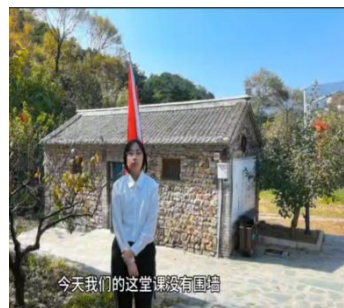
图—1 行走的思政课堂

职业学院开学初组织全体师生收看人民网“传承抗战精神技能铸就未来”同上一堂思政大课——《精神丰碑》。组织全体教师集体备课，推进思政课一体化建设，在所有学科教学中都融入思政教育，开展全体教师参加的思政融入教学的课程展示活动。组织师生到平北抗日战争纪念馆等6个红色教育基地参观学习，在全校开展红色文化宣讲活动，与全区各红色教育基地共建，选取优秀学生解说员实地为游客讲解抗战英雄事迹。