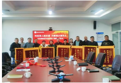
图—60 康庄镇赠送锦旗