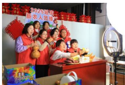
图-29 井庄镇电商人才培训教学成果展示