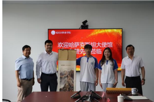
图—48 接待哈萨克斯坦使馆文华参赞