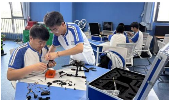
图—50 无人机组装与维修课

信息技术系无人机操控与维护专业立足延庆区域发展，构建了“校企协同、育训结合”的特色发展模式。依托合作企业实训基地，通过“企业文化进课堂”、“工学交替”、“顶岗实习”三年阶梯式校企共育，搭建人才成长桥梁。企业将中国民航局（CAAC）无人机驾驶执照考证课程与学校现有无人机基础、模拟飞行课程整合，进行课程共建；企业专家利用实训基地进行无人机检修课程讲授及指导，提升学生的核心技能与就业竞争力。校企共育模式精准对接企业需求，为行业输送高素质的无人机应用、运维与管理的技术技能人才。