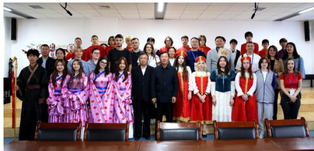
图—46 国际学生接待俄罗斯教育代表团