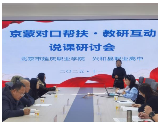
图—35 京蒙说课研讨会