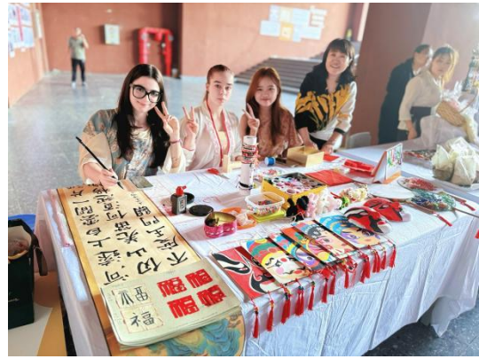
图—44 中国传统文化课业展示