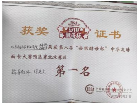
图—18 学生参加“安琪酵母杯技能比赛” 图—19 学生获得“安琪酵母杯技能比赛”一等奖