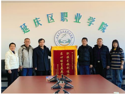
图—59 延庆镇赠送锦旗