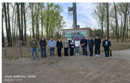
图—52 北信科大到沈家营林场实地调研