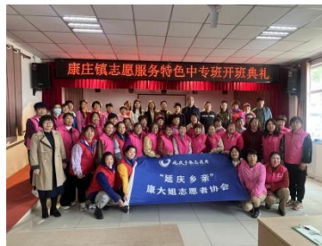
图-34 康大姐志愿服务中专班开班典礼