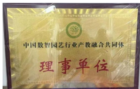
图—53 成为“中国数智园艺行业产教融合共同体”理事单位

在职业学院市域产教联合体建设中成为“中国数智园艺行业产教融合共同体”理事单位。该共同体由学校与北京市西郊农场有限公司、北京农学院共同牵头，集合了全国 27 个省、自治区、直辖市 151 家知名企业、院校及科研院所，是共商数智园艺未来发展的重要平台。共同体在未来建设中将深化与企业、学校及其他教育机构的合作，共同探索园艺行业的新模式和路径。秉承“创新、协调、绿色、开放、共享”的发展理念，加强与各方的合作，共同推动中国数智园艺行业迈向新的高度，培养更多符合新时代需求的园艺专业人才，以适应和引领行业发展。