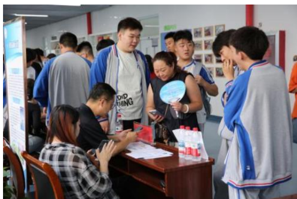
图-13 校园就业推介会家长现场咨询

职业学院与区人社局联合举办 2025 年实习就业推介会。推介会邀请了北京大董烤鸭、航天九院、全国人大培训中心等 61 家用人单位，提供维修技师、无人机助教、中西厨工等 496 个实习就业岗位，岗位类型涵盖面广，充分满足毕业生多元化的求职需求。学生们针对岗位职责、发展潜力、薪资待遇等方面与用人单位进行深入咨询和交流。职业学校中职学生、开放教育大专本科学员、农广教育中专班学员、京津冀教育协同校学生及 18 个街乡镇有就业需求人员等 1200 余人参加了本次活动，达成实习和就业意向 338 人。