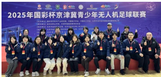
图-22 “国彩杯”裁判合照