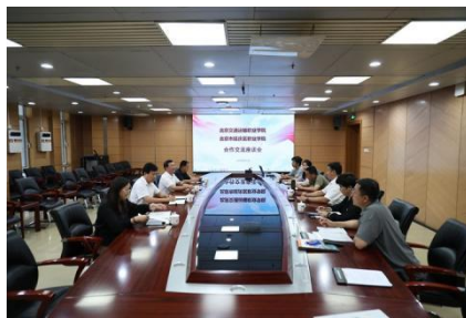
图—9 与北京交通运输职业学院合作办学交流会

职业学院汽车运用与维修专业与北京交通运输职业学院汽车技术检测专业开展“3+2”中高职衔接人才培养。两校共同制定人才培养方案，定期组织两校之间的教研活动、开展课题研究、教学资源 and 实训资源共享，以此共同促进教育教学改革。两校共同辅导学生参加技能大赛，形成“以赛促学、以赛促教”的培养机制。“3+2”衔接项目以体系贯通、课程体系深度融合、资源共享、共育竞赛能力等