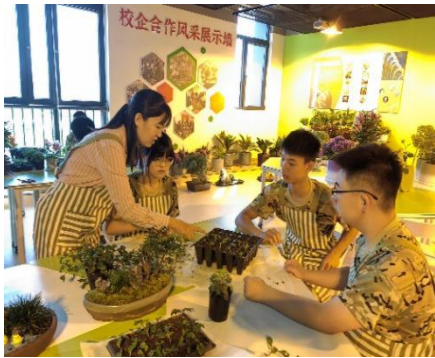
图—2 企业专家进课堂

职业学院园林技术专业围绕区域绿色发展大事，推进专业建设与区域经济紧密结合。与北京世园公园、北京名木成森古树名木养护工程有限公司等企业深度合作，通过企业文化进校园、企业技术进课堂、认知实习、工学交替、顶岗实习等形式，校企共同培育学生，为学生成才共建平台，为服务区域经济建设贡献力量。