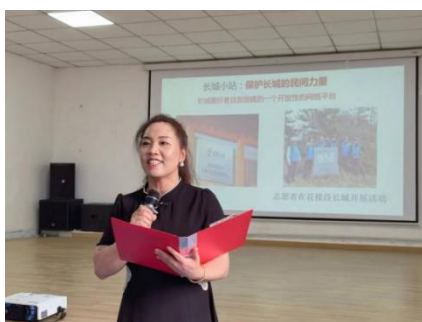
图—37 长城文化主题教育课程

将葫芦画手工艺作品推向市场促进农民增收 19 万元，让长城精神成为推动家乡发展的持久动力，增收致富的“金字招牌”。