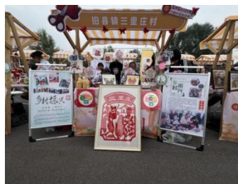
图-30 邀请专家助农调研图-31 开班授课助农开发产品图-32 助农产品在农民丰收节精彩亮相