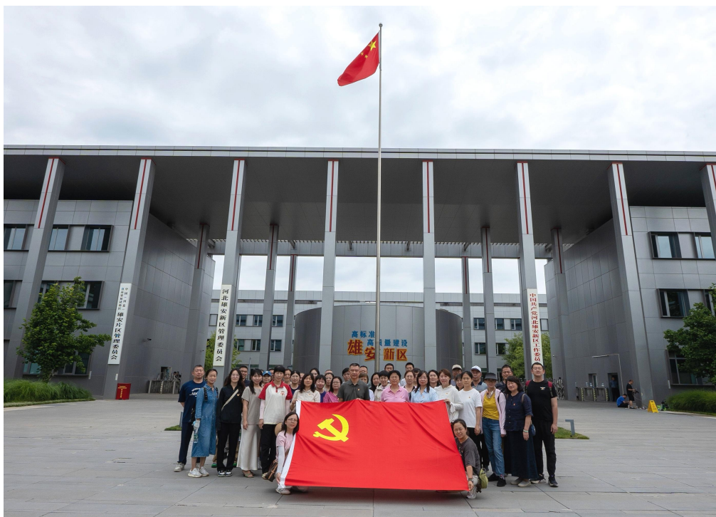
图 6-3 组织全体党员参观雄安新区