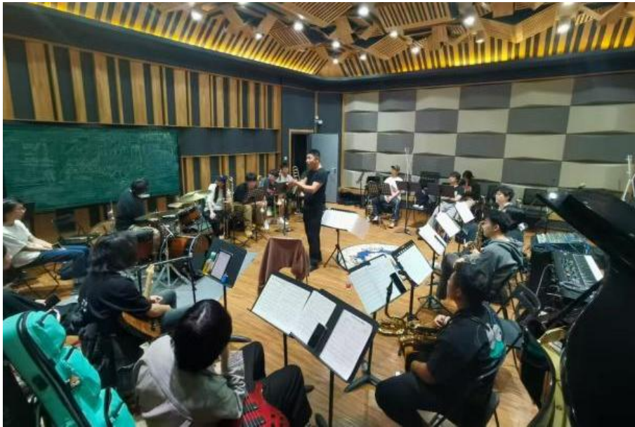
图 1-12 爵士乐工作坊课堂