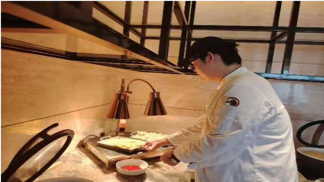
图 5-1 学生在希尔顿酒店实习

除了烹旅专业，学校其他各专业实习实践均在合作企业顺利推进。学生们通过在真实职业环境中的锤炼，有效提升了专业技能与综合职业素养，实现了从学习到应用、从生手到准职业人的重要跨越。