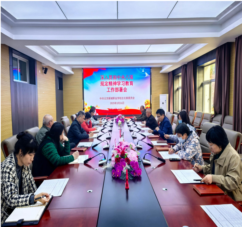
图 6-2 深入贯彻中央八项规定精神学习教育工作部署会