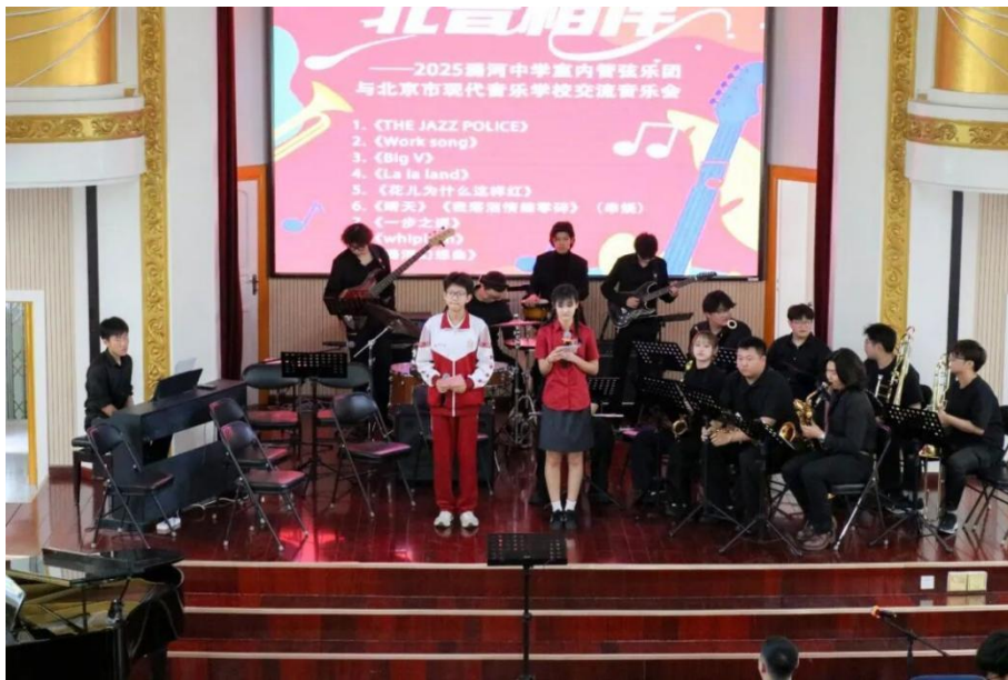
图 1-15 职普两校主持人主持交流音乐会

这场交流音乐会，不仅是一次音乐技艺的展示，更是两校学生心灵的交流与碰撞。通过音乐，他们跨越了学校的界限，共同创造了一段美好的回忆。在未来，两校在艺术教育领域将继续加强交流与合作，培养出更多优秀的艺术人才，让艺术的梦想在更多学生心中生根发芽，绽放出绚丽的光彩。