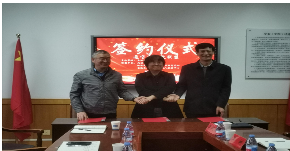
图 5-4 “通宝香”职教联盟签约现场

此次签约仪式标志着三校在职教领域开启深度联合的新征程。通过整合资源、优势互补,职教联盟将成为京津冀地区职业教育高质量发展的重要引擎,翻开京津冀职业教育发展的崭新篇章。三所学校将按照产业、行业、企业、职业与专业的“五业联动”大思路,共同搭建职业教育平台,打造职业教育综合体,探索三地在产教融合、校企合作、师资培训、课程建设、职教资源、联合招生、合作办学等方面的合作交流机制,推进通宝香三地职业教育与产业发展深度融合、校企深度合作、职业教育联动发展。