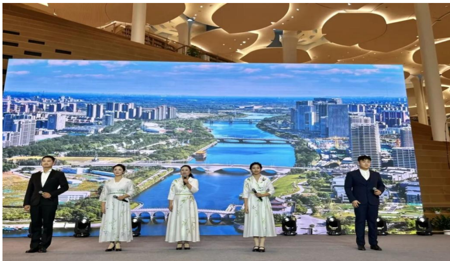
图 3-2 我校学生参加大运河文化阅读行展演

我校学子以朗诵的形式演绎运河古今风貌，既锤炼了专业技能，也直观彰显了学校“产学研创”教学成果。同时，这种年轻化表达为千年运河文化注入青春活力，创新了传统文化传承方式。作为扎根通州的高校，此次参与也是服务地方文化建设的举措，助力大运河文旅融合与文化带建设，为北京城市副中心文化软实力提升贡献了职业学校的力量。