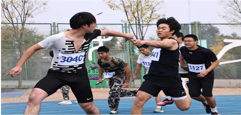
图 1-3 新城职业学校学生运动会

一场场赛事，不仅强健了学生体魄，更将规则意识、责任担当与集体精神深植于心，让体育育德的示范价值落地生根。