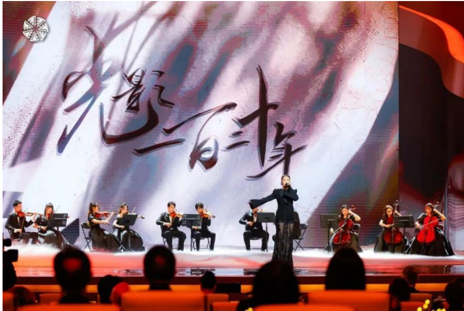
图 1-10 电影节开幕式演出现场