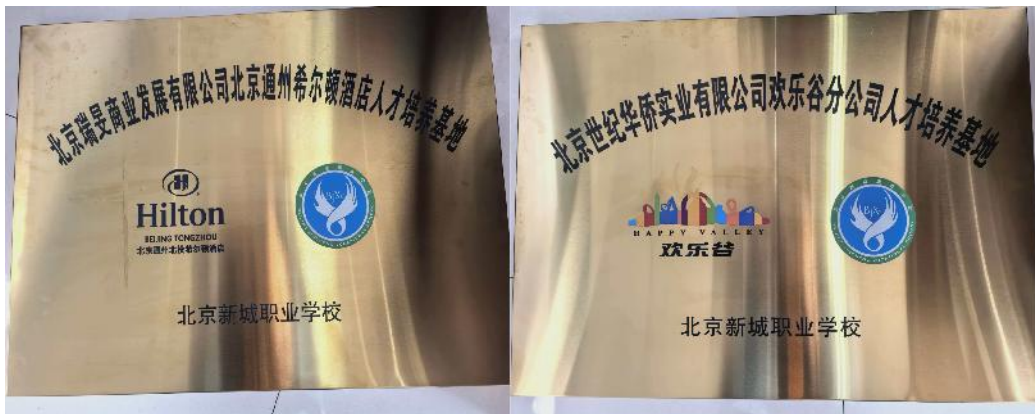
图 5-6 学校被授予“希尔顿酒店”人才培养基地、“北京欢乐谷”人才培养基地

引导区内职业院校立足区域产业发展需求，通过“高标准自建”与“深层次共建”双轮驱动，打造集教学、实训、生产、研发于一体的开放型区域产教融合实践中心，既支撑理实一体化教学，又发挥辐射引领作用，增强职业教育服务区域发展的能力。北京新城职业学校构建“校内共享实训基地+校外生产性实践中心”的实践平台格局：高标准自建舞美实训基地与汽车维修实训基地，其中舞美实训基地按比例还原专业剧场，配备国际主流设备，采用三大模块化教学模式；汽车维修实训基地创新“三分区工作坊+”混合式教学模式，培养出通武廊技能大赛获奖学生，其教学模式成为区域样板。深层次与行业龙头共建实践中心，与国家大剧院台湖舞美艺术中心合作打造实践中心，让学生参与真实项目实操；与北京欢乐谷共建娱乐设施实践中心，助力学生提升设备维护与故障诊断能力；2025 年与北投希尔顿酒店达成合作并挂牌“产教融合实习实训基地”，学生参与礼宾服务、峰会保障等实战工作，酒店定期反馈需求推动课程优化。北京市现代音乐学校搭建多元化开放实践平台，校内拥有 2 万余平米实训基地，设立“原创戏剧工作室”等创新载体；与兄弟院校共建跨校平台，联合举办音乐会；拓展校外实训基地，组织学生走进首都图书馆、社区养老中心等开展志愿服务，在真实场景中锤炼专业技能。