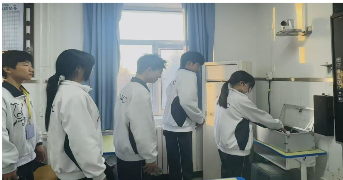
图 6-10 【行为养成】学生自觉有序存放手机