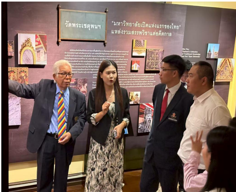
图 4-1 参观泰国国家教育展览馆

通过“安全筑基、教学赋能、语言搭桥”，培养兼具文化自信、国际视野与实践能力的复合型人才，为泰中民心相通与“一带一路”共建注入持久教育动力。