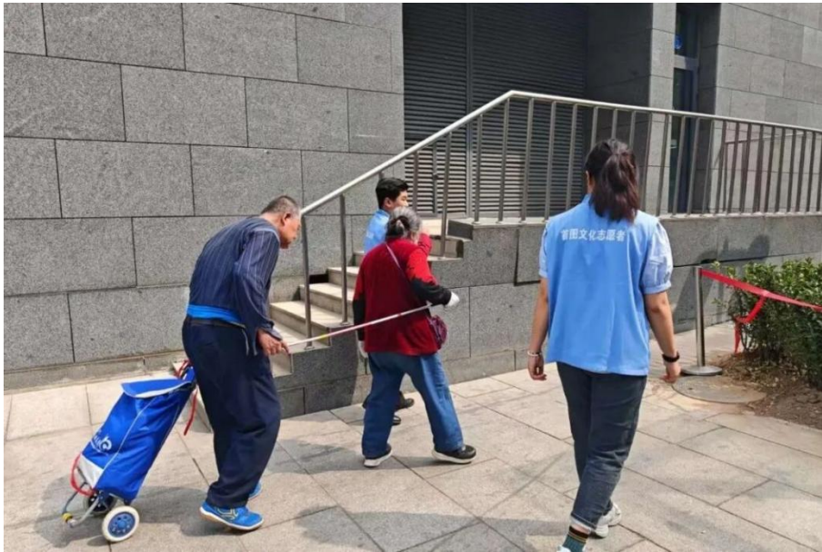
图 2-4 首图志愿者服务—为老人和盲人指引