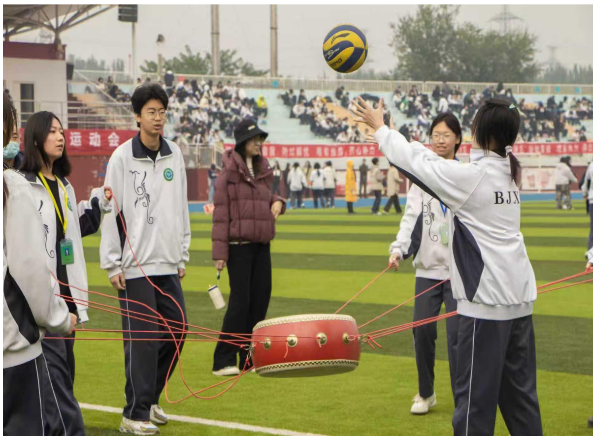
图 6-8 【团队协作】趣味运动会-同心鼓项目学生默契配合