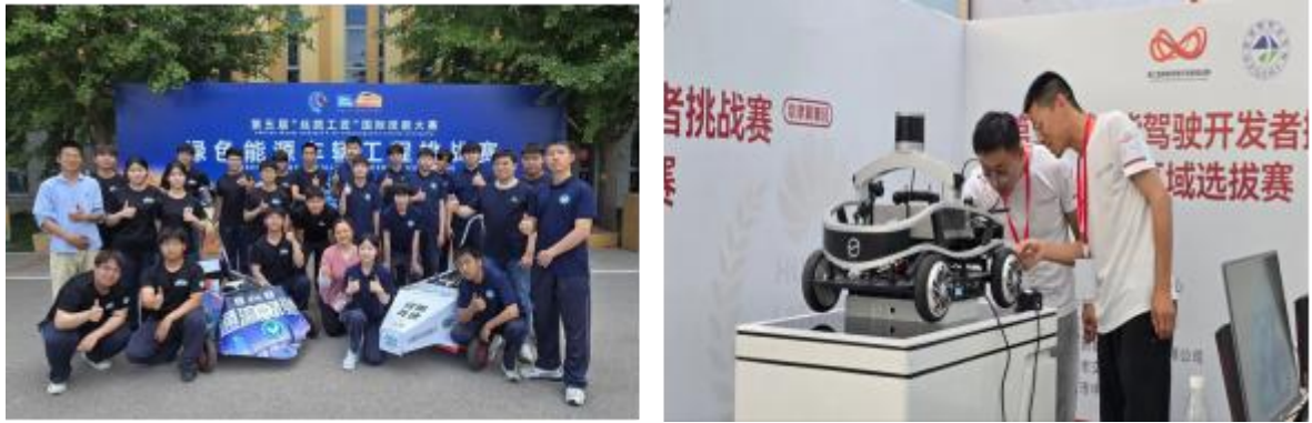
图 1-18 汽修团队参加第五届“丝路工匠”国际技能大赛