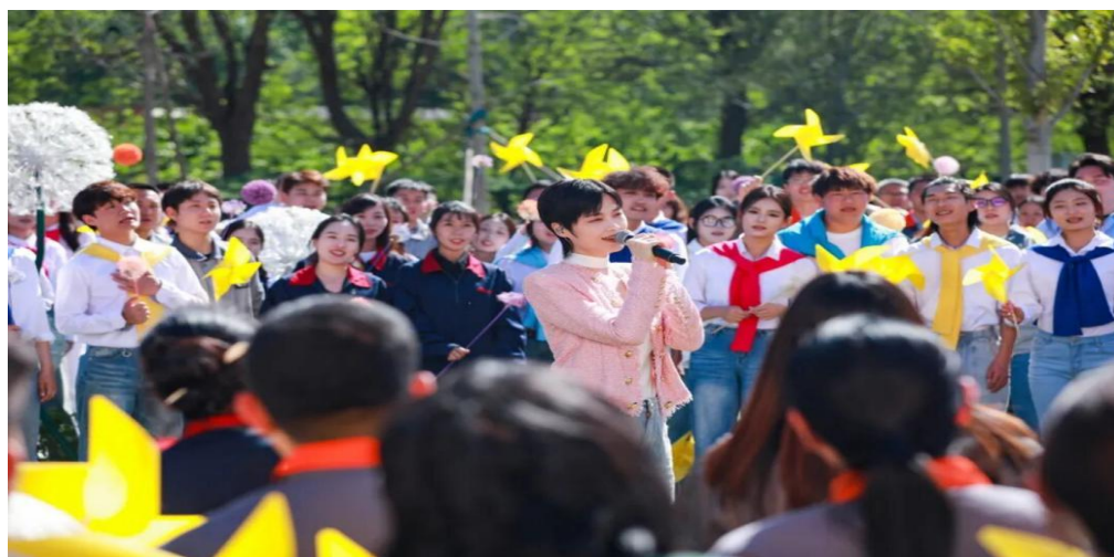
图 2-1 五一国际劳动节特别节目现场录制

北京市现代音乐学校受邀参与央视五一国际劳动节特别节目录制，组建 60 人演出团队，以兼具艺术感染力与时代温度的音乐、舞蹈作品，致敬一线劳动者。此次录制是学校艺术教育成果与行业需求精准对接的生动实践，通过央视国家级平台，充分展现了我校学生的专业素养与责任担当。同时，学校以节目标注制作为实践载体，深化产教融合，为文化演艺行业输送了具备实战能力的优质人才，助力弘扬劳动精神，彰显了民办艺术院校服务社会、赋能行业发展的积极作用。