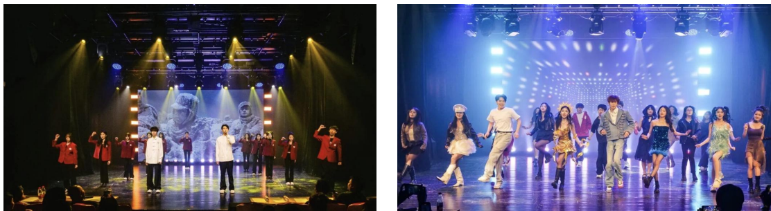
图 1-7 “乘着歌声的翅膀”歌舞晚会现场

这场汇聚声乐、舞蹈、表演、音乐剧专业学生的综合歌舞晚会，为双方专业群建设提供了优质实战载体。一方面检验专业群实战教学与分层训练效果，助力教师反向优化跨专业实训重点；另一方面以多专业融合演出打破学科壁垒，推动一体化课程开发，依托校际合作实现资源互通共享，还能根据学生舞台表现细化专业群个性化培养方案，深挖学生艺术潜力，让专业群教学更具实践力、协同力与专业性。