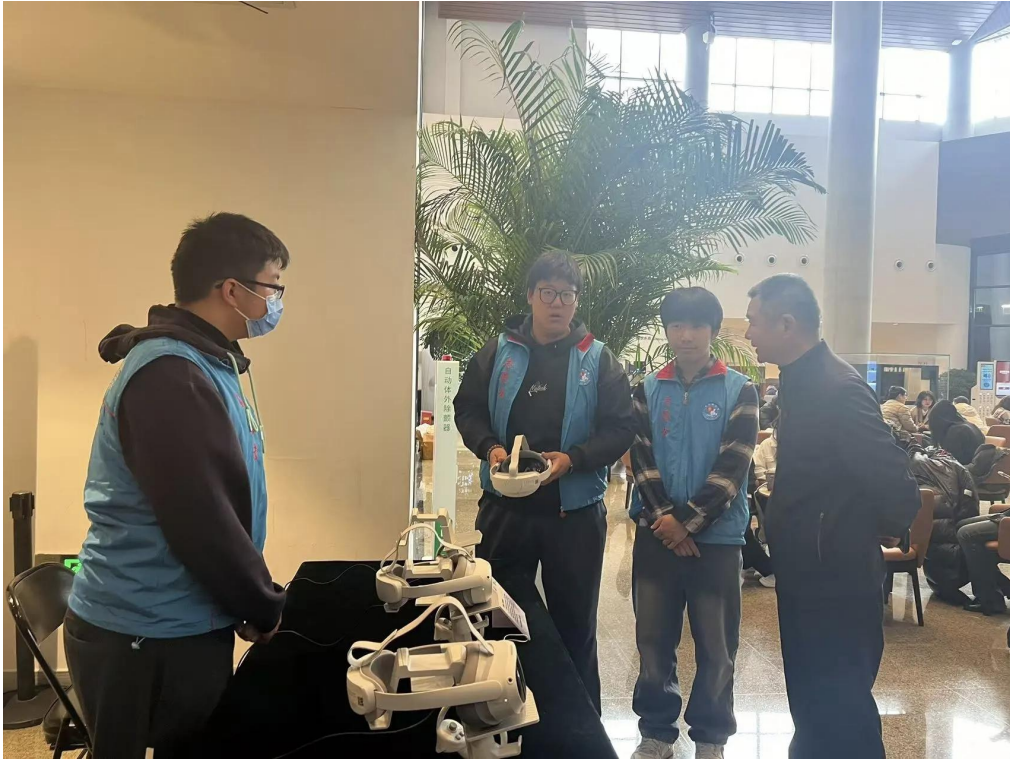
图 2-3 学生在台湖舞美艺术中心参加志愿服务