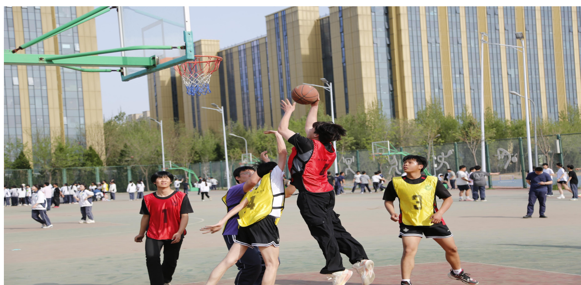
图 6-6 【竞技风采】校园篮球争霸赛—球员精彩对抗瞬间

为破解中职学校体育工作中存在的“学生参与度低”与“育人功能单一”的普遍难题，北京新城职业学校以教育部体育育人新政为指引，积极探索，创新构建了“全员参与+特长培养”双轨并进的体育育人新模式。学校系统设计“趣味运动会”、“羽毛球联赛”、“篮球争霸赛”三级赛事体系，其中趣味运动会设置拔河、同心鼓等集体项目，实现学生 100%全员参与，重在激发兴趣、凝聚团队；羽毛球与篮球联赛则采用分级淘汰制，聚焦竞技特长培养，实现“培优”与“竞技”目标。为固化育人成效，学校将赛事参与及表现纳入学生综合素质评价，形成制度牵引；同时通过公众号、宣传栏等载体开展全景宣传，积极塑造“爱运动、强体魄、育品德”的校园体育文化。经过一学年实践，该模式成效显著：学生运动兴趣与体质普遍增强，在活动中强化了协作、规则、拼搏等素养；构建“全员参与+特长培养”体育育人模式，为中职校落实体育新政提供了可复制、可推广的实践范本，实现体育与德育、智育协同赋能。