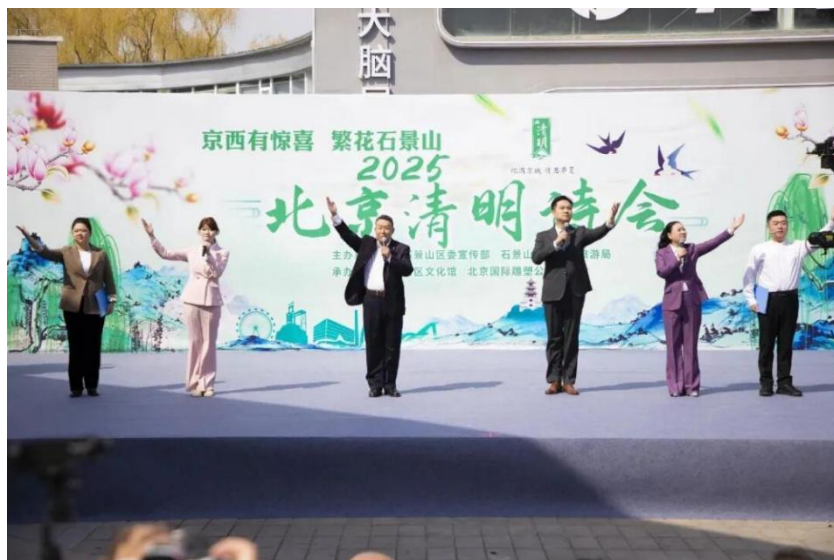
图 2-7 学生参加石景山区清明诗会