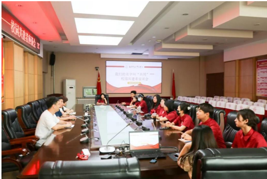
图 6-5 学生代表参与座谈会

学校举办《我们的名字叫“共同”-校园共建者座谈会》，在党支部统筹引领下，学生代表与校领导、党员教师代表面对面交流，围绕专业课时优化、文化课教学创新、教学设施改善等 12 项议题建言献策。校领导对学生提出的“延长专业排练时长”“改善教室音响效果”等合理建议现场回应，其中教室音响升级问题 24 小时内完成解决方案制定，一周内落地见效。此次座谈会搭建了师生民主沟通的坚实桥梁，彰显了党建引领下“以生为本”的治理理念，为学校高质量发展凝聚了广泛共识与强大合力。