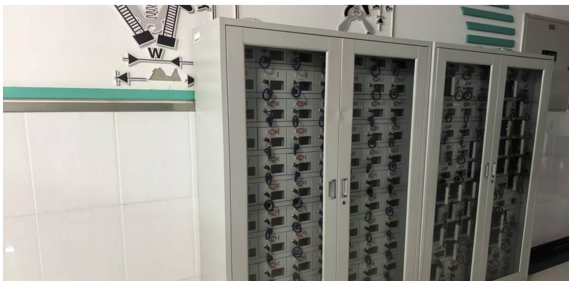
图 6-9 【设施保障】实训楼内整齐划一的手机存储柜