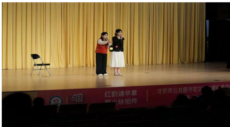
图 3-5 我校学生在 2025 年北京市诵读大赛朗诵《灯祭》

学生参加“红韵诵华章 薪火咏相传”2025 年北京市诵读大赛，是学校红色文化传承成效的直观彰显，为质量年报相关板块提供了鲜活实践支撑。活动以实践育人为核心，让学子在红色经典诵读中沉浸式感悟革命精神与家国情怀，实现红色基因的内化传承，践行立德树人根本任务。同时打破课堂局限，将红色文化与语言艺术实践深度融合，创新了红色教育载体，丰富了学校红色育人体系内涵。学子在市级赛事中的表现，既展现了学校红色文化教育的扎实实效，也扩大了红色育人品牌的影响力，全面印证了学校红色文化传承工作的实践价值。