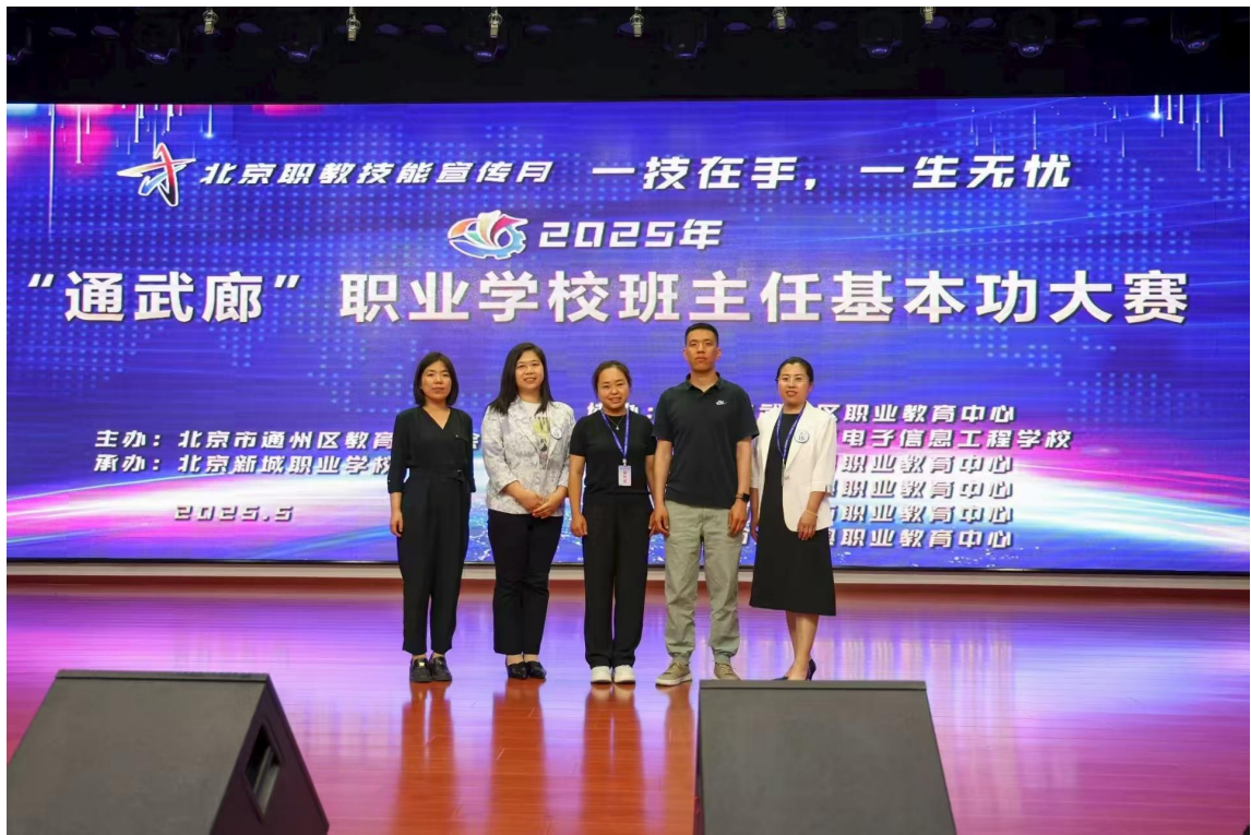
图 6-11 【以赛赋能】“通武廊”班主任基本功大赛现场

通过“三环”体系的持续赋能，学校班主任队伍的专业素养与实战能力得到系统性锤炼，一支“能打硬仗、善育新人”的班主任劲旅正成为推动学校德育工作高质量发展的坚实支柱。