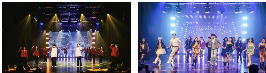
图 1-9 “乘着歌声的翅膀”歌舞晚会现场

这场汇聚声乐、舞蹈、表演、音乐剧专业学生的综合歌舞晚会，为双方专业群建设提供了优质实战载体。一方面检验专业群实战教学与分层训练效果，助力教师反向优化跨专业实训重点；另一方面以多专业融合演出打破学科壁垒，推动一体化课程开发，依托校际合作实现资源互通共享，还能根据学生舞台表现细化专业群个性化培养方案，深挖学生艺术潜力，让专业群教学更具实践力、协同力与专业性。