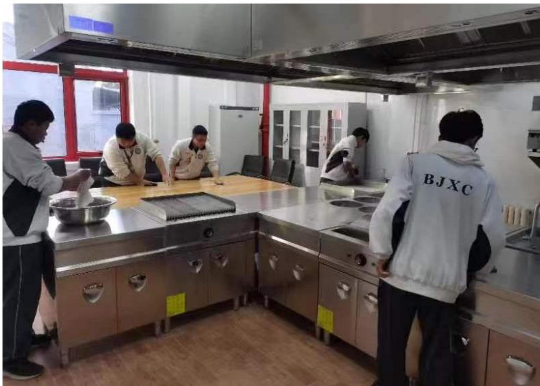
图 1-1 中西餐专业学生参与劳动实践