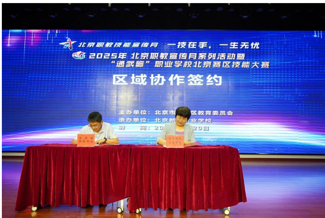
图 2-5 北京新城职业学校与张北县职教中心签订教育区域合作协议