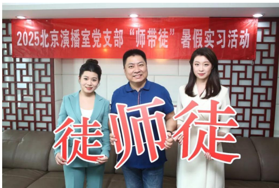
图 5-2 “师带徒” 实习师徒合影