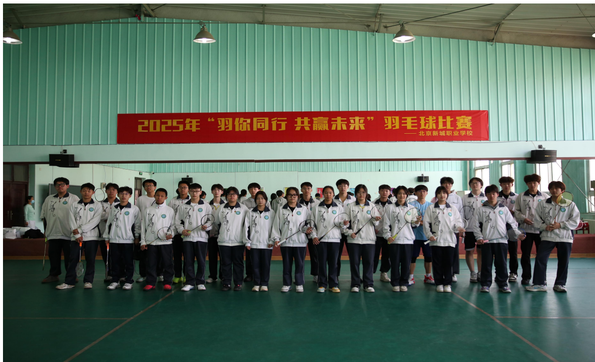
图 6-7 【全员风采】羽毛球联赛参赛队员精神饱满合影