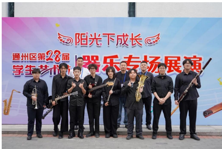
图 1-13 艺术节器乐专场赛后合影