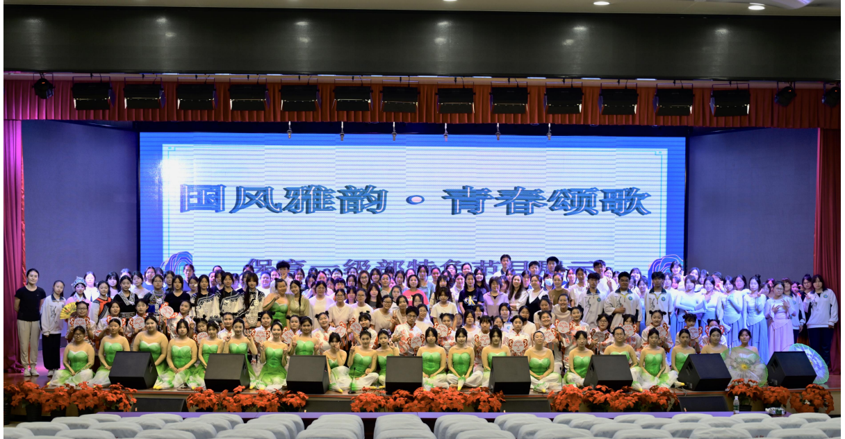
图 3-1 北京新城职业学校开展“国风雅韵 青春颂歌”主题汇演活动

将中华优秀传统文化的神韵与魅力展现得淋漓尽致。活动既为学生搭建了专业技能展示平台，锤炼了舞台表现、活动组织等实操能力，又让大家在沉浸式体验中感悟传统文化精髓，实现文化育人与专业赋能的双向奔赴。