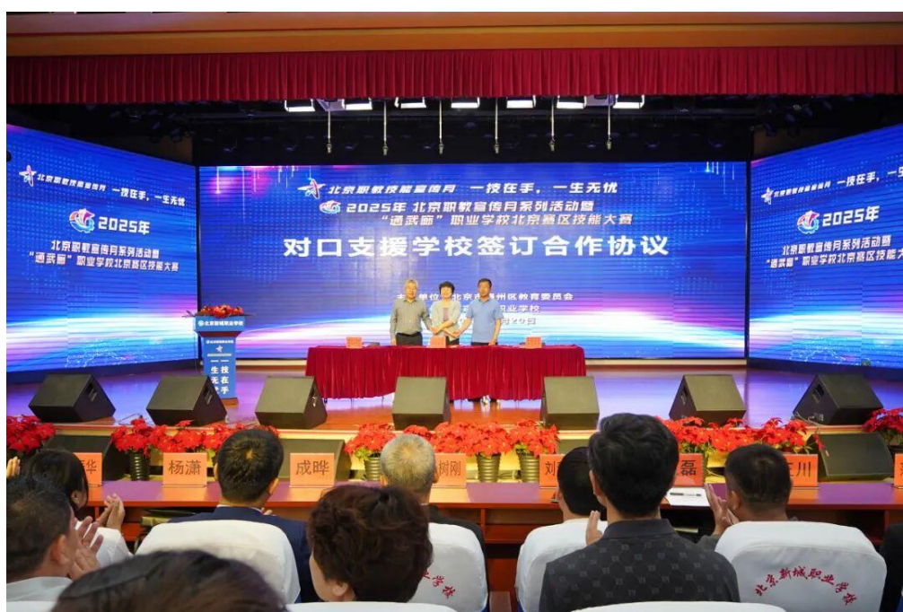
图 2-6 北京新城职业学校与奈曼旗、翁牛特旗职业院校签订对口支援合作协议