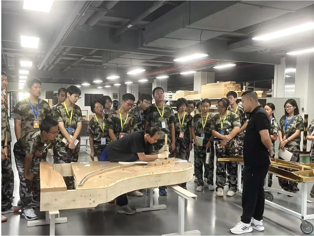
图 1-6 学生走进星海钢琴集团实践学习