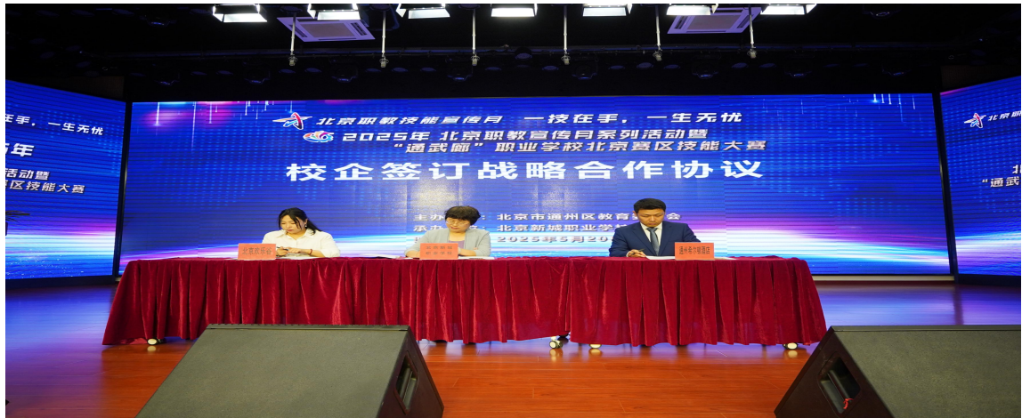
图 2-2 与北投希尔顿酒店签署合作协议

学校与北投希尔顿酒店签署合作协议，为中西餐烹饪、旅游服务与管理专业学生搭建实训平台。企业将参与课程设计，提供餐饮服务、酒店管理等实操场景和技术指导，学生可在真实岗位中锤炼烹饪技艺、服务流程等技能，既为酒店储备了适配的技能型人才，也通过学生实训过程中的实操服务，为企业日常运营提供辅助支持。