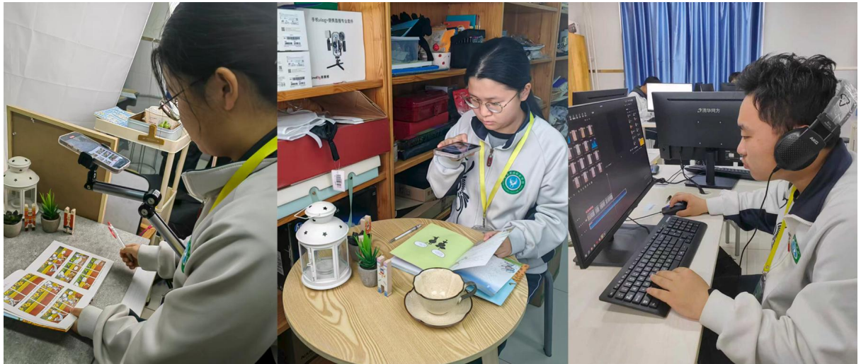
图 1-16 跨专业学生团队实战运营“剪阅荐书社”抖音账号