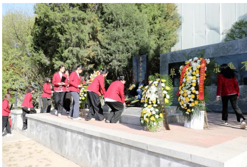
图 1-5 北音师生革命烈士陵园祭扫活动

现代音乐学校组织师生赴通州区革命烈士陵园开展沉浸式清明祭扫活动，通过敬献花篮、集体默哀、诗朗诵《缅怀先烈》、重温入团誓词等环节，让学生在触摸历史、缅怀先烈中感悟民族脊梁的精神力量。校领导以“学艺报国”为主题寄语学子，引导学生将爱国情怀转化为专业精进的不竭动力。活动打破传统红色教育模式，以具象化体验、情感化表达筑牢学生理想信念根基，让爱国主义精神在实践中生根发芽，成为艺术青年成长的精神底色。