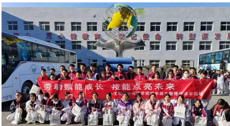
【图 1-1-3】“社区大课堂”师生留影

(4) 每学期开设社会大课堂实践活动，鼓励学生参与创新、创意、发明等创造性实践，营造具有中职特色的教育文化氛围，着力培养学生劳动中的科学态度、规范意识、效率观念与创新精神。2025 年 3 月 28 日，首师附中实验学校 140 名初二学生走进我校参与社会大课堂活动。此次活动不仅深化了两校间的交流联系，更让更多同学直观感受到职业教育的独特魅力。