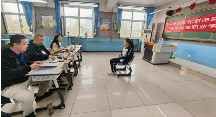
【图 1-5-1】房山区职业学校与高职院校共同组织学生转段考核

程性考核与常态化交流。深度协同确保了培养质量的一致性与可追溯性，为学生后续高职阶段的专业深化和可持续发展奠定了坚实基础，同时也赢得了合作院校的高度信任，为构建长期、稳定、互信的合作关系提供了坚实保障。