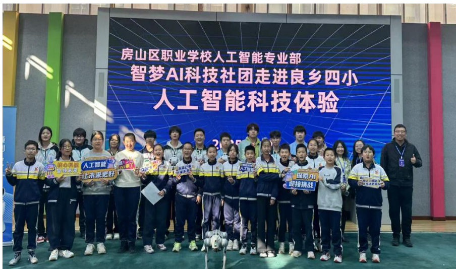
【图 1-6-1】房山区职业学校学生社团走进中小学校园科技节开展科技体验活动

学校积极探索职业教育与普通教育相互融通。面向区域内中小学，利用学校专业资源和实训基地，开放提供劳动教育、职业体验、技术技能实践等综合实践活动课程服务，助力中小学生学习综合素质提升。连续多年组织师生团队为房山区中小学生学习科技节、体育统测、中考体育等大型活动提供专业服务与保障，展示了职业教育的实践价值和社会担当。2025年深入中小学校参与校园科技节，开展人工智能体验项目服务学生1500余人次。代表房山区参加第43届北京学生科技节闭幕式暨科技教育成果展示活动，与会领导和嘉宾对学生扎实的技术应用能力给予高度肯定和称赞。