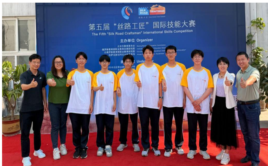
【图 1-8-1】房山区职业学校学生参加第五届丝路工匠国际技能大赛

房山区职业学校无人机操控与维护专业围绕电力巡检、农业植保等真实岗位任务，开发模块化课程，并将世赛、丝路工匠大赛的技术标准融入教学。学校建设竞赛级训练环境，开展项目化实战训练，重点培养学生精密操作与创新应用能力。在第五届丝路工匠国际技能大赛中，该专业两支队伍荣获国赛第三名，体现了“以岗位导课程、以大赛提标准、以证书验成效”培养路径的有效性，切实达成“以赛促教、以赛促学”目标，提升了学生职业竞争力。