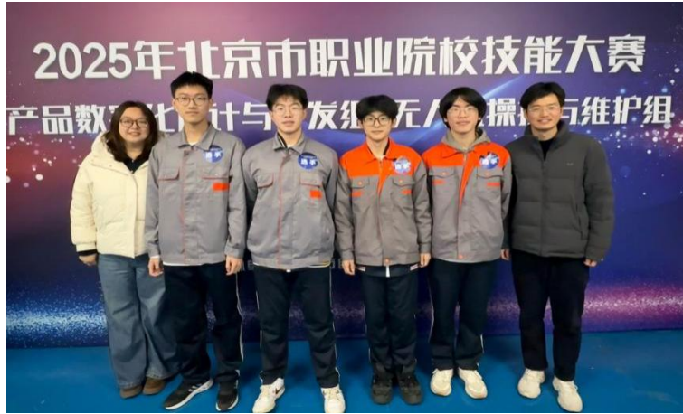
【图 3-2-1】学生参加 2025 职业院校技能大赛

与教学内容，确保教学与实际职业需求高度契合，让学生所学知识能够直接应用于未来的职业岗位，提高学生的就业竞争力与职业发展潜力。