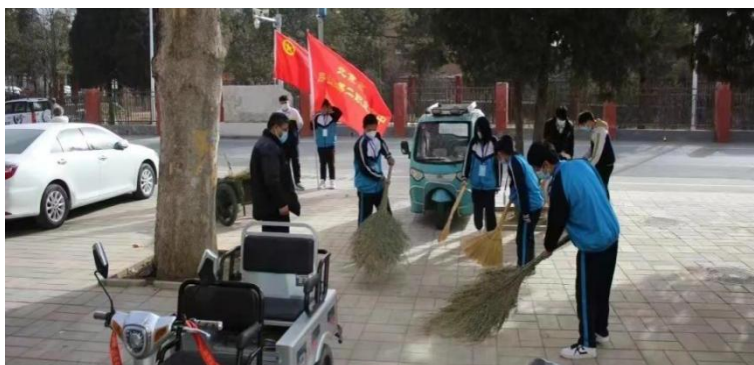
【图 1-1-2】学生参加“志愿者”活动

(3) 定期组织学生参与校内外公益实践活动（如走进社区宣传垃圾分类知识、投身志愿者服务、前往敬老院开展尊老敬老活动等），厚植社会责任感。