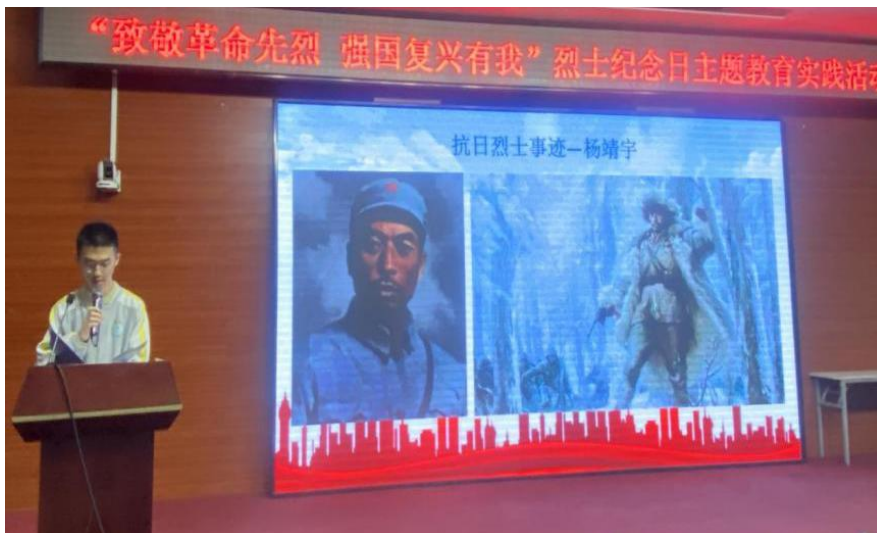
【图 3-3-2】“致敬革命先烈 强国复兴有我”主题教育