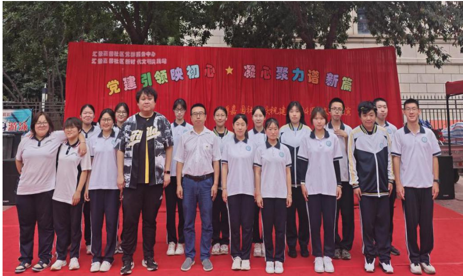
【图 2-3-1】房山区职业学校师生融入社区联合开展庆“七一”汇演活动