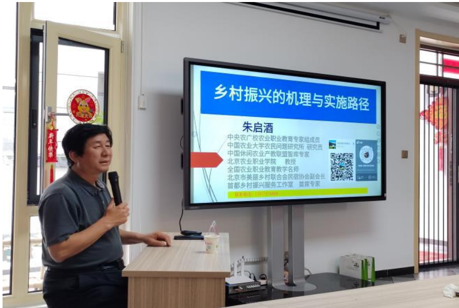
【图 2-2-1】朱启酒教授讲座

等系列特色培训项目。该项目不仅教授乡村品牌打造、文旅项目策划等实用技能，更注重培育学员的市场思维、运营能力与可持续发展理念，致力于培养一批懂技术、善经营、会管理的乡村本土人才。这些举措有效提升了参训农民的职业素养与增收能力，为激活乡村内生动力、促进农业农村现代化提供了有力的智力支持和技能支撑，是学校践行职业教育社会责任、赋能乡村全面振兴的生动实践。