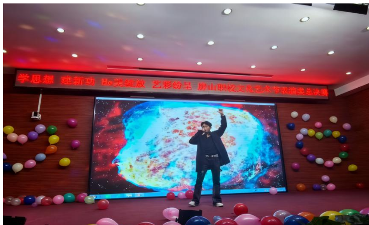
【图 1-1-4】艺术节—歌手大赛

学校将践行社会主义核心价值观深度融入学生社团活动，为提升学生综合素养搭建广阔平台，使之成为学校德育教育中一道亮丽的风景线与鲜明特色。结合学生的专业背景、特长优势与兴趣爱好，学校陆续组建了健美操社、礼仪之花社、青春之声广播站、美舞团、篮球社、足球社等多元化社团。通过丰富多彩的社团活动，学生找到了属于自己的“燃点”，既展现了中职学生的职业素养，又彰显了专业技能培养的丰硕成果。这些充满活力的社团活动，切实助力学生实现全面、健康、可持续的成长与发展。