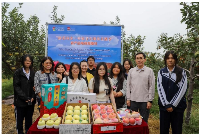
图 14 新加坡工艺教育局师生与昌平职业学校学生共同开展助农直播项目实践

学校持续深化与新加坡工艺教育局的合作，以数字电商为重要交流实践抓手，着力推动跨境电商人才联合培养和产教融合实践。2025 年 9 月 23 日-27 日，学校与 ITE 成功举办“新芯向农·中新青年助农直播季”主题教学交流活动。学校充分发挥在数字电商与现代农业领域的资源优势，设计实施了涵盖“理论复盘-方案优化-脚本打磨-实战演练-总结提升”的全链条实训课程。活动期间，两校学生混合编组，深入昌平区智慧农业合作社，协同开展特色农产品跨境直播推广实战。ITE 学生引入东南亚市场视角，昌平职业学校学生阐释产品文化内涵，双方携手共同开展助农直播，获超万次互动点赞，实现了专业技能锤炼与跨文化交际能力的双提升。此次合