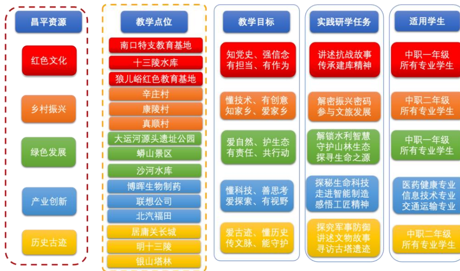
图 1 昌平职业学校绘制的思政实践教学昌平资源图谱