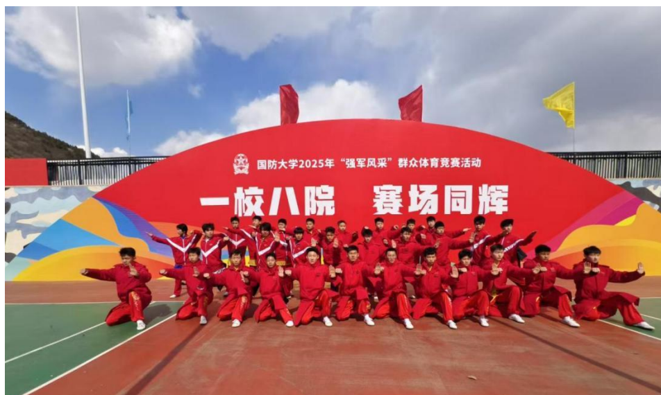
图 12 北京少林武校学生在中国人民解放军国防大学表演

北京少林武术学校充分发挥自身特色，积极参加北京市各类武术比赛和武术表演，多次受邀参加中央广播电视台、北京市、各区级大型活动演出，在多元平台上展现中华武术的魅力。2025年，学校选派学生团体在昌平区“居庸山月”中秋晚会、石景山区秋运动盛会、中国人民解放军国防大学校运会等大型文艺活动上进行武术表演，以精湛技艺和昂扬风貌赢得广泛赞誉。这些演