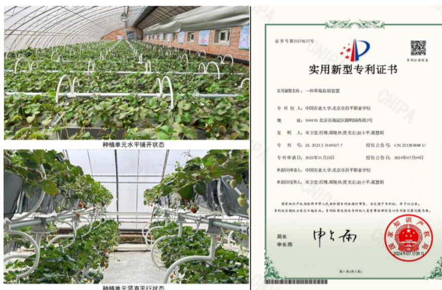
图 6 昌平职业学校与中国农业大学合作研发的专利在昌平草莓园应用推广

昌平职业学校与中国农业大学共建的教授工作站，聚焦昌平草莓产业发展痛点，深化“校企合作”协同研发机制，用技术为昌平草莓产业高质量发展注入职教动能。一是科教协同攻关核心技术，联合中国农大组建“教授+硕博士+专业教师+学生”的研发团队，紧紧围绕农业三率提升等关键问题开展专项研究，形成“一种草莓栽培装置”等实用新型专利4项。二是研发团队攻克空间利用与高产平衡难题，将专利进行技术转化。其中，“动态叠放式栽培槽”因低成本、高适配性优势，被纳入昌平区农业补贴政策，成为区域设施农业升级推荐装备；该专利技术在百千工程示范村辛庄村的辛庄草莓产业园、康寿草莓合作社规模化推广应用，使土地利用率提升50%以上，单棚产值增加2万元，有效破解了传统栽培“空间受限、效益不高”的难题。