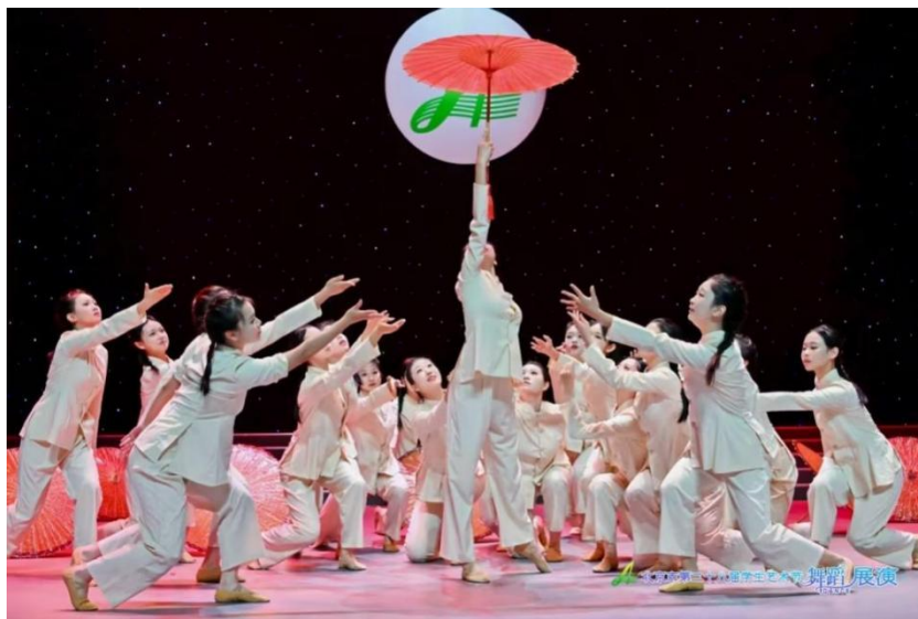
图 2 昌平职业学校舞蹈团在北京市第二十八届学生艺术节上

昌平职业学校积极落实《北京市全面实施学校美育浸润行动工作方案》，通过艺术课程、美育展演、社团活动、环境创设等途径，推进美育浸润。学校积极推进校级舞蹈团建设，整合艺术教师力量，精心编排成品剧目，打磨艺术精品，探索构建“技能训练+素养提升+实践展示”三位一体培养模式，让舞蹈成为学生展示自信的重要载体。舞蹈团每周固定开展基本功训练与多元舞种教学，系统提升学生身体协调性、表演技巧与艺术审美；组织学生参与各级各类美育展演活动，以赛促练、以演提质，提升学生舞蹈技能与审美素养；积极搭建美育实践平台，在校庆、学校教育教学成果展演、春秋季节运动会开幕式等活动中进行演出，呈现精彩舞蹈节目。学生集体展演舞蹈作品《船歌》在北京市第二十八届学生艺术节中获金奖，6 名学生在区级展演中获个人单项 5 金 1 银。