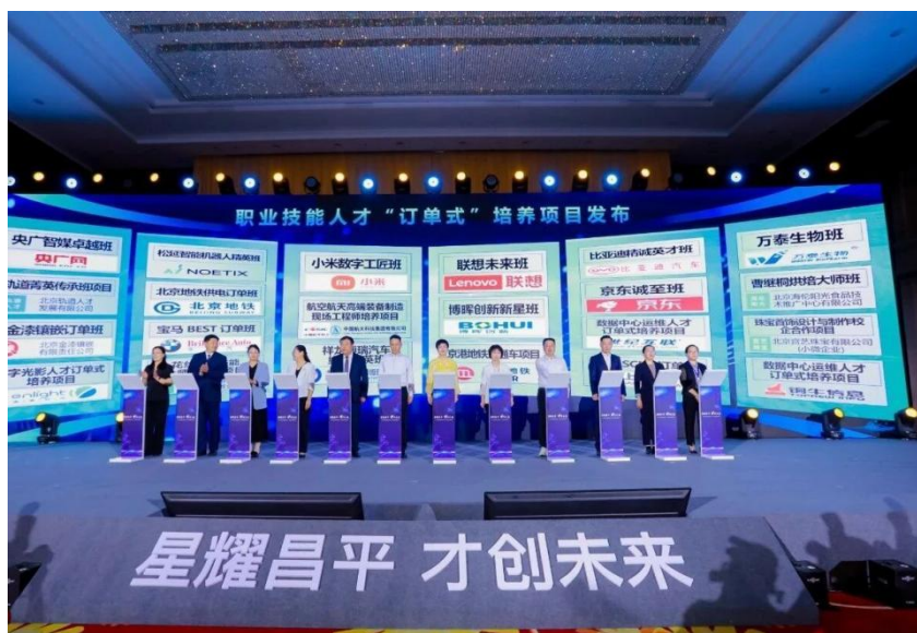
图 8 2025 昌平区教育科技人才一体化政策项目启动 22 个订单式人才培养方案

校企双方聚焦生产需求，联合开展“订单式”人才培养。校企合作开展的定向人才培养模式。校企双方共同制定培养方案，共建课程资源与师资队伍，组建特定订单班级实施教学，实现教学内容与岗位需求精准对接，以工学结合为特色，引入企业真实生产案例开展实训，有效缩短学生上岗适应期。学生考核合格后可进入企业定向就业，推动教育链、人才链与产业链、创新链深度融合。这一创新实践不仅为企业持续输送高素质技术技能人才，有效缓解企业“用工难”问题，还为优化区域营商环境、促进产业升级提供了坚实的技能人才支撑，进一步增强了昌平职业教育的吸引力与竞争力，助力打造具有区域特色的职业教育品牌。