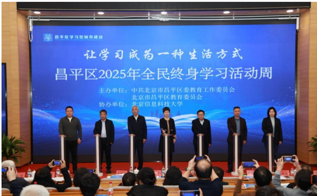
图 10 昌平区 2025 全民终身学习活动周启动仪式

昌平区在成功创建“北京市学习型城市示范区”基础上，持续开展“后示范区时代”建设工作。一是 专家研讨，明确方向 。组织相关委办局、镇街和职成教育系统召开“学习型城市示范区建设工作研讨会”，特邀北京市学习型城市示范区评估专家组组长吴晓川作《持续推进学习型城市示范区建设的策略和方法》主题讲座，委办局各成员单位交流研讨，明确后示范区时代的工作方向和重点，形成以依学治理推进学习型昌平建设，助力区域高质量发展的共识。二是 依托项目，科学规划 。科学研制 2025 年学习型城区建设的实施项目，包括：35 个社区（村）培训、6 个典型社区文化建设、高素质农民培训、老年教育培训、终身学习宣传月活动等 8 项内容。开设昌平区村播与乡村网红高素质农民培训班、“建设乡村实习项目”班，助力乡村振兴。2 篇案例入选 2025 年北京市职业学校社会服务典型案例集。三是 推进实施，突出成效 。组织编写《非遗剪纸》《亲子面点》两门课程校本教材，社区（村）培训、高素质农民培训、老年教育、农民教育等累计逾 3.4 万人次，培训课程内容包含健身操、面点、国画、剪纸、阳台种植、手工编制等。开展老年学分银行试点培训。围绕医养康养、传统文化等，建设 4 门培训课程，培训 312 人次。四是 培育典型，示范引领 。举办昌平区第二十一届全民终身学习活动周开幕式，激发广大市民的学习热情，大力营造“人人皆学、处处能学、时时可学”的良好氛围，经过广泛动员、组织申报、培育指导，昌平区共有 4 人被评选为首都市民学习之星。进一步推动全民终身学习体系建设，提升城乡市民的综合素质。