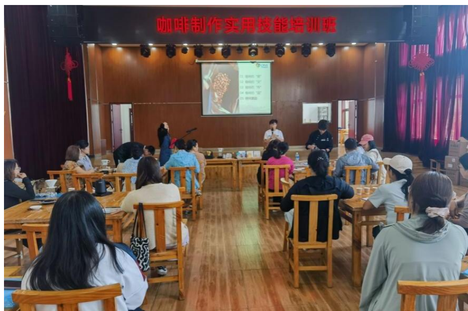
图 9 昌平职业学校举办咖啡制作实用技能培训班

昌平职业学校围绕昌平区兴寿镇文旅农融合发展定位，依托与辛庄村共建的科技慧民工作站，面向该镇辛庄、西新城等 10 个村 25 名山区劳动力，举办咖啡制作实用技能培训班。学校组建由咖啡行业专家与专业教师构成的教学团队，精心设计覆盖咖啡基础知识、产地品鉴、手冲与虹吸技术、销售运营、拉花咖啡制作的系列化课程，打破传统技能教学模式，创新融入乡村旅游场景化应用元素，让技能培训与区域产业生态深度契合，提升参训人员经营理念和咖啡制作技能，助力村民在现代服务业中找到差异化发展路径，为该镇“咖啡+乡村”新文旅业态蓄力赋能。