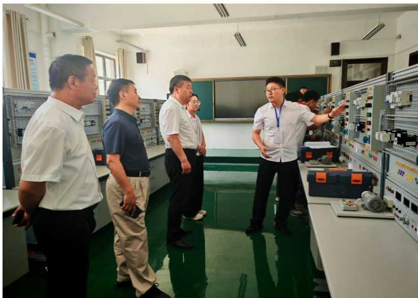
图 11 昌平职业学校到襄垣县职业技术学校开展帮扶活动

为深化落实北京市昌平区教育委员会、山西省襄垣县教育局《共同推进两地教育对口合作框架协议》，昌平职业学校与襄垣县职业技术学校建立深度合作关系，加强两校互动，形成“经验输出+共建共享+精准赋能”帮扶模式，全方位助推该校办学质量提升。昌平职业学校组建由教学管理骨干、专业带头人组成的帮扶团队，输出学校办学理念与专业建设经验；聚焦当地支柱产业需求，共建特色专业教学标准，共享优质课程资源与实训教学方案，助力襄垣职校优化专业布局；以师资培训为重点，通过专题讲座、名师示范课、跟岗学习等形式，更新当地教师教育教学理念，