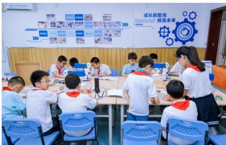
图 5 指导天通苑学校智能工匠社团学生活动

昌平职业学校携手北方天途航空技术发展（北京）有限公司、联想教育科技（北京）有限公司、深圳市爱创科技教育有限公司，与昌平区天通苑学校合作，探索校校企合作推进职普融通。该项目将企业真实设备与职业环境等优质产教融合资源引入中小学，精准对接天通苑学校需求，