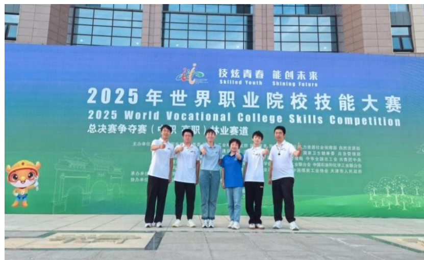
图7 智慧农业系学生团队获2025年世界职业院校技能大赛总决赛争夺赛（中职）林业赛道金奖

学校智慧农业系在2025年世界职业院校技能大赛总决赛争夺赛林业赛道中，取得1金1银的好成绩。该系依托都市型现代农业产教联合体，积极整合政、校、企、社资源，针对产业痛点和实际生产问题，实施项目教学，开展科研攻关，为企业、农户解决技术难题。为做好世界职业院校技能大赛参赛工作，该系组建了多学科、跨专业的校企双师团队，为参赛学生精准制定训练计划，突出技术实操、应急处理、团队协作等关键能力培养。参赛团队认真研究比赛标准，从实际生产中提炼参赛项目。针对白粉病危害榛子的痛点问题，制定了“数智检测+绿色防控”的综