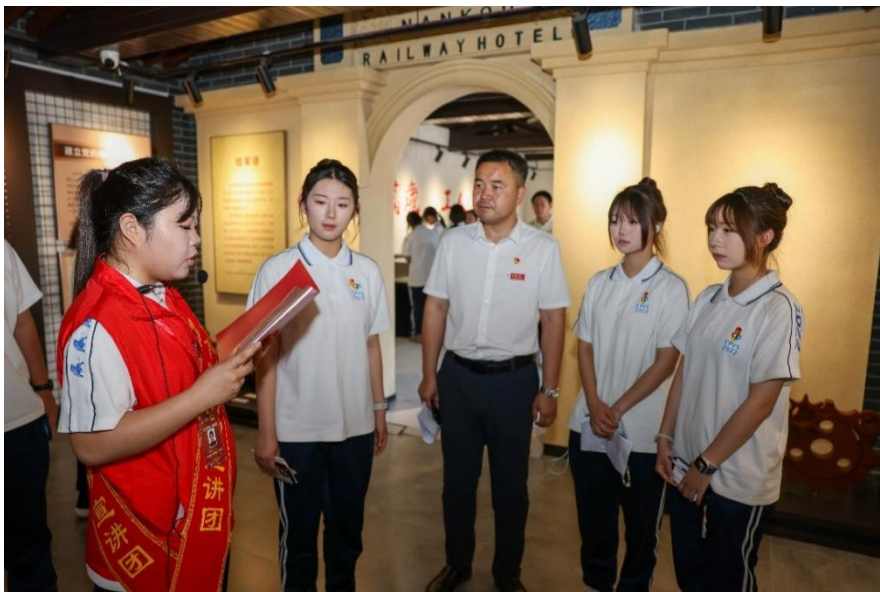
图 13 昌平职业学校师生参观中共南口特别支部纪念馆

昌平职业学校系统谋划实施“一条主线、两个阵地”，打造“红+专”研学品牌，推进红色文化传承与专业认同培育深度融合。明确“一条主线”，即“升旗仪式—党史学习—专业拓展”，构建分层递进的红色研学框架，组织学生到天安门广场观摩升旗仪式，开展爱国主义教育；组织学生走进中国共产党历史展览馆等爱国主义教育基地，在沉浸式参观、专题讲解和集体宣誓中，坚定理想信念，厚植家国情怀。用好“两个阵地”，：一是依托天安门广场、北大红楼等红色场馆打造理想信念教育阵地，开展长征精神、革命传统等专题学习；二是结合专业特色，走进昌平