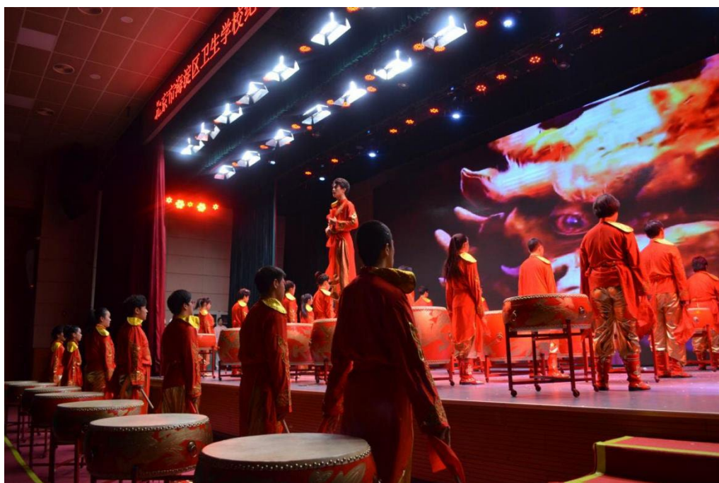
图 1-1 战鼓社团汇报演出《龙的传人》

精彩纷呈的视听盛宴，更是一次深刻的爱国主义教育。话剧《纪念一二·九运动》、战鼓《龙的传人》、合唱《我爱你中国》、诗朗诵《少年心怀热忱·守望民族未来》等节目，将爱国主义教育融入其中，潜移默化地影响着学生的价值观，让红色基因在新时代的中职学子心中生根发芽，激励着他们以先辈为榜样，胸怀祖国，在未来的道路上，为中华民族伟大复兴贡献自己的力量，让红色血脉在青春的征程中永远流淌。