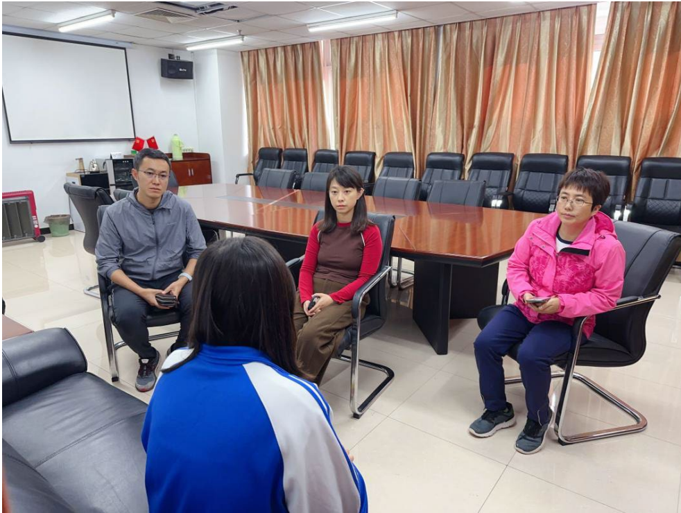
图 2-1 校企合作，助力困难学子腾飞