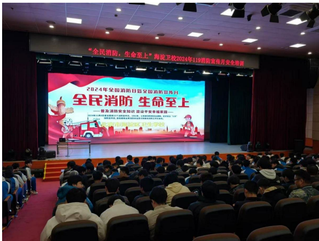
图 6-2 119 消防宣传月安全培训讲座

学校紧密围绕北京市关于消防安全工作的统一部署，全面推行北京市消防一体化综合监管服务系统，致力于构建安全稳定的校园环境。首先，北京市消防总队通过系统，对学校实现了中控室值班人员的实时点名，确保双人值守制度的严格执行，提高中控室的应急响应能力，有效保障校园消防安全的实时监控和事故处理的及时性。其次，学校借助系统对校园内的消防设施进行全面高效检查，及时发现并上报安全隐患，确保问题得到迅速整改。通过建立详细的隐患台账，实现了对消防安全隐患的闭环管理，提升了消防安全管理的精准度。最后，学校通过系统详细记录每次消防演练的过程和结果，为分析演练效果、调整演练方案提供了数据支持。