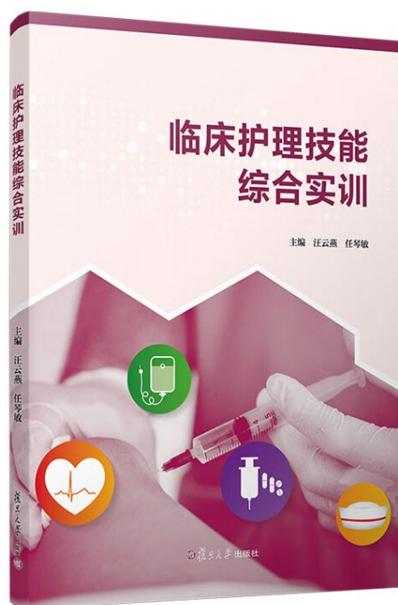
图 1-4 《临床护理技能综合实训》教材