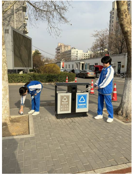
图 6-1 学生积极参加学雷锋活动