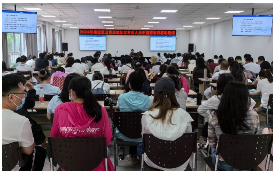
图 2-3 2024 年社区专业人员中医药培训基地培训

学校作为海淀区继续教育中医药教育基地,培训内容涵盖中医药基本理论、知识和技能。培训形式包括理论讲授、实践操作和案例分析等。学校为社区医护人员传授中医药基本理论,如阴阳五行、脏腑经络、病因病机等;通过中药分类、药性、功效及配伍原则的学习,使其掌握常见中药的使用方法与注意事项;随经验丰富的中医师进行病例分析、诊断与治疗,使社区医护人员学会运用中医药理论解决实际问题,提升临床应变能力,深刻理解中医药文化的博大精深,并在实践中灵活应用。2024 年,学校先后举办了 8 期中医药培训及社区必修课培训,累计培训 1232 人次。