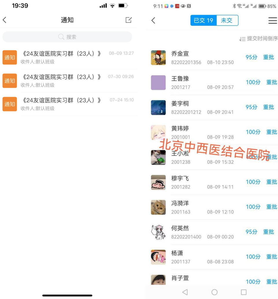
图 5-1 利用 APP 和线上平台辅助进行实习管理