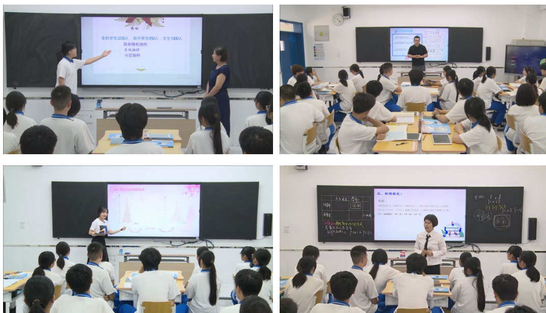
图 1-9 数学组参加北京市职业院校技能大赛教学能力比赛