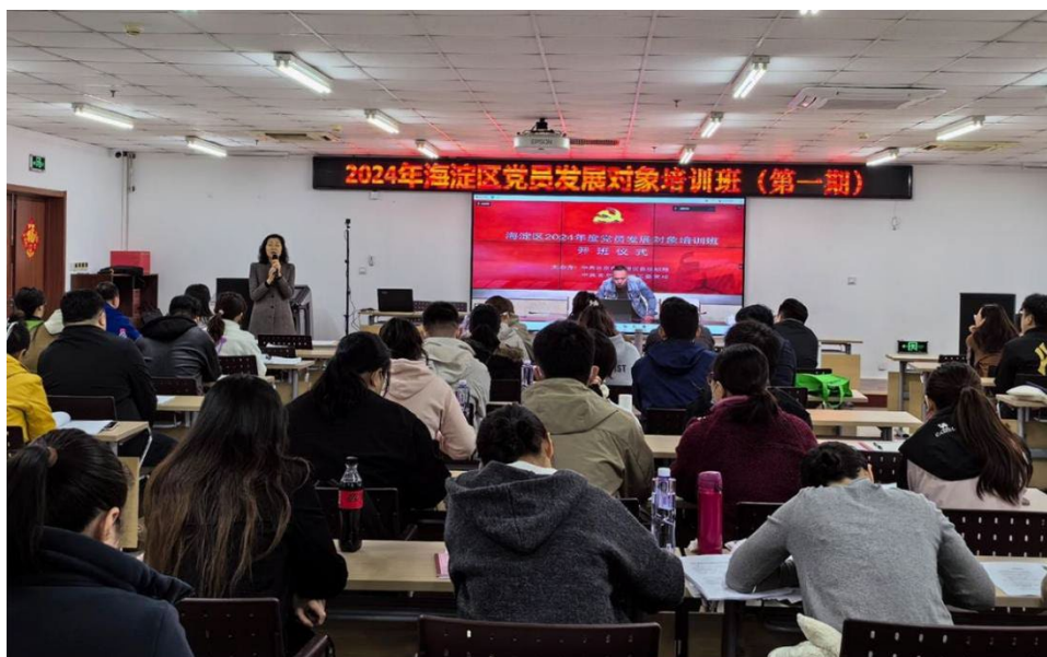
图 2-2 2024 年海淀区卫健系统党员发展对象培训班