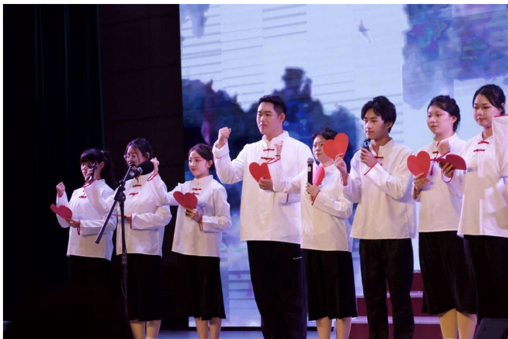
图 1-3 文学社团汇报演出《少年心怀热忱·守望民族未来》