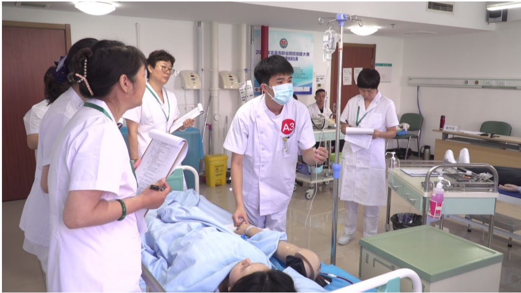
图 1-7 北京市职业院校技能大赛护理技能比赛现场