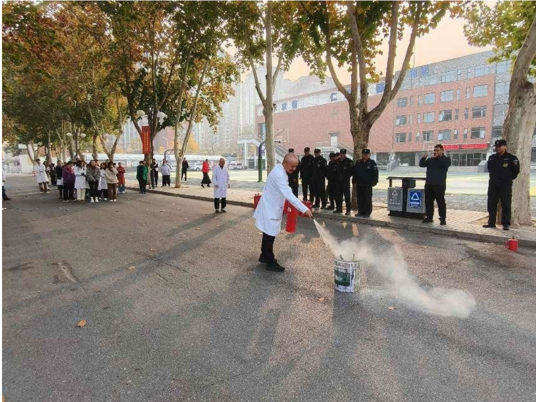
图 6-3 消防演练现场