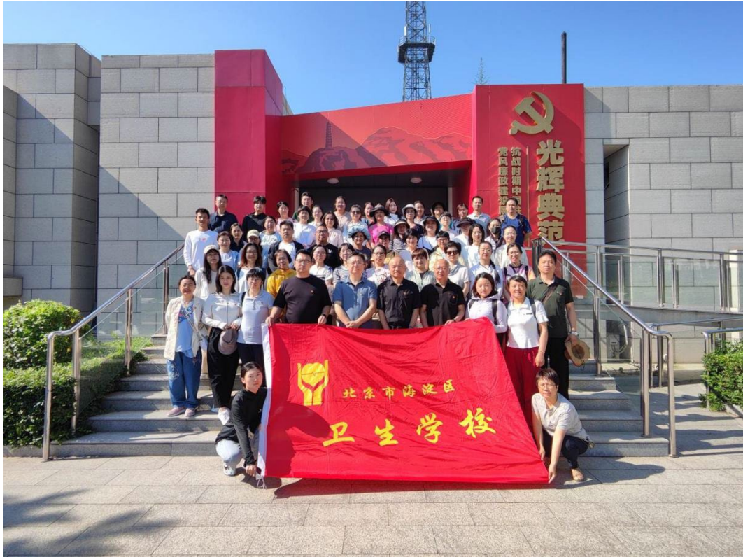
图 3-3 主题党日活动-参观党风廉政建设展览

争的一幕幕场景,先烈们舍生忘死的无畏精神激励党员们在自己的工作岗位上更加发奋图强,增强了党员同志们的文化认同、思想认同和情感认同,学英雄、见行动、勇担当,自觉将红色文化的精神力量转化为推动学校高质量发展的实践行动。