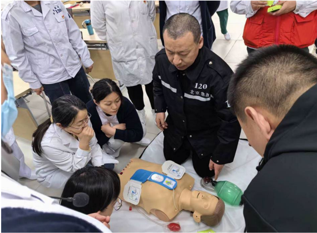
图 6-5 医学急救教学演示

和能力，培养院前急救人才打下了良好的基础。不仅做到了急救知识和技能的进一步推广和认知度提升，更是将“医教融合”的职业教育办学模式落到了实处。