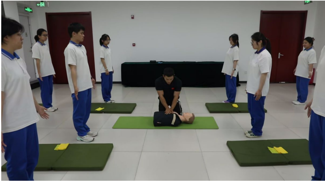
图 1-5 体育课锻炼 CPR 所需肌群