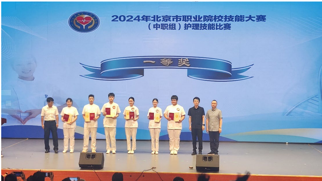
图 1-8 学生获北京市职业院校技能大赛护理技能比赛一等奖