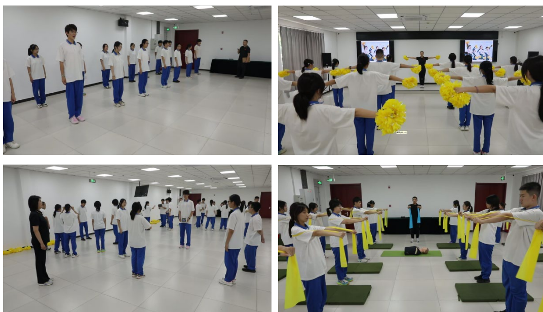
图 1-10 体育组参加北京市职业院校技能大赛教学能力比赛