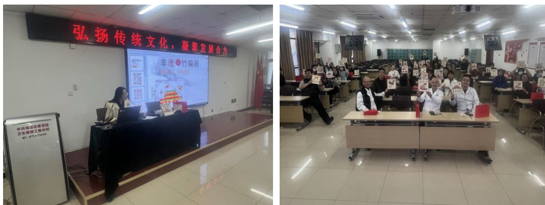
图 3-1 开展主题党日活动-弘扬传统文化 凝聚发展合力

竹编画属于国家级非物质文化遗产，具有悠久的历史 and 独特的艺术价值，是中国劳动人民辛勤劳作的艺术结晶，竹编工艺世代相传。为弘扬中华优秀传统文化，近距离体验非遗文化魅力，学校组织开展以“弘扬传统文化、凝聚发展合力”为主题的党日活动，邀请专业老师讲述非遗竹编画文化，现场指导工艺制作。活动期间，指导老师从选材方式、纺织技巧、注意事项等方面，介绍竹编工艺的制作流程，通过互动方式，调动党员干部、教职工对竹编画的好奇心和求知欲，有效活跃了课堂氛围。大家在制作竹编画过程中，充分发挥想象空间、融入个人创意、投入爱国情感，在沉浸式体验过程中，培育和践行社会主义核心价值观。