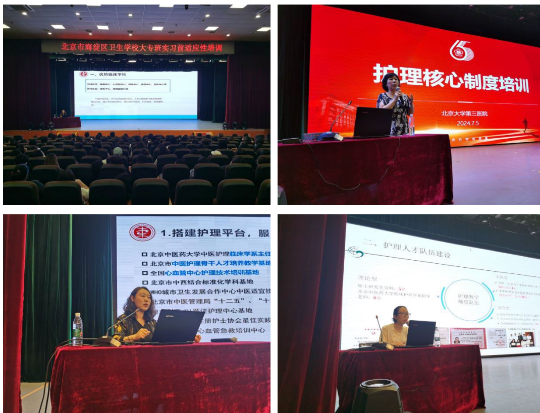
图 3-2 知名医院的一线专家为大专生进行实习前培训