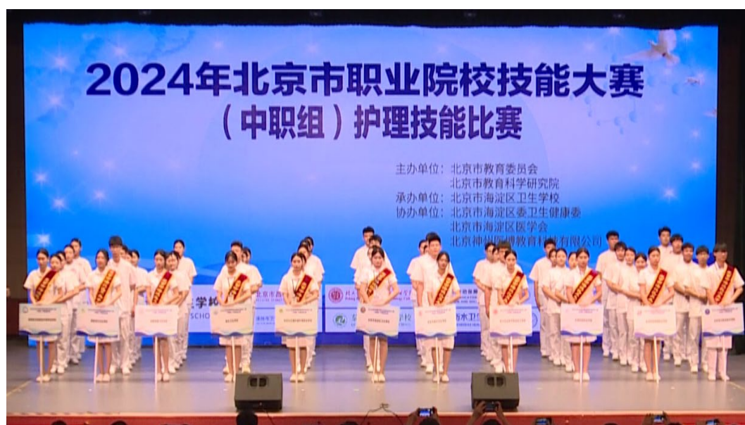
图 1-6 北京市职业院校技能大赛护理技能比赛开幕式

技能大赛的成功举办，有利于优化职业教育类型定位，促进职业教育高质量发展，进一步激发广大职业院校学生的学习热情，带动广大青年学生努力练习技能，走技能成才、技能报国之路。