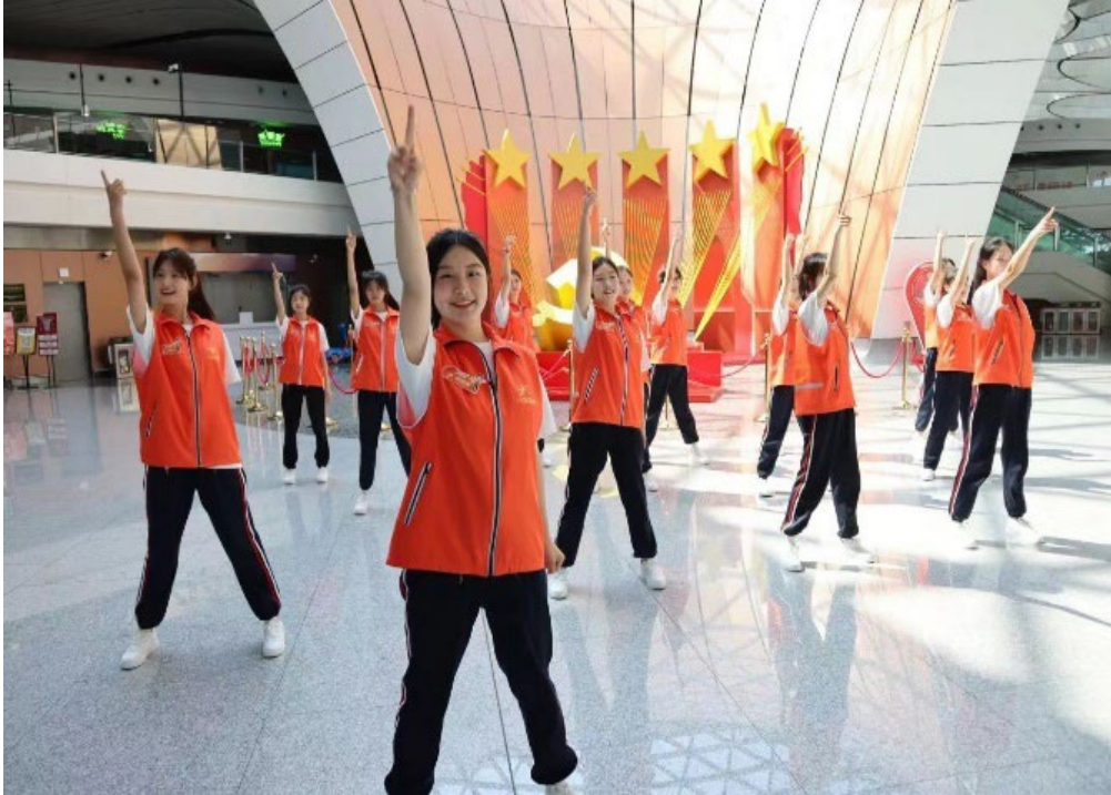
图 2-9 学生参加“Free time-热辣春日滚烫青春”主题志愿者快闪活动