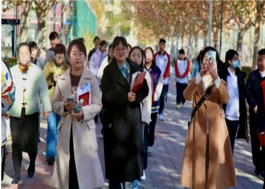
图 1-10 校园开放日家长参观校园