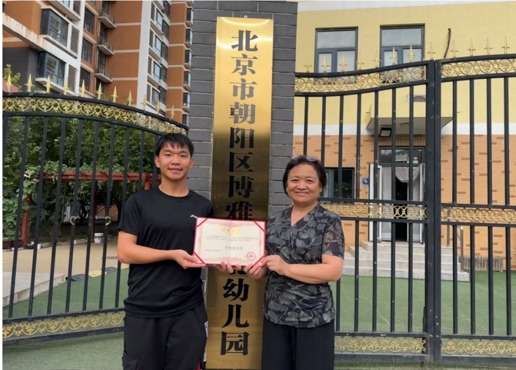
图 1-16 朝阳区博雅来北幼儿园园长为幼儿保育专业学生颁发优秀实习生证书