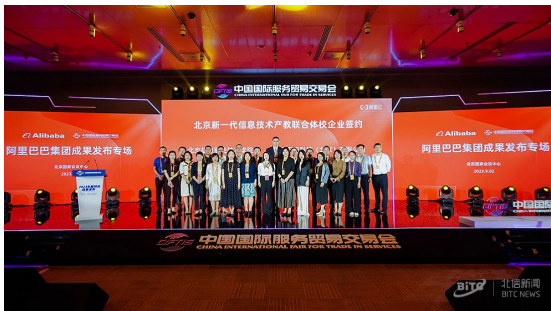
图 5-2 市域产教联合体建设

自 2023 年加入北京新一代信息技术产教联合体以来，学校积极参与联合体组织的校企交流活动，先后到访中关村朝阳园西门子大厦、海淀城市大脑展示体验中心和航天信息股份有限公司等，深入了解行业前沿。参加新一代信息技术培训，提升教师的专业水平。依托联合体平台和技术优势，学校成功举办北京市职业院校技能大赛大数据应用与服务赛项，吸引了 11 所中职院校的 21 支团队、63 名选手参赛。学校与阿里巴巴集团、北京电商协会合作，面向京津冀地区举办直播技能大赛。通过加入北京新一代信息技术产教联合体，学校社会服务质量提升，社会影响力不断扩大，为区域经济发展贡献了力量。