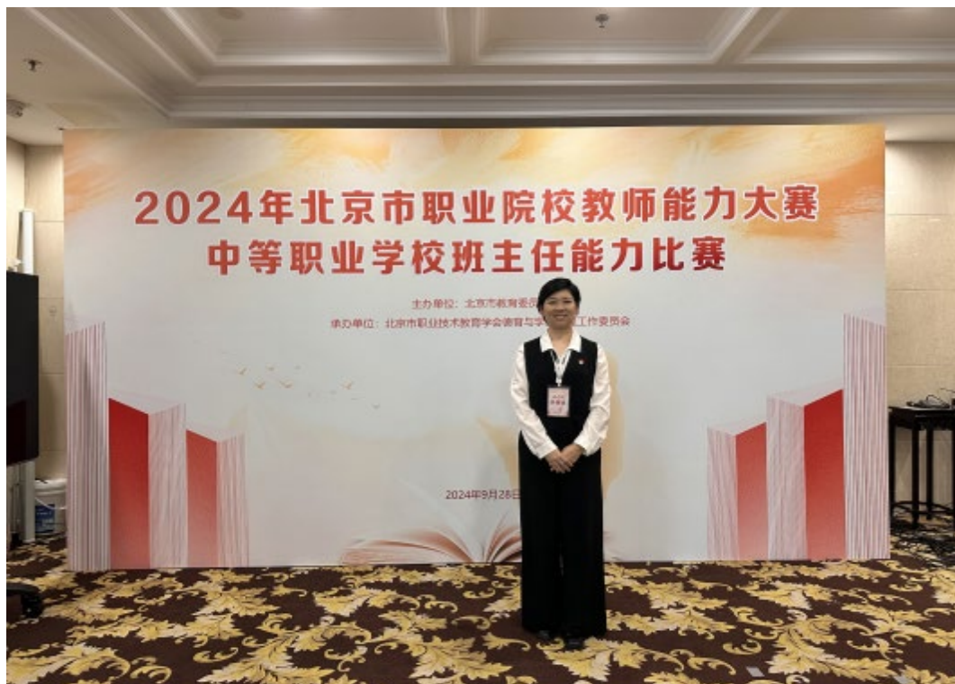
图 6-5 教师获 2024 年北京市职业院校班主任能力大赛一等奖