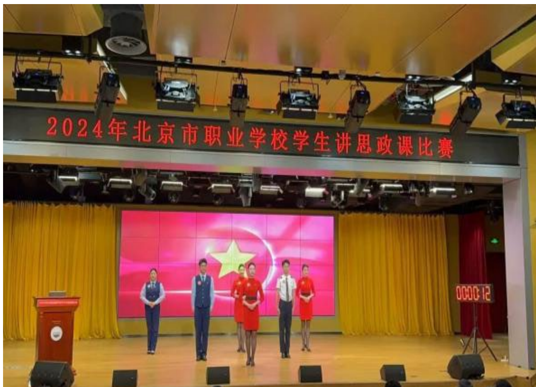
图 1-7 学生在讲思政课比赛现场