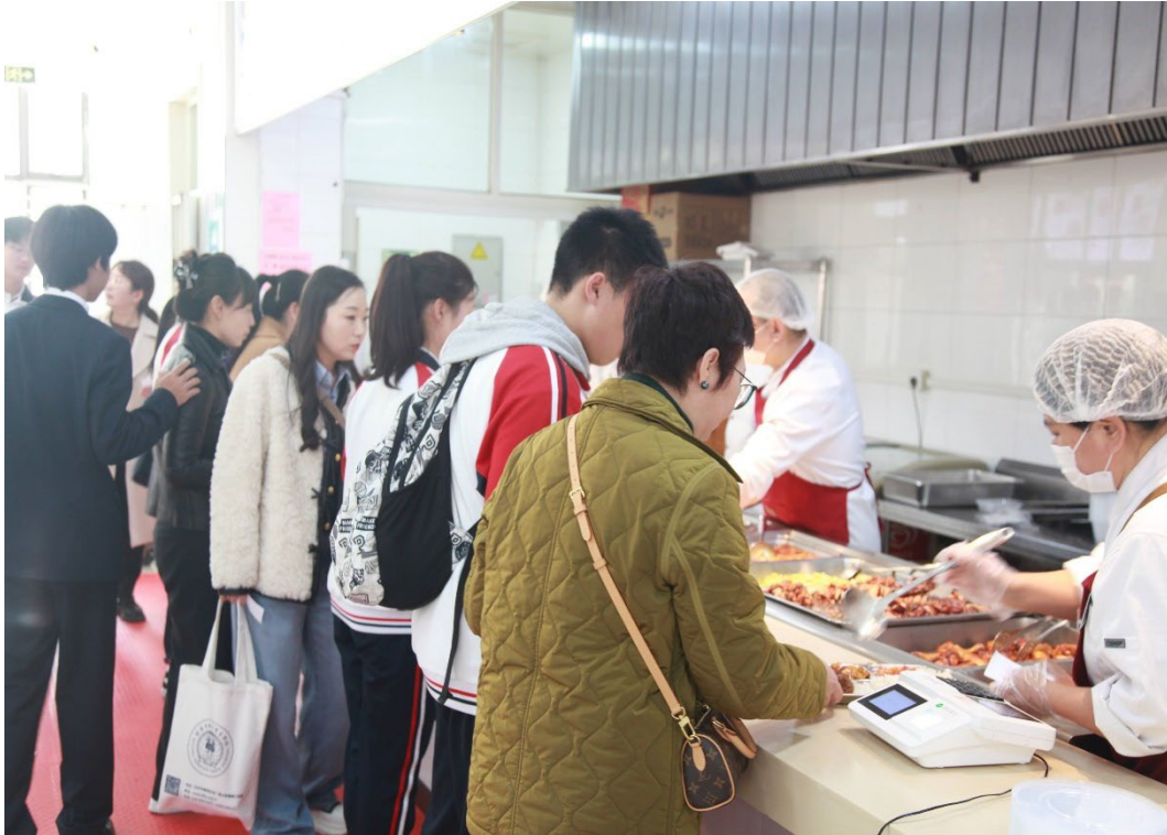
图 6-7 膳食委员会成员体验学生食堂用餐情况