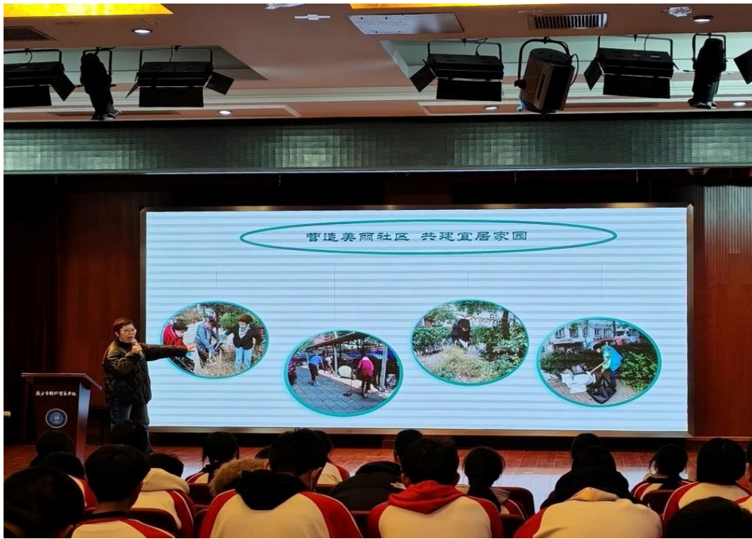
图 3-2 社区大讲堂—“做有温度的社工”