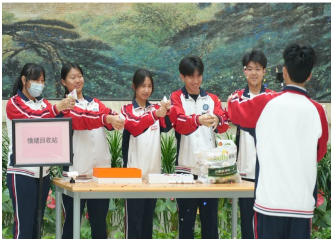
图 1-1 心理游园会-情绪回收站