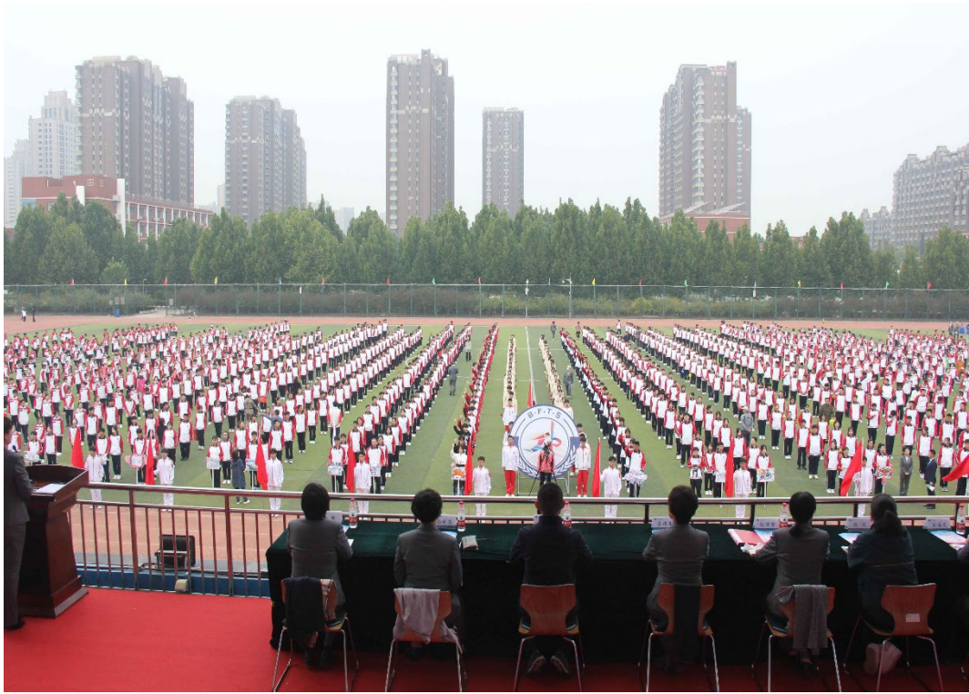
图 1-6 第二十五届学校运动会开幕式