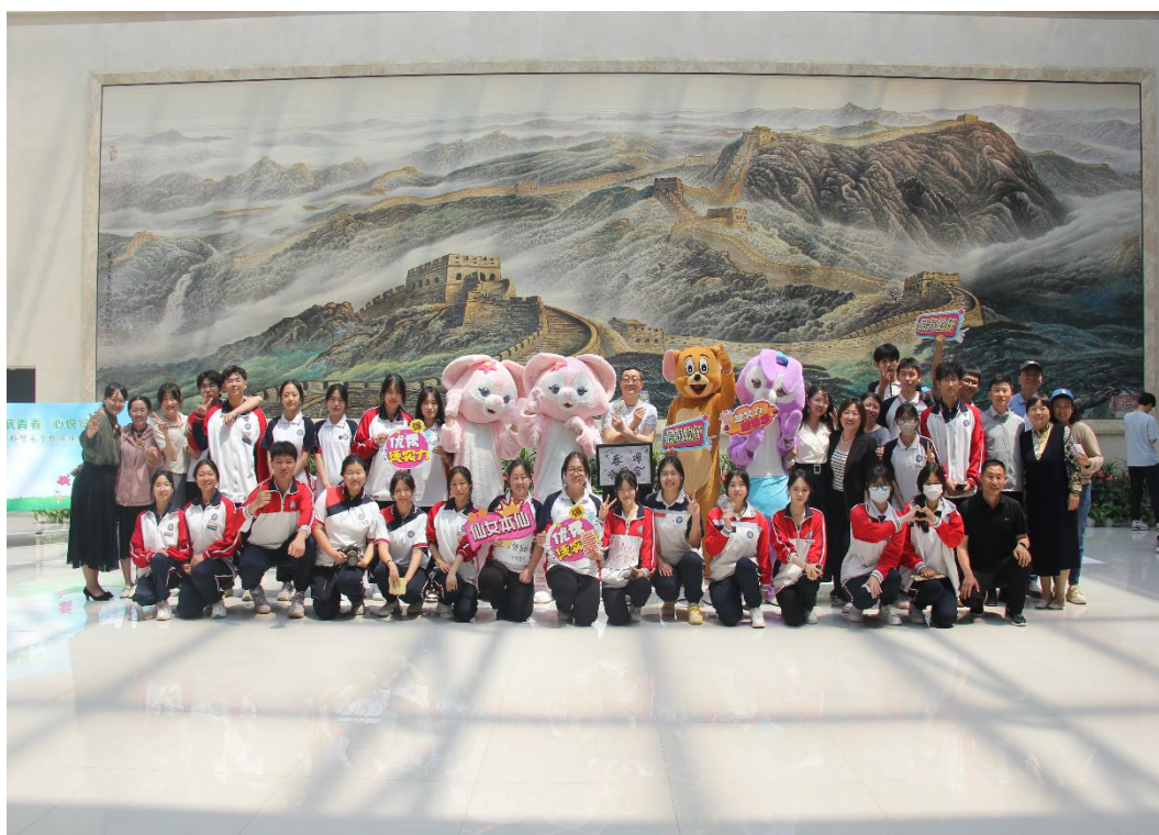
图 1-2 心理游园会—师生同乐