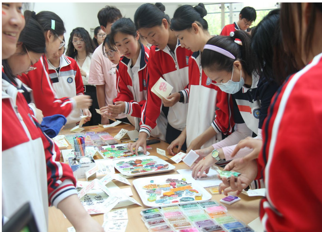
图 1-3 心理游园会—我手印我心