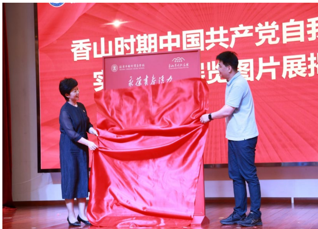
图 6-2 “永葆青春活力——香山时期中国共产党领导自我革命实践专题展览”开展仪式