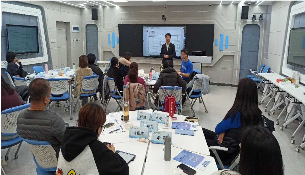
图 2-4 学校与航协合作开展 1+X 民航教员、考评员培训