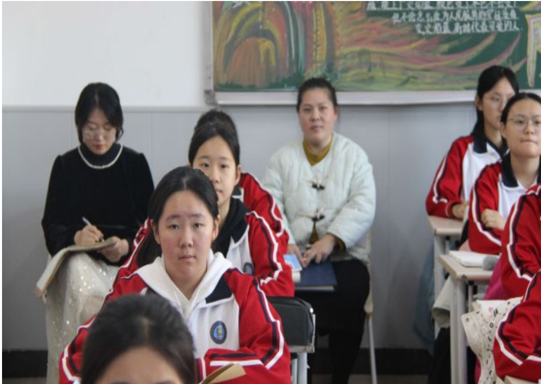
图 1-9 家长入班听课