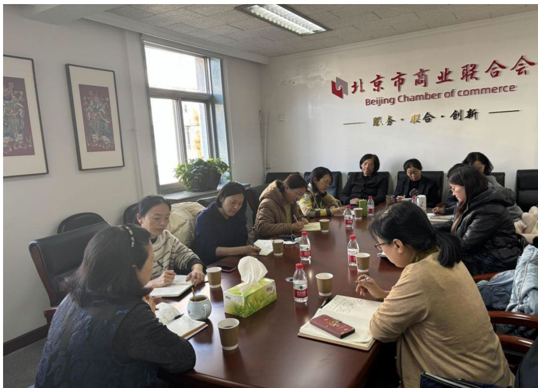
图 2-1 到北京市商联合会开展国际消费中心城市人才需求调研