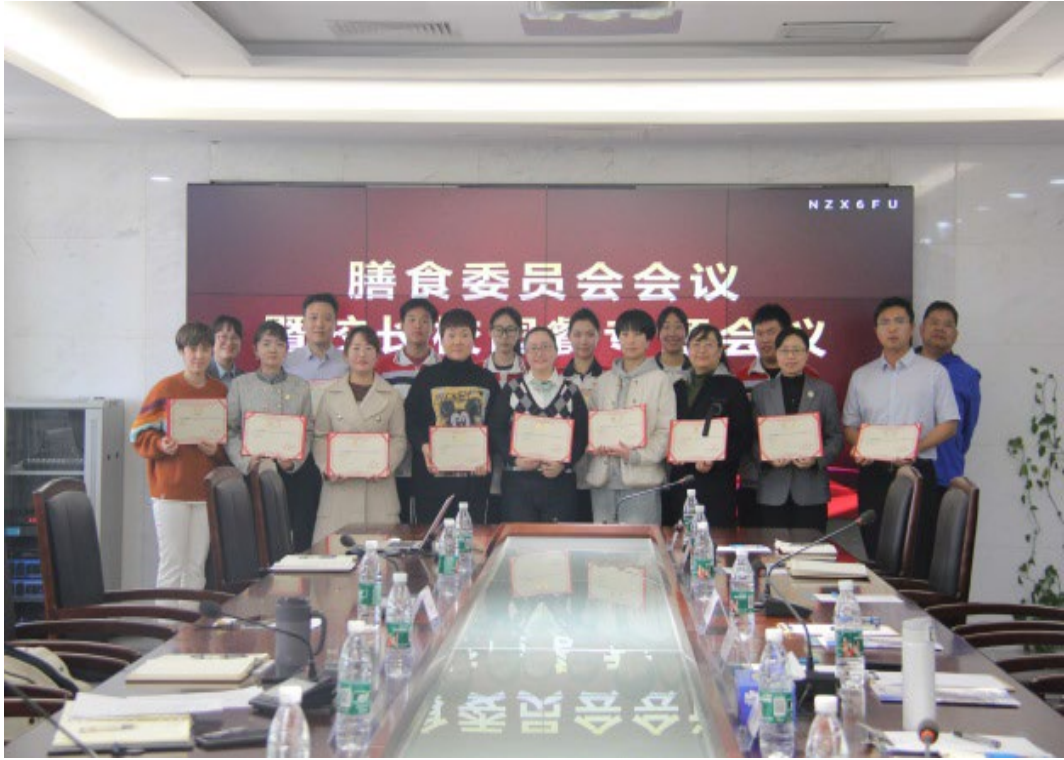
图 1-8 膳食委员会助力学校管理