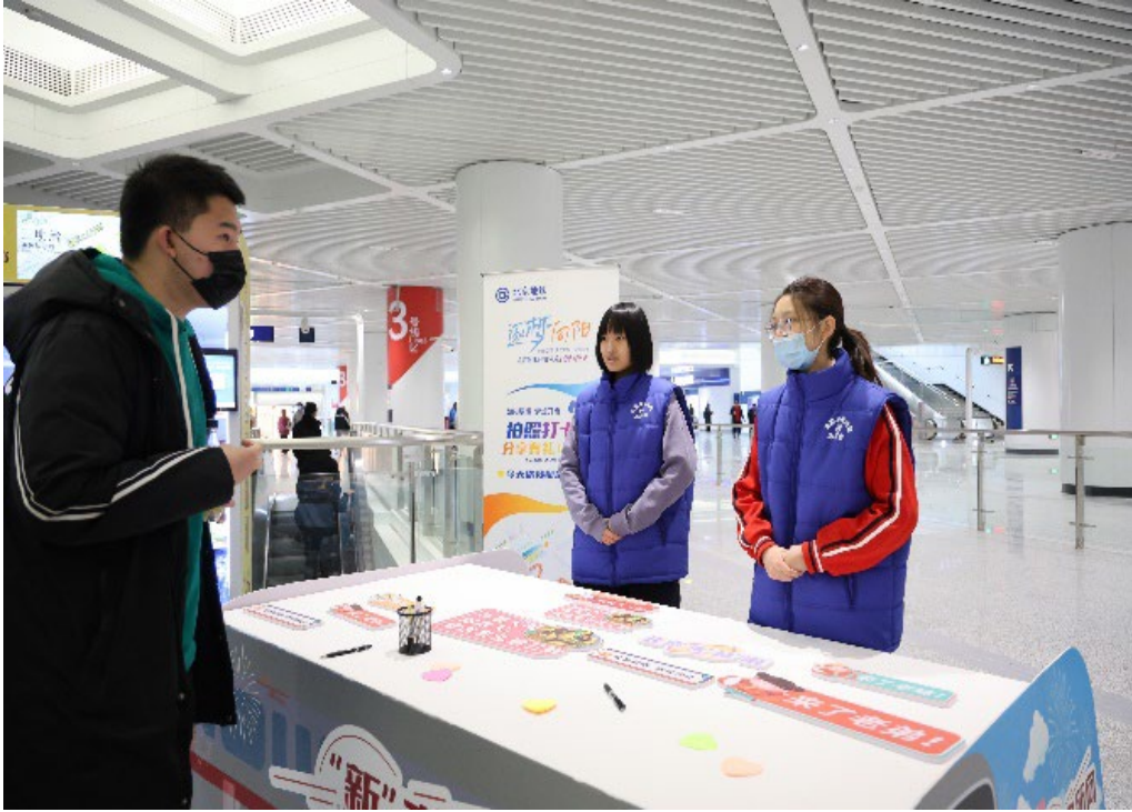
图 2-8 轨道专业学生参加平安地铁志愿者活动

2024 年，交通服务系师生积极参加机场和地铁志愿者活动，学生参与总人数超过 100 人次，为首都高品质民生出行贡献力量。