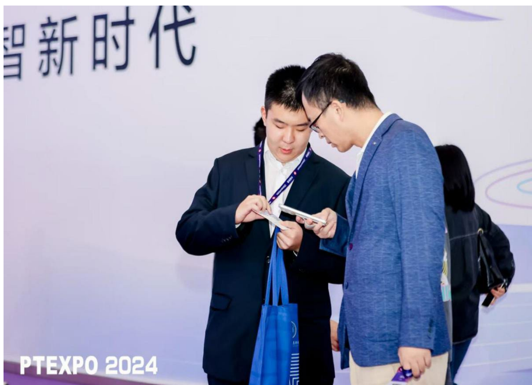
图 2-3 学生在 2024 年中国国际信息通信展览会现场调研