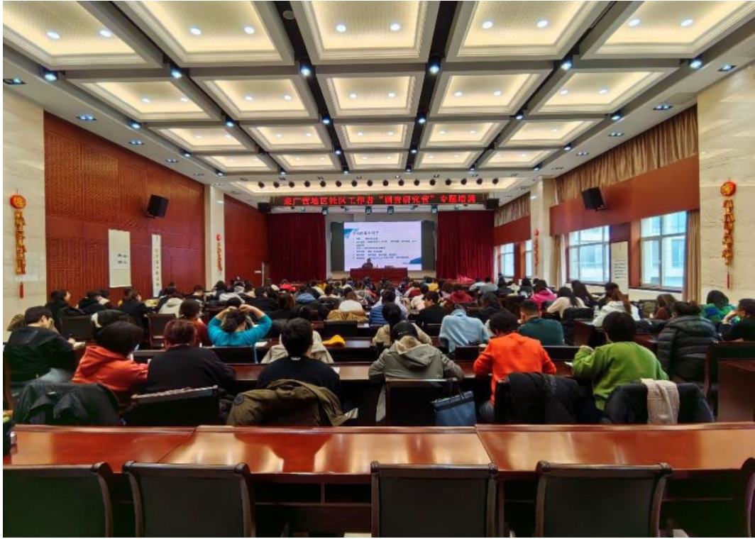
图 2-6 组织属地社区工作者专题培训