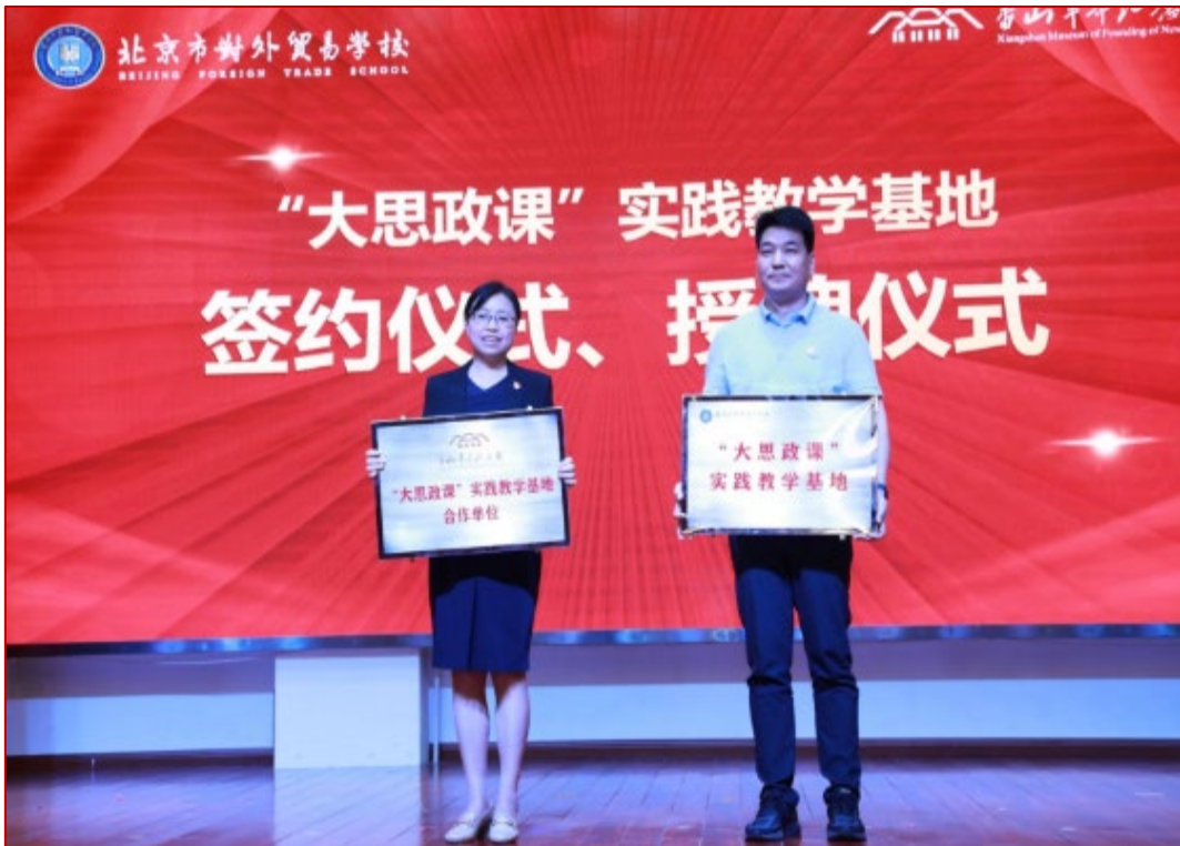
图 3-3 学校与香山革命纪念馆共建“大思政课”实践教学基地