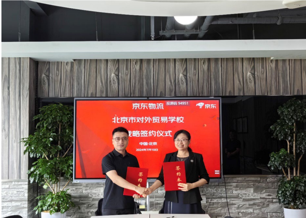
图 5-1 与京东物流举行合作签约仪式