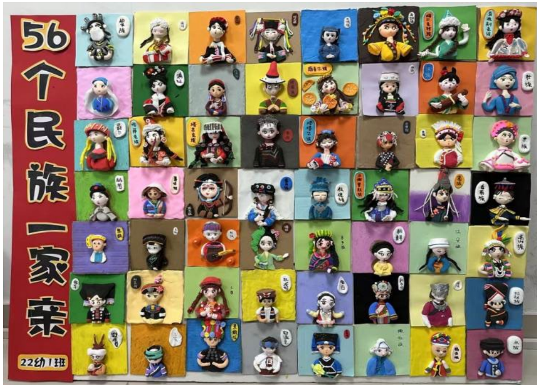
图 3-1 56 个民族一家亲——超轻粘土作品

代元素，将盘扣制作成摆件、胸针、挂饰等，将非遗技艺应用于日常生活，让古老盘扣焕发出全新魅力。