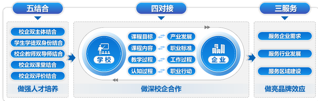
图 1-12 国际商务服务专业群建设模式图

参与冬奥会、服贸会、北京车展等重大活动。建设期内，专业群取得标志性成果 394 项，其中国家级 150 项。教师团队获全国教学能力大赛三等奖，2 名学生获国家奖学金，150 人次在各专业技能大赛中获奖，升学率 99%，工学交替满意率 99%。