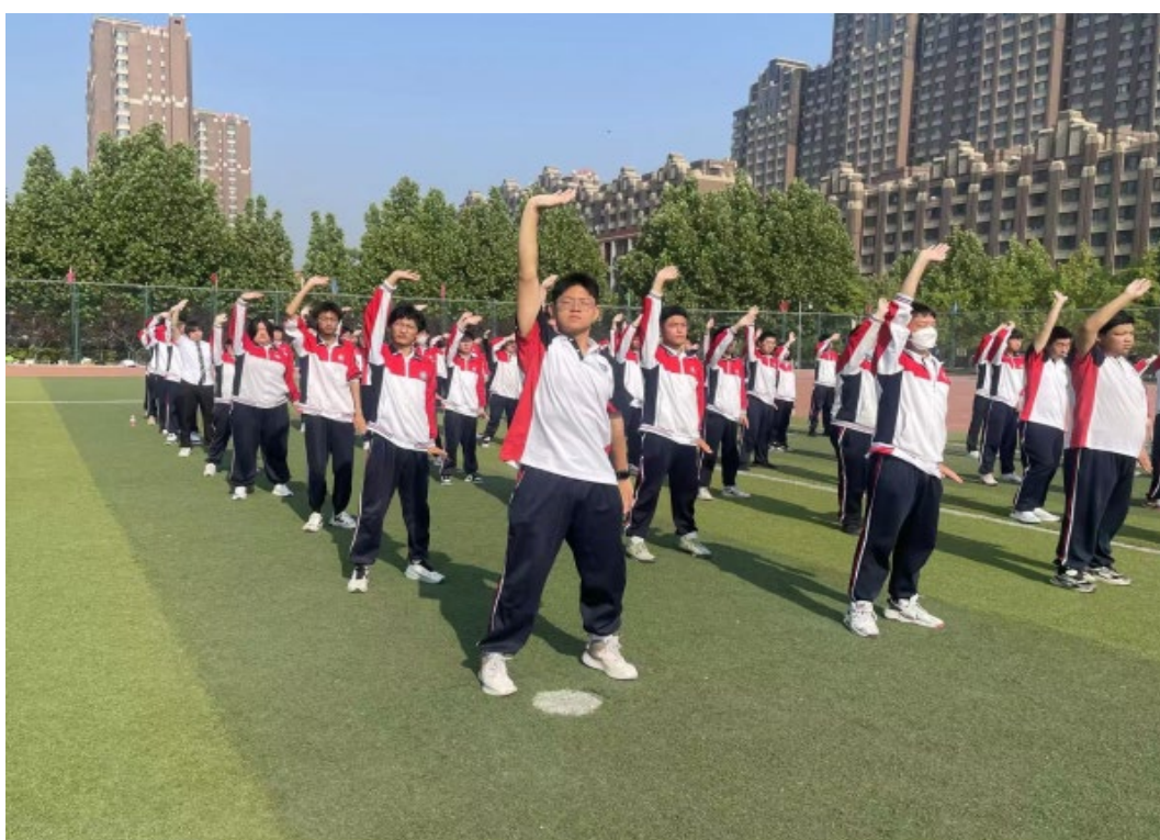
图 1-5 八段锦训练

学校秉承健康第一的教育理念，实施学生体质健康提升计划。一是持续推进体育教学改革，在“教会、勤练、常赛”一体化上下功夫，促进学生掌握体育健康知识、掌握体育运动技能。二是持续开展常规体育锻炼，按照“全员、全过程、全周期”参与体育锻炼的理念，坚持日常锻炼，推广“八段锦”中华优秀传统体育项目。三是持续开展体育竞赛活动，上半年启动“阳光体育节”，全年组织广播操、晨跑、拔河、篮球、足球等活动，举办田径运动会，激发学生运动激情、拼搏进取精神，强健体魄，增强团队意识。