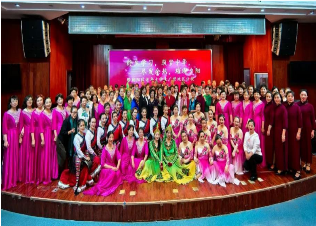
图 2-7 组织属地老年大学学年度毕业汇演