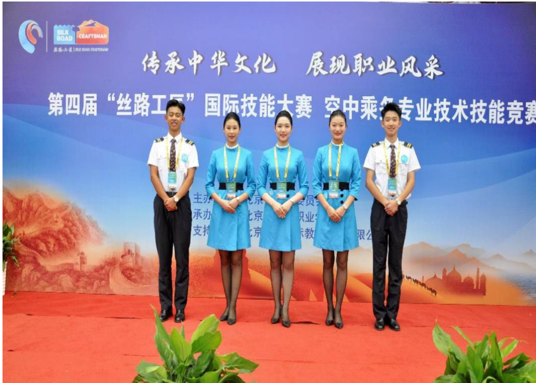
图 4-3 学生参与“丝路工匠”国际技能大赛