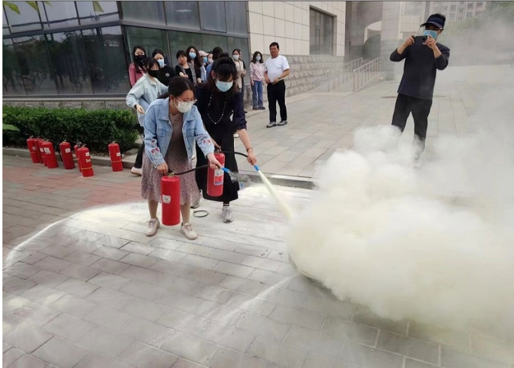
图 6-8 “出真水灭真火”消防实操演练活动