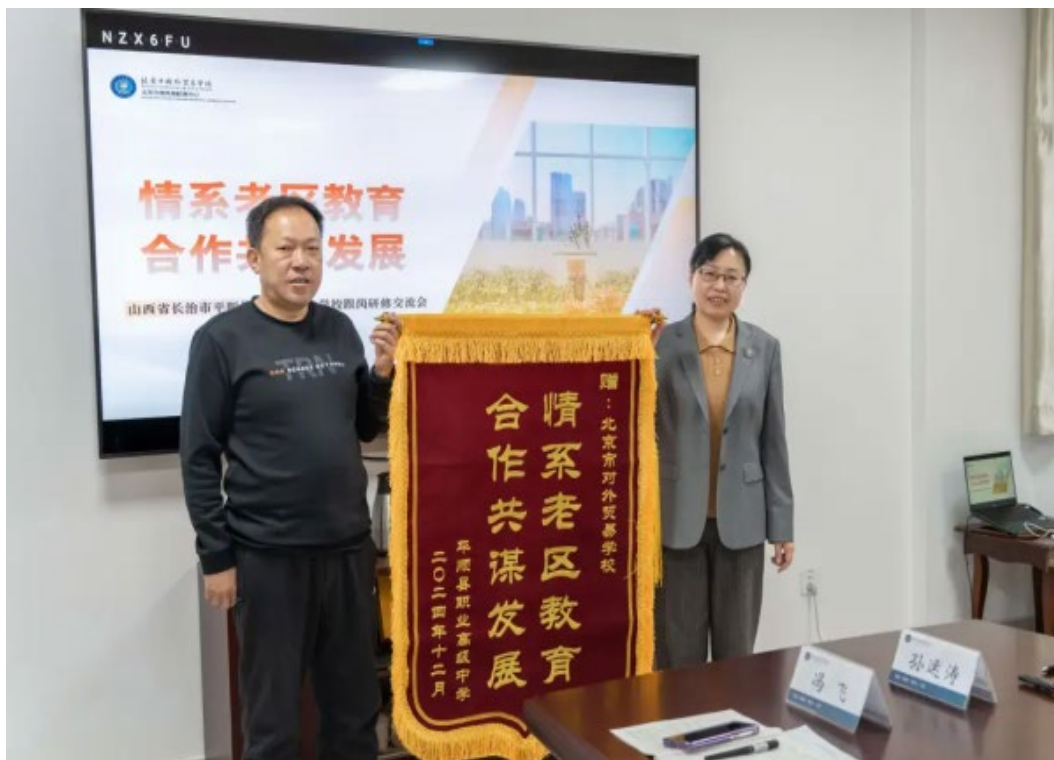
图 1-11 关工委组织与平顺县职业高级中学交流研讨