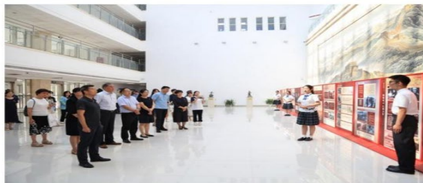
▲北京市对外经济贸易学校的红色讲解员为来宾进行专题展览讲解。