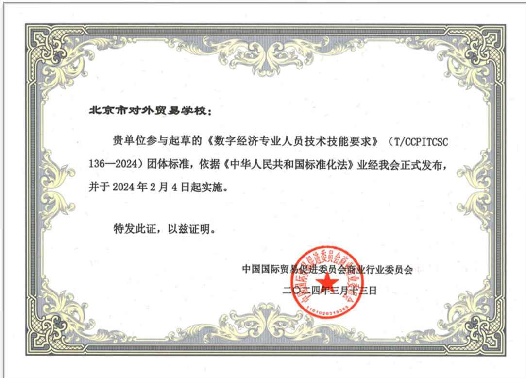
图 1-13 学校参与《数字经济专业人员技术技能要求》标准制定