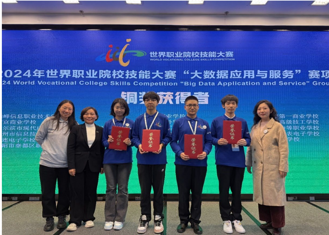
图 1-14 信息技术系四名学生获得世界职业院校技能大赛铜奖

经过三年的建设，全域数字化运营专业群、阿里巴巴直播电商学院学生培养质量显著提升。2024年，在电子商务、大数据等多个赛道中，共计42人次获奖，在北京市职业院校技能大赛大数据赛项中荣获一等奖，赛道数量、获奖次数及最高奖项方面均创新高。各类技能大赛为教育教学改革、人才培养指明了方向，促进了教学改革，以赛促教落到实处。