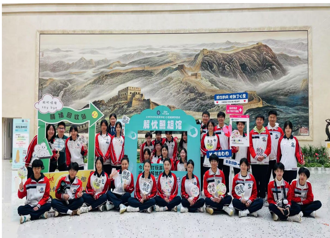
图 1-4 心理游园会—师生同乐