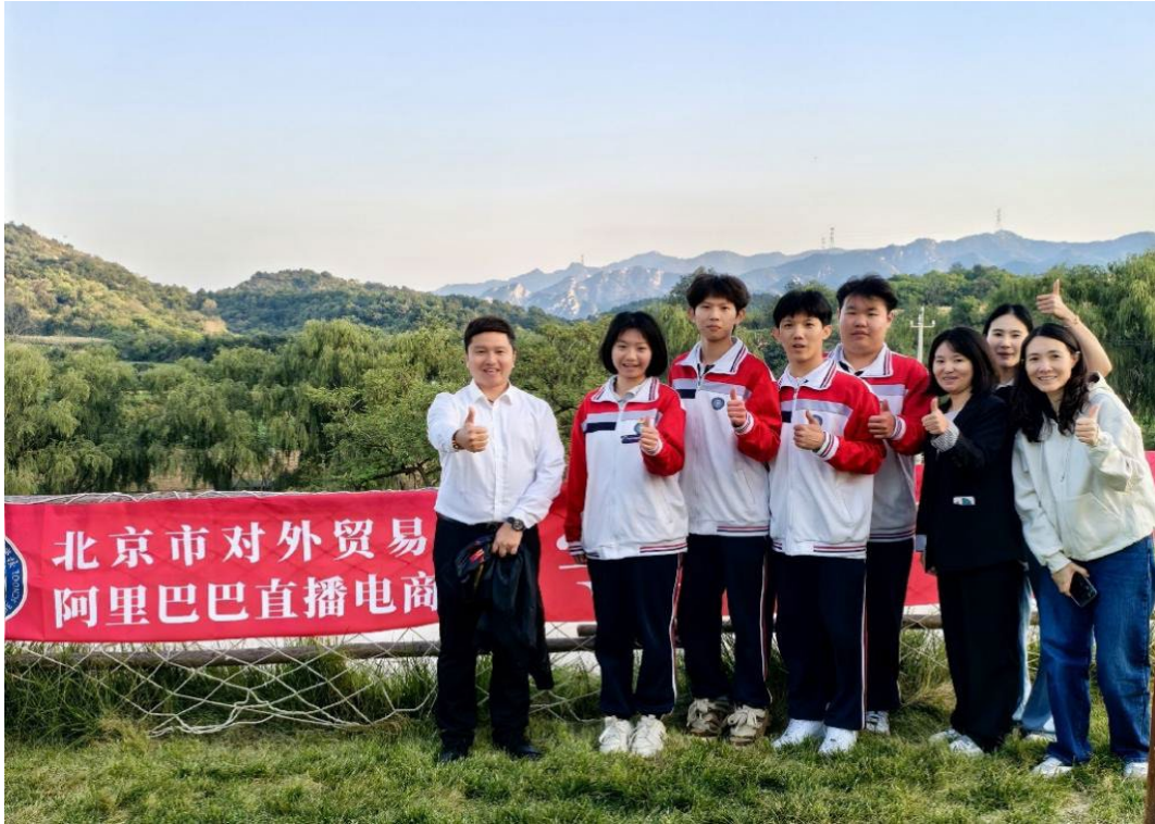
图 2-5 师生在箭杆岭村开展直播带货助农活动