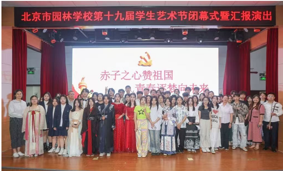
图 1-4：第十九届学生文体艺术节汇报演出