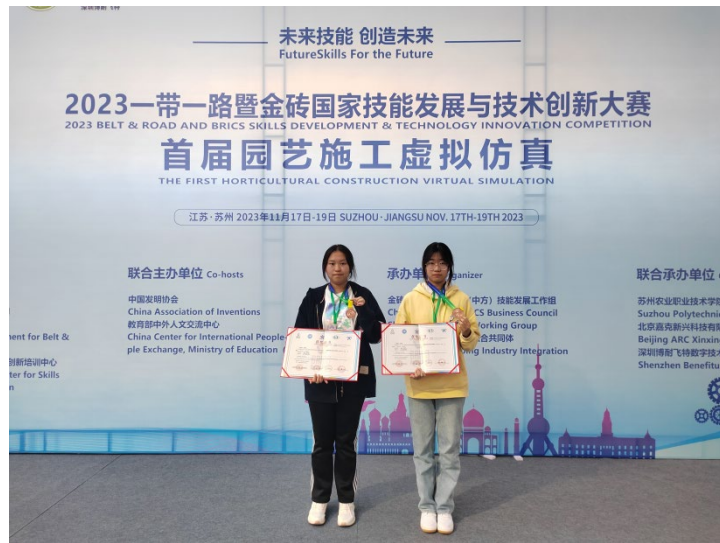
图 4-2：一带一路暨金砖国家技能发展与技术创新大赛获奖选手

准确度。最终在全国 145 个代表队中，学校两组选手分别取得三等奖和优秀奖的好成绩。