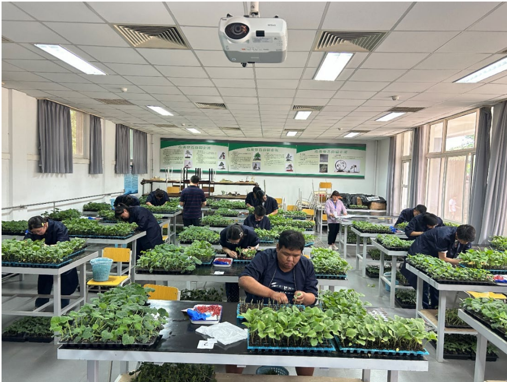
图 1-9：2024 年北京市职业院校技能大赛“植物嫁接”比赛现场

承办行业大赛。承办2024年北京市第六届职业技能大赛园林绿化工（房山赛区）初赛、2024年北京市公园管理中心插花竞赛，得到主办方的认可。