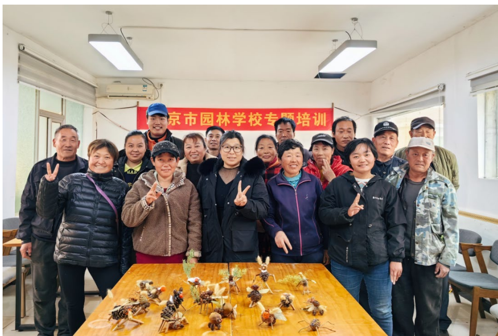
图 2-2: 顺义区乡村花卉园艺农民从业者植物再利用专项技术培训

学校积极开展乡村振兴服务,承担了由北京春风画境园林工程有限公司主办的新型农民工、下岗再就业、退伍军人三类人员的就业技能培训任务。学校根据顺义区春风农场要求,制定培训方案,提供培训材料,安排教师以理论讲解、实践操作、案例分析等方式,分三个批次对 69 人开展了艺菊、花束制作、果蔬花艺、植物再利用制作等系列花艺技术培训。顺义区乡村花卉园艺农民从业者的专业技能和综合素质得到了显著提升,为顺义区花卉园艺产业的持续健康发展注入了新的活力。