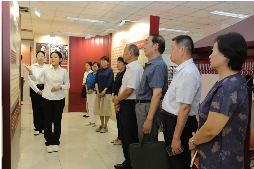
图 3-3: “永葆青春活力”红展接待来访人员

北京市文化遗产保护专业群将红色文化作为群建设展示宣传的重要选题。年内，会展服务与管理专业对接香山革命纪念馆将“永葆青春活力”巡展作为真实任务搬进学校。在设计方面，巧妙地运用现代展示手法与视觉元素，将香山革命时期的历史故事与精神内涵生动地呈现给观众，增强了展览的感染力与吸引力；在搭建过程中，学生们积极响应环保号召，秉承绿色环保理念，大胆选用纸基作为主要搭建材料，为绿色会展实践提供了有益范例。旅游服务与管理专业学生依托红色文化展览真岗讲解任务，深入研究红色讲解政治性、教育性、时代性、传承性的特点，撰写讲解稿，进行讲解训练，先后为来校参观的北京市教委领导、同类院校领导、学校师生、老干部等讲解服务 8 个批次 400 余人。通过红展，不仅训练了学生的展陈、讲解服务能力，更重要的是增强了学生对红色文化的认知和记忆，加深了对红色文化的理解和认同。