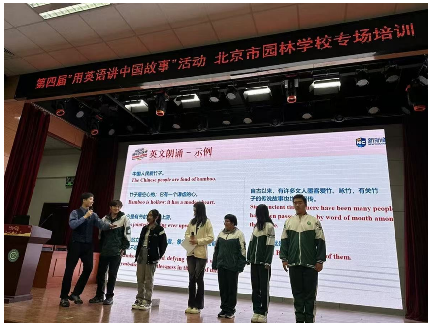
图 3-2: “用英语讲中国故事”活动专场培训

中国传统文化。学校作为首个组团报名的中等职业学校，为此主办方在学校举办了专场培训会，并被中国教育电视台官媒报道。