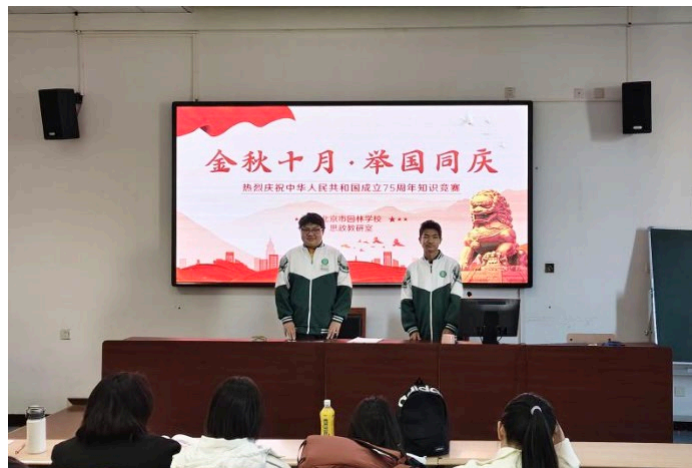
图 1-1：庆祝新中国成立 75 周年知识竞赛

以庆祝中华人民共和国成立 75 周年为契机，学校结合思政课授课内容组织了一场线上线下相结合的知识竞赛。学生通过学习通线上平台参与学习和答题，线上参加初赛，线下组织决赛，竞赛内容涵盖了国家发展历程、重要历史事件等，旨在加深学生对国家历史和文化的了解。竞赛结束后，举行颁奖仪式，表彰优秀选手，进一步激发了学生的学习热情和爱国情感。此次活动不仅创新了思政课的教学形式，还增强了学生的国家认同感和民族自豪感。