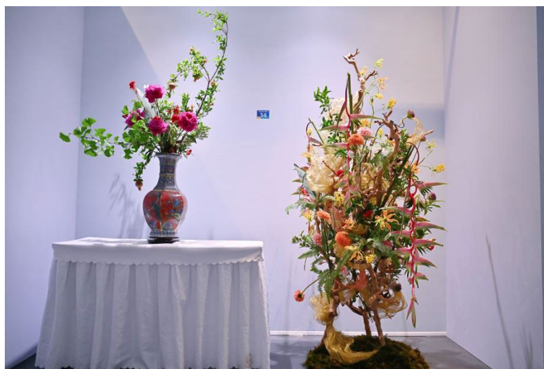
图 4-1：2024 成都世界园艺博览会插花花艺专项竞赛学生获奖作品

世界园艺博览会作为由国际园艺生产者协会（AIPH）认定的国际性博览会，是园林园艺行业最高级别的专业性国际博览会，博览会的花艺赛项旨在促进技能人才培养、弘扬工匠精神和促进国际合作交流。2024年6月7日，园林学校花艺设计与制作专业学生参加2024成都世界园艺博览会插花花艺专项竞赛。此次竞赛设传统插花和现代花艺两个项目，吸引了来自中国和日本的50位花艺行业精英同台竞技。学生传统插花作品《岁月鎏金》以其精湛的技艺和深邃的文化内涵，赢得了评委的高度赞誉，荣获传统插花金奖；现代花艺作品《万卷繁华》以其创新的设计和丰富的色彩层次，展现了现代花艺的魅力，荣获现代花艺铜奖。通过竞赛搭建了国际互学互鉴的桥梁，拓宽了学生的国际视野，提升了学生的职业素养。