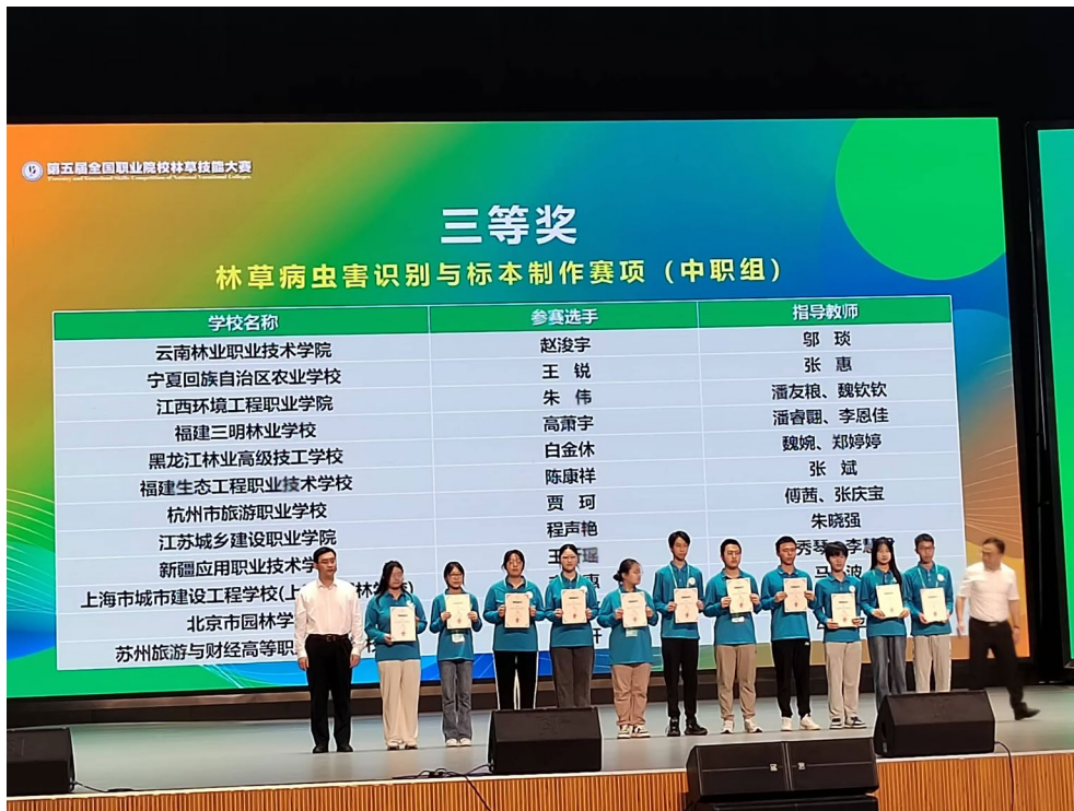
图 1-10: 全国职业院校林草技能大赛病虫害识别与标本制作赛项三等奖

行业赛：参加由北京插花协会主办的首届全国青少年花植艺术大赛，获得青少年个人二等奖 2 个、三等奖 1 个，团体奖一等奖 1 个；参加 2024 首届中国“岁朝插花”展赛，获得最佳色彩奖 1 项、优胜奖 1 项；参加 2024 年成都世界园艺博览会插花花艺专项竞赛获金奖 1 个、铜奖 1 个；参加北京市公园管理中心 2023 年科普海报设计大赛，获得二等奖 1 项；参加第五届全国高校商业经营挑战赛会展文案创作竞赛，获得二等奖 1 项、三等奖 1 项。