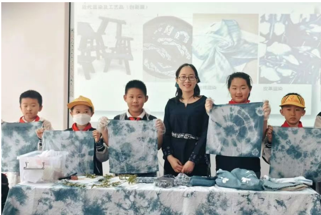
图 1-6：长阳中心小学职业体验专场活动之植物扎染体验

学校发挥北京市园林绿化科普基地作用，依托专业资源优势，面向幼儿园、中小學生开展职业启蒙、职业体验活动。2024 年，为房山长阳中心小学 416 名三年级师生提供职业体验专场服务。此次专场活动结合专业设置和学生年龄认知特点，提供小小园艺师、小小训犬师、小小彩画师等 15 门职业体验课，以专业知识讲解、职场情境体验、专业操作实践等环节为重点，富有趣味性、实践性，弘扬了园林文化、职业文化，培养了学生的职业精神、劳动意识和创新理念。长阳中心小学向学校赠送锦旗一面。