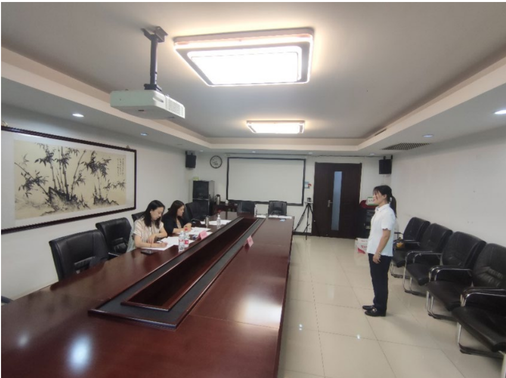
图 2-1: 学校承办北京市公园管理中心展览讲解员自主评价

为持续做好行业职工培训服务，学校年内面向北京市公园管理中心所属 11 家公园开展调研。通过调研准确把握行业现状和需求，明确职工培训服务的发展方向。2024 年承办了北京市公园管理中心绿化、讲解技能人员自主评价培训与考评工作，共计 255 人、591 人天；为房山园林绿化局定制花艺师培训课程方案；发挥工程师学院平台作用，与绿京华公司校企合作面向行业开展园林绿化工考评鉴定工作，共计 5 批次、255 人。