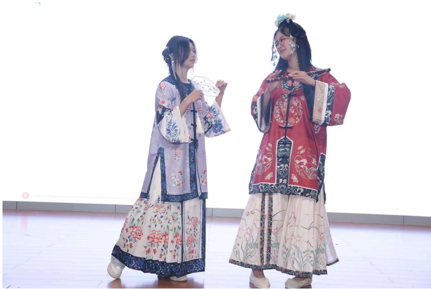
图 3-1：服饰文化社团传统服饰展演活动

彰施——植物扎染体验系列活动”，开展了桑之叶、柘之茎、茜草之根、桃核之皮四期扎染体验活动，并拍摄公众号宣传短视频，向公众弘扬染料植物文化与技艺。服饰文化社开展古代服饰展示活动，通过服饰文化，深入了解中华民族的历史和文化。