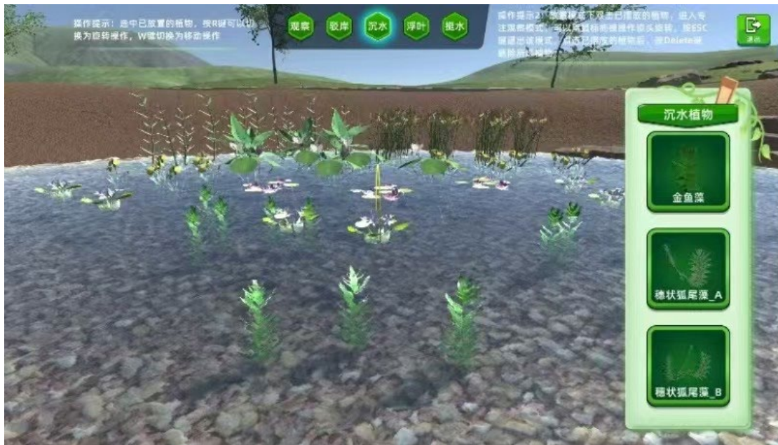
图 1-7：小微湿地虚拟仿真实训平台

《小微湿地虚拟仿真软件》是一款模拟湿地植物景观设计、驳岸置石施工、湿地滤料设计的专业教学仿真软件。旨在通过创建小微湿地的虚拟环境，使学生了解到湿地景观植物的类型、常见种类、湿地植物景观设计的方法，还有驳岸置石设计原则和施工流程，以及湿地滤料的种类、功能以及设计原则等专业知识，同时在这个环境中进行互动和体验，从而产生身临其境的感觉。该软件丰富了专业课程的信息化资源和教学形式，它身临其境的沉浸性、与虚拟物象的交互性以及虚拟空间的想象性，大大增加了园林专业学习的趣味性，提升了学生的学习兴趣，让学生在“玩”中做，在做中学。