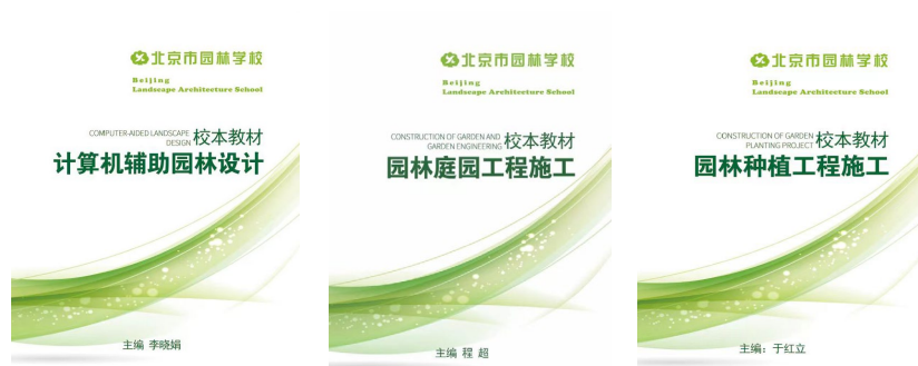
图 1-5: 园林技术专业“金教材”建设成果