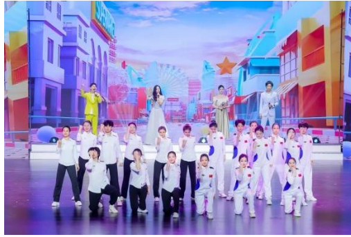
见上图：《奋斗的青春最美丽》