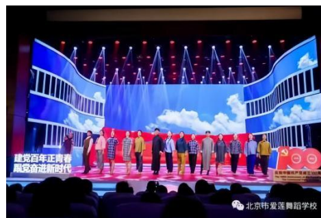
见上图：《那一束光》演出

例如：在民间舞方面，我校学生艺术实践作品《京西春晓》，所展现的是北京门头沟一带清朝末期民间所盛行的京西太平鼓，是经国务院批准的非物质文化遗产。学生的这一艺术实践作品，获得北京市第十六届舞蹈大赛少儿组三等奖，应当说是对传统民间舞的一次有益尝试。同时，爱莲舞校还积极参与了大兴区“平南文化创新与发展”活动。