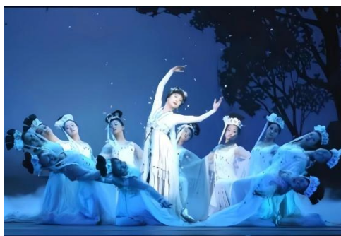
见上图：红楼梦照片

1997年，由已故老校长陈爱莲领衔主演的中国大型古典剧《红楼梦》，被文化部、广电部批准为“1997年中国国际歌剧舞剧年”参演剧目。1998年，舞剧《红楼梦》再度公演，中央电视台、北京电视台、《人民日报》、《北京日报》、《文化报》等多次报道了演出盛况，认为“演出非常成功”，“是舞剧精品中的精品”，“学生的表演可以和国家剧院媲美”。经中宣部推荐，中央电视台特向全国转播数次。大型艺术实践剧目《红楼梦》先后在北京及全国各地演出800余场，特别是在新中国建国70周年之际，在首都副中心的演出，受到了满堂喝彩，为传承中国舞这一中华优秀传统文化做出了积极的贡献。