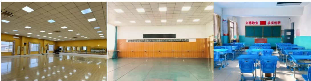
见上图：国标舞教室、舞蹈教室、标准化教室

根据北京市大兴区高质量发展和本校办学实际情况，进行了充分调研分析和认真总结，提炼并汇总编制出了2024年度北京市爱莲舞蹈学校中等职业学校质量年报。通过编制教育质量年报，学校可以全面总结教育教学工作，发现问题，提出改进措施，从而推动学校高质量办学标准化建设。2024年度的质量年报将在人才培养、服务贡献、文化传承、国际合作、产教融合、发展保障、面临挑战等7个方面进行阐述，探索京津冀一体化合作办学的新经验新范式，以及提高学校关键办学能力和教学质量、加强教师团队建设、拓宽学生成长成才通道、创新国际交流与合作机制、服务北京”四个中心“建设，京津冀协同发展等方面的特色措施。北京市爱莲舞蹈学校质量年报充分展现职业教育发展成就，不仅有学校概况、参与办学总体情况、学校资源投入、参与教育教学改革、主推本校发展、问题与展望等。