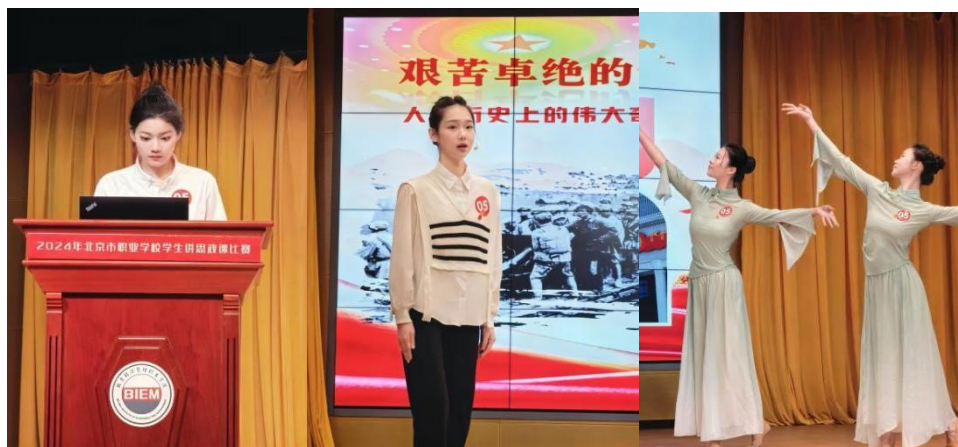
见上图：讲思政课比赛现场

1.9.3 在“激昂青春展风采，强国有我新征程”北京市职业学校学生讲思政课大赛中，北京市爱莲舞蹈学校高二班的四位同学以卓越的表现赢得了广泛的赞誉，学生凭借深刻的主题阐述、生动的演讲技巧以及真挚的情感表达，荣获大赛一等奖，为学校争得了荣誉，也为青春留下了浓墨重彩的一笔。