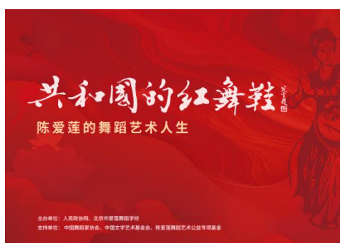
见上图：“共和国红舞鞋”——陈爱莲的舞蹈艺术人生展。

陈爱莲作为新中国舞蹈事业的奠基人之一，其艺术生涯与红色文化紧密相连。她不仅通过舞蹈作品展现了革命历史与英雄人物，更在舞台上传递了坚定的革命信念和爱国情感。陈爱莲的舞蹈作品如《白毛女》、《红旗》等，都是对红色文化的深刻诠释和传承。