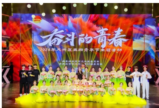
见上图：五四青年节主题活动

爱莲舞校用专业舞蹈技能坚守意识形态主阵地，联系服务群众，积极参加大兴区域的多个大型活动：在2024年5月北京市爱莲舞蹈学校作为区直团委代表受邀参加，并选派40余名青年学生积极参与节目演出！