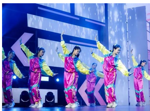
见上图：《青春起跑线》

在《奋斗的青春最美丽》、《青春起跑线》、《一路生花》节目中作为舞蹈演员参与表演，积极展现爱莲青年学子挺膺担当、团结奋斗的良好风貌！