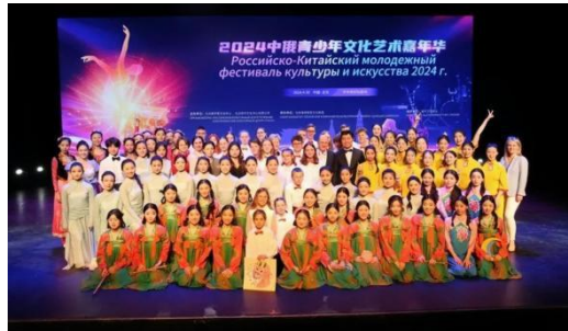
见上图：中俄青少年文化艺术嘉年华

此次嘉年华活动是为了加深中俄两国青少年之间的文化了解与艺术交流，促进两国青少年的友好往来，是中俄文化交流与合作框架下的重要项目！