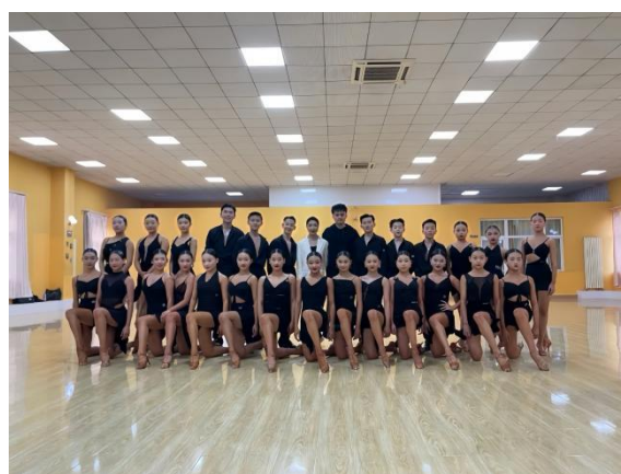
见上图：中国舞专业和国际标准舞专业