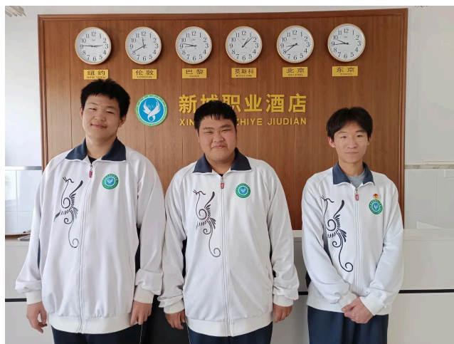
图 1-10 高三旅游专业 3 名学生考取导游资格证