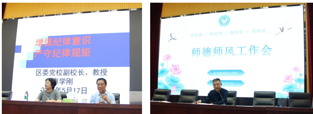
图 6-1 开展党纪学习与师德师风教育活动