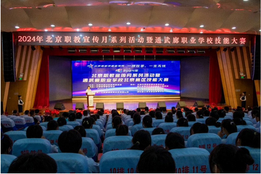
图 2-3 承办 2024 年“丹佛斯”杯通武廊职业学校北京赛区技能大赛

本次大赛是展示“通武廊”三地职业教育成果的重要手段，是加强三地职业学校相互交流、相互学习的重要平台。大赛的成功举办，为“通武廊”三地职业学校学生搭建了一个同场竞技、互通有无、互比互学、相互提高的交流平台。