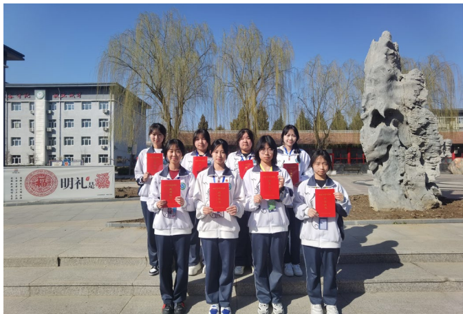
图 6-2 学生获得政府奖学金

高度重视学生资助工作，多渠道宣传资助政策，秉承公正、公平、公开的原则，严格按照上级要求认真做好学生免学费、助学金、奖学金的认定与评审工作，确保资助专项资金按时发放到学生手中。本年度，学校共有 507 名学生免除学费；82 名家庭经济困难学生获得了助学金；60 名学生获得北京市政府奖学金；2 名学生获得国家奖学金；资助政策为同学们的学业和生活提供了有力保障。此外学校注重资助育人，积极宣传获得奖学金学生的优秀事迹，为广大学生树立学习榜样，帮助学生增强自信，树立远大理想。鼓励受助学生自立自强，回馈社会。受助学生在学习和生活中展现出积极向上的态度，学习成绩稳步提升，进而促进了良好校风的形成。