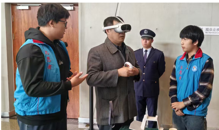
图 1-4 “剧光灯”志愿服务队走进国家大剧院台湖舞美艺术中心