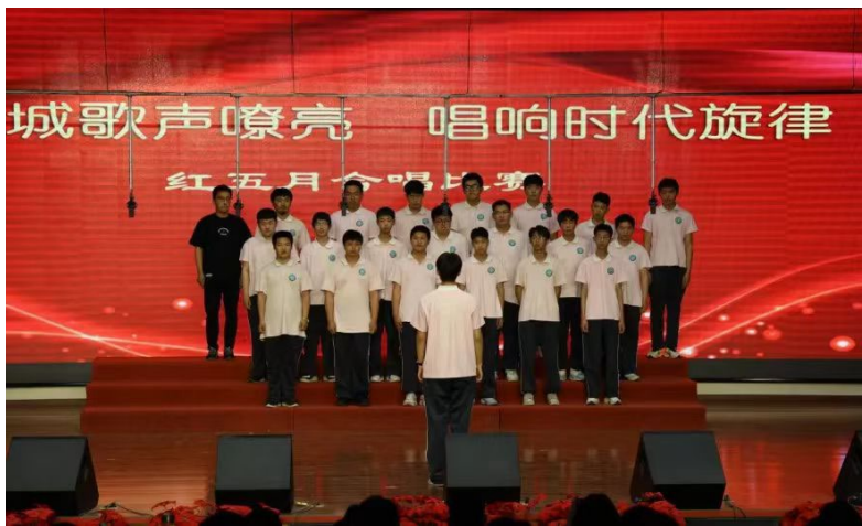
图 3-2 “红五月”合唱比赛