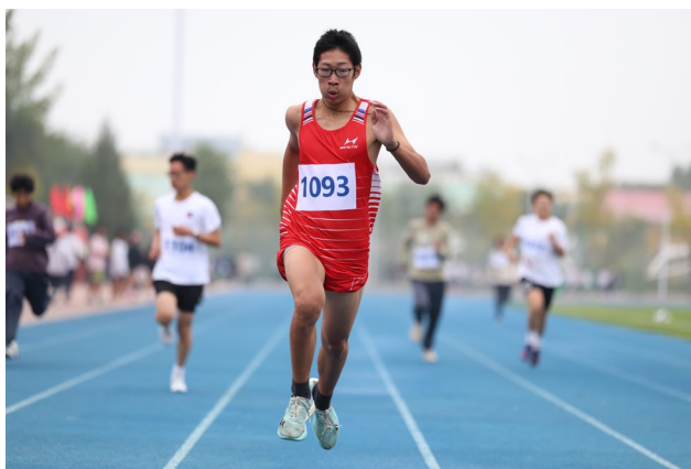
图 1-6 体育社团学生参加学校运动会

学校根据学生实际身体情况开展了一系列喜闻乐见的体育活动，帮助学生在体育锻炼中享受乐趣、增强体质、健全人格、锤炼意志，时刻践行“文明其精神，野蛮其体魄”的体育育人精神。组织学生参与校园定向越野活动，在校园内设置多个打卡点，并发放路线地图，要求学生以小组为单位，在规定时间内找到所有打卡点并完成任务。通过定向越野活动，极大地锻炼了学生的意志品质，培养了他们独立思考、自主解决问题的能力，让学生们在体育运动中实现了综合素质的提升，展现出体育活动独特的育人作用。