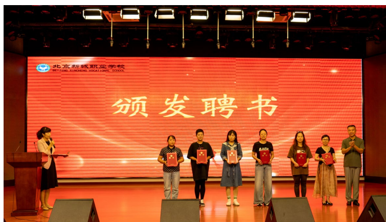
图 6-3 学校为家长颁发协同育人聘书

在此基础上，学校建立德技兼修、工学结合的协同育人模式，深度挖掘企业德育资源，邀请行业大师为学生授课，将企业文化与校园文化有机结合，拓宽德育渠道。同时，注重“以人为本”的德育教育，引导学生树立正确的就业观和人生价值观，提升职业核心能力和就业竞争力。通过系统化的职业意识、职业理想和就业观念教育，培养品德高尚、专业过硬、适应社会需求的职业人才，为学生未来的发展奠定坚实基础。