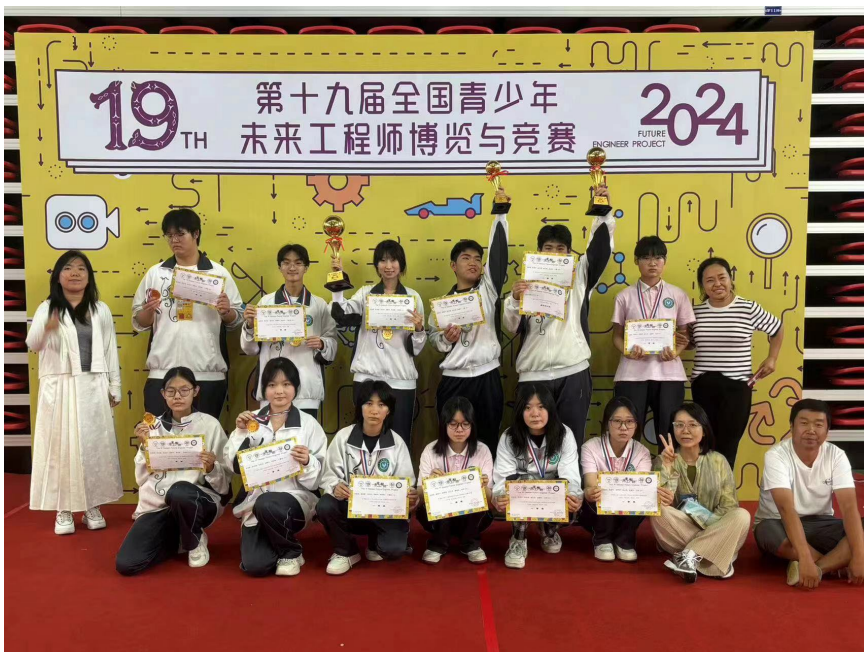
图 1-3 “创意花窗”赛项荣获国赛冠军

指导教师根据劳动教育项目内容，制定资源整合方案，对校内外劳动教育资源进行统筹整合。学生积极参与并按专业分组，将专业技能与创新设计项目相结合，其中保育员专业的劳动教育项目“创意花窗”获得全国青少年“未来工程师”博览与竞赛冠军。通过劳动实践活动，学生可以更好地了解专业技能和技巧，增强专业技术与实际工作相结合的经验，为就业和职业发展提升了竞争力，实现了以技能展优势，以劳动促发展的目的。