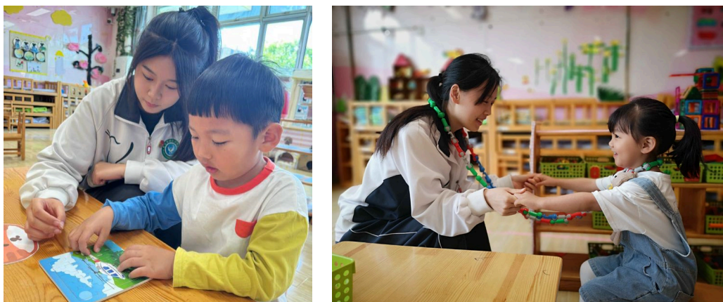
图 5-1 幼儿保育专业学生在幼儿园实习

这场实习，不仅让同学们完成了从“中职生”到“教育工作者”的华丽转身，更积累了宝贵经验。相信同学们未来定能在幼教之路绽放光彩，精心培育祖国的希望之花。