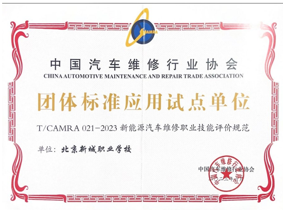
图 1-13 学校成为中国汽车维修行业协会团体标准应用试点单位

学校积极推进与行业、企业技术研发工作，参与中国汽车维修行业协会制订的《新能源汽车维修职业技能评价规范》应用，并成为团体标准应用试点单位。