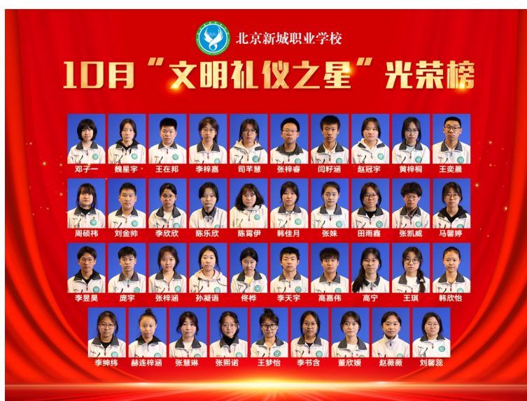
图 1-1 “文明礼仪之星”光荣榜

在北京新城职业学校这片青春洋溢的校园里，有一场“美丽角逐”每月准时拉开帷幕——文明礼仪之星评比，她宛如一场绚丽多彩的文明盛宴，正悄然重塑着校园风貌。每学期初学校制定并发布文明礼仪之星评选活动方案，通过广泛宣传，全体学生了解活动的目的、意义和评选标准。评选对形象礼仪、课堂礼仪、课间礼仪、校园活动礼仪等提出要求，各班每月进行民主评议，结合候选人的日常表现推出班级的文明礼仪之星。开展评选文明礼仪之星活动使整个校园沉浸在温和、有序的氛围中，文明意识不再是高悬的标语，而是化作同学们下意识的举手投足，个人素养也在一次次文明实践里生根发芽。每一位同学都是一朵潜力无限的文明之花，在这场评比的滋养下，正绚烂绽放，让校园处处芬芳！