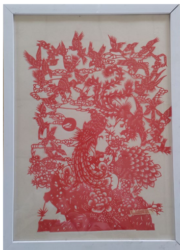
图 3-1 学生实践非遗作品

精心组织丰富多彩的传统文化活动，涵盖经典诗词诵读、传统书法绘画展示以及民俗手工体验等。同学们热情高涨，积极参与。在诗词诵读环节，大家声情并茂，领略诗词韵味；书法绘画现场，一幅幅作品展现出对传统艺术的独特理解。非遗手工体验更是趣味十足，剪纸、制作花窗等让同学们感受到非遗文化的魅力。通过这些活动，不仅加深了学生们对传统文化的认识，激发了他们传承文化的责任感，更营造了浓郁的校园文化氛围，让传统文化在学生心中扎根、发芽、绽放光彩。