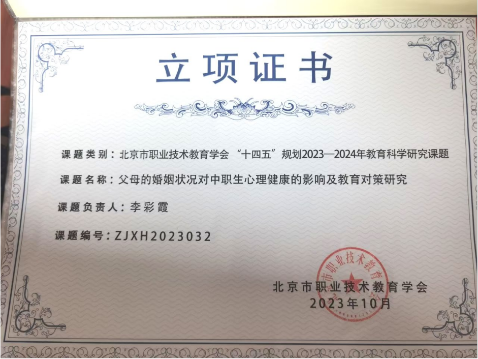
图 1-12 市级课题《父母的婚姻状况对中职生心理健康的影响研究》

该研究成果目前已经在学校班主任培训会上分享和推广，可以帮助班主任筛查班级中可能存在心理健康问题的学生。