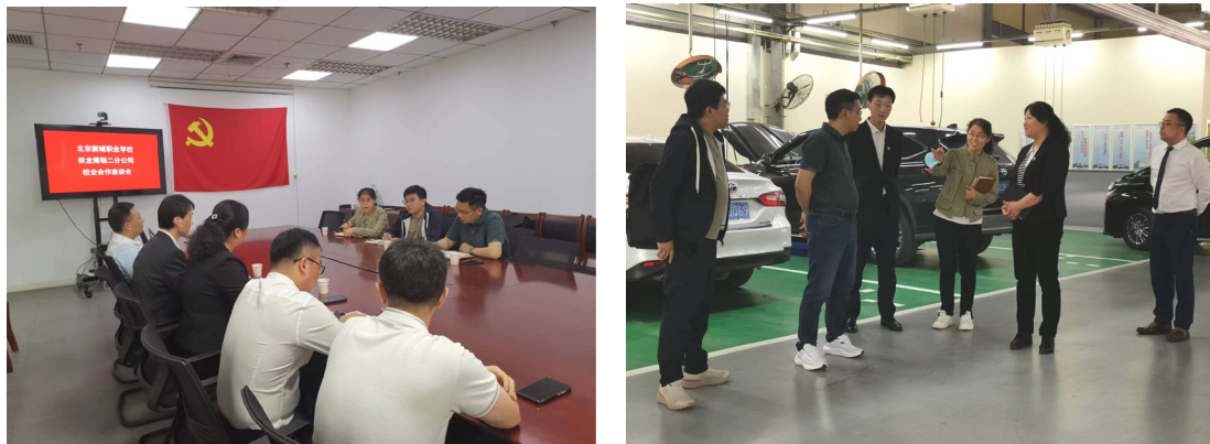
图 1-9 汽修专业学生到北京祥龙博瑞公司实习实践

学校与祥龙博瑞公司合作，开展“工学结合”式校企合作培养。企业根据需求制定培养方案，学校负责实施教学。学生在校期间能够接触到企业的实际工作环境，毕业后到企业实习。这种合作模式不仅提高了学生的就业率，还为企业输送了技能型人才。