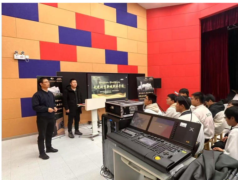
图 6-4 四方联动：邀请企业人员进课堂