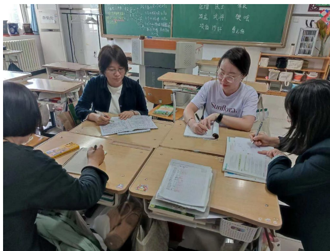
图 2-4 赤峰卫生学校跟岗教师参加课后交流会

跟岗期间，学校采取专家讲座，说课比赛，校内听课，备课活动等形式分层次从理论到实践，让交流活动效果落地。