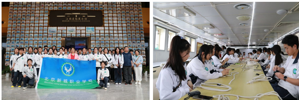
图 1-2 研学活动——参观江南造船厂、体验水手绳结课程

通过研学，学生们不仅领略了祖国的大好河山、革命的光荣历史和改革开放的伟大成就，更树立了大国工匠的崇高理想，点亮了心中智慧的明灯，为未来的发展奠定了坚实的基础。