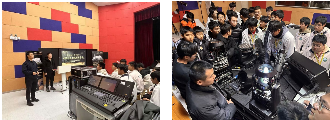
图 1-7 国家大剧院台湖舞美艺术中心专业老师进校宣讲

舞台艺术设计与制作专业与国家大剧院台湖舞美艺术中心等企业合作，共同推动产教融合。学校与企业共同制定人才培养方案、构建课程体系、共建实训基地等。学生在校期间可以参与到企业的实际项目中，了解舞台艺术设计与制作的流程和要求。同时，企业也经常走进学校为学生讲解专业知识，为学生的职业发展提供了有力支持。