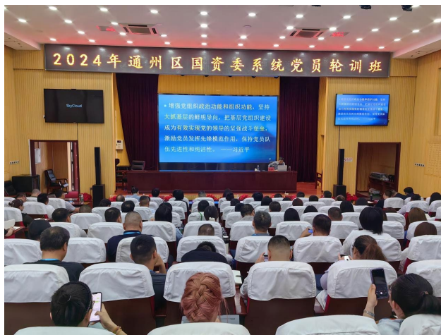
图 2-1 通州区国资委系统党员轮训班