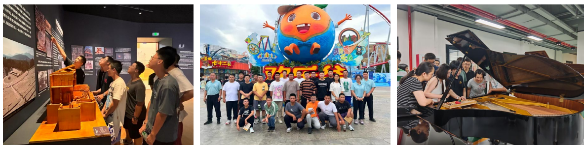
图 5-2 学生走进企业参观与实践

此次校企合作入学教育，是学校与三家企业人才培养合作的良好开篇，更是产教融合新探索的里程碑。双方期待深化合作，培育更多大国工匠，助力学子逐梦前行，满载而归。