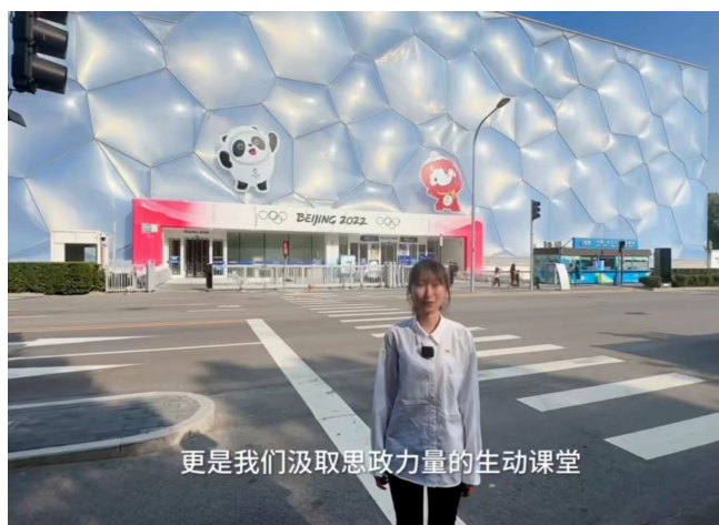
图 1-5 参赛学生讲《中国花样游泳 信念之光 梦想之舞》思政课

2024 年首次参加由北京市教育委员会举办的“激昂青春展风采 强国有我新征程”职业学校学生讲思政课比赛，提交的《中国花样游泳 信念之光 梦想之舞》、《运河文化映青山，共话时代新征程》、《怀鸿鹄之志，展骐骥之跃》三个作品均荣获三等奖。比赛不仅锻炼了学生们的研究能力、表达能力和团队合作能力，也进一步坚定了他们的理想信念，增强了他们的社会责任感和历史使命感。学生们纷纷表示，将以此次比赛为契机，继续深入学习思政知识，关注时事热点，提升自身素养，努力成长为德智体美劳全面发展的社会主义建设者和接班人，为国家的发展和民族的复兴贡献自己的智慧和力量。