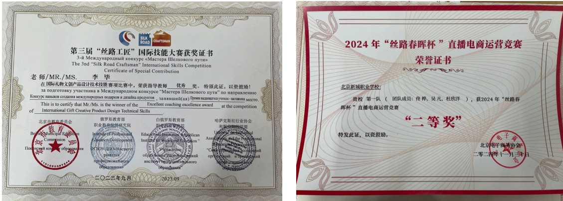
图 4-1 “丝路工匠”、“丝路春晖杯”比赛获奖