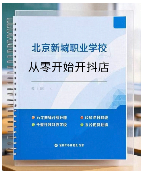
图 1-8 活页式教材

实的基础。同时成立了大师工作室，并与企业共同开发撰写了活页式教材《从零开始开抖店》，内容涵盖了电子商务数据分析的基本理论、方法和实践案例。系统讲解了如何在抖音开网店，以及媒体运营的基本理论、策略和实践技巧。教材采用活页式装订，学生在学习过程中，可以根据实际任务需求，随时替换或加减内容。学习完成后保存相关活页。这种教学方式大大提高了学生的学习兴趣 and 效率。学生通过学习，掌握新媒体运营的核心技能，为未来的职业发展做好准备。