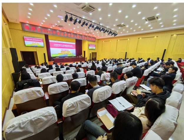
图 2-2 通州区事业单位新入职人员初任培训

承接通州区 2024 年事业单位新入职人员初任培训，参培人数 162 人。根据《事业单位人事管理条例》（国务院令第 652 号）和《事业单位工作人员培训规定》（人社部规〔2019〕4 号）相关要求，通州区开展事业单位新入职人员初任培训培训。通过培训，使新聘用人员全面提升政治理论素养和法律素质，增强大局意识、公仆意识和责任意识，掌握岗位必备知识，尽快完成角色转变，为北京城市副中心建设做好保障。。