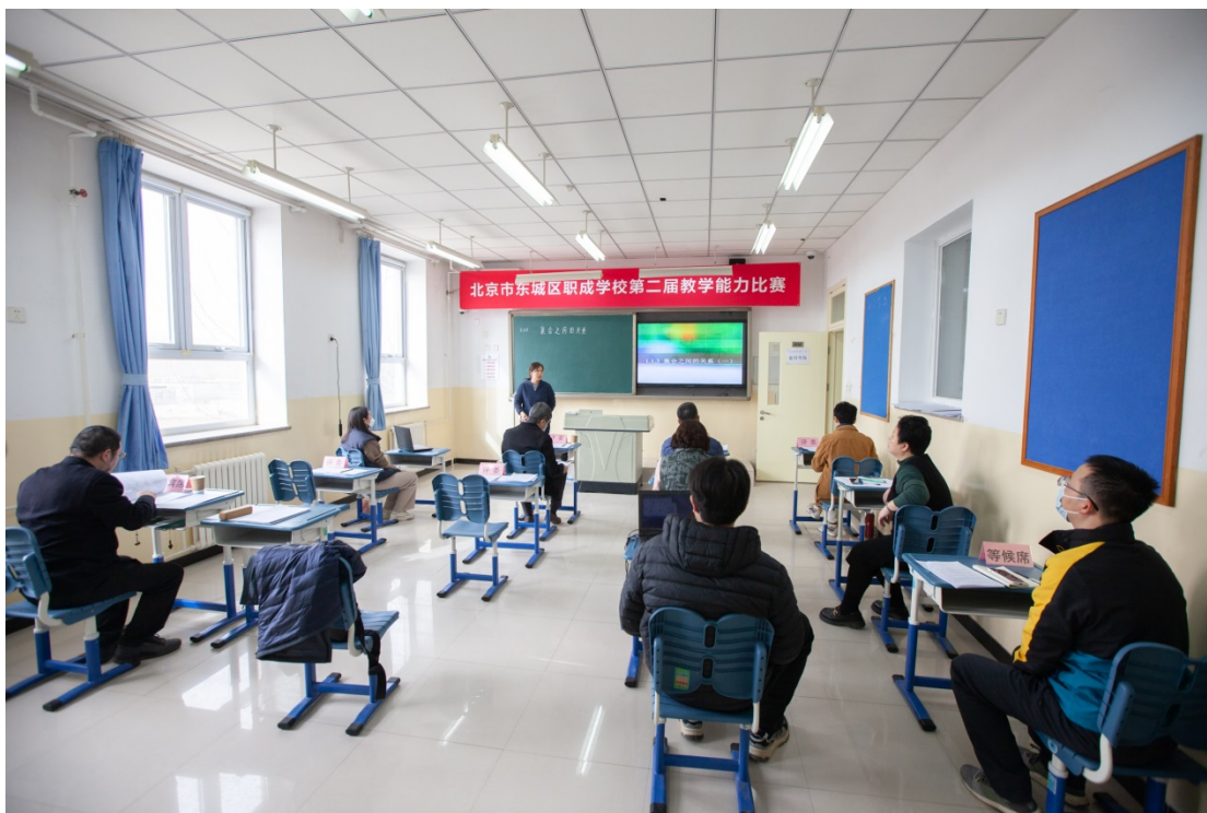
图 21：2023 年 3 月举行“北京市东城区职成学校教学能力比赛校级预选赛”活动