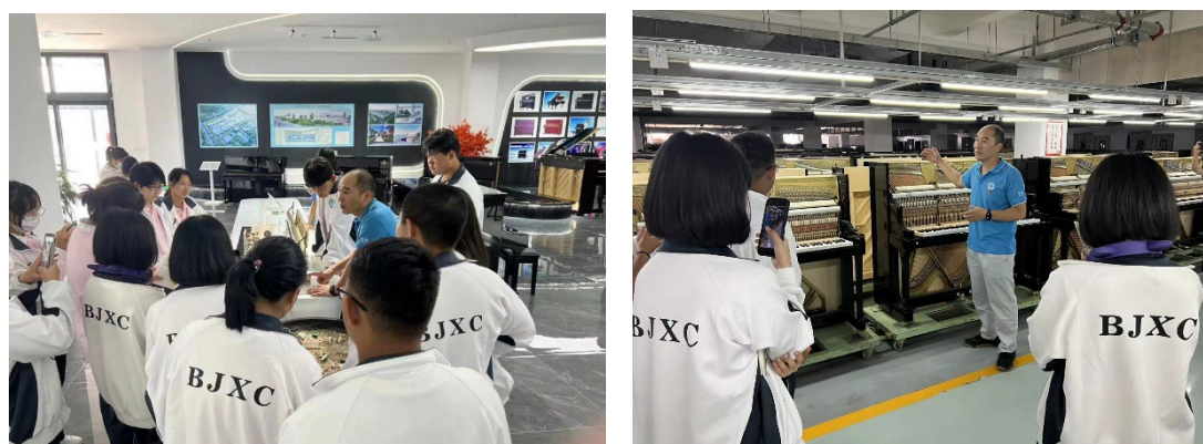
图 5 学生走进星海钢琴集团实践体验

在与星海钢琴的深度合作中，教师和企业专家积极创新教学方法与手段，共同推动课堂教学改革。课堂不再拘泥于教室，教学也不再是教师的单向传授，注重学生职业技能和职业素养的培养。运用项目化教学、真实工作任务驱动教学、案例分析和情景教学法，推进教学训做评一体化。依据人才培养目标和教学目标，精准对接企业需求，以“企业和岗位要求”为目标，融入产业行业企业最先进的元素到教学过程中，逐步调整完善以能力为本位、理论知识与实践技能一体化的课程体系。