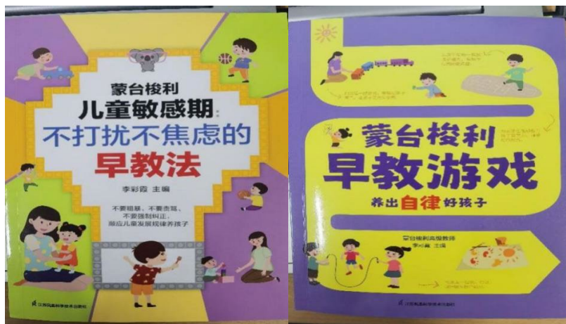
图 8 李彩霞老师主编教材正式出版