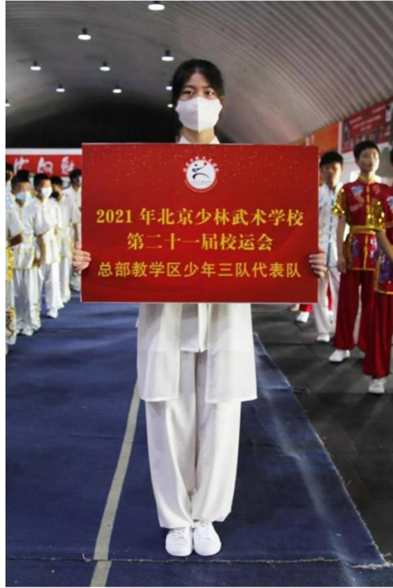
图 5：校运会 3

共青团活动：学校党委、行政高度重视并热情支持共青团的建设和团委开展的各项活动，定期听取团委工作汇报，经费、场地、人员等具体问题上不遗余力地的给予支持。