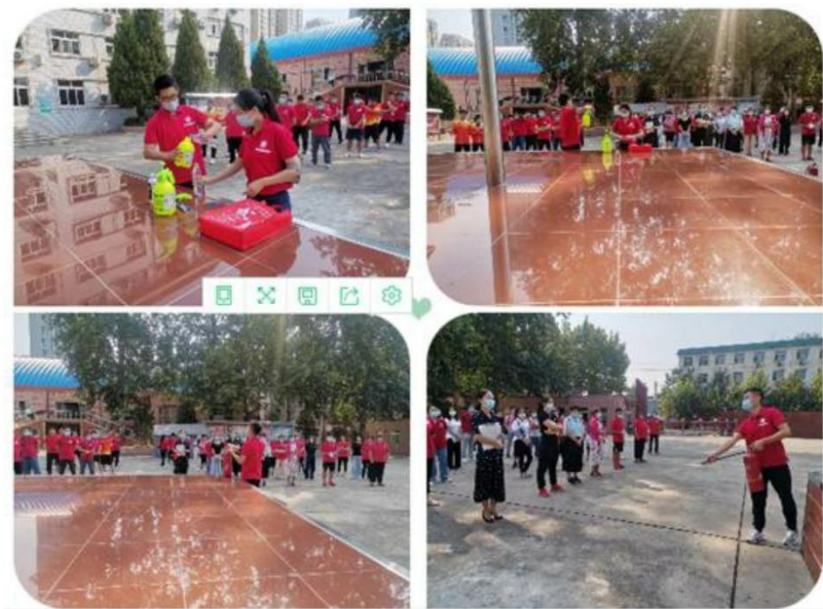
图 24：员工培训 3