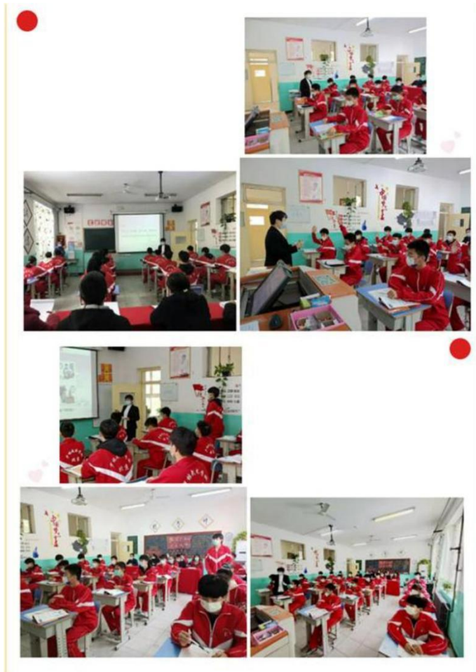
图 13：思想政治示范课