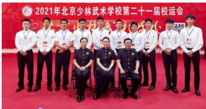
图 4：校运会 2