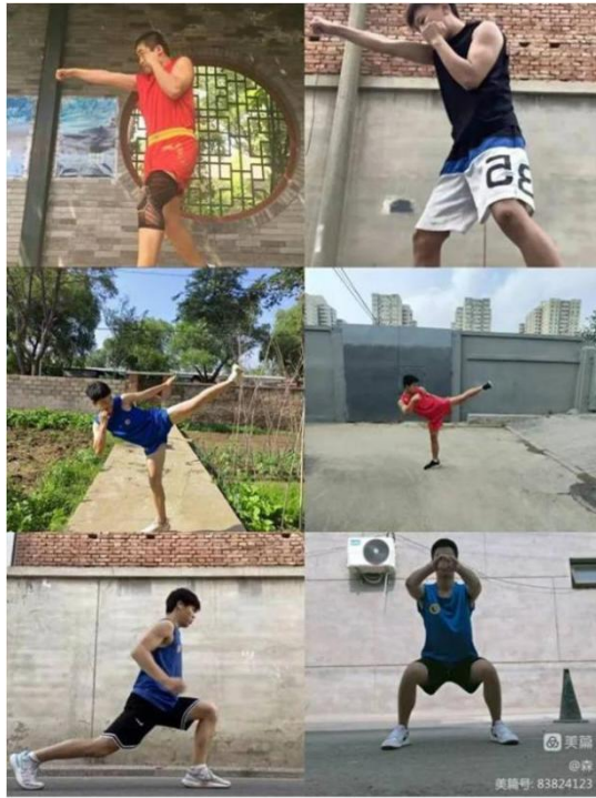
图 19：线上武术课 3