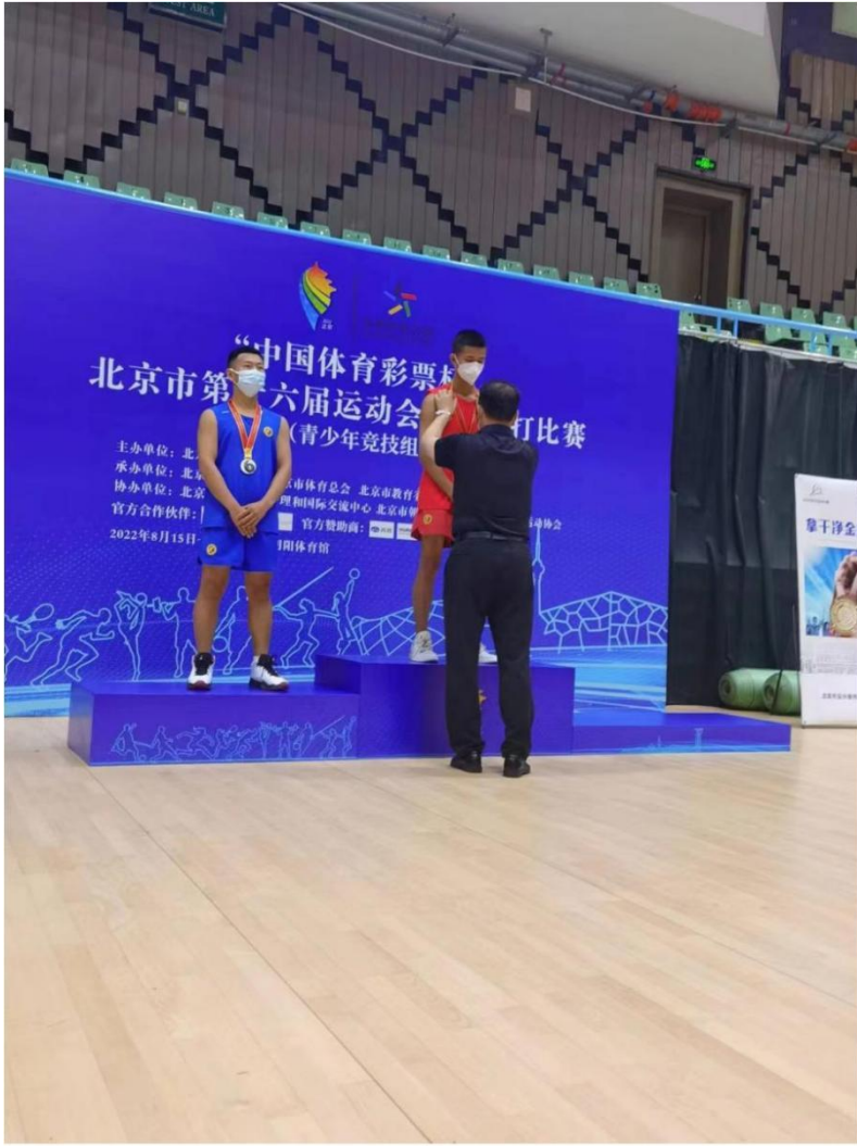
图 10: 北京市第十六届运动会武术散打比赛 1