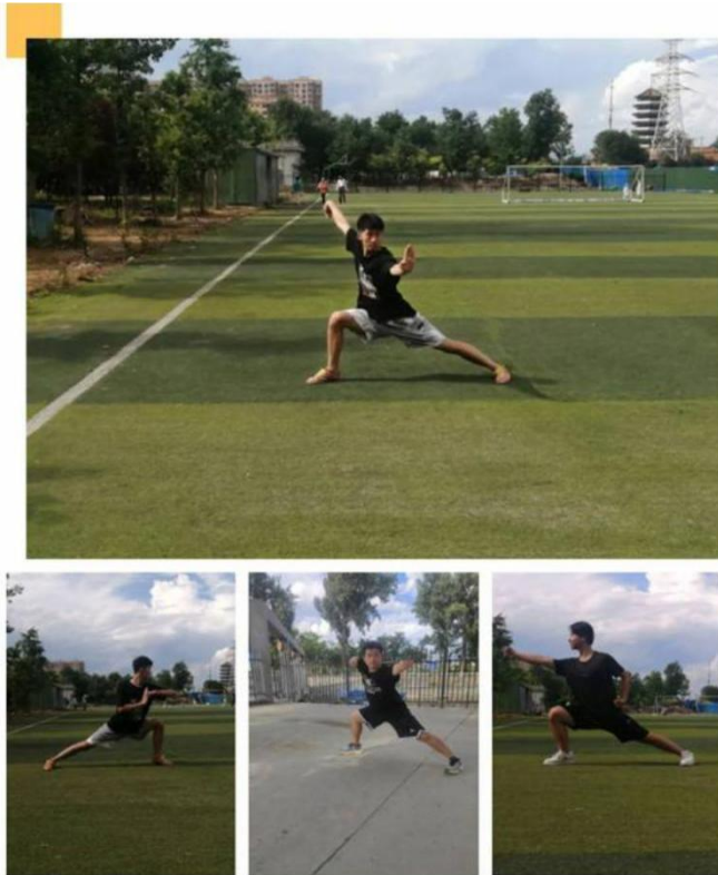
图 17：线上武术课 1