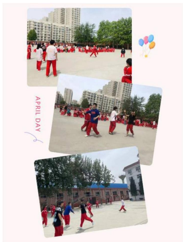
图 8：学生课余活动 2