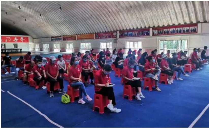
图 23: 员工培训 2