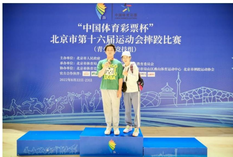
图 9：京市第十六届运动会摔跤比赛

2022 年 8 月 22 日至 23 日在燕山体育馆举行了北京市第十六届运动会摔跤比赛。本次比赛有 11 个单位参赛共计 473 名运动员。学校选派 4 人共获得：第三名 1 人、第五名 1 人。