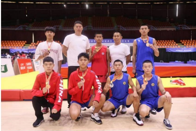
图 11：北京市第十六届运动会武术散打比赛 2