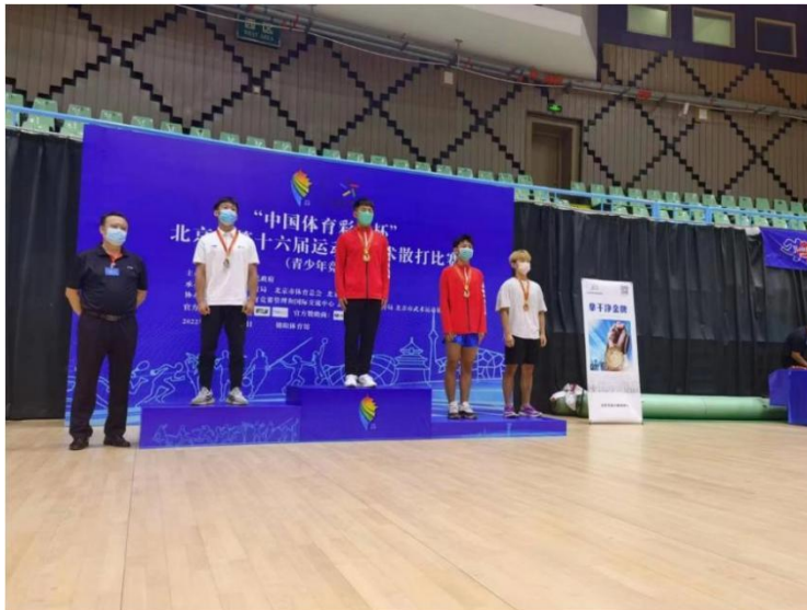
图 12：北京市第十六届运动会武术散打比赛 3