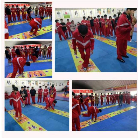
图 7：学生课余活动 1