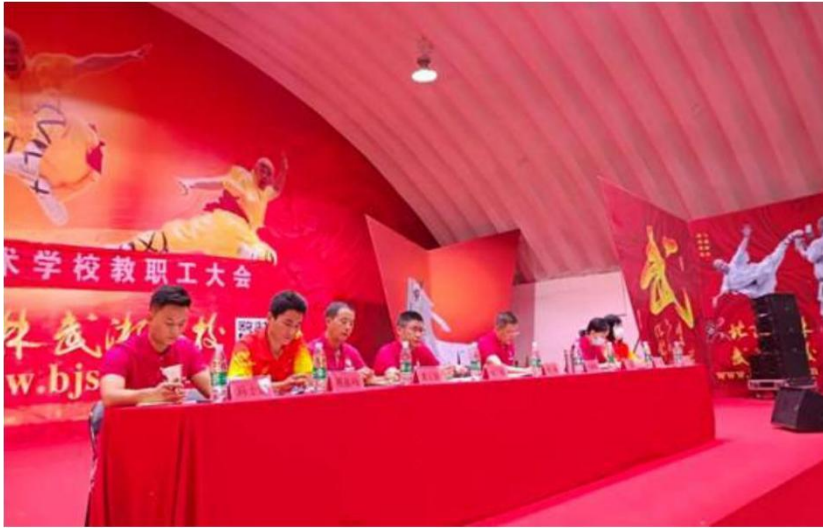
图 22: 员工培训 1