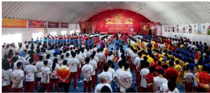
图 3：校运会 1

八、认真组织一年一度的演武大会、校运会、篮球赛等活动，达到思想教育、体育锻炼、展示特长、丰富校园文化生活的目的。