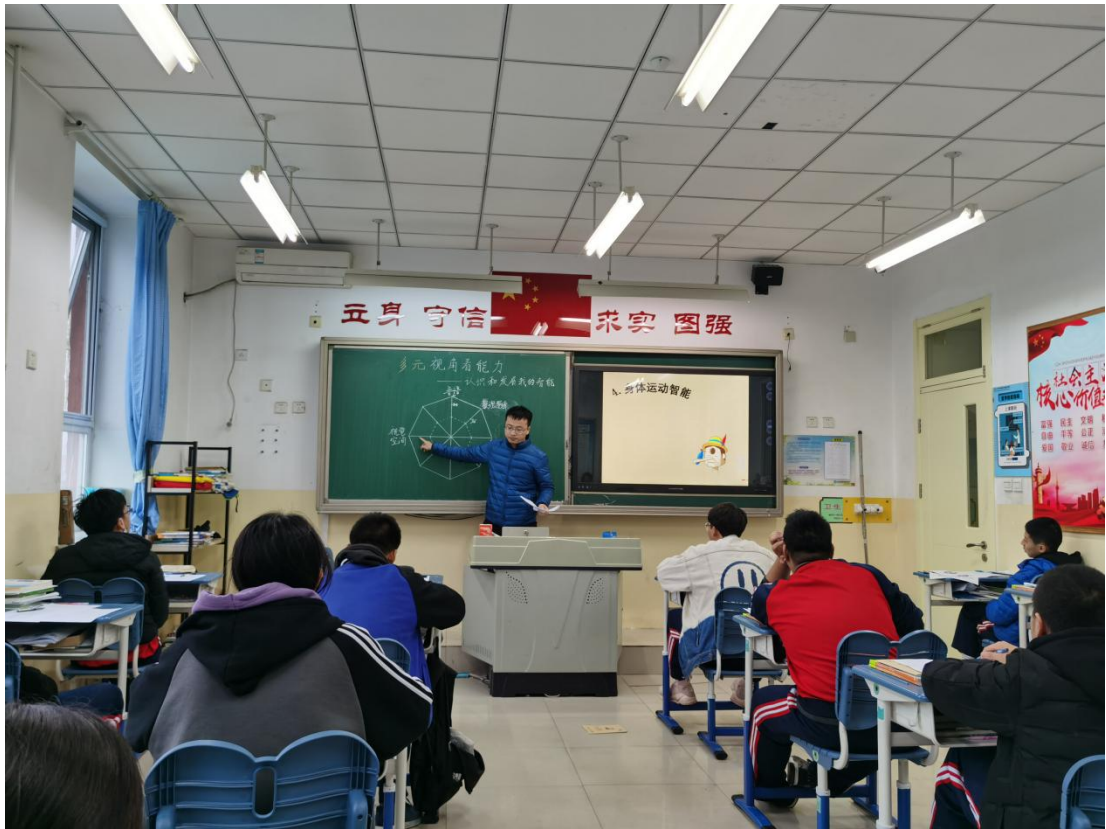
图 7：2021 年 11 月青年教师展示课