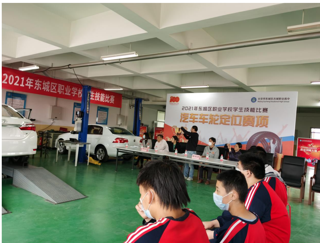
图 5：2021 年 4 月东城区职业学校学生技能比赛汽车车轮定位赛项比赛现场

学们的“工装照”，对每月技能比赛的上榜同学以放大的工装照张榜公布，以此激励同学们学习工匠精神，踏实苦练，提升技能操作水平。