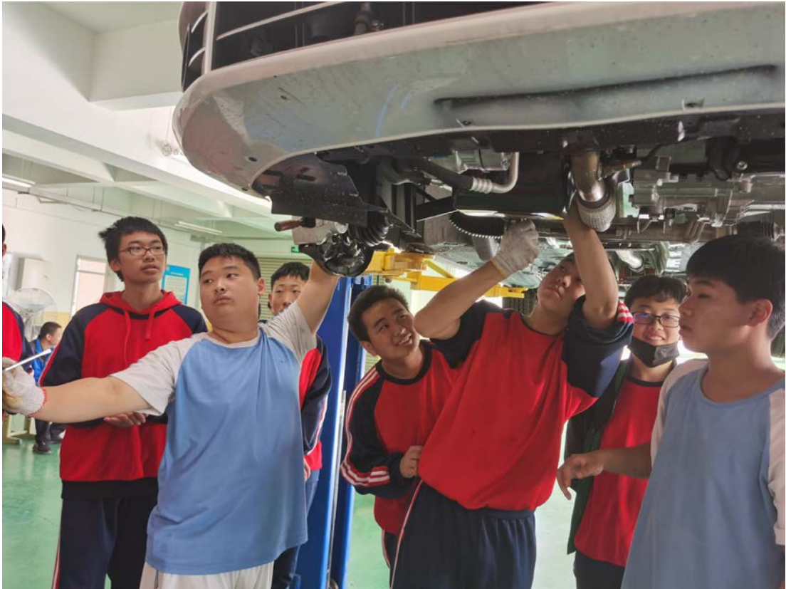
图 8：2021 年 10 月聘请企业技师开展真车实践教学