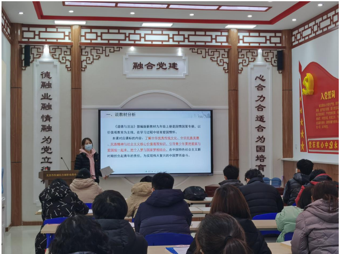
图 6：2021 年 10 月开展教师校本教研活动

学校立足专业发展，在青年教师的培养方面，坚持理论联系实际的原则和教师自主发展的原则，引导青年教师走专业化成长之路，丰富和提升教育教学理论，提高教育教学技能和专业技能，以适应新形势下的教育教学理念，提高本专业的办学水平。学校通过建立青年教师发展工作室、师徒结对、定期听评课制度、组织教学技能竞赛、走访实习企业、聘请专家指导等方式，努力做好青年教师的培养工作，使青年教师快速成长。