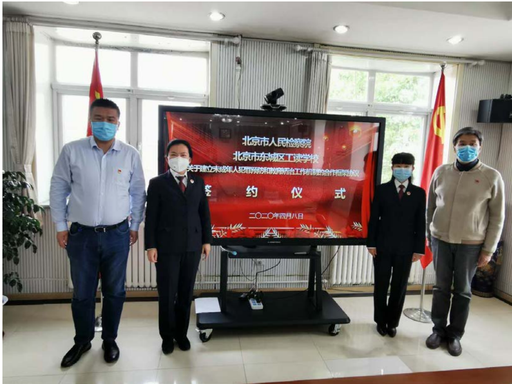
图 10：与市人民检察院合作建立未成年人犯罪预防和教育矫治工作合作框架