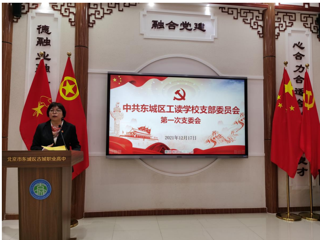
图 2：2021 年 12 月学校党支部召开支委会图片

学校坚持党对学校工作的全面领导，严格执行民主集中制，通过支委会、党务会、校务会等组织不断完善议事决策的规则与流程。做好主题党日、我讲微党课、我是宣讲员等活动，不断强化学习的内容与形式，加强廉洁教育、党性教育。近两年，学校在做好疫情防控常态化工作的基础上，以党建为引领，守初心、担使命，着力做好学校治理、队伍建设、素质教育三项重点工作，彰显学校“办适合学生的教育”的育人目标。学校充分发挥党组织的战斗堡垒作用和党员先锋模范作用，党支部坚持为党育人、为国育才的政治方向，坚持社会主义办学方向，以立德树人为根本目标，始终将学习贯彻习近平新时代中国特色社会主义思想等重要讲话精神作为首要任务，不断强化“四个意识”，坚定“四个自信”，做到“两个维护”，通过“三会一课”武装头脑、指导实践，推动各项工作。