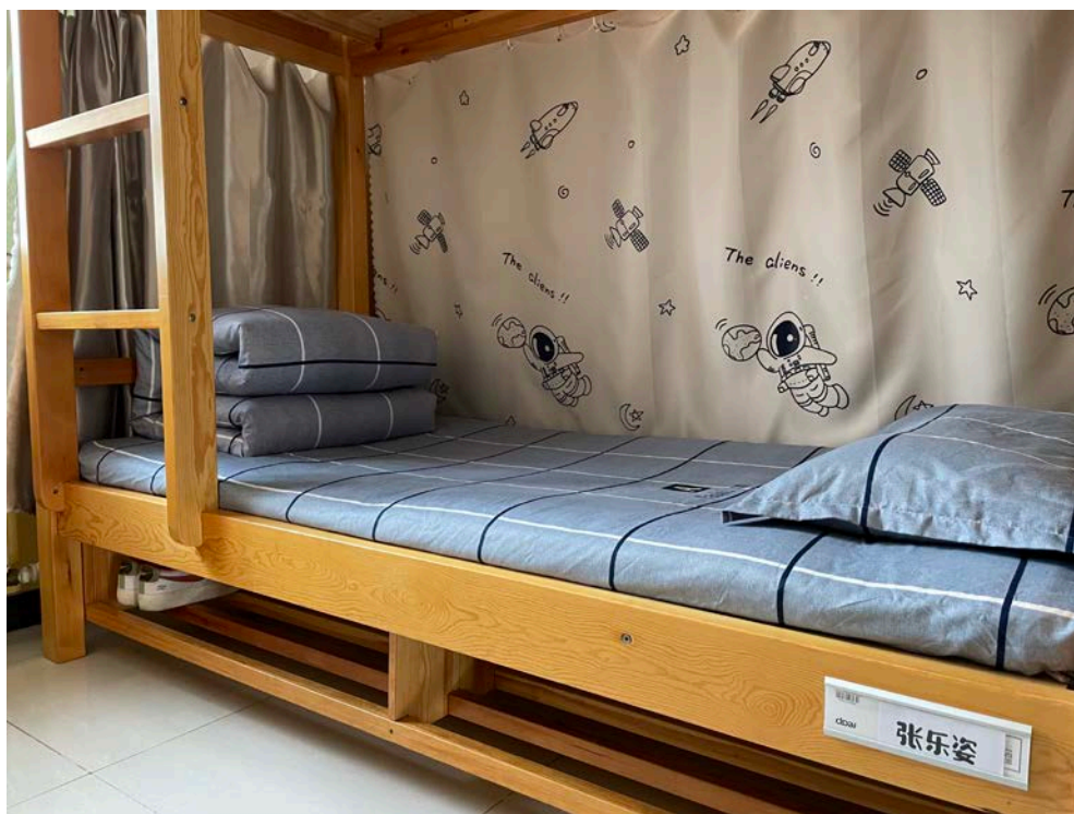
图 11：2022 年 10 月学生内务评比活动

在对学生的日常规范养成教育中，将卫生习惯的培养作为重点抓手，提出明确的内务卫生标准和规范要求，每周随时检查。特别是疫情以来，学校加强了内务卫生的要求，良好的内务卫生习惯已经内化成为学生受益终身的优秀品质，这也成为毕业生深受用人单位好评的重要方面。为维护校园安全，严格入校安检制度，把好校园安全第一关。在区教委支持下，提供政府采购程序购置透视安检设备，要求学生及家长以维护校园公共安全秩序为己任，严格遵守安检制度，每周一返校时，进行人物分检，有效杜绝了危险物品入校的隐患，为广大师生营造出安全的校园净土。在入校安检过程中，小到香烟、火机，大到弹弓、甩棍……安防工作为大家守住了学校安全的第一条防线。