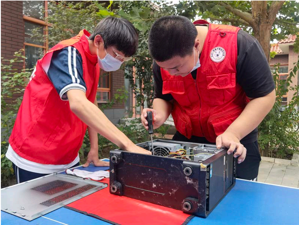
图 4-1 大兴一职开展“助力家乡，我在行动”乡村振兴活动