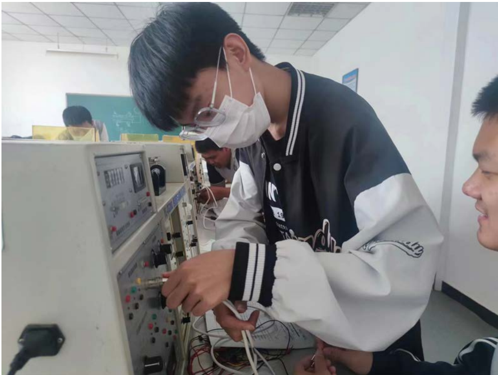
图 1-3 大兴一职开展“勤学敬业向未来”主题社团活动