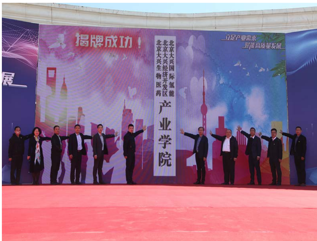
图 2-2 大兴一职成立三大产业学院浮囊高质发展