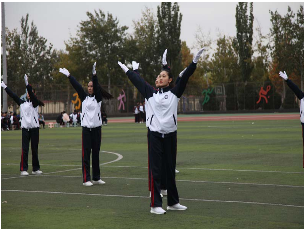
图 1-2 大兴一职广播操比赛

大兴一职以习近平总书记关于教育的重要论述为根本遵循，全面坚持立德树人的根本任务，坚持五育并举，创新德育实践，着力构建具有职业教育特色的育人新格局。依托专业建设打造各具特色的班级文化，落实学生一日常规，同时开展丰富多彩的校园文体活动，篮球、乒乓球赛、跳绳比赛，队列礼仪广播操大赛、自编操比赛，每月班级小视频评比，每月的文明班级、文明宿舍、文明个人评比，星社团优秀学员评选，持续做好学生自主学习手册的使用管理，培养学生养成良好的自主学习能力。见图 1-2