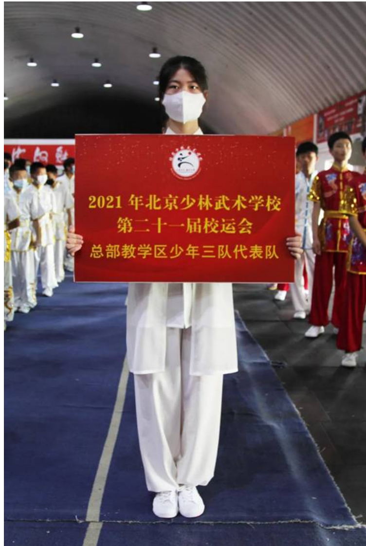
图 5：校运会 3

共青团活动：学校党委、行政高度重视并热情支持共青团的建设和团委开展的各项活动，定期听取团委工作汇报，经费、场地、人员等具体问题上不遗余力地的给予支持。