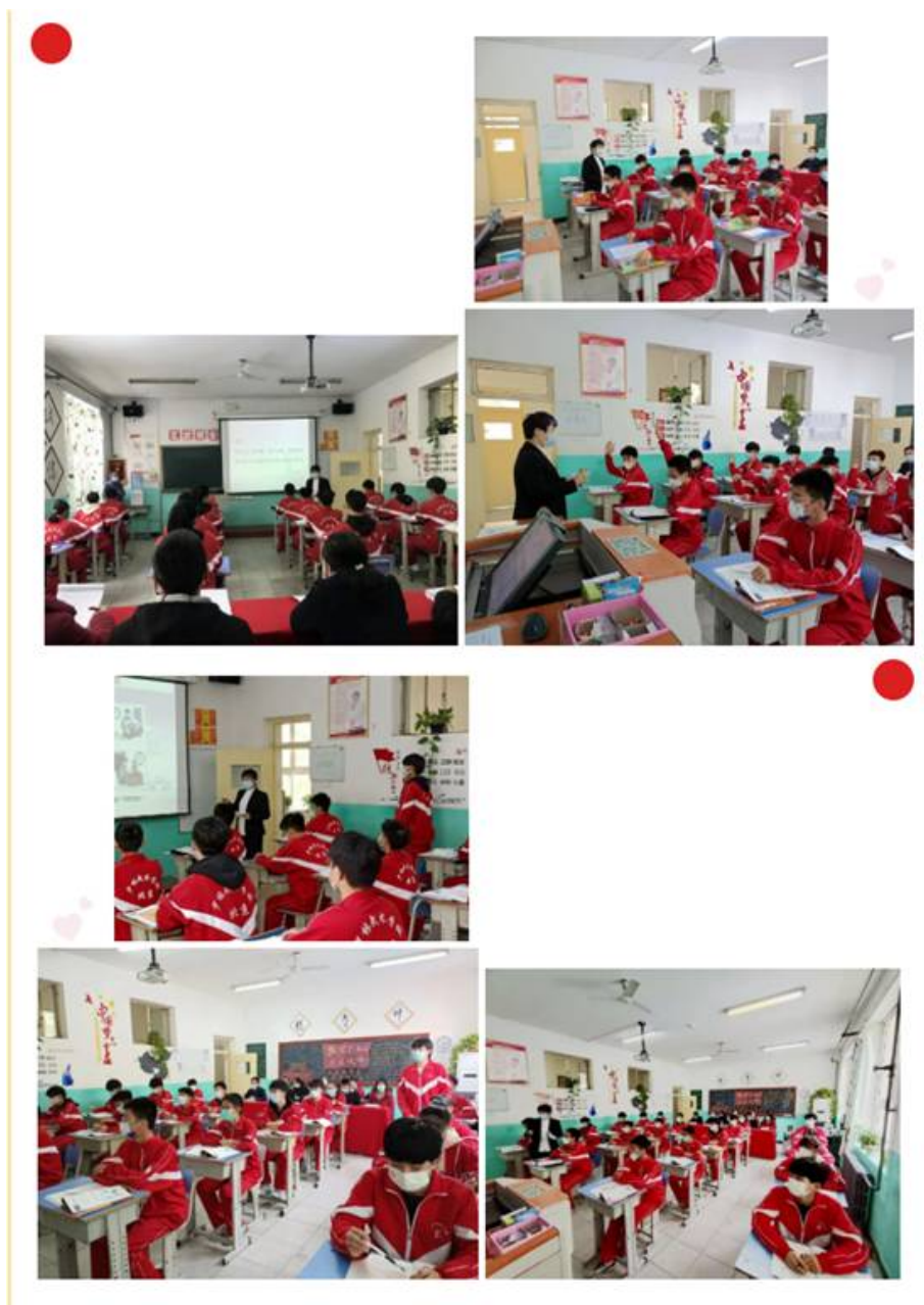
图 13：思想政治示范课