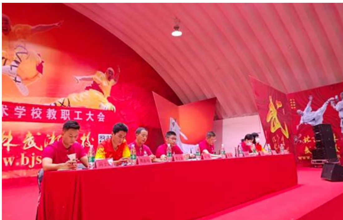
图 22：员工培训 1