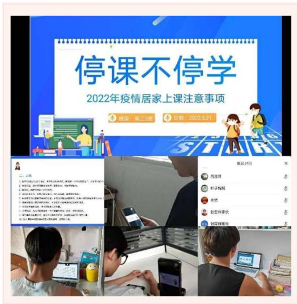
图 15：线上教学家长会