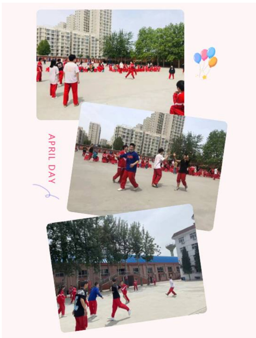
图 8：学生课余活动 2