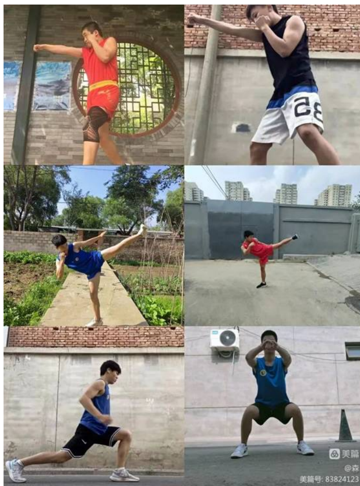
图 19：线上武术课 3