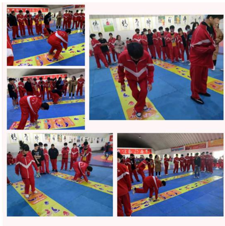
图 7：学生课余活动 1