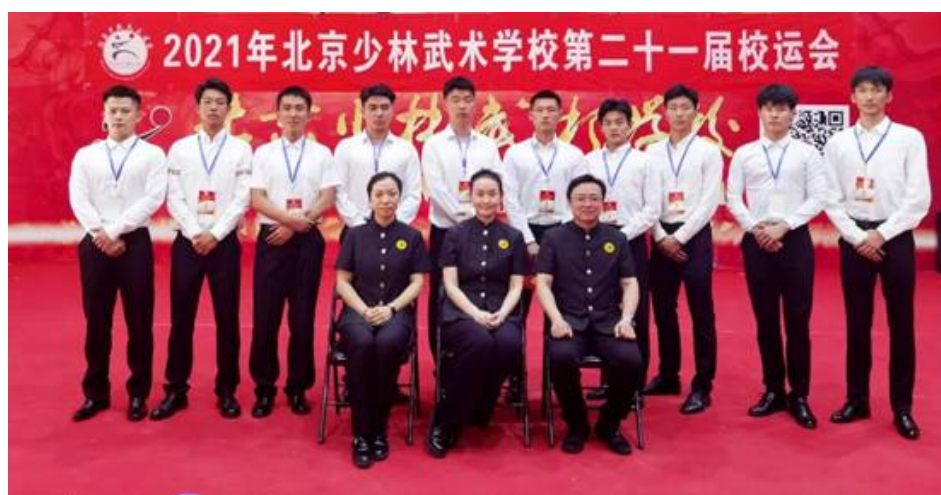
图 4：校运会 2