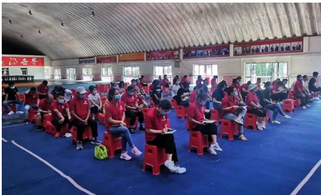
图 23：员工培训 2