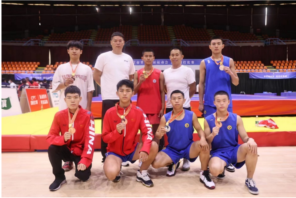
图 11：北京市第十六届运动会武术散打比赛 2