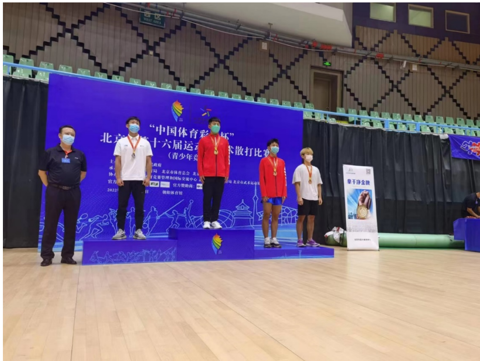
图 12：北京市第十六届运动会武术散打比赛 3