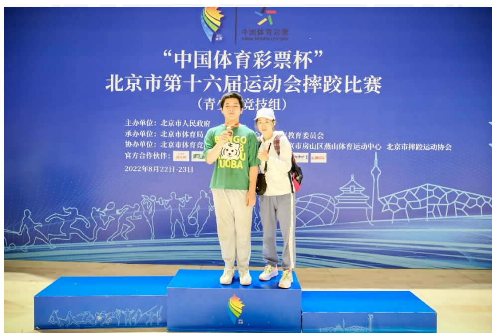
图 9：京市第十六届运动会摔跤比赛

2022 年 8 月 22 日至 23 日在燕山体育馆举行了北京市第十六届运动会摔跤比赛。本次比赛有 11 个单位参赛共计 473 名运动员。学校选派 4 人共获得：第三名 1 人、第五名 1 人。