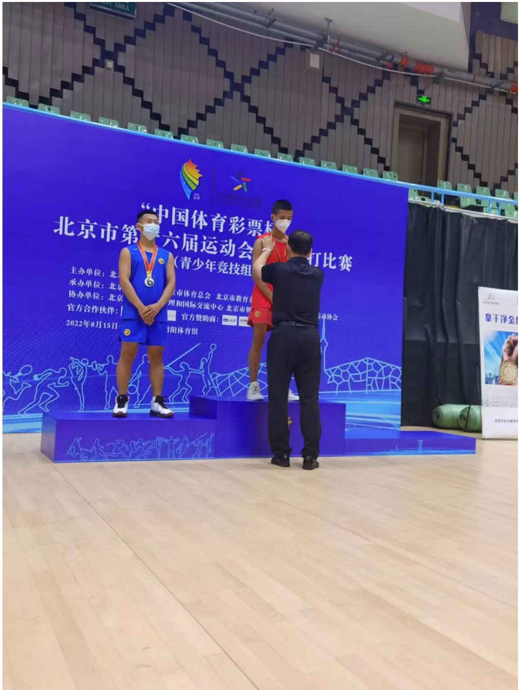
图 10: 北京市第十六届运动会武术散打比赛 1