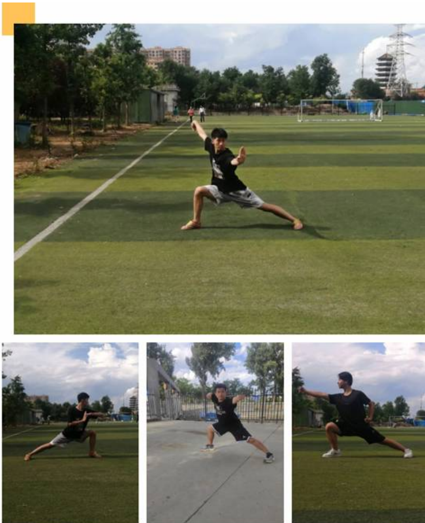
图 17：线上武术课 1