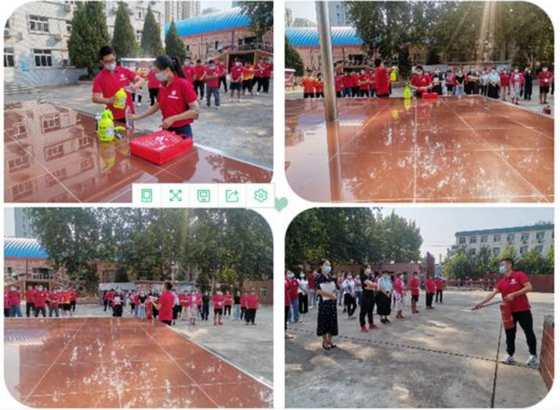
图 24: 员工培训 3