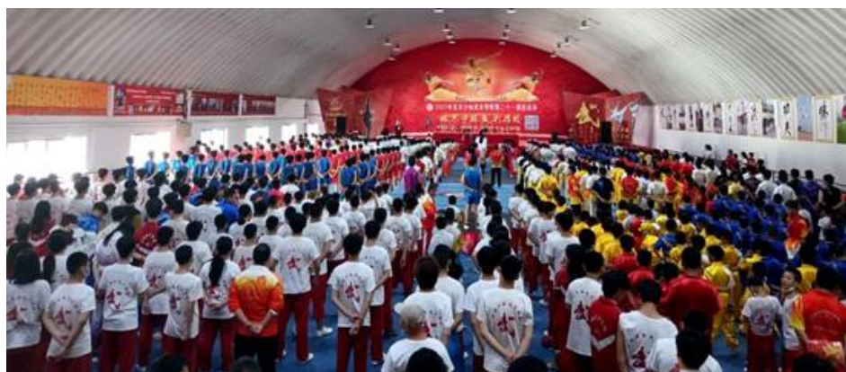
图 3：校运会 1

八、认真组织一年一度的演武大会、校运会、篮球赛等活动，达到思想教育、体育锻炼、展示特长、丰富校园文化生活的目的。