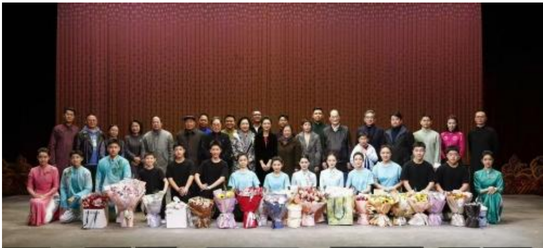
图 2-12 北戏教师能力提升项目专场演出合影

两场备受关注的优秀教师及团队专场演出活动，是2024年北戏教师能力提升项目的重要成果之一，旨在通过专项资金支持优秀教师及其团队举办专场演出的方式，强化学院教师艺术实践能力，助推学院高水平“双师”队伍建设，该项目从设立之初就受到了广大教师的广泛关注和积极参与，除支持专场演出之外，项目还包含了支持学院教师调查研究计划、观摩交流计划等多项内容。未来，学院将进一步丰富项目支持举措，强化与教师能力建设需求的匹配度，不断促进人才队伍建设，推进学院职业教育高质量发展。