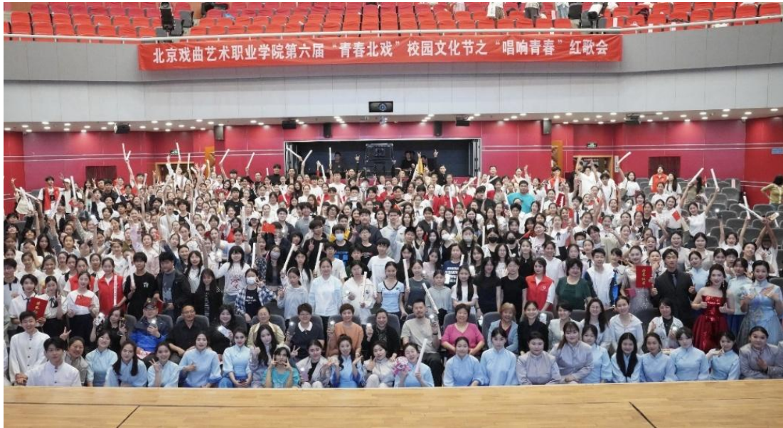
图 2-2 北戏第六届红歌会活动现场

风采的重要舞台。同学们在表演中感悟先辈信念，汲取奋进力量，以青春风貌将红歌热情转化为学习动力，在弘扬传统文化中锤炼本领，让青春在推动文化繁荣中绽放光彩。