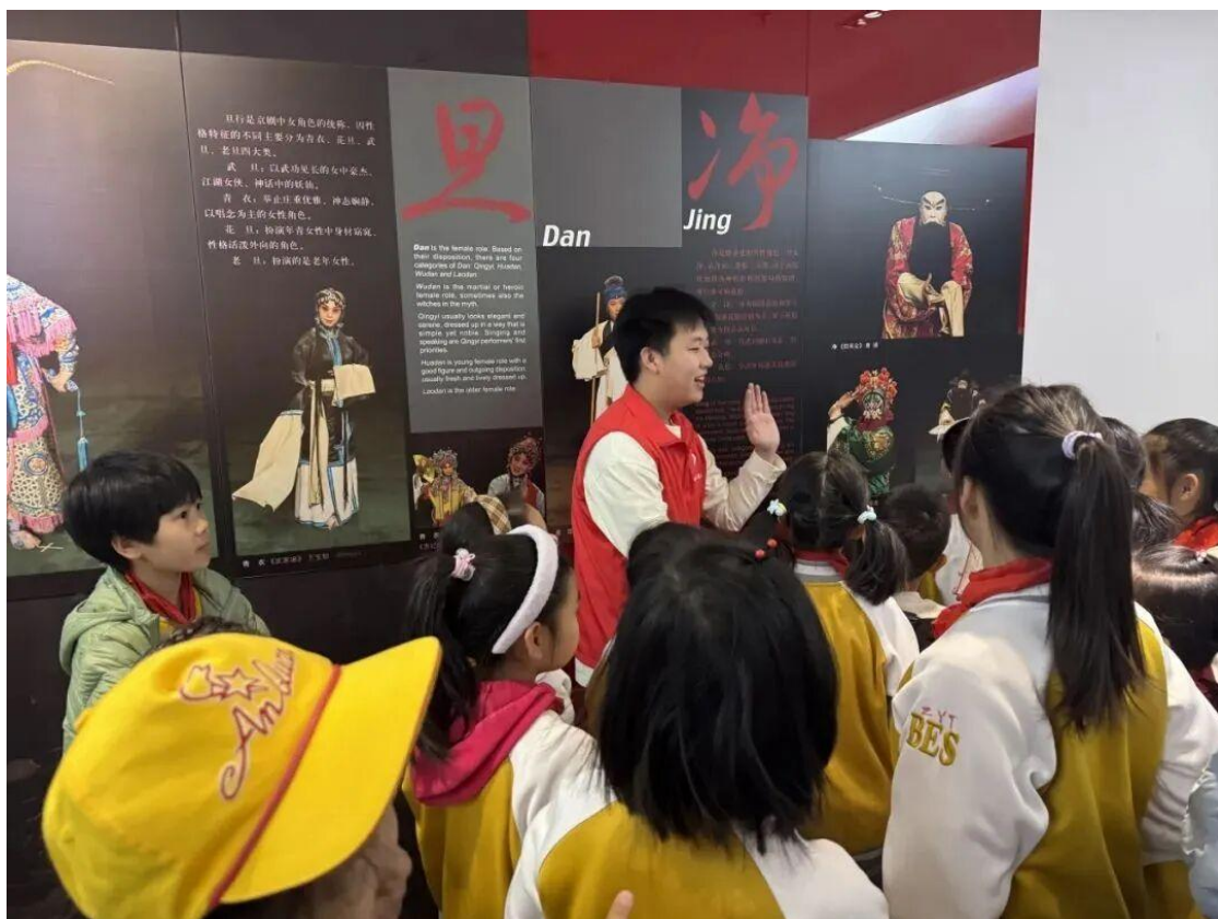
图 4-1 “艺培学堂”活动现场

“艺培学堂”系列学习活动通过沉浸式、互动性的方式，为青少年上了一堂生动的传统文化启蒙课，帮助孩子们从小接触并理解京剧艺术，增强文化自信，为国粹在新时代的传承与焕新贡献了北戏力量。