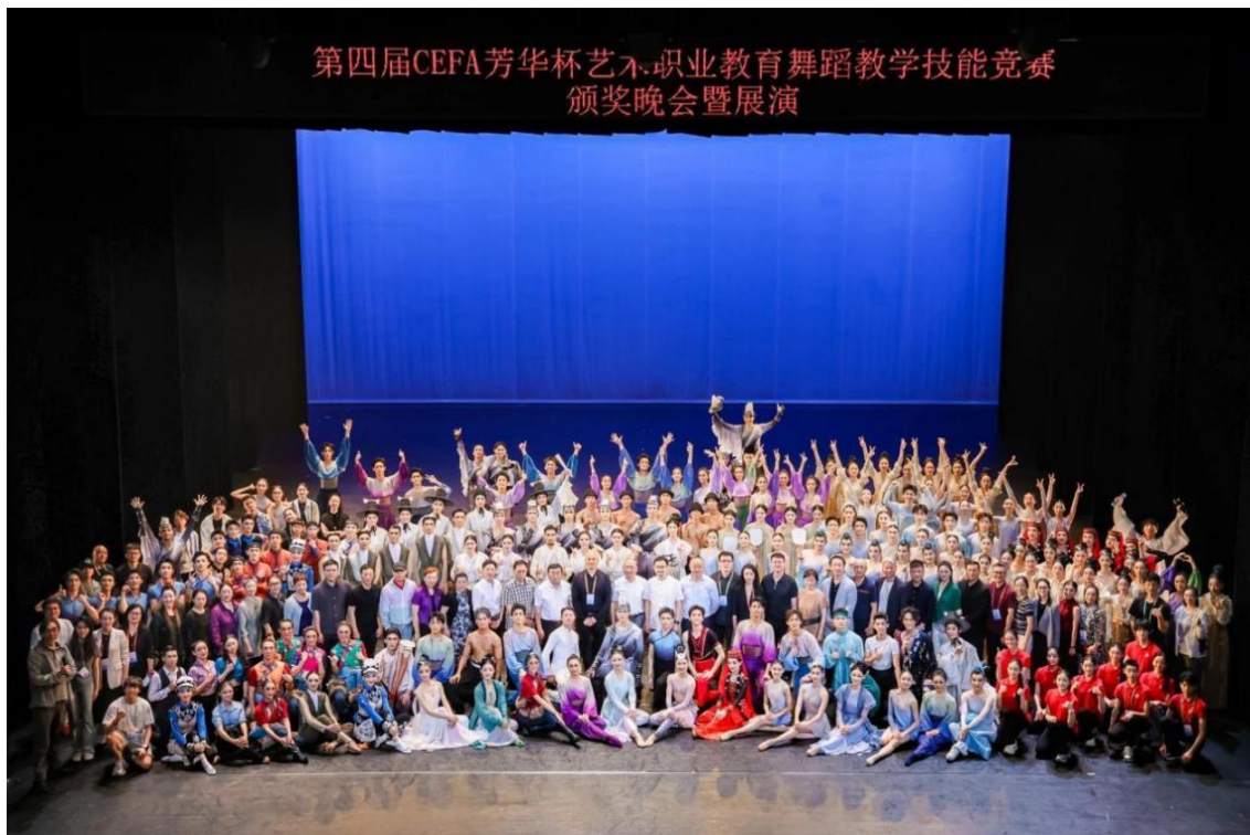
图 2-6 北戏参加第四届 CEFA “芳华杯” 获奖