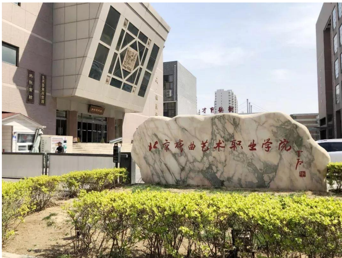
图 1-1 北京戏曲艺术职业学院