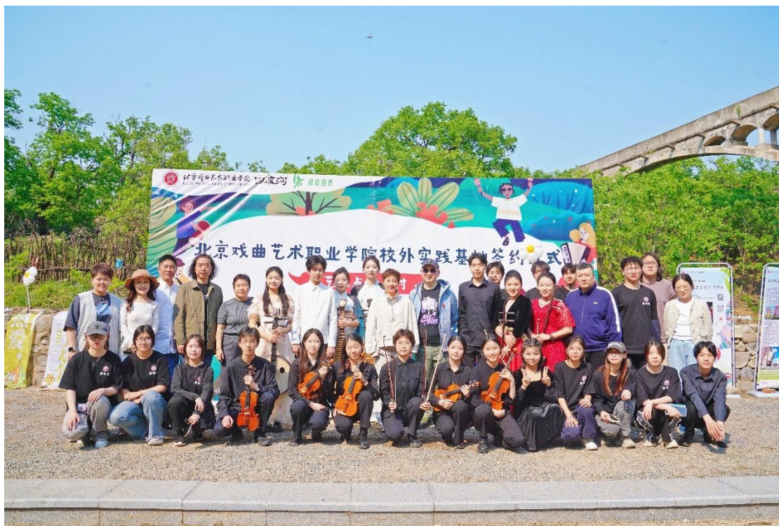
图 3-6 北戏师生服务北京市怀柔区渤海镇四渡河村

夏·青春音乐会》，通过民乐与西洋乐的精彩演绎，将高雅艺术直接送达田间地头，有效促进了城乡文化的互动与融合。这一“高校-乡村-企业”三方协同模式，不仅为青年学子提供了深入基层、施展才华的实践平台，更旨在通过持续的艺术浸润、演出与培训，激活乡村内生文化活力，探索以艺术教育和文化振兴赋能乡村可持续发展的有效路径。