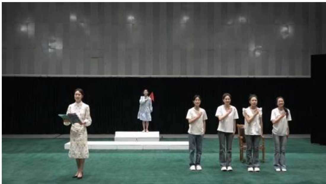
图 2-11 北戏作品入围第六届中华经典诵写讲大赛国赛