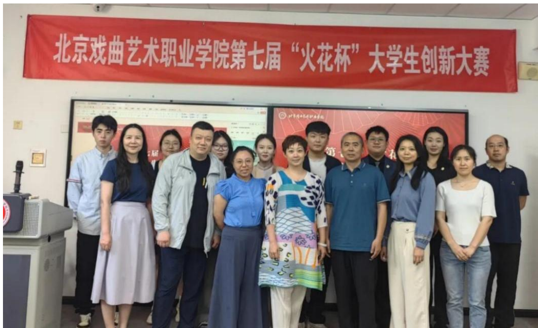
图 2-14 北戏举办第七届“火花杯”大学生创新大赛

这不仅是一场比赛，更是一次思维的火花碰撞。未来学院将继续整合资源，完善创新创业培养机制，让更多“火花”在此点燃，照亮学子的追梦之路。