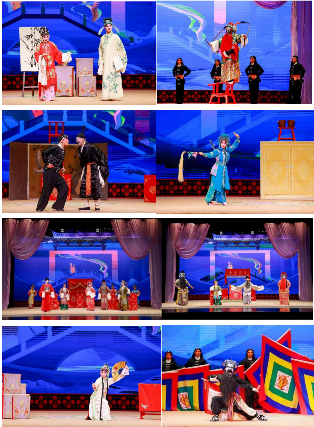
图 2-8 北戏小梅花获奖剧照