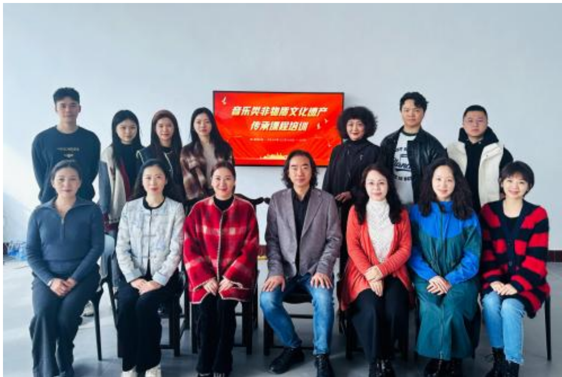
图 2-3 北戏教师赴闽培训

作为北京市教委立项支持的校企合作“双师型”团队，此次赴闽培训是北戏深化民族音乐传承教学创新、推动传统文化与职业教育融合的重要举措。团队将持续探索非遗在新时代的传承路径，将传统音乐精髓融入教学体系，为培养具有文化自觉与创新能力的艺术人才积累实践经验。