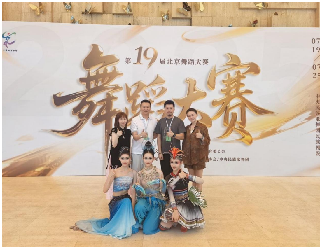
图 2-5 北戏舞蹈系在第十九届北京舞蹈大赛获奖

每一次荣誉的背后，都离不开院系领导的支持、教师团队的潜心指导与辛勤耕耘，以及学生演员们的刻苦训练与挥汗奋进。从练功房到少儿剧场，再到民族剧院乃至国际赛场，师生们用汗水与才华，在一系列高规格平台上锤炼了专业技能，深化了艺术理解，真正实现了教学与实践的深度融合，让艺术才华在舞台上绚丽绽放。