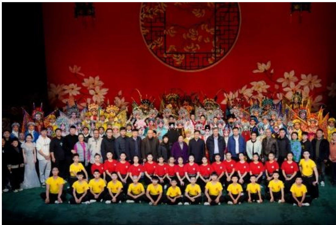
图 3-3 三地四校联合举办京津冀协同发展教学成果展演

在国家京津冀协同发展战略实施十周年之际，为贯彻落实习近平总书记在深入推进京津冀协同发展座谈会上重要讲话精神，共谋京津冀艺术职业教育高质量发展的新篇章，推动戏曲艺术在新时代的传承发展，京津冀三地的四所艺术院校共同携手，北京戏曲艺术职业学院联合天津艺术职业学院、河北艺术职业学院、石家庄市艺术学校，于2025年11月29日至12月1日在长安大戏院共同举办“同心筑梦·京韵流芳”戏曲教学成果展演。活动期间，四所院校通过四场精彩演出集中呈现教学与人才培养成效：开幕式上，京剧基本功展示与《红娘》《上天台》《恶虎村》《砸奎驾》等经典剧目选段轮番上演，北戏《梨园占春》将现场气氛推向高潮；后续专场中，天津艺职院折子戏、河北艺职院《八大锤·断臂说书》、北戏《秦香莲》等剧目接连亮相，尽显国粹魅力与新时代戏曲生命力。同期举办的京剧研讨会，聚焦戏曲传承创新与区域协同发展，共商合作大计。此次展演是三地四校协同育人的生动实践，谱写了文化共融共促新篇章。未来，四方将持续深化艺术教育资源共享，推动专业建设、剧目创作、非遗传承等领域深度合作，为京津冀艺术职业教育高质量发展注入持久动力。