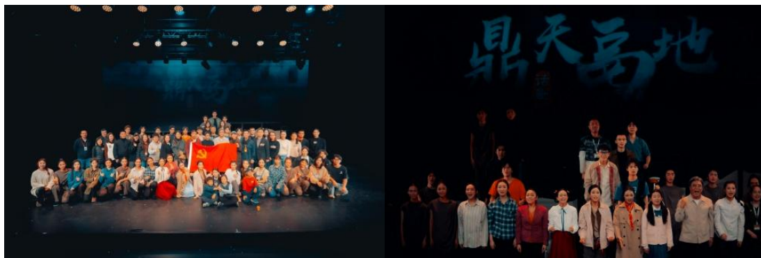
图 2-18 北戏原创话剧《鼎天鬲地》国家话剧院演出照

作为一部以现实为题材的优秀话剧，《鼎天鬲地》自2023年创演以来受到各方好评，荣获2023年北京大学生戏剧节优秀创作银奖、表演艺术奖、优秀指导教师奖，2024年入选北京市委教育工作委员会北京高校校园原创文化精品项目。