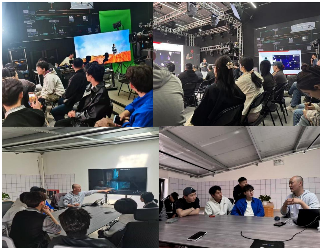
图 2-16 北戏舞美系体验 XR 虚拟演播室

为深化产学研融合、助力戏曲艺术与现代科技创新发展，2025年4月2日至3日，学院舞美系大二灯光班学生，在系主任原野、教研室主任高一博带领下，赴北京澜景科技有限公司深澜空间开展沉浸式前沿技术学习。企业相关技术人员热情接待并全程指导。活动中，技术人员深入浅出讲解 XR 虚拟演播室核心原理、系统架构及应用，分享虚拟拍摄、实时渲染等前沿技术。互动环节，技术人员手把手指导学生操作设备，体验虚拟场景搭建、灯光调控等流程；师生踊跃参与，原野、高一博老师就教学实践问题与企业深入交流。此次学习拓宽了学生视野，明确了其职业发展方向，也为舞美系教学革新提供新思路。舞美系将持续深化校企合作，探索产学研融合新路径，为学生创造更多接触前沿技术的机会，培养高素质舞美专业人才，推动戏曲艺术与现代科技深度融合。