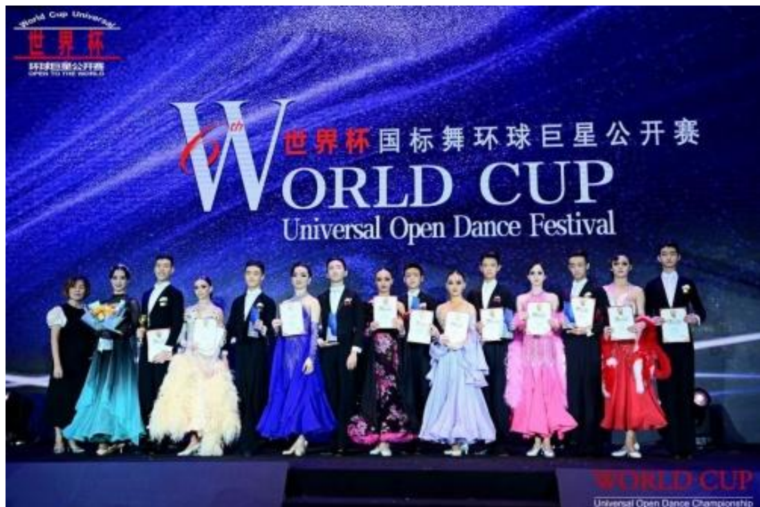
图 2-7 北戏学子在世界国标舞环球巨星公开赛获奖