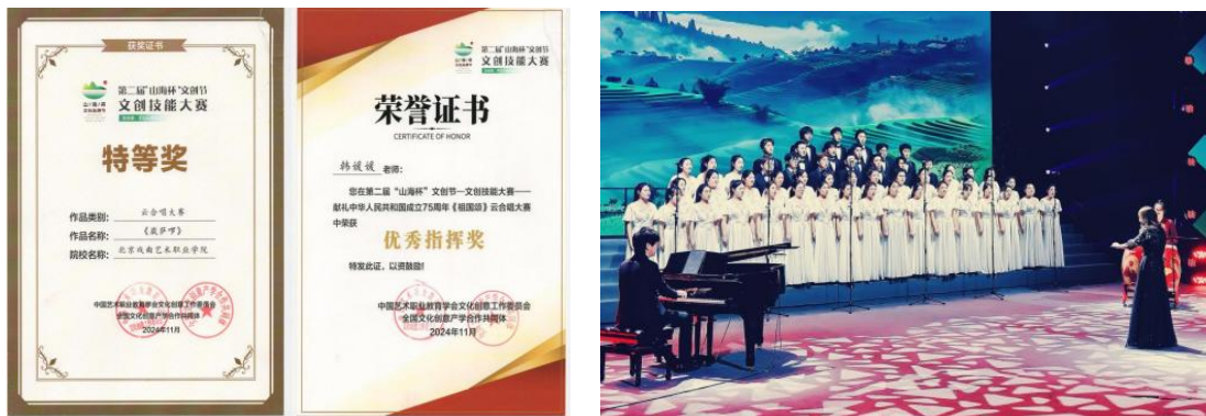
图 2-9 北戏合唱团获奖及参赛照

2024年是新中国成立七十五周年华诞，是向着全面实现“十四五”规划目标任务砥砺前行之年。立足于文化自觉和爱国情怀，以献礼中华人民共和国成立七十五周年为契机，经中国艺术职业教育学会文化创意工作委员会研究，特报中国艺术职业教育学会批准，举办了献礼中华人民共和国成立七十五周年《祖国颂》合唱大赛。本次合唱大赛为中国艺术职业教育学会文化创意工作委员会第二届“山海杯”文创节—文化创意技能大赛的赛项之一，旨在以恢宏的合唱追忆峥嵘岁月、歌颂奋进岁月，唱响盛世的繁荣华章；用音乐工作者的使命担当凝聚爱国力量、礼赞党建精神，奏响民族复兴、文化自信的时代最强音。