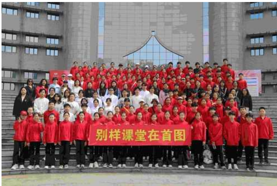
图 2-15 北戏师生走进首图

未来，我院将以协议为依托，持续拓展与首都图书馆的合作内涵，将优质公共文化资源引入育人体系，通过讲座、观展、研学等多种形式，构建生动立体的“第二课堂”，推动文化育人从课堂走向社会，实现“润物无声”的教育效果。