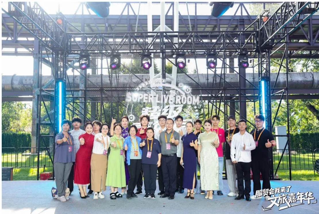
图 3-2 北戏师生在中国国际服贸会上亮相

小吃赞》、快板《玲珑塔》、京韵大鼓《连环计》、相声《打灯谜》等节目，语言诙谐、表演精湛，现场气氛热烈。此次演出既锤炼了学生舞台实践能力，又践行了学院服务社会文化建设的责任担当，未来北戏将持续深耕艺术职业教育，为首都文旅融合发展注入更多艺术活力。