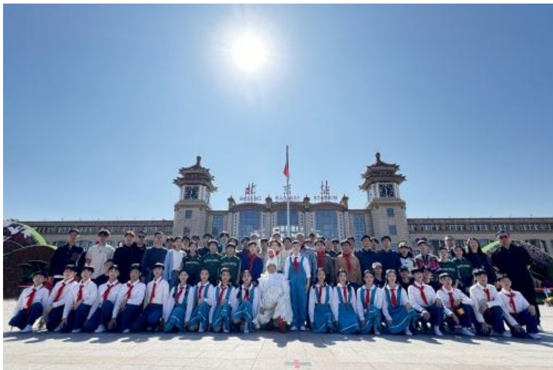
图 3-4 北戏师生携新编京剧《心愿》片段在北京站“快闪”演出