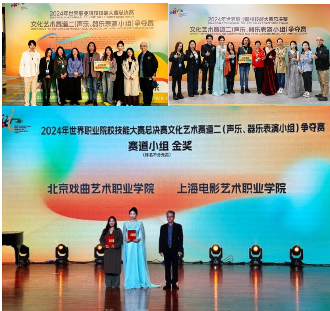
图 2-4 北戏师生参加世界职业院校技能大赛