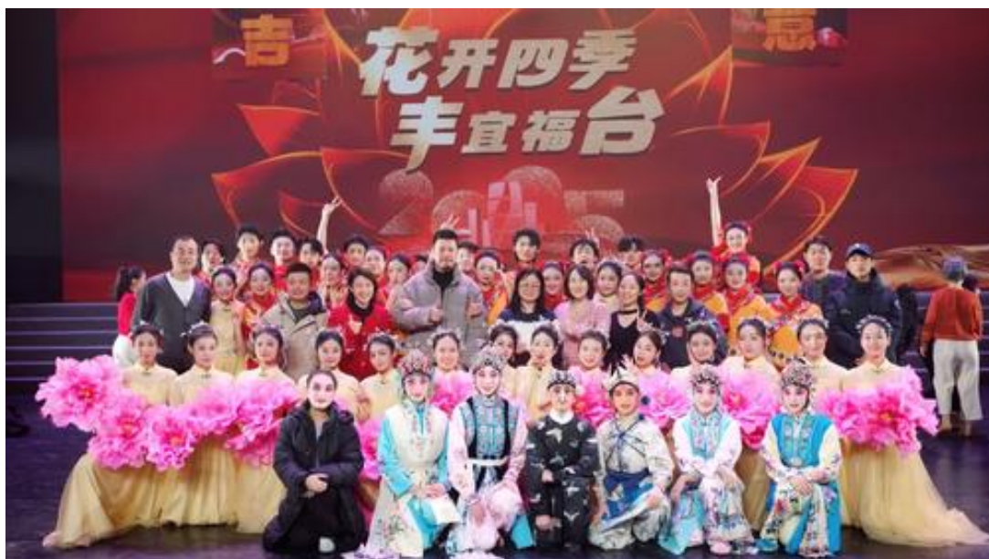
图 3-5 北戏师生参加丰台区 2025 年市民迎新春文艺演出