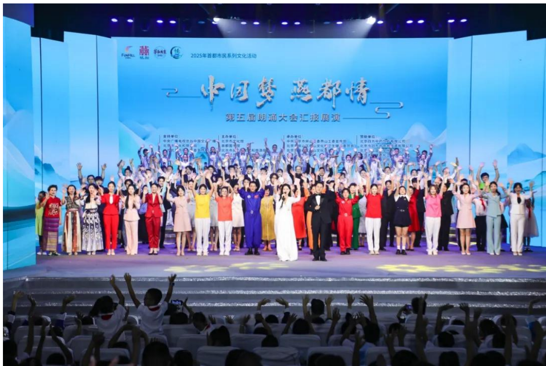
图 2-10 北戏参加“中国梦·燕都情”第五届朗诵大会总决赛

这两项重要赛事成绩的取得，是全院师生精益求精、勇攀高峰精神风貌的展示，也是学院深化人才培养模式改革、肩负起传承弘扬中华优秀传统文化使命的具体实践。通过赛事的锤炼，进一步激发了学生的文化自信与艺术创新活力，为促进学生的全面健康成长与服务社会主义文化强国建设注入了坚实力量。