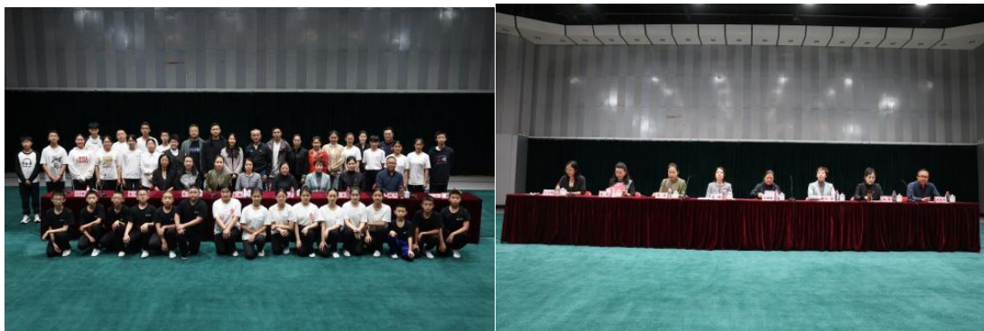
图 6-2 北戏与内蒙古艺术剧院委培班开班仪式现场