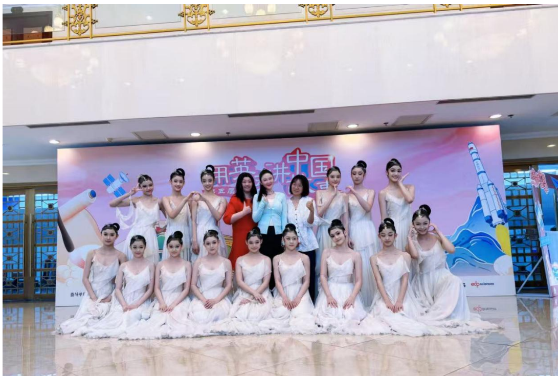
图 5-2 北戏师生参加“用英语讲中国故事大会”展演颁奖典礼

学院舞蹈系原创舞蹈《运河谣》惊艳亮相，诠释运河千年历史沧桑与人文精神，演出现场赢得观众雷鸣般的掌声。此次演出完美契合大会“让世界读懂中国”的宗旨，以舞蹈这一无国界语言讲述生生不息的运河故事。参演学生表示：“这样的实践比书本学习更生动，更有自信向世界讲好中国故事。”