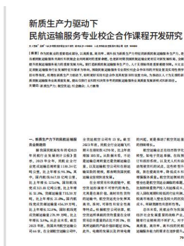
图 10- 发表论文