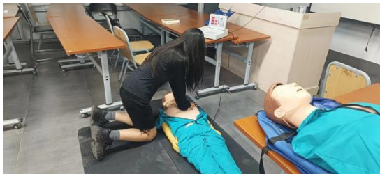
图 18-学生模拟急救练习