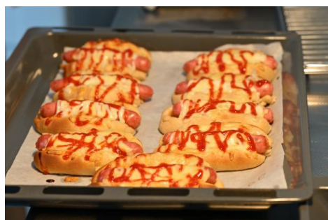
图 14-烘焙课同学们制作的热狗