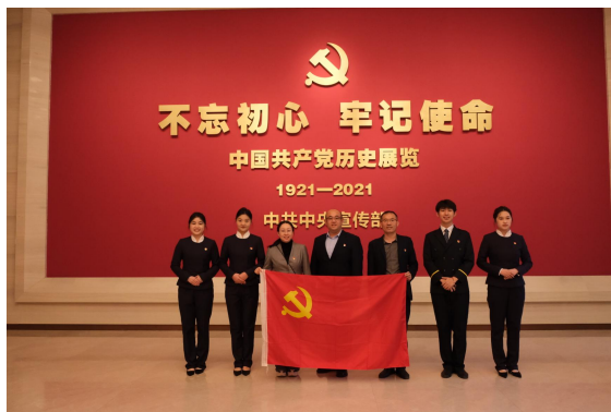
图 3-企业党支部及学生代表参观中国共产党博物馆