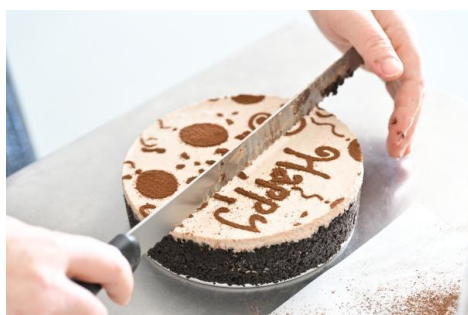
图 15-烘焙课同学们制作的蛋糕