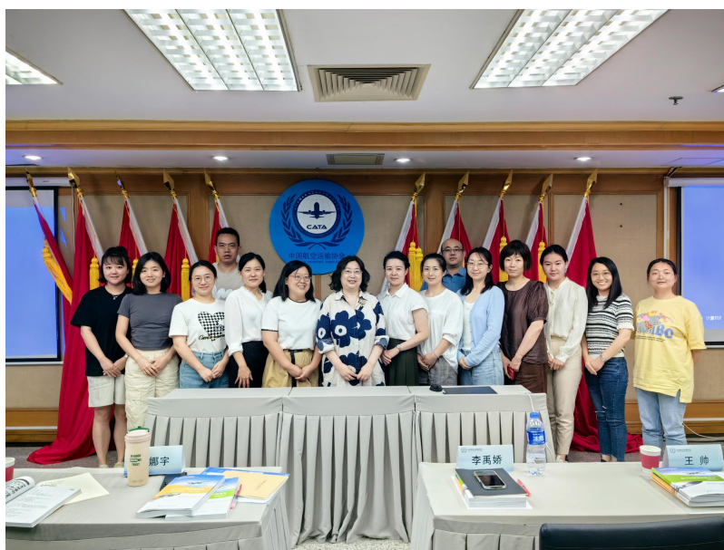
图 23-首期《航空运输地面服务员》教员班

随着航空业的快速发展，对专业人才的需求日益增加。为更好地培养符合行业需求的高素质技能型人才，校企携手合作。其中，在师资队伍建设方面取得了显著成效，特别是通过参与中国航空运输协会国家职业技能标准《航空运输地面服务员》职业技能等级证书首期四级工（中级）教员培训项目，并顺利通过了考核获得了中级教员资格认证。进一步提升了教师队伍的专业水平。这不仅增强了老师们的专业技能，也为后续开展更高质量的教学活动奠定了坚实基础。积极探索校企合作新模式，除了常规的教学合作外，还开展了联合科研项目申报、实习就业推荐等多种形式的深层次合作，形成了良好的互动机制。不断探索更加灵活高效的人才培养方式方法，努力打造一支既懂理论又能动手操作的优秀教师团队，为我国民航事业输送更多高质量的技术技能人才而不懈努力！