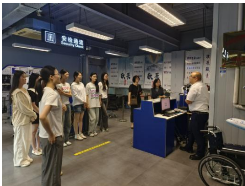
图 26-值机业务办理讲解