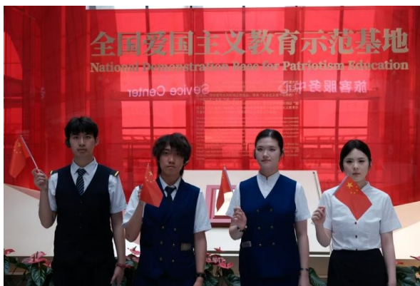
图 22-英语兴趣小组活动