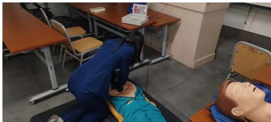
图 20-学生模拟急救练习

英语兴趣小组旨在提高学生的英语沟通能力和跨文化交流能力。课程内容包括日常英语对话、航空服务专业术语、听力与口语训练等。通过这些课程，学生将能够在国际航班上更加自信地与乘客交流，提供更优质的服务。英语兴趣小组的成员们反映，通过小组活动，他们的英语口语水平有了明显提高。此外，小组内的互动也非常活跃，大家相互鼓励和支持，形成了良好的学习氛围。