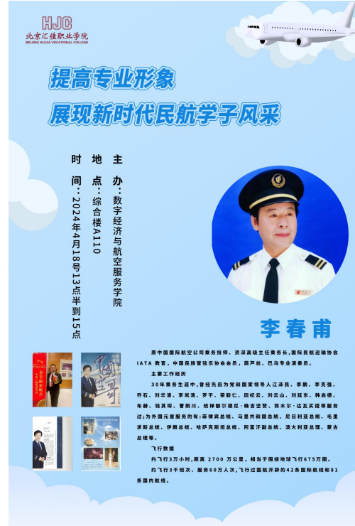
图 9-李春甫讲座海报