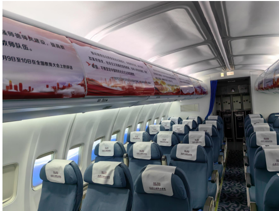
图 6-党史教育进客舱