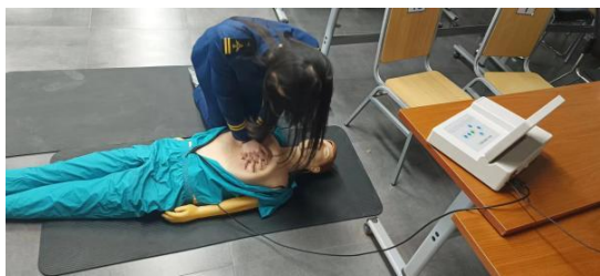
图 19-学生模拟急救练习