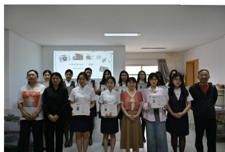
图 13-烘焙培训证书颁发