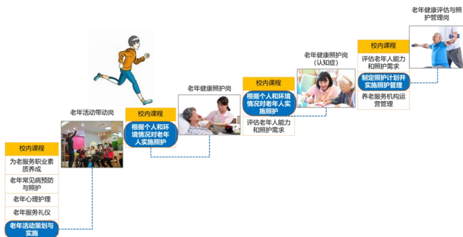
图 1-6 校企双元“工学交替”的教学模式

经过几年的改革实践，该模式取得了显著成效。学生的职业综合素养与职业行动能力显著提升，赢得了用人单位的广泛认可，收到用人单位 30 余封表扬信。学校不仅为养老服务领域输送了大量人才，也为其他高职院校提供了可借鉴的人才培养模式。在 2023 年的全国养老行业产教融合共同体成立大会上，成立智慧康养高级学徒制产业学院发展联盟。