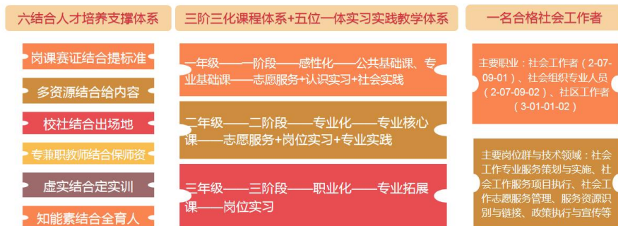
图 1-8 “6351”人才培养模式

政社行校共同调研，依据国家社会发展需要、行业职场发展需要、民政学院社会工作专业发展定位需要、学生发展需要确定培养目标，从而确定培养规格、课程体系、教学内容和教学方法，为了保障教学，校社合作共建实习实训基地、教师团队，合作开发课程和教学资源，共同制定人才培养方案。