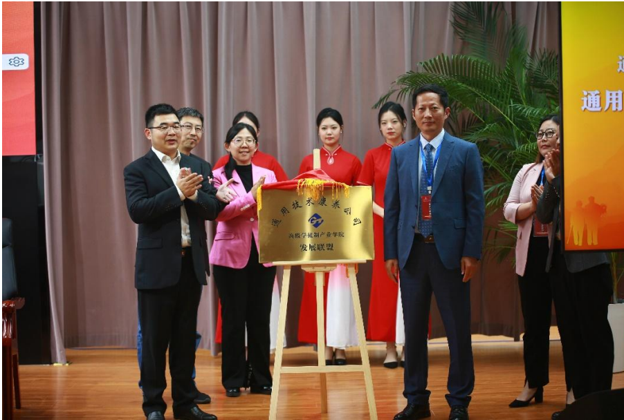
图 1-7 智慧康养高级学徒制产业学院发展联盟成立