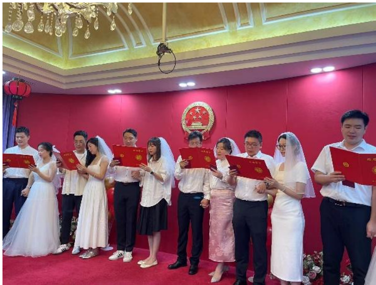
图 2-2 集体婚礼颁证仪式现场

2024 年 8 月 10 日七夕节，学校婚庆服务与管理专业师生与西城区律苑婚姻家庭服务中心举办集体婚礼颁证仪式，为 12 对新人提供了专业的婚礼指导与服务并细致规划了仪式的每一个环节。这是一场生动的实践课，也是政、企、校合作的成功范例。