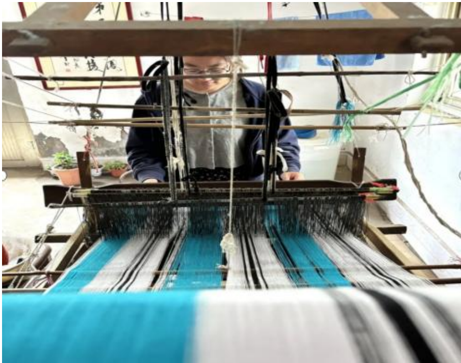
图 3-3 “古窑十八梭”纺织技艺

2024年8月，“青扬文化”社团走入山东省东营市，了解“古窑十八梭”纺织技艺的历史背景与文化内涵。古窑十八梭，这一蕴含深厚历史文化底蕴的传统织布工艺，其制作过程繁复精细，需历经72道纯手工工序，从采棉至织布，每一环节皆匠心独运。它以七种基本色线为基，幻化万千色彩，借由十八种精湛技法，如平布、斜纹等，交织出绚烂多彩的几何图案。织造时，手艺人的双脚与双手默契配合，棉线在其间穿梭起舞，最终织就一幅幅精美厚实、如霞似锦的老粗布，展现了传统工艺的独特魅力。