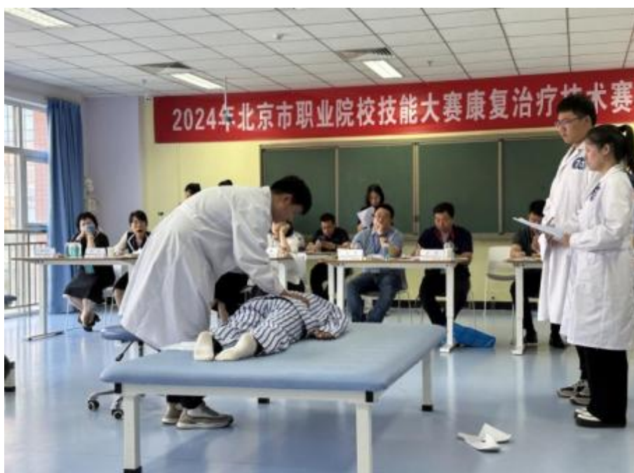
图 1-13 复治疗技术比赛进行中