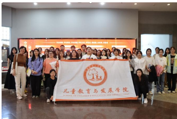
图 3-2 “发现非遗之美，体验印刷文化”之中国印刷博物馆实践活动合影

为了用好社会大课堂，引导学生在社会实践中增知识、长才干、受教育，充分发挥第二课堂思政育人实效。2024年4月，学校“行走课堂”系列之“发现非遗之美，体验印刷文化”实践活动在中国印刷博物馆开展，学生们通过参观深刻了解古代雕版印刷、活字印刷等传统精湛技艺，推动课内学习与课外实践贯通，增强学生对印刷文化的深入了解，对中国传统文化的热爱和尊重。