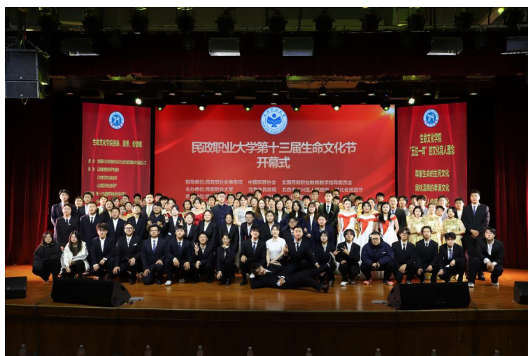
图 1-5 第十三届生命文化节

生命文化学院以生命文化理念为核心，确立“以文化人，以礼立人”的教育理念。在课堂教学渗透贯彻这一理念的同时，设立生命文化大讲堂（每两周一期），举办生命文化节（每年12月3-4日），开展拜师礼（每届一次生命导师拜师礼、一次行业师傅拜师礼）、策划丧礼仪式（多次）、生死体验活动（一学期两期）。通过清明云祭祀、演讲比赛、朗诵比赛等丰富的实践活动，树立新的丧葬礼仪文化，服务国家殡葬事业发展，达到润物细无声的育人效果。