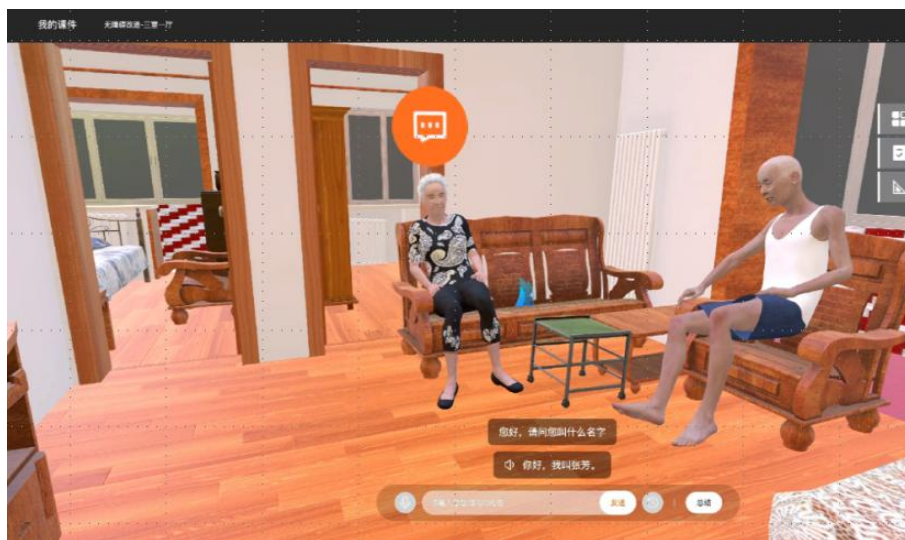
图 1-11 虚拟仿真教学系统

育教学应用项目”和元宇宙创新教育应用大赛场景创新一等奖，体现了其在教学创新与社会服务方面的卓越成就。