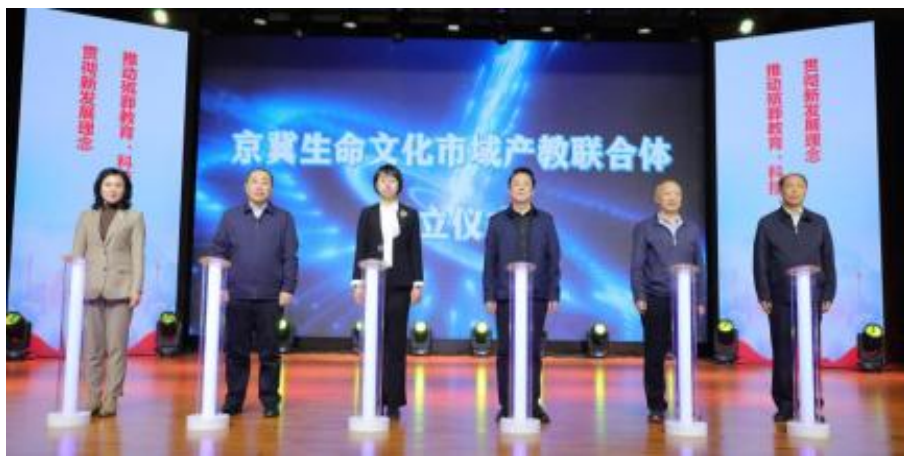
图 5-1 京冀生命文化市域产教联合体成立

学校建设了京冀康养市域产教联合体和京冀生命文化市域产教联合体。自成立以来，在政府的大力扶持下，依托全民政行指委，大兴区产业园区，合作企业，学校开展了中高本课程标准制定，教材开发等工作，充分发挥了政府统筹、产业聚合、企业牵引和学校主体作用。