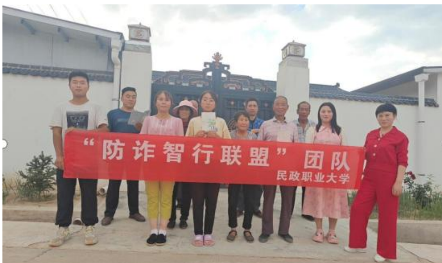
图 2-1 开展乡村反诈系列宣传

随着数字化时代的快速发展，网络诈骗日益猖獗，农村地区由于信息相对闭塞、村民防范意识薄弱，成为了网络诈骗的高发区域。为增强农村居民尤其是留守老人的反诈意识，帮助老人跨越“数字鸿沟”，提升其生活质量，儿童教育与发展学院“反诈智行联盟”暑期社会实践团队，前往甘肃省镇原县开边镇兰沟行政村后河自然村和贵州省遵义市赤水市天台县天台村开展反诈系列宣传活动，帮扶留守老人，促进乡村全面发展。