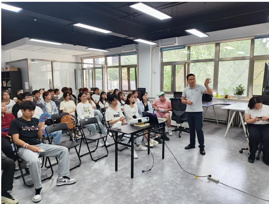
图 3-5 学生赴北京红海人力集团参观学习