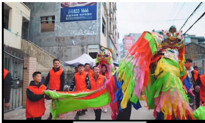
图 3-1 学生参加春节舞狮活动

2024年2月，康复工程学院举办以“辞旧癸卯、迎新甲辰—寻年味、拾年俗”为主题，突出“喜庆祥和过大年，传统文化再继承”，遵循简洁可行、力所能及的原则，深入挖掘春节的文化内涵，以活动为载体，吸引全体同学广泛参与，培养和树立学生认知传统、尊重传统、继承传统、弘扬传统的思想理念，增强学生对中华文化的认同感和自豪感，着力营造欢乐、祥和、平安、健康、文明的节日氛围。