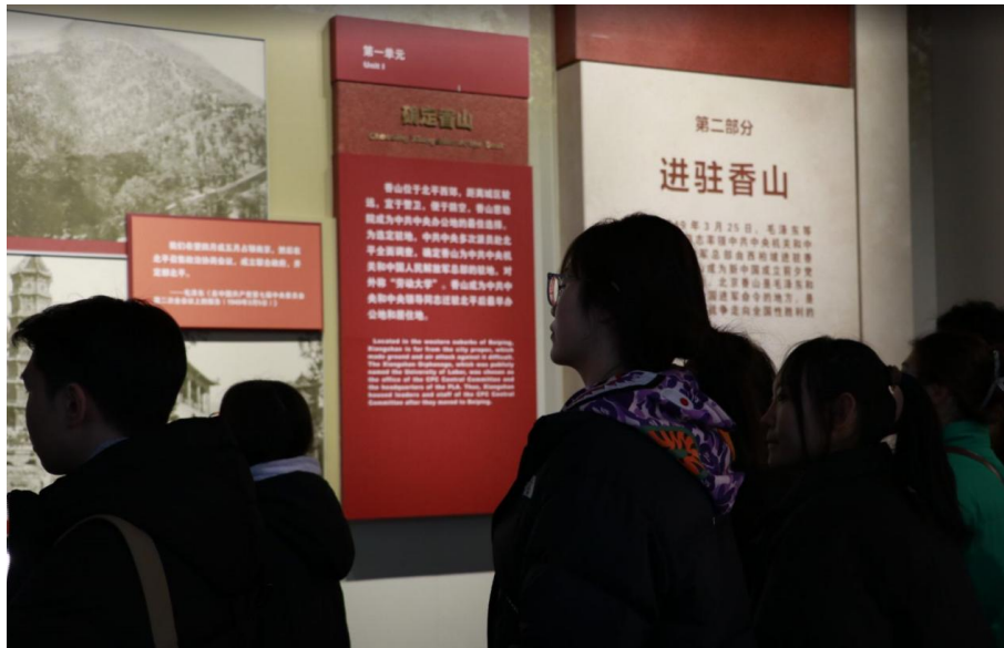
图 3-6 香山革命纪念馆参观

全面贯彻落实党的二十大精神，深入学习贯彻习近平总书记关于青年工作的重要论述，推动团员和青年主题教育走深走实，引领广大青年在社会实践中受教育、长才干、作贡献。2024 年 1 月 20 日，院团委组织“卓越”训练营全体同学赴香山革命纪念馆参观学习，重温“红色进京路”，接受党性教育，感受革命前辈的辉煌历程，赓续共产党人精神血脉。通过参观，同学们重温了中国共产党的百年征程，深刻感受到了革命先烈们为民族独立和人民幸福付出的巨大牺牲和努力，更加坚定了同学们认真学习理论知识、积极锤炼技能本领，为实现人民对美好生活的向往，实现中华民族伟大复兴中国梦贡献青春力量。