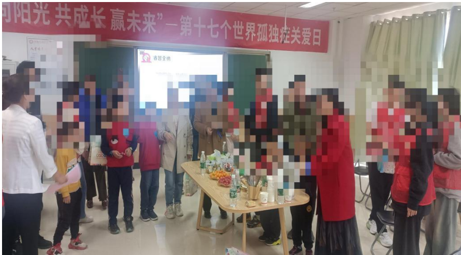
图 1-2 “向阳光、共成长、赢未来”孤独症日公益活动现场

2024年3月30日，在第十七个“世界孤独症日”来临之际，学校与睿智全纳教育康复中心、海淀区融爱融乐心智障碍者家庭支持中心共同举办“向阳光、共成长、赢未来”孤独症日公益活动。活动中，志愿服务队带领数十名孤独症儿童完成系丝带、绘画风筝、玩游戏等多个环节。通过此次活 动，学生加深了对孤独症的认识，提升了自身应对孤独症儿童的专业能力，对所学专业的社会价值和使命有了更深层次的理解，从而坚定了践行“躬行、仁爱”校训，成为优秀民政人才的决心。