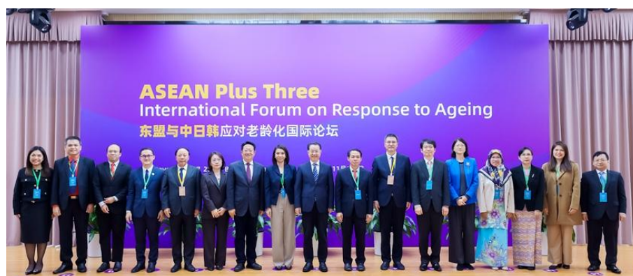
图 4-1 东盟与中日韩应对老龄化国际论坛

论坛的成功举办，不仅为东盟与中日韩各国进行高规格政策对话提供了重要平台，更深化了各方在老龄化议题上的理解与交流，有力推动了先进养老技术和理念在区域内的广泛传播与应用，标志着东盟与中日韩在应对老龄化挑战方面迈出了实质性的一步，为未来深化合作、共同探索老龄化解决方案奠定了坚实基础。