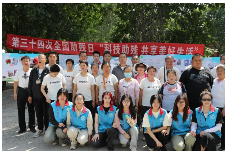
图 1-4 科技助残系列服务现场