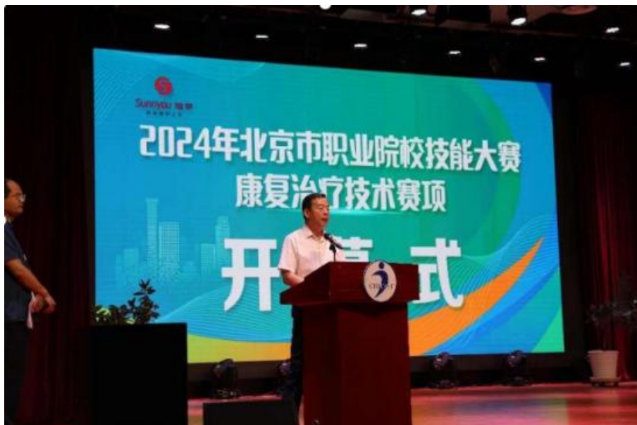
图 1-12 复治疗技术赛项开幕式

平卫生学校、天津医学高等专科学校等 6 所学校组成了 11 支参赛队伍，33 名参赛选手参加了次赛项。