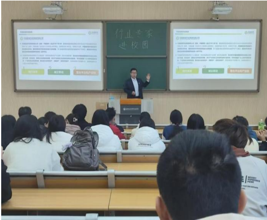
图 3-4 中国健康养老集团养老运营部负责人讲解企业文化与特色