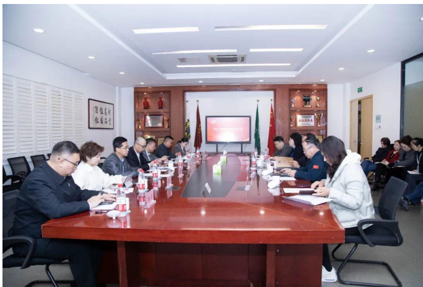
图 14：第六次产教融合推进会聚焦提高教学质量助推就业

派执行院长和学生工作负责人，负责学生的组织和管理。有了这种机制保障，就能实现校企一家，不分彼此，休戚与共，合作共赢。但这还不够，还必须向实向深，特别是在职业教育社会培训方面开拓发力，开辟校企合作的新局面。