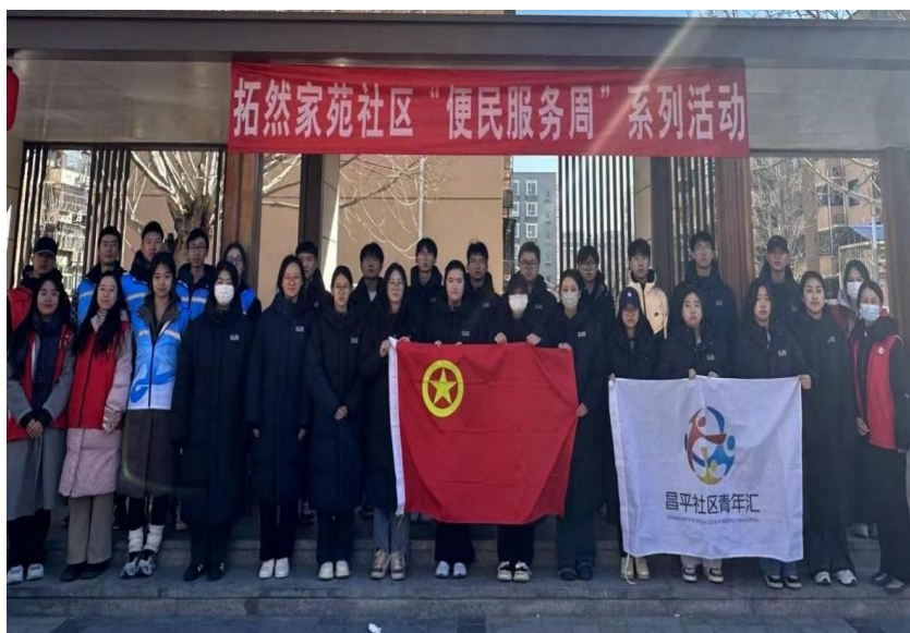
图 10：大学生志愿者走进拓然家苑社区，提供便民服务