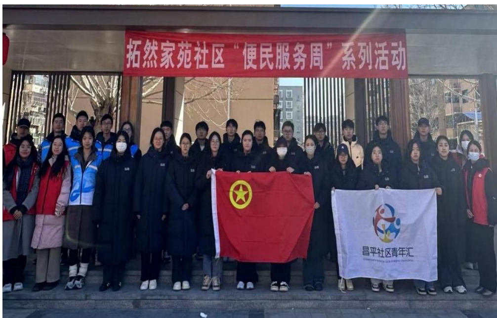
图 4 大学生志愿者走进社区、服务社区

近年来，学院积极组织学生参加形式多样的志愿服务活动和爱心公益活动，如在校内组织清洁校园志愿服务活动、维护校园安全稳定志愿活动、节俭养德教育实践活动；在校外开展学雷锋志愿服务活动、献爱心公益活动，到养老院、儿童村定期开展志愿服务活动。2024 年，学生参与志愿者服务达到 533 人次。学院党委承接北京民办教育协会政府购买服务项目，实施“乐龄 1+X 文化敬老”教育项目，组织师生党员和入党积极分子 180 余人次，到北京洪湖江山国际老年公寓开展讲座 7 场，参与慰老助老活动 10 余次，受益老人达到 500 余人次，受到养老院老人们的广泛好评。走进拓然家苑社区、便民服务受欢迎。