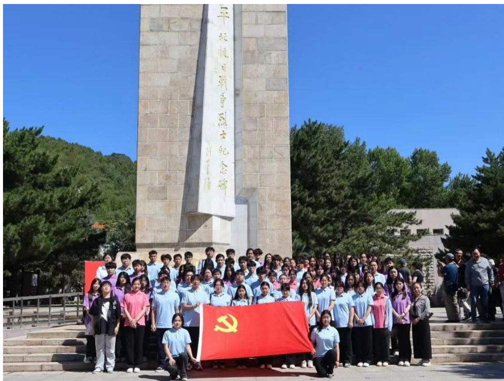
图 3 大思政进入社会大课堂

思想政治理论课是落实立德树人根本任务的关键课程，讲深讲透讲活思政课具有重要意义。我们充分挖掘时事热点和学生实际生活，对思政教材内容进行拓展与深化。在讲解社会主义核心价值观时，通过两条线在比较中进行落实：第一，通过中西方文化价值观对比，总结出坚持社会主义核心价值观的必要性；第二，通过引入社会上、身边践行社会主义核心价值观的典型人物事迹和现实中躺平人物的故事，总结出社会主义核心价值观对每个人成长的重要性。同时，积极开展“红色文化主题月”，通过红色歌曲演唱、革命故事演讲、走访红色基地等实践活动，传承红色基因，强化学生的理想信念，为学生的未来发展筑牢坚实的道德根基。