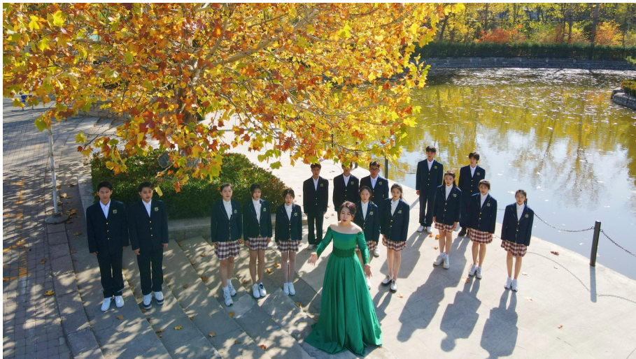
图 14：校园红歌演唱会