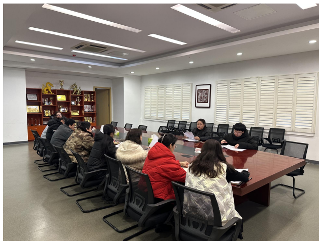
图1 学工部“大思政课”工程建设研讨暨推进会

与会成员结合本职工作，就我校“大思政工程”实施和大思政课程体系构建及推进工作进行了充分的研讨和交流。