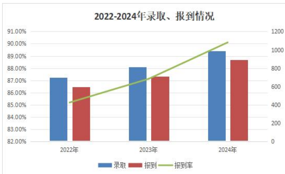
图6 近三年新生录取报到情况示意图