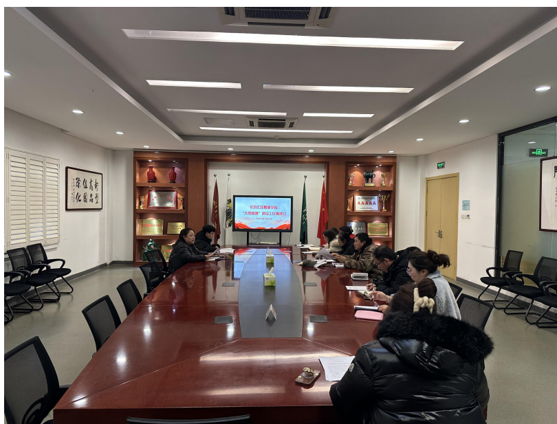
图2 学生管理部门落实大思政课工程建设部署会

团委学生会思想引领：借助新媒体推送思政内容，如榜样故事、热点解读，引领学生思想。组织活动：开展思政主题团日活动，如演讲、参观基地，让教育“活”起来。志愿服务：组织学生参与各类服务，如社区公益、乡村支教，强化教育效果。