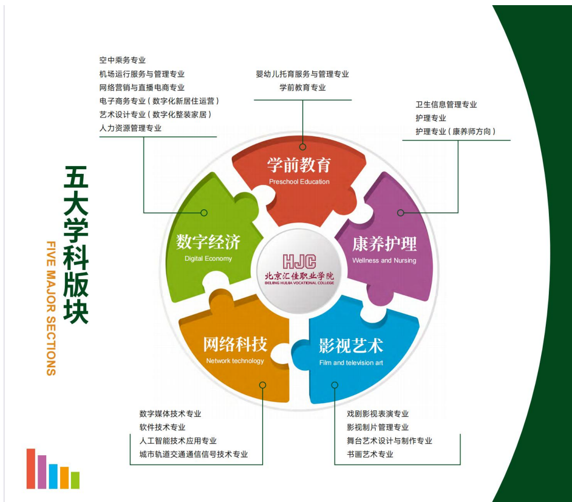
图 8 五大专业领域形成新的专业布局结构示意图