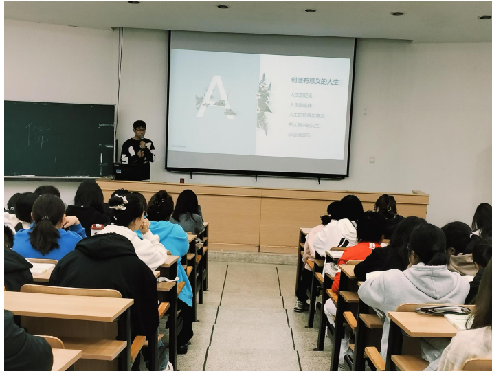
图 5 大学生讲思政校级选拔赛