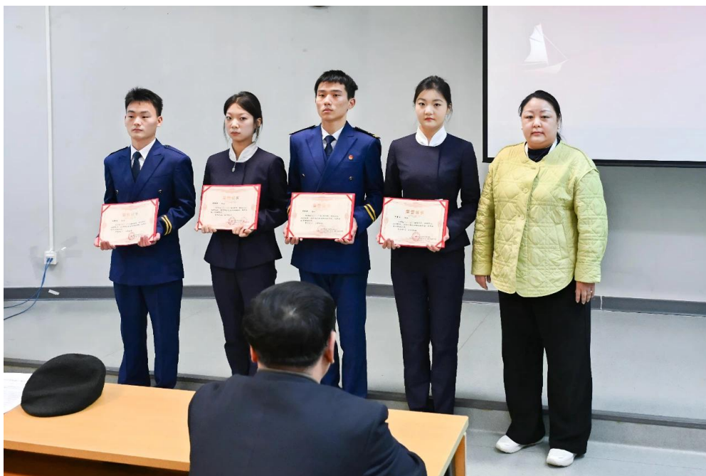
图 11：华航企业奖学金颁奖仪式