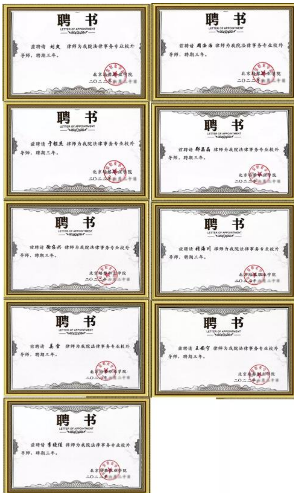
图 4 学院聘请律所律师作为校外导师聘书