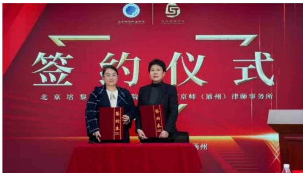
图 2 学院与律所签订合作协议

受聘的律师们承担校外指导教师的职责，参与学生的实习实训指导，同时还承担部分课程的授课任务，将他们的实战经验带入课堂，让学生们在学习理论知识的同时，也能接触到实际案例，增强学习的实践性和针对性。此外，他们还积极参与人才培养方案的制定研讨和规划，为学院法律系的人才培养工作出谋划策。