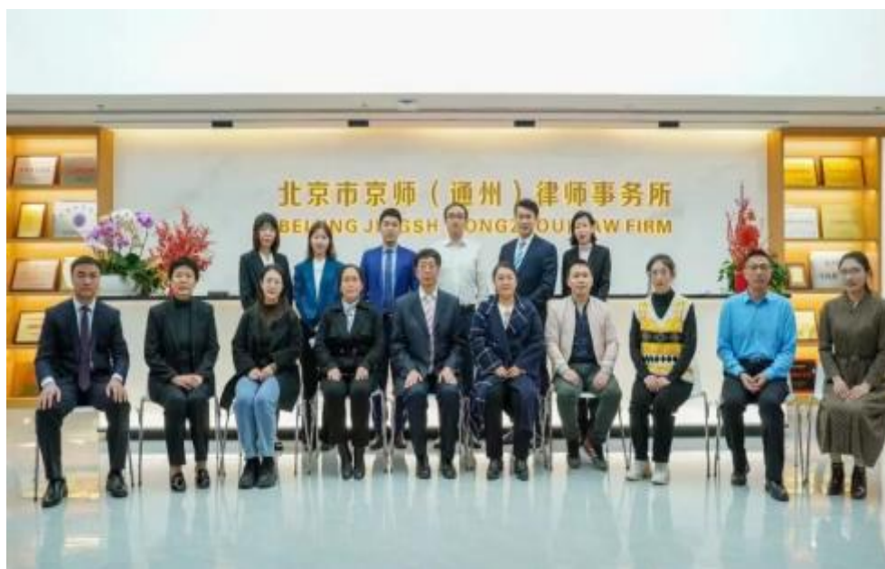
图 1 律所律师与学院领导老师合影

2022 年 10 月 21 日下午，学院法律系与京师（通州）律师事务所携手共建“教学实习实训基地”，开启了校企合作的新篇章。