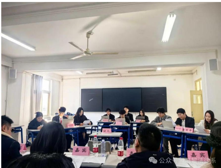
图 5 展示了学生们在模拟法庭上的精彩表现

他们身着正装，扮演着法官、律师、当事人等不同角色，通过模拟真实的法庭程序，展现了法律系学生对法律知识的掌握和运用能力。此次活动不仅为学生们提供了一个展示自我和锻炼能力的平台，也为他们未来的职业生涯打下了坚实的基础。