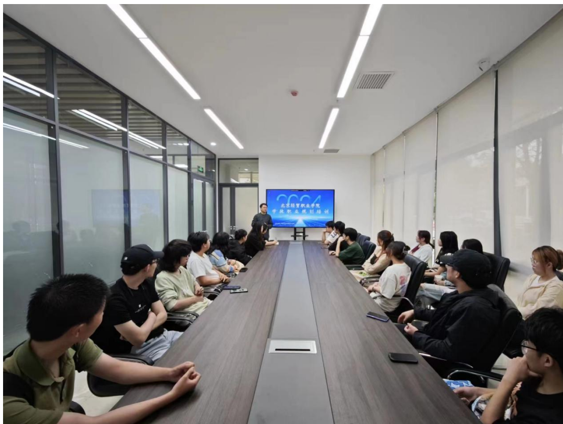
图 3 现代学徒制培训会