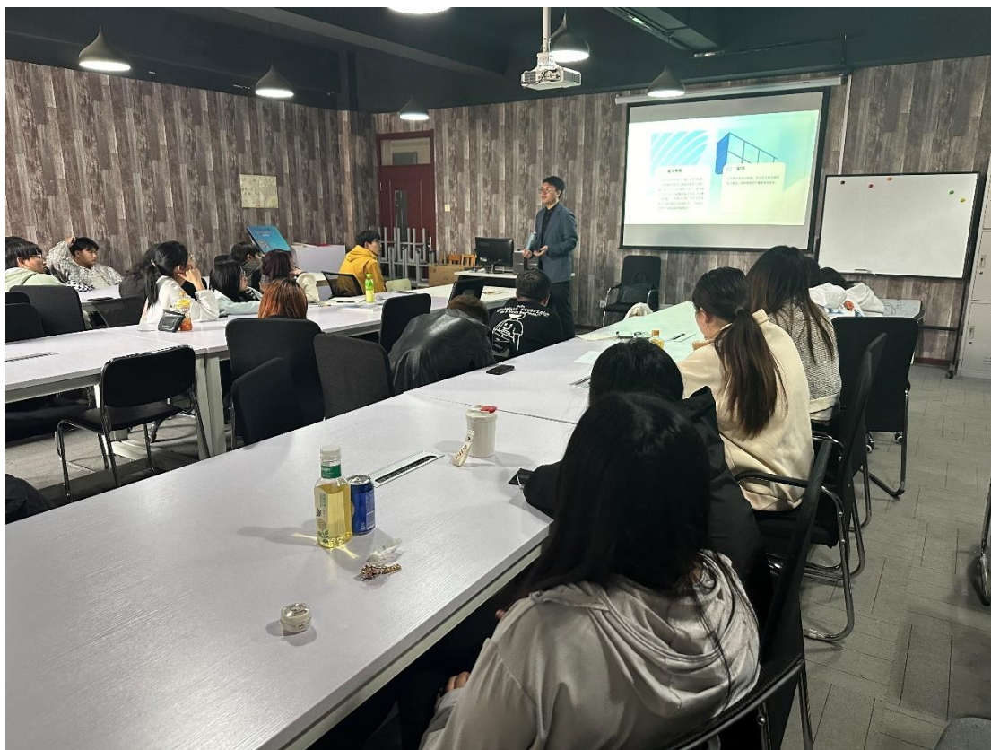
图 2 学徒制学习动员会

工作。校企双方合作制定了《影视动画专业现代学徒制学习规程》、《现代学徒制学习岗位调研报告》、《2022 级影视动画专业现代学徒制学习期间住宿（住集体公寓）安全责任书》、《2022 级影视动画专业现代学徒制学习期间走读（不住集体公寓）安全责任书》、《监护人知情同意书》等多份工作规程文件的编写，据此执行后续工作，做到相关安排制度严谨、执行规范。