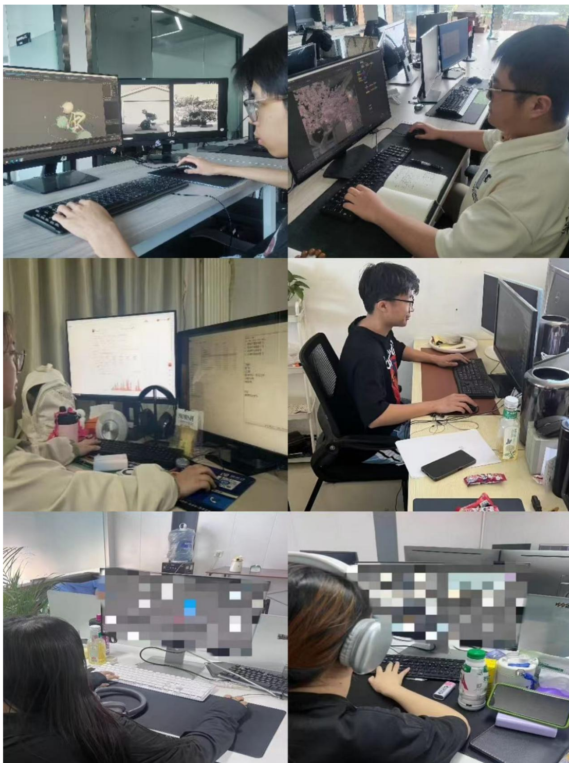
图 5 现代学徒制成效图