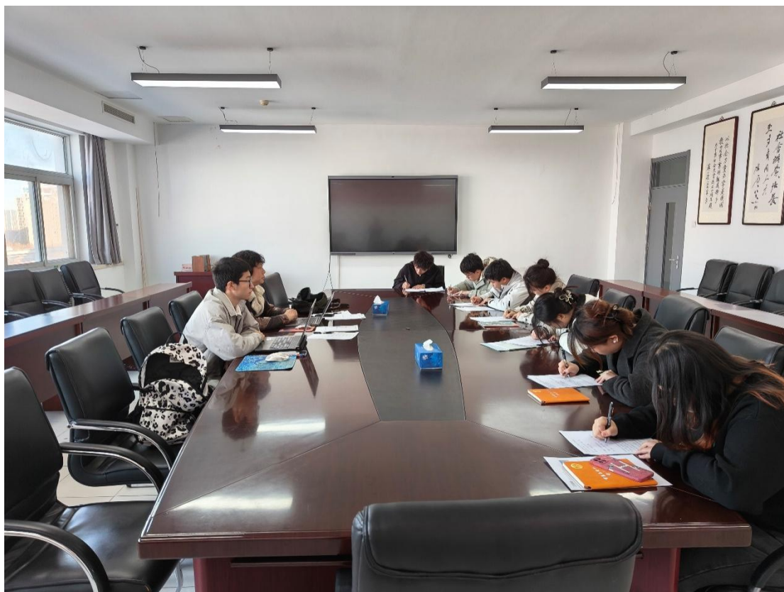
图 4 双创中心成员招募遴选

校外实训基地建设方面，经北京铭扬兄弟影视文化传播有限公司安排，我校影视动画专业与十余家影视后期制作企业确立了校外实训基地关系，由相关企业负责本专业的现代学徒制教学、认识实习、岗位实习和就业承接工作。