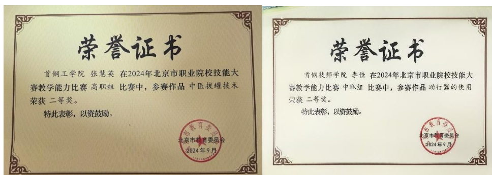
图 8 护理专业老师团队在教学能力比赛中获奖

2024 年，首钢工学院护理专业李佳老师和李艳娇老师分别带队参加的 2024 年度北京市职业院校技能大赛教学能力比赛。在备赛阶段，北京大学首钢医院临床护理专家给予了精心指导。在实训场地方面，更是不遗余力的给予了全程毫无保留的支持。最终两支队伍的老师在北京市比赛中均获得了二等奖的好成绩。