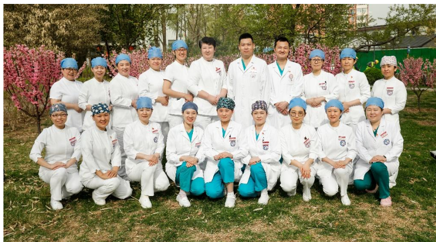
图 3 首钢医院在首钢工学院承担课程的教师

在护理教研室不断创新教学能力的同时，专业老师积极持续进行专业能力的自我培养，与北京大学首钢医院深度合作，从日常查房到大科室教学查房延伸到专科护士的各项护理活动中，共同探讨临床的进展和教学过程中的要点，在教学活动和临床工作中共同寻求护理技能提高和理论循证的方法，在教科研过程中校企共同进步。