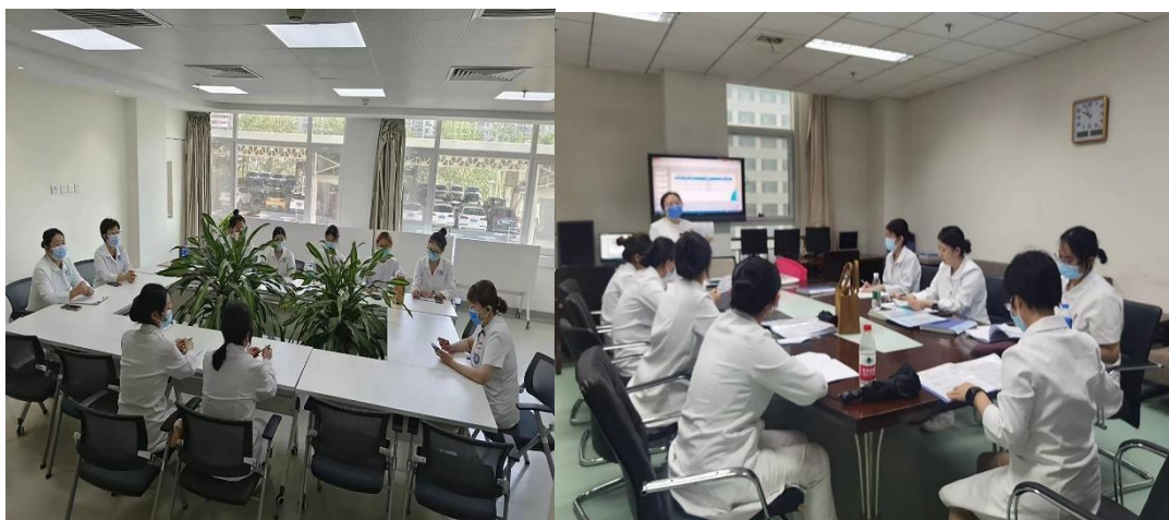
图 4 首钢工学院护理专业教师到北京大学首钢医院进行企业实践