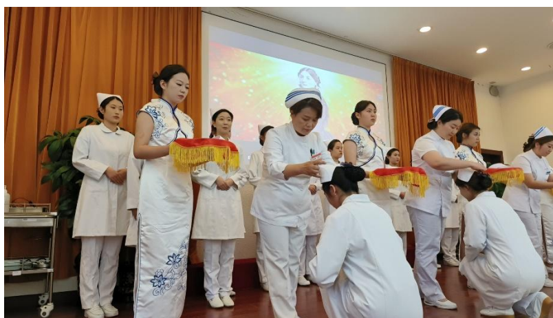
图 5 北京大学首钢医院护理部副主任参加 5.12 护士授帽仪式

首钢医院也积极参与到护理专业的各项活动中。为弘扬南丁格尔精神，提高护理专业学生职业素质，培养护理专业学生对护理事业的热爱，2024 年 5 月 15 日护理与学前教育学院开展了庆祝国际护士节庆祝活动，暨授帽仪式。伴随着“平安夜”的庄严乐曲，护理部白文辉主任为护生戴上圣洁的燕帽，站在南丁格尔像前宣读誓言，并告诉学生要继承和发扬护理事业的光荣传统，奉献爱心，关爱生命。