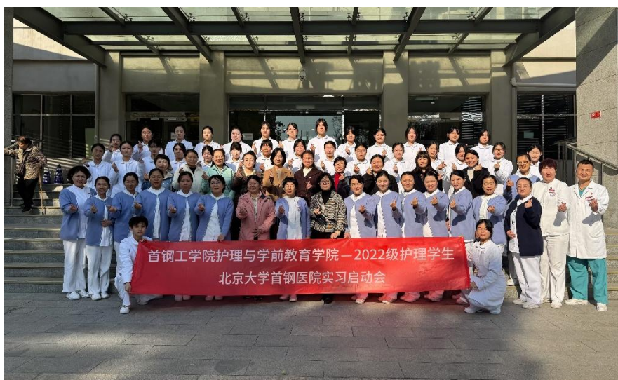
图 10 首钢工学院护理与学前教育学院 2022 级护理学生 北京大学首钢医院实习启动会