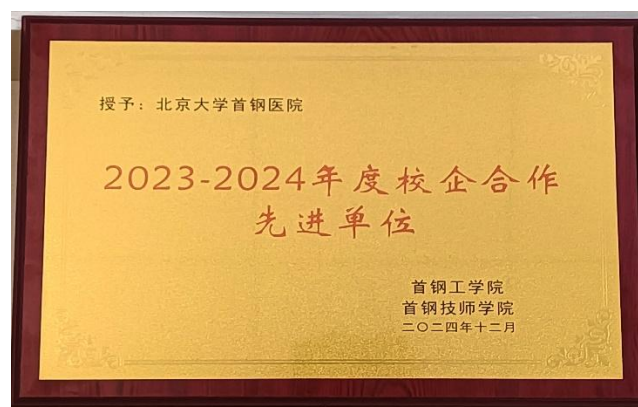
图 2 北京大学首钢医院被评为 2023-2024 年度首钢工学院校企合作先进单位

在医院和首钢工学院双向奔赴的努力下，学校的发展势头越来越好。2024 年，北京大学首钢医院被评为 2023-2024 年度首钢工学院校企合作先进单位。