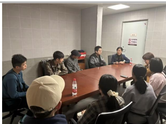
图 5 学徒制实践双师教学指导