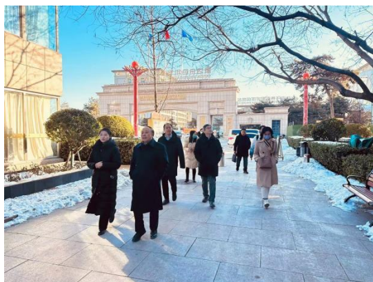
图 1 学校领导来院进行企业考察演练

燕达养护中心作为学校申本的考察企业，参与考察企业实施的相关工作，为学校申本工作提供支持，主要包括为制定迎接民政职业大学申建工作评估专家组的企业考察接待方案提供相关素材，配合完成 14 次企业考察演练活动，完成参观点布置、相关工作人员安排工作，并由营销部总监担任讲解人。