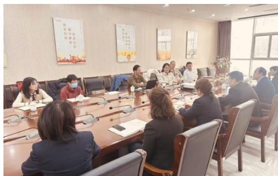
图 3 评估中心建设研讨

围绕校企合作共建老年人能力评估中心、老年人能力评估师、老年辅具器具咨询师评价组织进行多次深入交流，并形成了初步推进计划，下图 3。