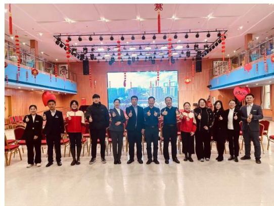
图 2 燕达考察工作组合影（部分成员）