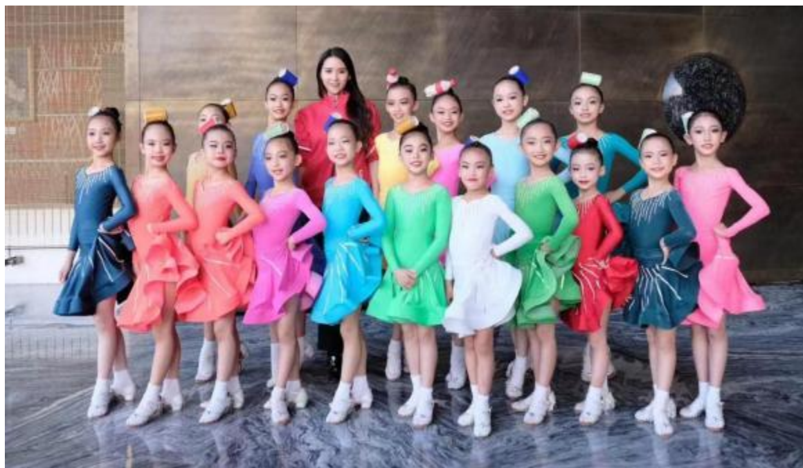
图13-2 学生到企业一线进行实践活动