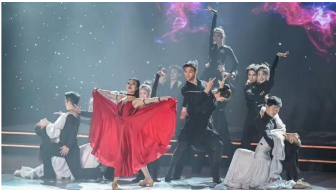
图5 学生参加《北京市第十四届职工文化艺术节》演出剧照

2、2023年12月，舞蹈表演专业学生参加“北京市第十四届职工文化艺术节”演出。