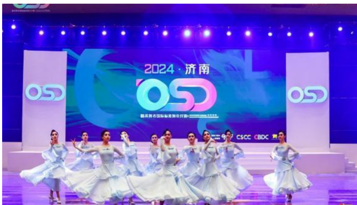
图10 学生在OSD济南站进行三维一体摩登舞等级教材展示与推广