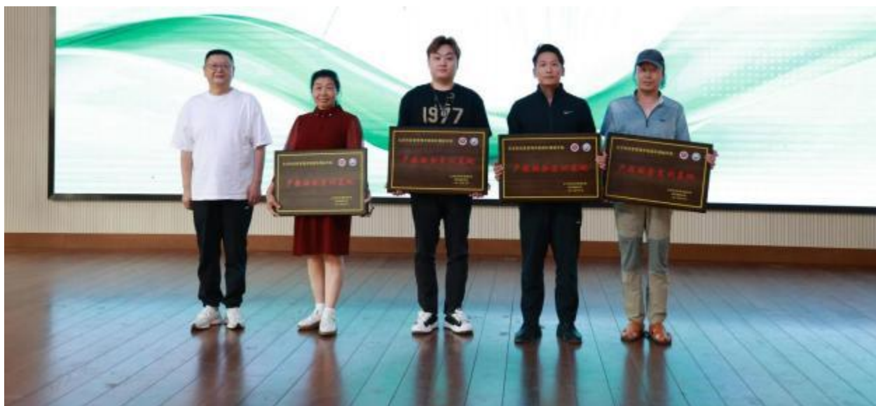
图3 产教融合实训基地授牌

公司非常重视产教融合实训基地的建设，积极调研专业建设要求及行业、产业发展需求，投入人力物力建立产教融合实训基地。实训基地通过与当地产业紧密对接，开设实训课程，实现学生理论知识与实践能力有效的结合，为学生提供更好的技能培训和实训环境。同时，基地也为企业大量提供优秀人才资源，促进企业与专业的深度合作。