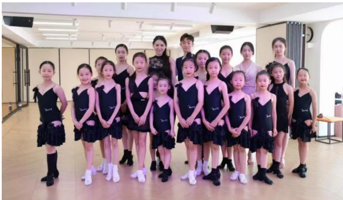
图13-1 学生到企业一线进行实践教学

校企双方积极探索课程改革及建设，以岗定课，岗课融通，以职业岗位为主导，紧贴岗位需求重构课程体系，重组课程内容。根据舞蹈表演专业学生实习和就业过程中发现的问题，及时调整课程开设学期以及课时量占比；根据学生就业以舞蹈教育教学为主要岗位需求，增加舞蹈教学法的课时量并将舞蹈教学法技术术语的授课比重降低，增加教学方法以及课堂模拟教学的环节，在企业的安排与协助下将教学法课堂搬到企业，进行实践教学。