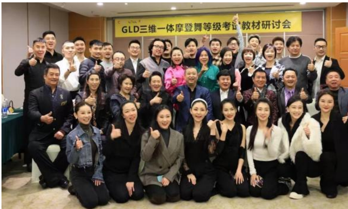
图9 专业教师、企业专家、行业专家共同参加考级教材研讨会

公司成立专项小组，与OSD共同合作，投入资金和人力参与GLD三维一体摩登舞等级考试教材研发，组织专业学生成立考级教材录制推广小组，进行考级教材的普及推广。在此过程中，学生们不仅能够学习到市场最新的考级教材，为毕业后就业增加筹码，同时也锻炼了沟通、交流能力，更加锻炼了团队协作精神。