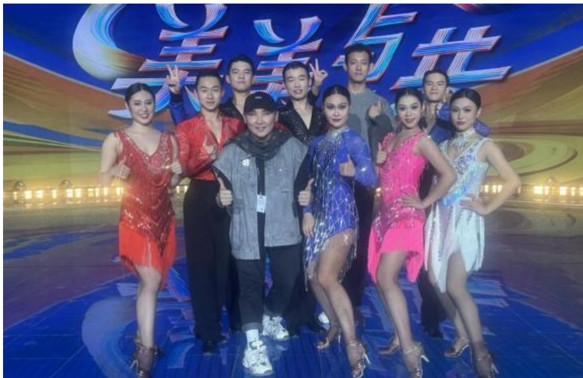
图4 学生参加《美美与共》演出现场合影

1、2023年11月，舞蹈表演专业学生参加“一带一路”十周年“美美与共”国际文化交流活动。