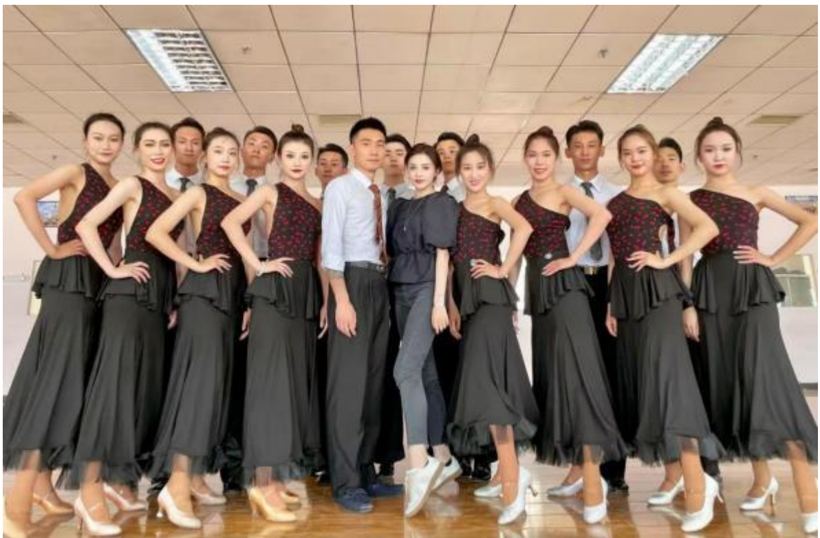
图8 专业教师到企业挂职授课