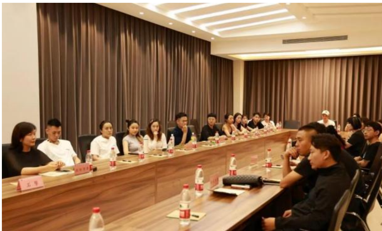
图1-1 人才培养方案修订企业座谈会

2024年7月4日，我公司选派企业负责人、企业导师并邀请众多行业专家、企业专家参与舞蹈表演专业人才培养方案的修订。企业负责人、企业专家们从企业需求人才实际出发，阐述了当前行业发展急需舞蹈表演专业人才需求现状，重点强调了具备就业市场竞争力应具备的综合能力的培养；企业负责人、企业专家参与了舞蹈表演专业人才培养方案修订的调查问卷。