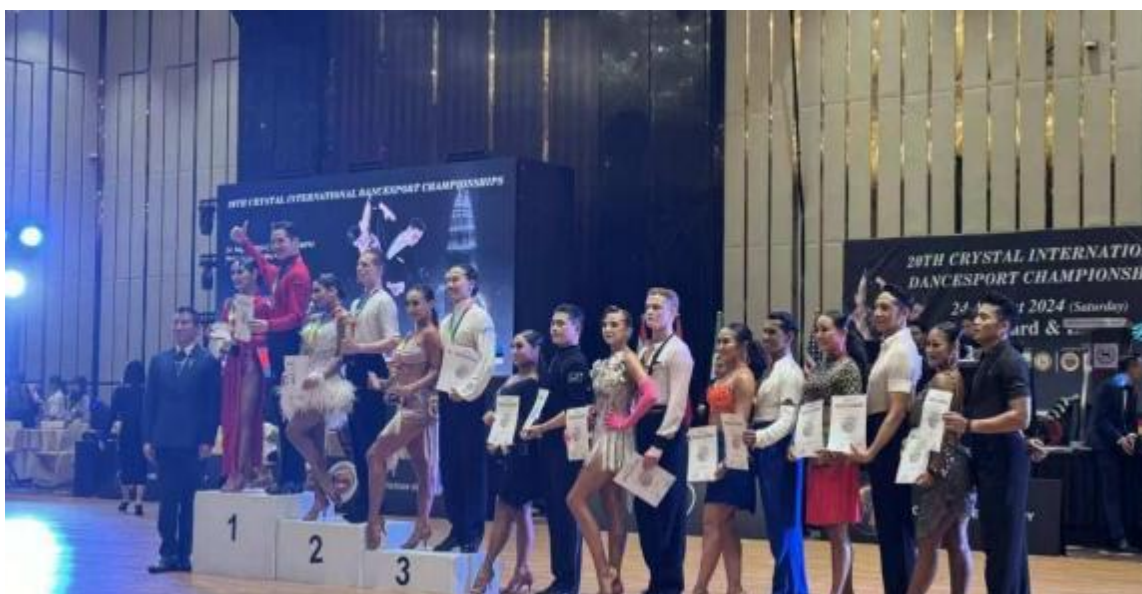
图11-2 教师参加 2024 The 20th Crystal International Dangsspot Chanpionship 并获奖