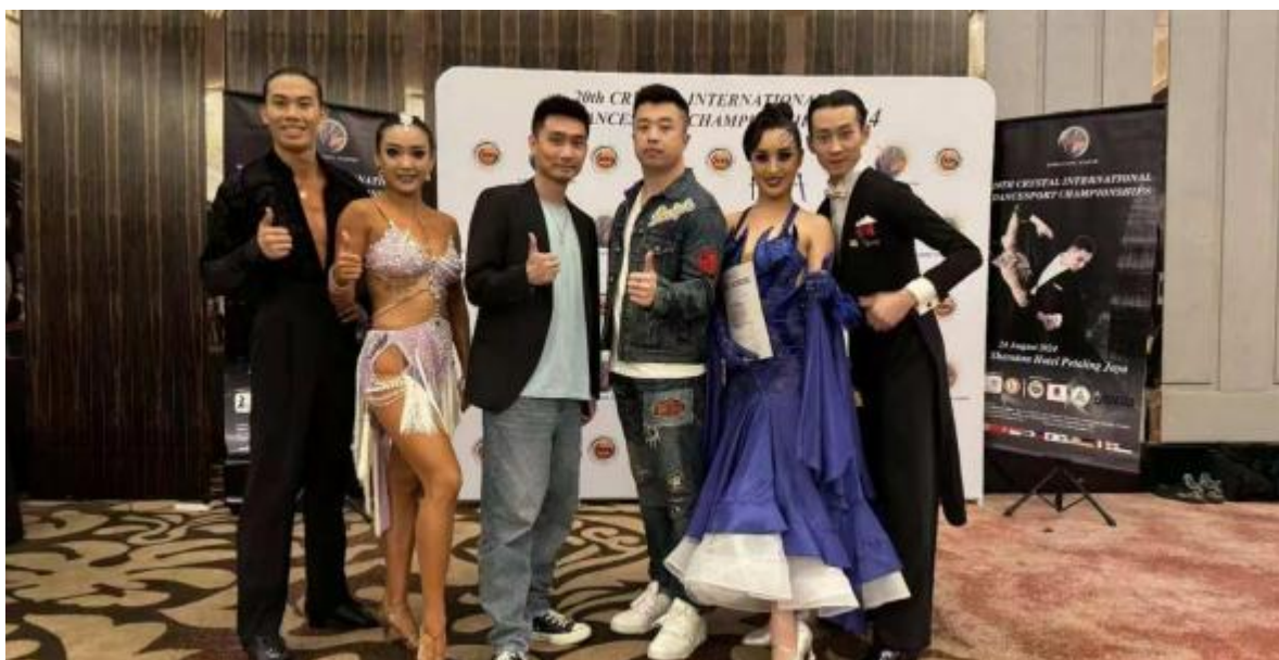
图11-3 专业负责人与企业专家与获奖教师及学生合影