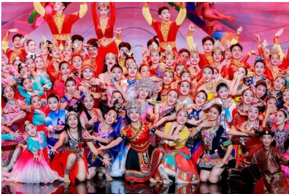
图6 学生参加国家大剧院《我和祖国一起成长》六一主题演出活动

3、2024年6月1日，舞蹈表演专业学生参加国家大剧院《我和祖国一起成长》爱国主义教育六一主题演出活动，舞蹈表演专业学生已经是连续两年参加该品牌演出活动，受到主办方工作人员的一致好评。