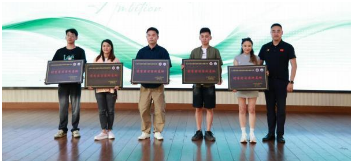
图2-2 优秀实习实践基地授牌