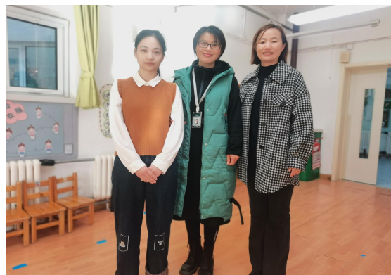
美术教师进入幼儿园指导环创