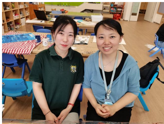
学院教师与实习生交流