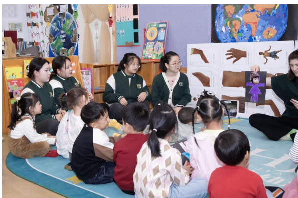
实习生观摩外教上课