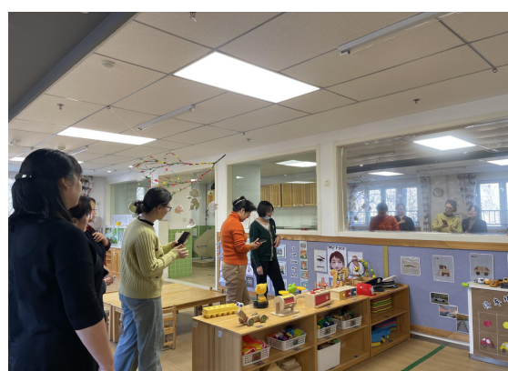
学院教师参观幼儿园环创