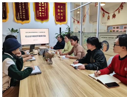
研讨合作开发教材