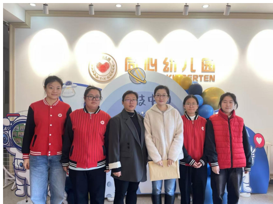
学院教师进入幼儿园指导实习生工作