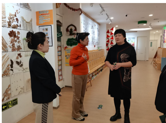
院园领导交流沟通