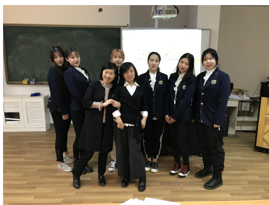
毕业设计答辩完成