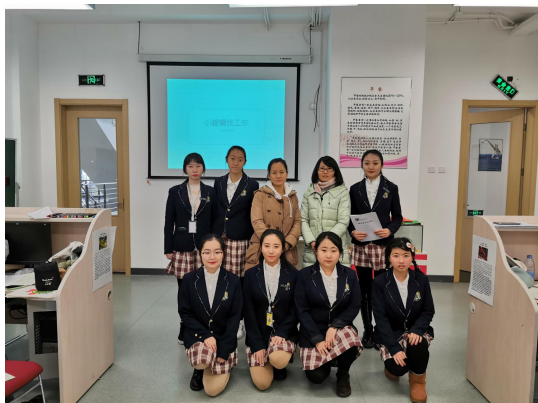
幼儿园指导教师参与指导毕业设计

教师学院自开展围绕幼儿园主题教育活动的毕业设计起，每年都会邀请幼儿园教师参与毕业设计指导工作，指导学生的毕业设计选题、教案设计、模拟上课、专业答辩等，幼儿园教师参与毕业设计指导工作，学生从中可以获得更加专业、更贴合一线的教学指导，学生受益颇丰。