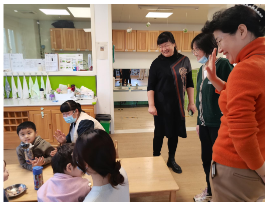
学院教师进入幼儿园观摩