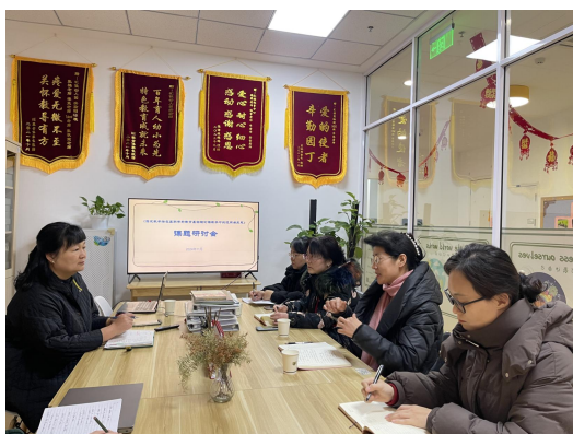
院园共同开展课题研究

教师学院与汇佳幼儿园实验园共同开展课题《探究教学法在高职学前教育基础理论课教学中的运用与反思》的研究工作，2024 年 12 月此项科研课题顺利结项。接下来，校企双方还将共同合作开发新型、活页式教材，进一步助力学前教育专业的科研改革与创新。