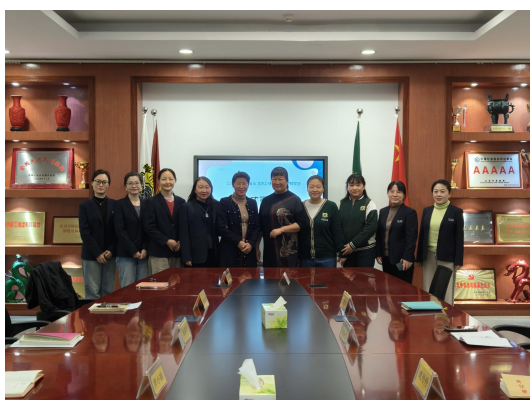
院园双方共同开展岗位人才需求研讨

依托汇佳实验幼儿园托育班小苗圃班为基础，教师学院与汇佳实验幼儿园多次开展托育服务与管理专业的岗位人才需求调研，同时，针对托育服务与管理专业的培养目标、课程设置、培养模式展开深入探讨，助力我院托育专业的进一步发展。