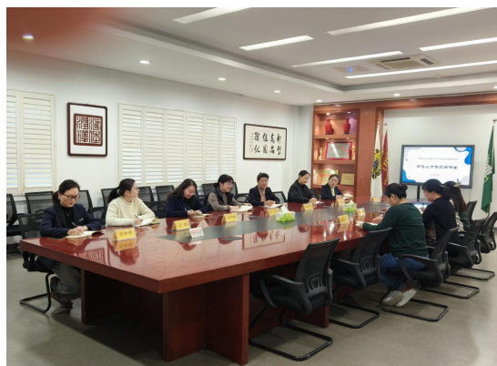
深入研讨人才培养方案