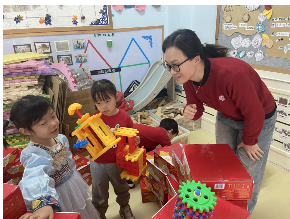
学院教师参加企业实践活动

学前教育专业建立“双导师”机制，即幼儿园实习指导教师和学院指导教师。“双导师”需要具备“双师”能力，即：幼儿园实习指导教师不仅要自身专业能力过硬，同时要具备“带徒弟”的教学能力。学院指导教师不仅具备学科扎实的专业理论知识，同时要具备企业的实践能力。因此，要加强“双导师”机制，对教师既有“培养”，又有“考核”，校企深度合作，有助于校企双方加强建设“双导师”的选拔、培养、管理、激励等方面工作，提升“双导师”的“双师”素质。