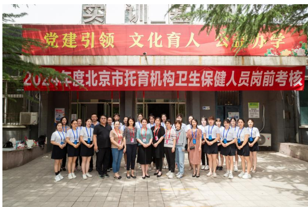
图 5 在北京科技职业学院举行的 2024 年度北京市托育机构卫生保健人员岗前培训

泰成方舟与学院的合作，成为了产教融合的典范。双方的合作模式、合作成果和经验做法，得到了上级部门、行业协会和社会各界的广泛认可和高度评价。这一合作模式也为其他高校和企业提供了有益的借鉴和参考。