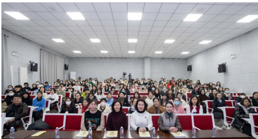
图 4 在北京科技职业学院举行的昌平区托幼（育）机构“医育结合”专题培训

升了公众对学前教育及婴幼儿托育重要性的认识，校企合作完成北京市托与行业保健医职业岗前培训考试，协办了昌平区的托育职业技能大赛，也推动了行业内外的资源共享和协同发展。