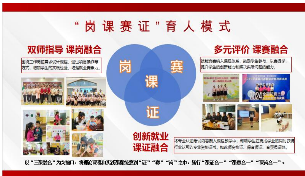
图 2 “岗课赛证”育人模式图

教融合的职业教育特点，在“一院两园一平台”的产教融合背景下，学院以成果为导向，不断深化教育教学改革，优化课程设计，构建“岗课赛证”育人模式，学生在 2024 年的学前教育幼儿教育赛项比赛中，荣获北京市一等奖，并代表北京市参加世界职业院校技能大赛。同时，该模式也为提高毕业生的就业率和就业质量提供了有力支撑，整体教学成果斐然。