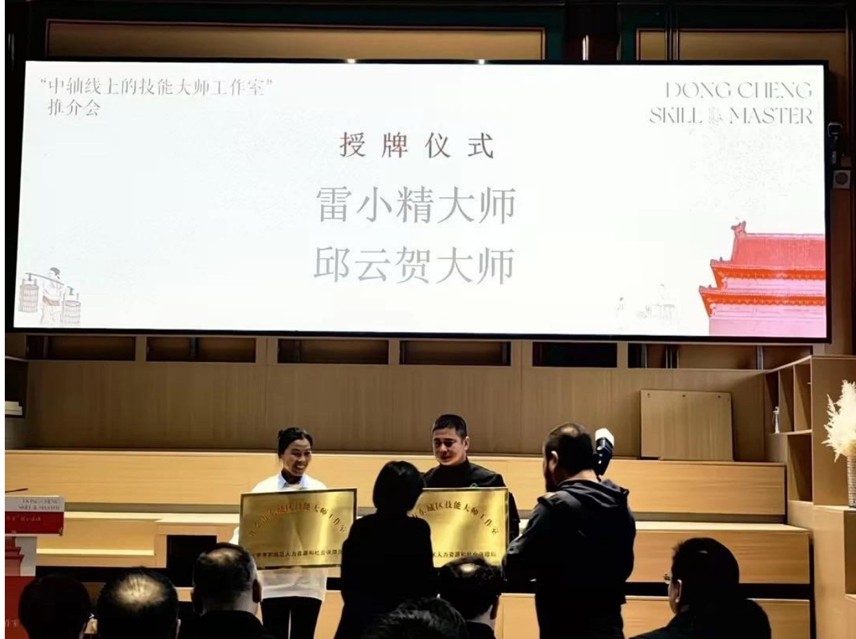
图 15 雷小精技能大师工作室授牌仪式