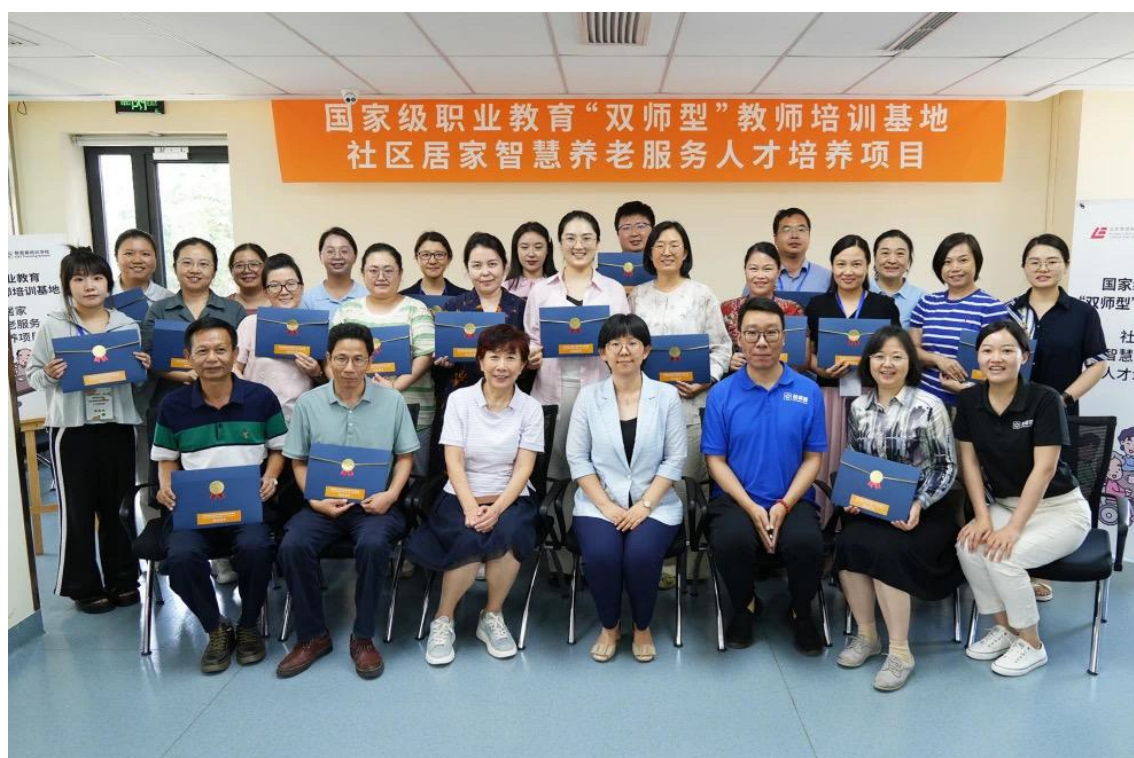
图 8 国家级职业教育“双师型”教师培训基地项目

本次培训内容内容涵盖中国老龄化及国家政策解读、社区居家养老服务实践与管理、康养服务人才素养发展模型三大模块，项目设计结合研修班学员背景，定制真实情境、真实任务及真实服务团队开展，围绕国家政策解读、社区居家养老实务、银发经济视角下智慧健康养老行业现状及政策分析、乡村振兴村养老模式调研、养老人才培养、校企产教融合、智慧养老专业课程建设开发、居家智慧养老服务人员的培养等方面开展探讨。