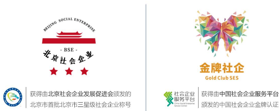
图 1 三星级及金牌社会企业认证

2019 年获得首批北京市三星级社会企业的称号，并通过了中国社会企业认证的最高等级—金牌社会企业认证。