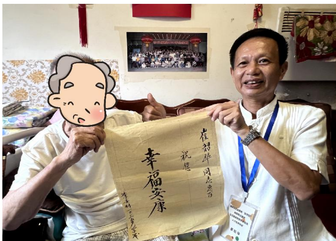
图 10 “双师型”教师培训基地项目参与居家养老服务模式