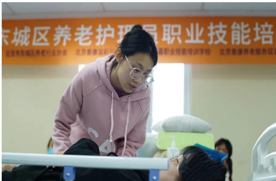
图 4 东城养护理职业技能大赛实操赛场