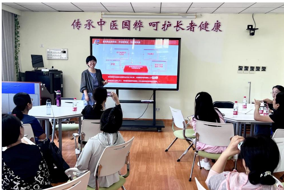
图 11 “双师型”教师培训基地项目参观智能实训室