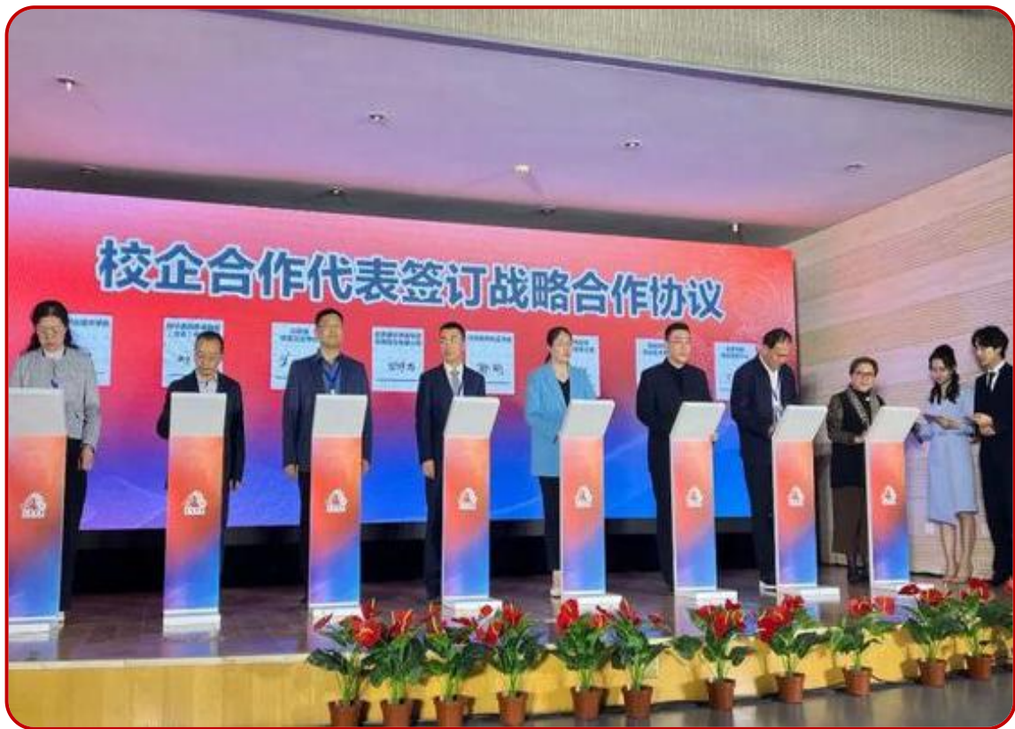
图 17 京津冀养老服务人才校企合作培养对接会