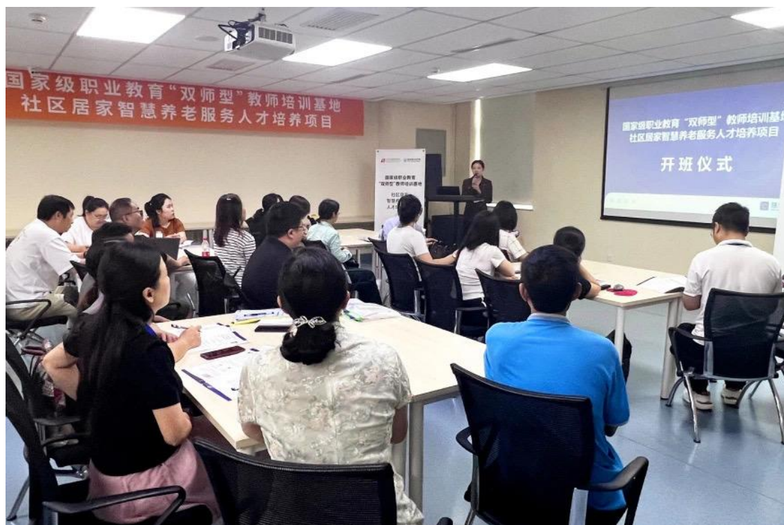
图 9 国家级职业教育“双师型”教师培训基地项目开课仪式