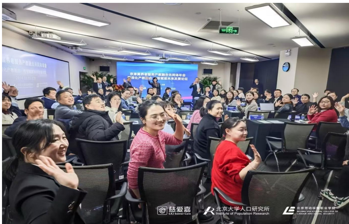
图 21 京津冀养老服务产教融合共同体年会大合影