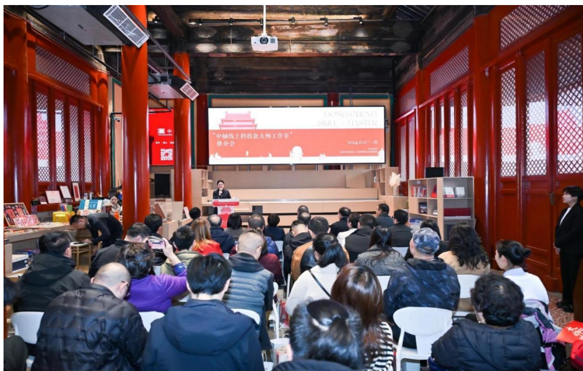
图 14 北京市中轴线上开启技能大师工作室推介会