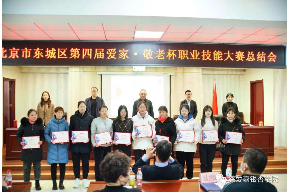
图 3 东城养护理职业技能大赛总结会现场