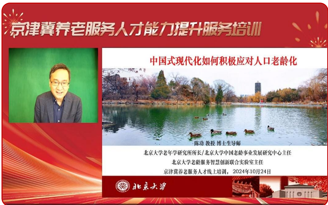
图 18 京津冀养老服务人才能力提升培训