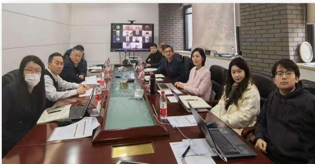
图 19 北京大学人口时间银行项目

五是产学研协同发展，为院校及产业发展赋能。北京大学人口研究所融合专业教育特性，聚焦育人助人项目运作，首创体验式老年学课程体系。牵头《以时间银行创新推动实施积极应对人口老龄化国家战略的理论和应用研究》国家社会科学基金重大项目，推动时间银行社区助老模式；出版《大国养老：中国特色养老服务体系纲论》《中国时间银行发展研究报告》《智慧健康养老服务教学创新研究》等3部专著。慈爱嘉研发的智慧养老平台，通过远程监测老年人健康数据，协同提供智能护理等技术，打造了“没有围墙的养老院”。