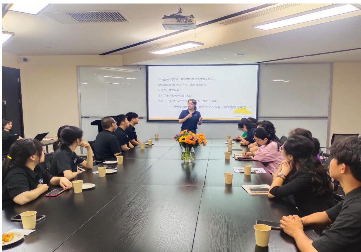
图 7 “入学即入职”人才培养启动仪式