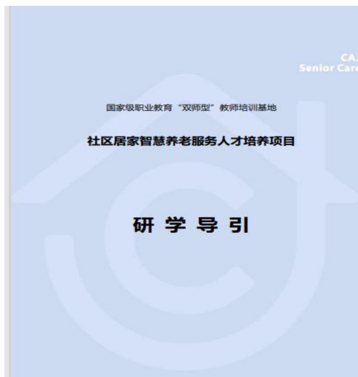
图 12 “双师型”教师培训基地项目研所手册