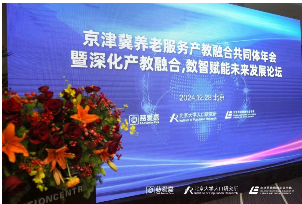
图 20 京津冀养老服务产教融合共同体年会

沿线国家养老人才培养研讨会，近 600 人次学生取得国际执业能力证书。1 个专业标准和 9 门课程标准获得一带一路 2 个国家认证，5 门课程资源纳入泰国曼谷职业院校课程体系。