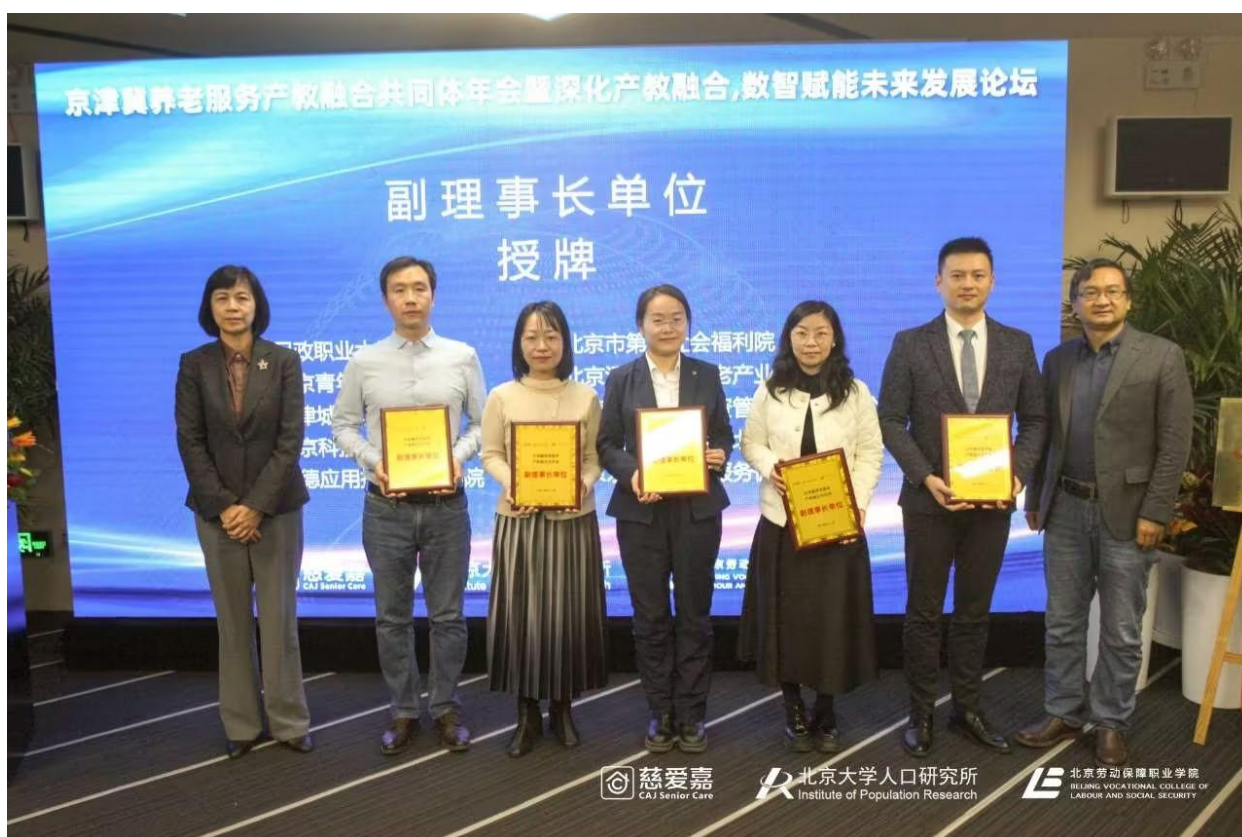
图 22 京津冀养老服务产教融合共同体理事单位授牌