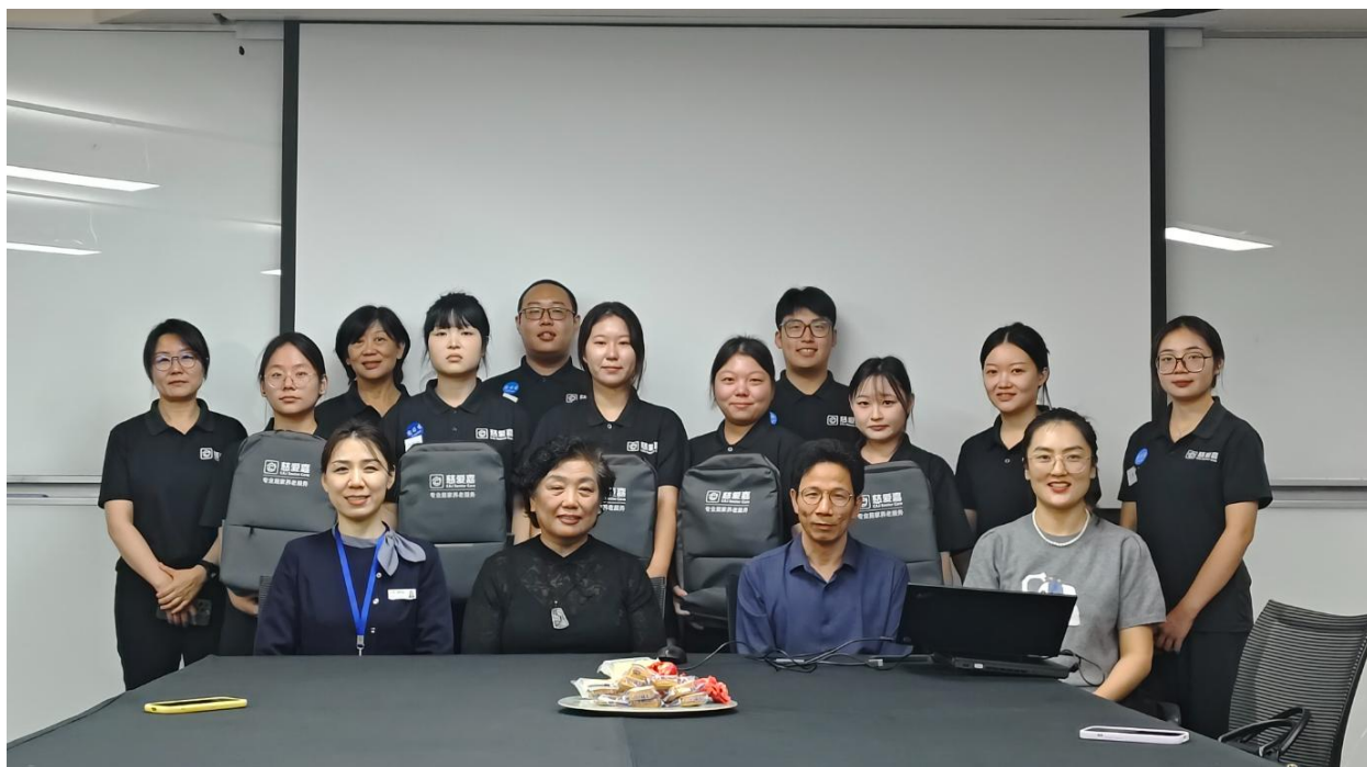
图 6 “入学即入职”项目 23 级启动仪式