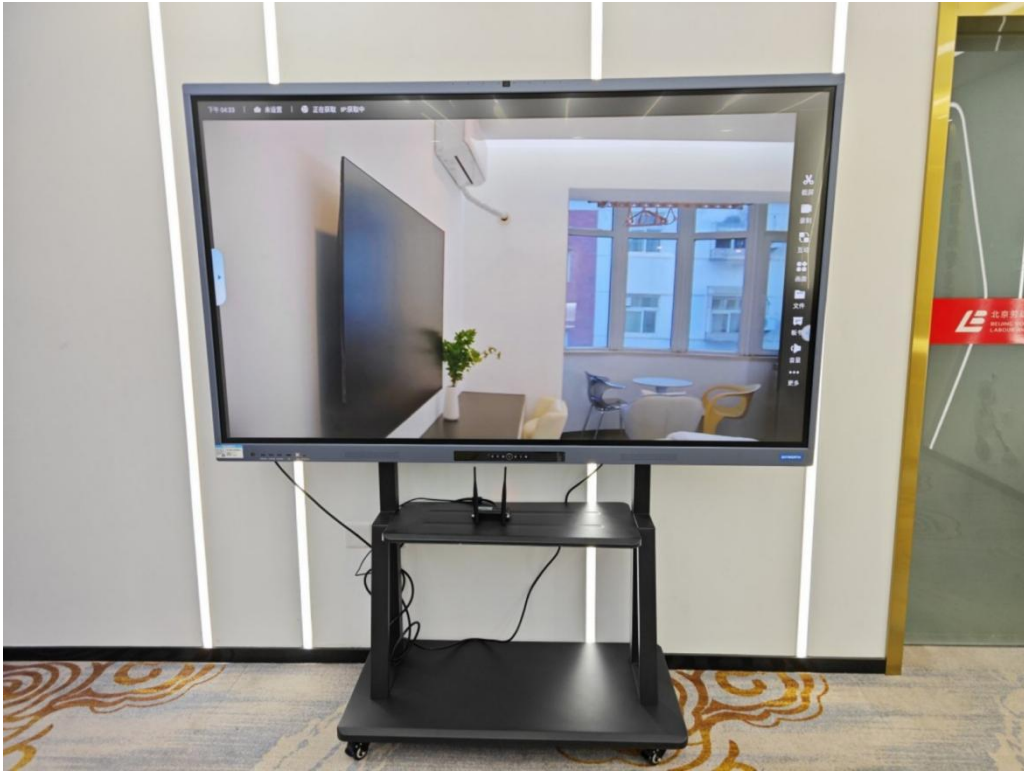
图3 移动示教系统智慧互动终端

家政清洗护理教学套装：主要包括定制扫地机器人、地板打蜡机、地毯清洗机等。主要用于教授学生熟练掌握设备的操作试用，以及如何高效的进行清洁和护理工作，有助于提升学院在新科技下现代家政行业中新产品运用的专业技能。