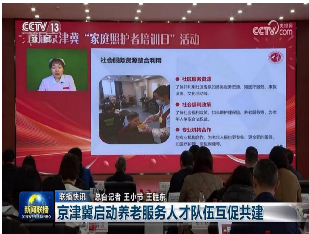
图4 首届“家庭照护者培训日”活动直播现场

为“同质同标”推进三地养老服务人才队伍互促共建，切实发挥实践教学、社会培训、岗位锻炼等在人才培养方面的重要作用，今年7月，京津冀三地民政部门联合印发了《京津冀养老服务人才培训基地、见习基地管理办法（试行）》。经过近半年的申报、评审、公示程序，劳职院成为首批京津冀养老服务人才培训基地之一。