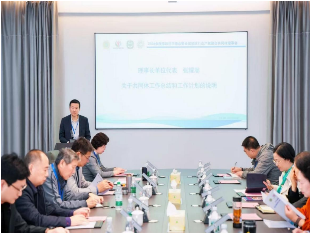
图5 参加全国家政行业产教融合共同体理事会