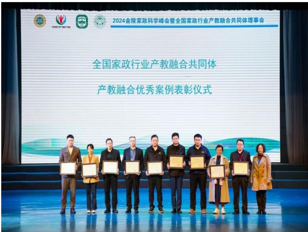
图6 美亚联创接受产教融合优秀案例表彰