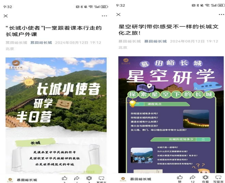
图 12 周嘉仪同学参与编辑、运营的公众号内容

而“长城小使者研学半日营”活动同样倾注了她大量心血。从活动主题的确定到具体流程的设计，每一个细节都经过了反复推敲。她巧妙地将长城知识讲解、互动体验游戏以及小使者实践任务融入其中，使孩子们在轻松愉快的氛围中深入了解长城，激发他们对传统文化的热爱与传承意识。