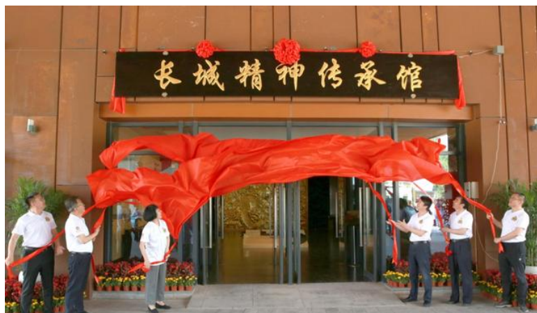
图1 2021年学院与慕田峪公司达成校企合作

2024年在原有合作的基础上继续深化校企合作，推进文旅产教融合发展，共同打造了《我为长城造条船》短视频创作与运营项目，本项目属于校企联合专周实训，对接长城精神传承馆文创部新媒体运营实习生岗位，主要工作职责是文旅内容短视频创作、平台分发与编辑、研学产品宣传等内容。双方开展校企合作以来，从人才培养方案、课程设置、实习实训、师资培训、课程开发等方面全方位开展校企合作。通过对岗位核心能力的分析，将《短视频创作与运营》实习周的教学内容进行了分解和流程化实施，如下所示。