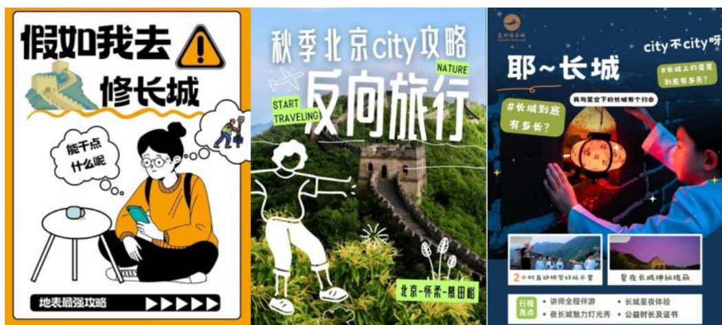
图 9 慕田峪新媒体运营岗位见习学生作品

慕田峪公司为学生提供了暑期见习的机会，通过多元评价系统，最终遴选出 3 名学生参与了岗位的实习。通过实习，学生反馈不仅学到很多实用的技能，还体会到了团队合作的重要性。学生走进企业了解产业发展，提前了解岗位，感受职业生活，提高职业素养。