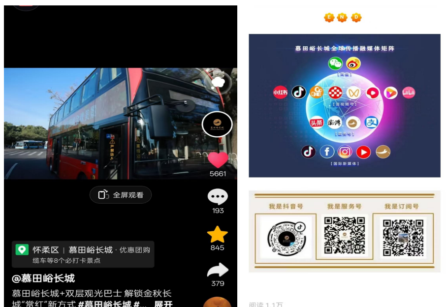
图 14 “慕田峪长城 + 双层观光巴士”短视频在不同平台的点击量与获赞量

在深秋红叶正盛的时候，这个短视频的传播确实给慕田峪长城文旅项目带来了一些积极影响，在一定程度上提升了景区的知名度和美誉度，吸引了更多不同地方、不同年龄的游客前来感受长城秋日景色，对景区客流量增长起到了促进作用，也算是为当地文旅产业发展和校企合作在文旅推广方面积累了一些有宜的经验。