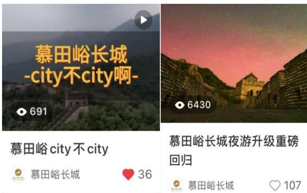
图 8 学生作品投放在企业官方小红书平台