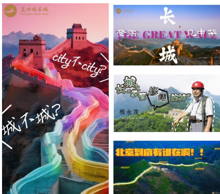
图6 学生短视频作品视频封面设计