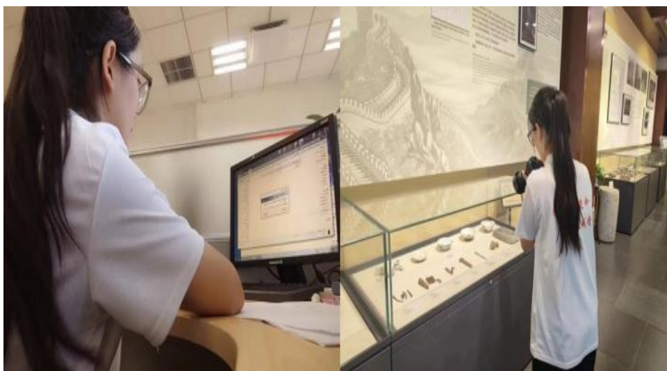
图7 学生在长城精神传承馆岗位实践环节

本项目将慕田峪公司新媒体运营岗位真实生产场景融入教学中，使课程内容与实际岗位对接，教学上采用“全案项目化+个案模块化+素养职业化的”的创新模式，将短视频创作与运营项目的课堂搬到了企业工作场景中，并对学生创作的作品进行了真实投放，接受市场检验。