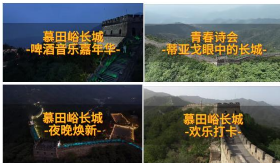
图 10 刘晓雨同学策划、拍摄、剪辑的项目

刘晓雨同学在企业实习的实践过程中，根据热点话题和宣传方向进行选题，保障了视频的内容的时效；她还参与了多次活动拍摄工作如锅包肉品鉴会，礼遇产品全流程等，在拍摄过程中，注重捕捉活动亮点和精彩瞬间，确保了素材的丰富性和多样性；参与了三次直播活动，负责了直播前的设备检查、直播期间关注观众评论和舆论导向，确保直播活动的顺利进行；在部门安排下，她参与了夜长城的值班工作。等待古筝汉服老师及时到场表演和老师物品存放。这不仅让实习学生更深入地了解了慕田峪长城的夜间景观和文化特色，还锻炼了其的应变能力和团队协作能力。通过与其他值班人员的紧密配合，确保了夜长城活动的顺利进行。以下是刘晓雨同学企业实习过程中参与制作的短视频。