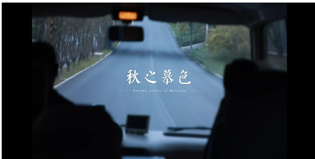
图 13 影视专业教师与学生参与拍摄的“慕田峪长城 + 双层观光巴士”短视频

2024 年 10 月，在校企合作积极推进的情况，我们共同打造各种项目，其中推出的“慕田峪长城 + 双层观光巴士”旅游产品组合，算是在金秋长城“赏红”模式上进行了一次新尝试。北京京北职业技术学院在这个项目里，依据自身的专业特点，安排影视专业骨干教师带着一些专业基础尚可、有点创新想法的学生，组建了拍摄团队，与慕田峪长城旅游服务有限公司携手合作，参与到《秋之暮色》短视频创作当中。