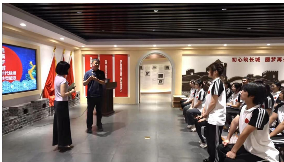
图5 企业导师罗经理与教师一同上课

策略指导。这种师企联合教学模式，让学生们在学习过程中就能够与市场需求接轨，避免了理论与实践脱节的问题。