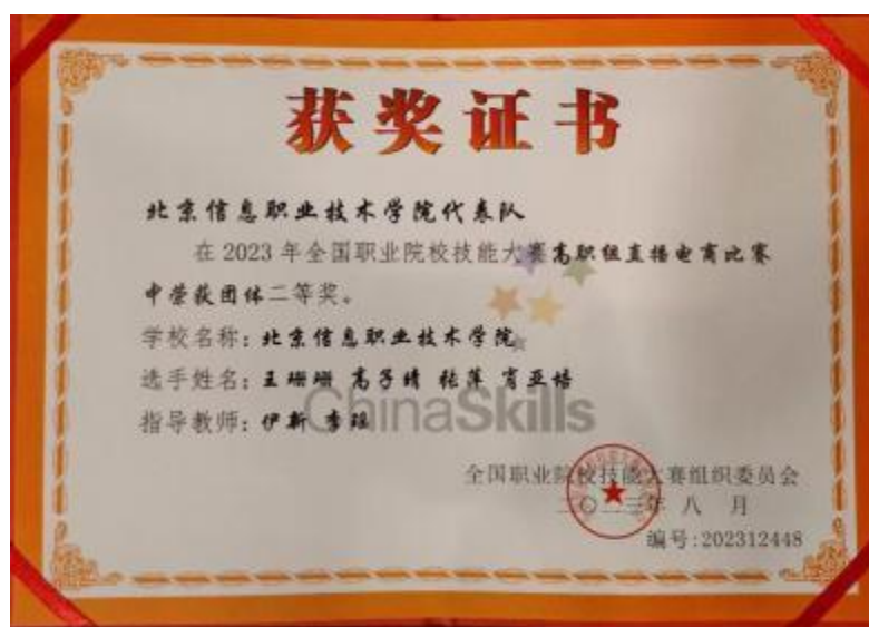
图6 以“赛”提“技”获得直播电商国赛二等奖

南京奥派与北信将课赛深度融通，以赛提升教学水平,以赛促进课程改革优化。首先深入分析和解读赛项规程，尤其是其中的竞赛内容和评分标准。在全国职业技能大赛直播电商赛项中，取的全国二等奖的名次。