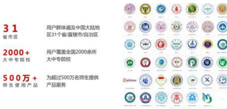
图1 南京奥派企业服务用户情况

公司于2002年研发了国内首套电子商务虚拟仿真教学实训软件，并将虚拟仿真技术陆续应用在财经商贸、公共管理等专业领域，产品覆盖2000余所普通高校和职业院校。2015年，公司确立了应用数据技术持续提升人才培养质量的研发战略，在800余所职业院校开展了第三方人才培养质量评价试点，参与教育部职业教育数字化治理有关工作，为18个行业构建人才需求谱系图提供技术支撑。2016年起服务浙江省商业类（电子商务模块）职教高考，2023年起服务山东省电子商务类职教高考，同年的8月份成为全国职业技能大赛直播电商赛项的技术支持单位。