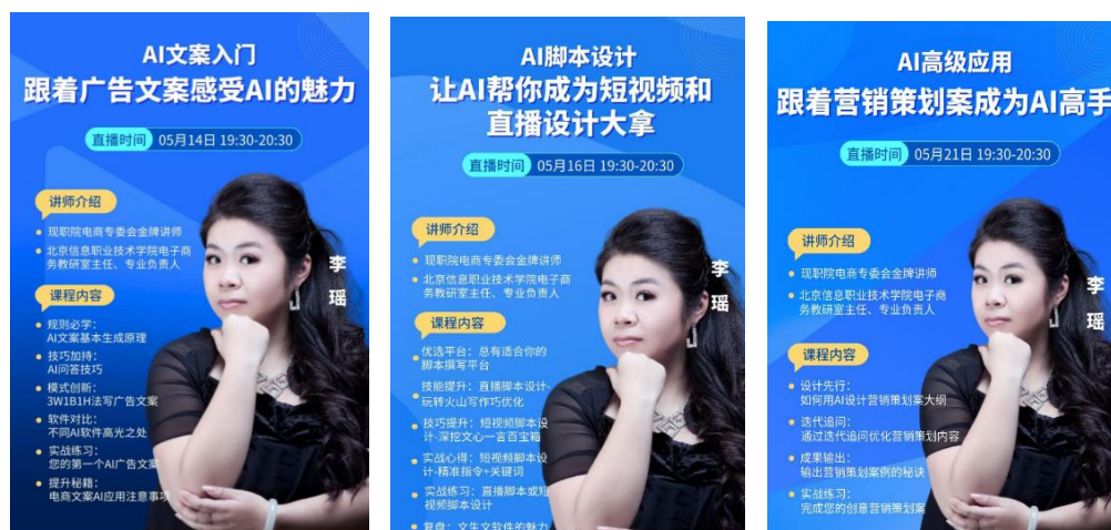
图7 开展AIGC赋能电商教师直播课

通过北京信息职业技术学院电子商务专业与南京奥派基于岗位的人才培养的深度合作，我校电子商务专业教研室主任发挥专业特长，2024年作为北京市职教学会电子商务专委会秘书长赋能北京中高职教师，开展了AIGC助力职业院校教师高效办公和教学应用、AIGC助力职业院校教师科研质量与提升的专项培训，企业通过培训了解了院校电子商务专业教学对AIGC技术应用的需求，在南京奥派平台上加入了大模型的应用，把文生文、文生图、文生视频嵌入平台，北京信息教师的专业研究助力了企业平台的升级改造，同时推动了京津冀职业院校电子商务专业教师AIGC赋能。