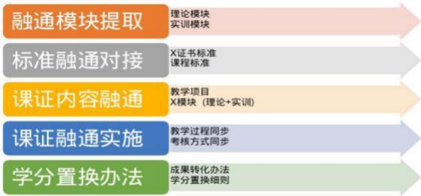
图2 校企课证融通实施路径

校企双方积极参与直播电商职业技能等级证书的申报工作，成功获批了直播电商职业技能等级证书试点资格。证书申报与试点合作从岗位、课程深度融合，通过证书有效检验学生的学习效果。校企双方共同制定了X证书培训与考核方案，组织学生开展培训和考试工作。