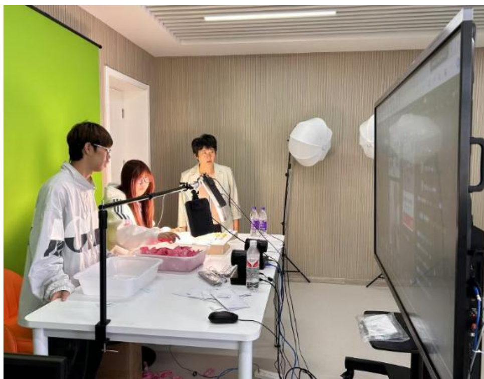
图3 校企共建直播间开展生产性实训

在设备安装调试过程中，南京奥派的技术人员全程参与，为学院提供了技术支持和培训，使学院教师和管理人员能够熟练掌握设备的操作和维护方法。目前，实训基地已正式投入使用，为学生提供了良好的实践教学环境。