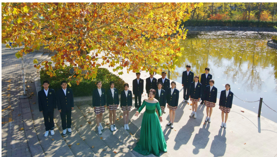
图 14：校园红歌演唱会