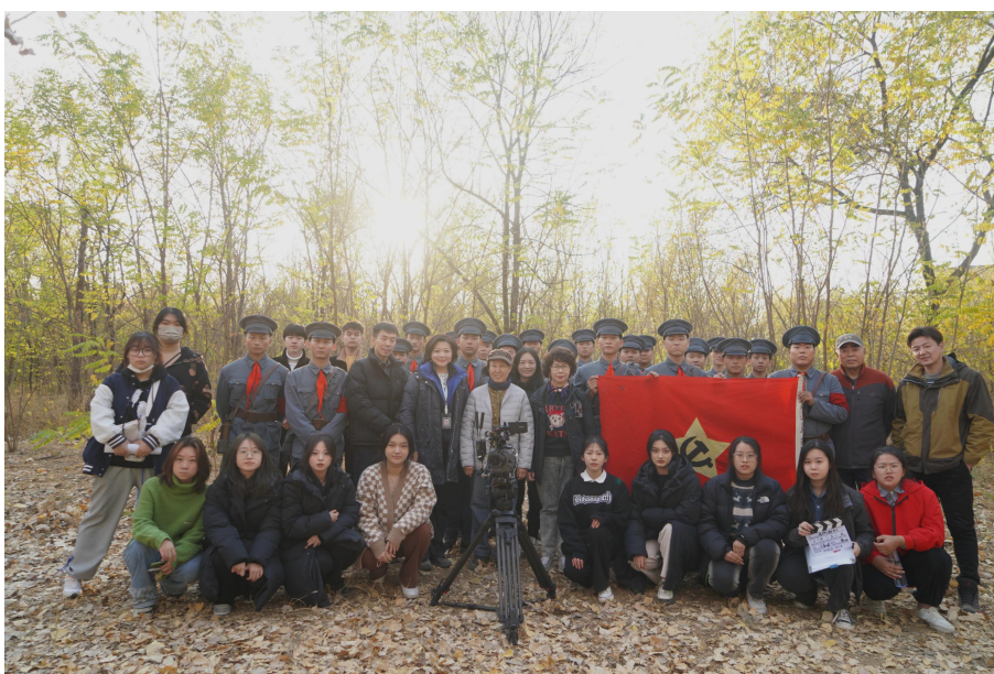
图 13：创编校园版 MV《三湾改编》主题曲《信仰之树》，荣获“最受师生欢迎奖”

国际影视艺术学院是北京汇佳职业学院和北京大美海景国际文化传媒公司产教融合而建立的产业学院。合作企业的创始人白丽君董事长是中国人民解放军八一电影制片厂高级化妆师，深耕影视行业50多年，参与拍摄百余部影视剧，具有独特的党建主旋律风格，参拍的影视作品曾荣获金鸡奖、华表奖等国家级专业重要奖项。其在汇佳校园内建立了“白丽君大师工作室”。结合企业优势，把主旋律电影的红色基因融合到教学大思政中，坚守红色文艺阵地，构建“思政课程+课程思政”大格局。在组织师生参加北京大学生音乐节时，创新思政教学模式，把电影《三湾改编》主题曲《信仰之树》改编为校园版MV，荣获“最受师生欢迎奖”，并有7名参加演出和制作的学生成为入党积极分子，红色基因浸润和催生了新时代的红色演艺人才。