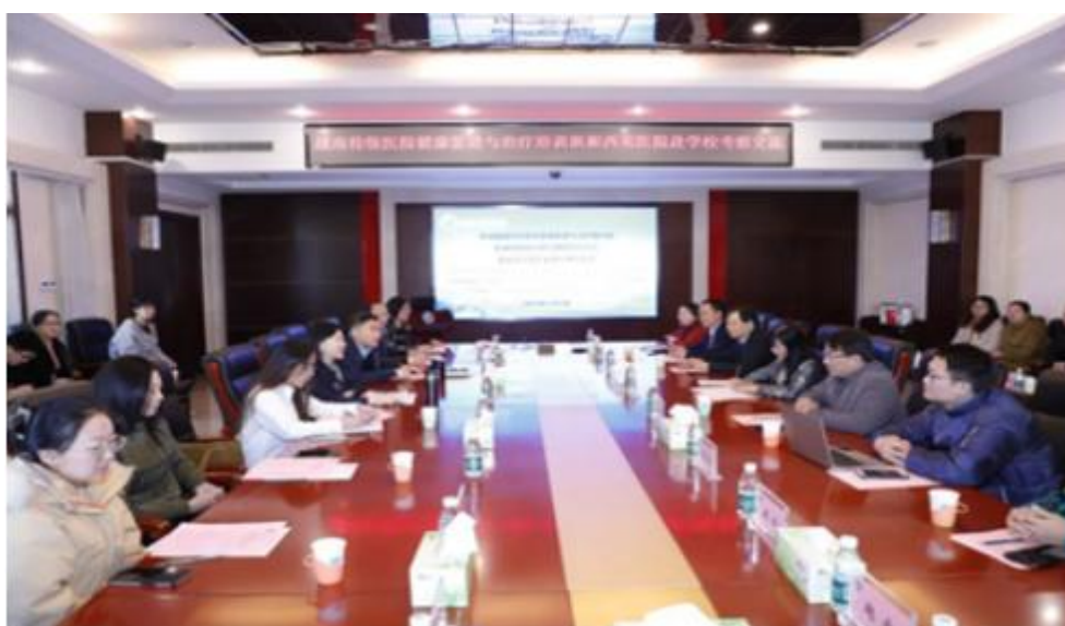
图 4-2 中国中医科学院西苑医院赴北京卫生职业学院考察交流