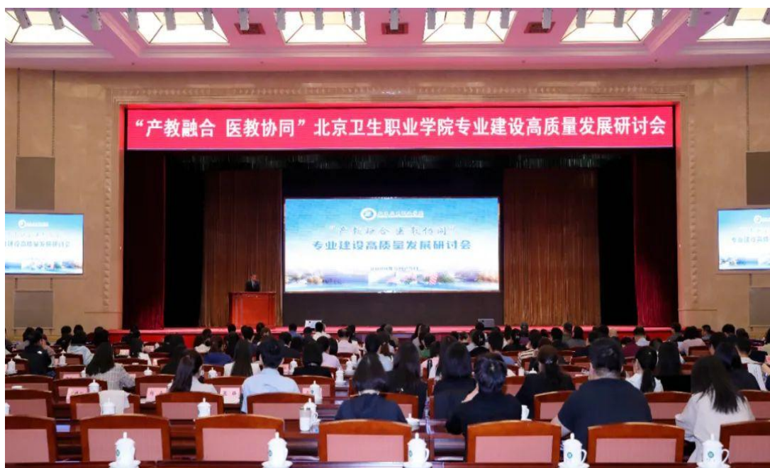
图 5-1 北京卫生职业学院“产教融合，医教协同”专业建设高质量发展研讨会

历史上规模最大、校外专家数量和影响力最大的专业建设研讨会。开启了我校专业高质量发展新篇章。学校在北京市卫生健康委的关怀帮助下，在行业企业专家的指导支持下，全校师生共同努力，大力弘扬教育家精神，进一步整合“政、行、企、校”各类资源，完善校院（企）联合培养机制，实现师资、技术、设备等资源在学校教育和产业发展中的全面共享与互通互融，以共享共赢的有效行动积聚融合实力，实现学校的高质量发展，服务首都卫生健康事业的高质量发展。