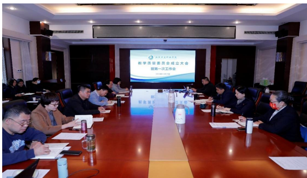
图 6-8 教学质量委员会成立大会

为了全面推进学校课堂教学质量评价工作，学校形成以系（部）为主体，以校级督导为主导的课堂教学状态评价机制。进一步明确学校各级、各类听评课工作的规范化要求。根据《北京市职业院校教学管理通则》、《北京卫生职业学院教学质量保障“护堤行动”计划》等文件精神，特制定《北京卫生职业学院课堂教学质量评价规范》。