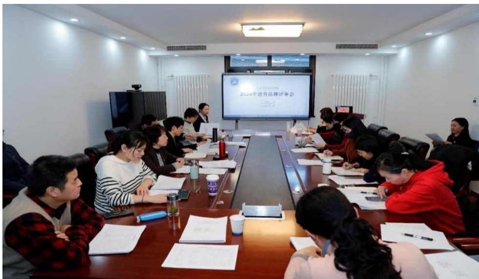
图 1-1 2024 年德育品牌评审会