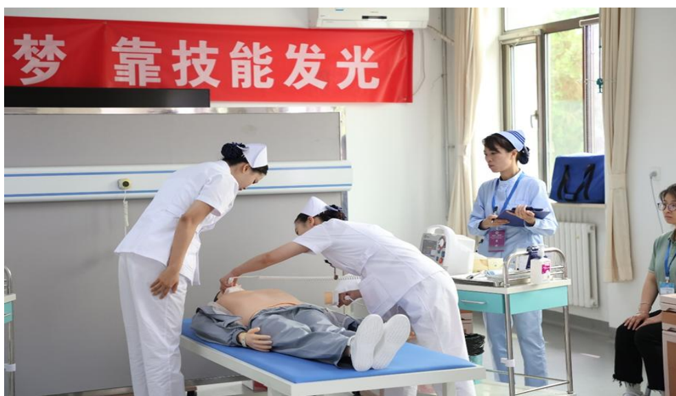
图 1-9 护理技能赛项赛事现场