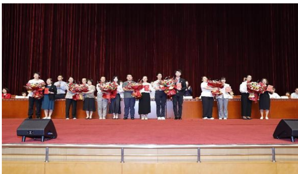
图 6-6 “拜师仪式”环节

2024 年学校入职专任新教师共 14 人。入职后为帮助新教师尽快适应教学岗位，走上讲台、站稳讲台，为每位新教师安排相关专业、具有高级职称的指导教师，进行为期半年或一年的指导，并于开学典礼上组织“拜师仪式”环节，增强新教师的归属感和责任感。