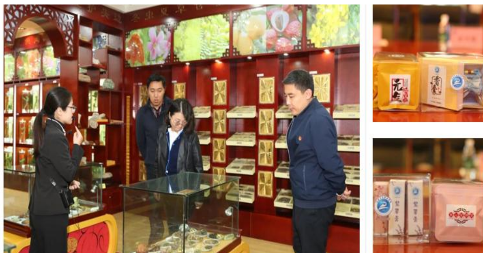
图 2-1 展现中医药魅力、传承中医药文化