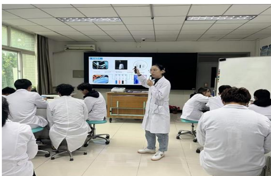
图 6-4 教学名师公开课

落实校内教师素质提升计划，做好教学名师、专业带头人、教学创新团队和骨干教师的过程性培养工作。本年度完成教学名师、专业带头人和骨干教师等 12 人共计 16 次讲座或履职公开课及评课工作，并在其培训、科研、进修等方面提供经费支持，促进了我校教科研骨干队伍的学术交流工作。