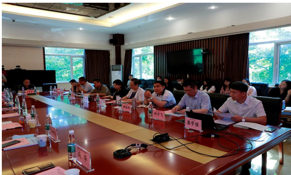
图 1-3 专业建设指导委员会会议

建设方面，学校引导各专业邀请行业专家、教育专家及校内骨干教师成立专业建设指导委员会，并定期召开会议，对专业建设与改革进行集体研究。在专业建设指导委员会的全面指导下，完成人才培养方案的定期修订、课程标准的研制、课程开发等，始终确保专业及课程建设符合新时期行业及相关岗位对技术技能人才的要求。其次，以国家级及省级特高专业建设为统领，在学校的统一领导下，由各职能部门为牵头单位，引导各专业落实人才培养模式创新、课程资源建设、教材与教法改革、教师创新团队建设等 9 大建设任务，全方位提升专业建设水平及人才培养质量。