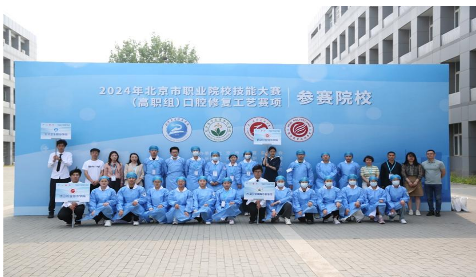
图 1-7 参赛队合影