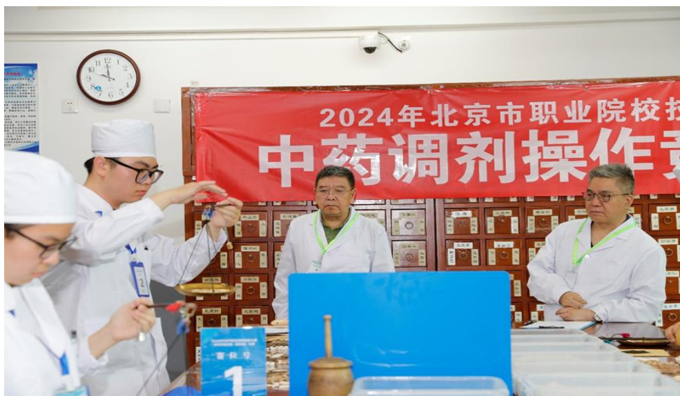
图 1-8 中药传统技能赛项赛事现场