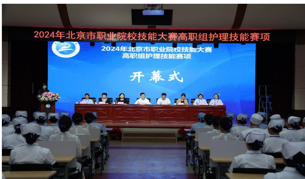
图 1-6 开幕式现场