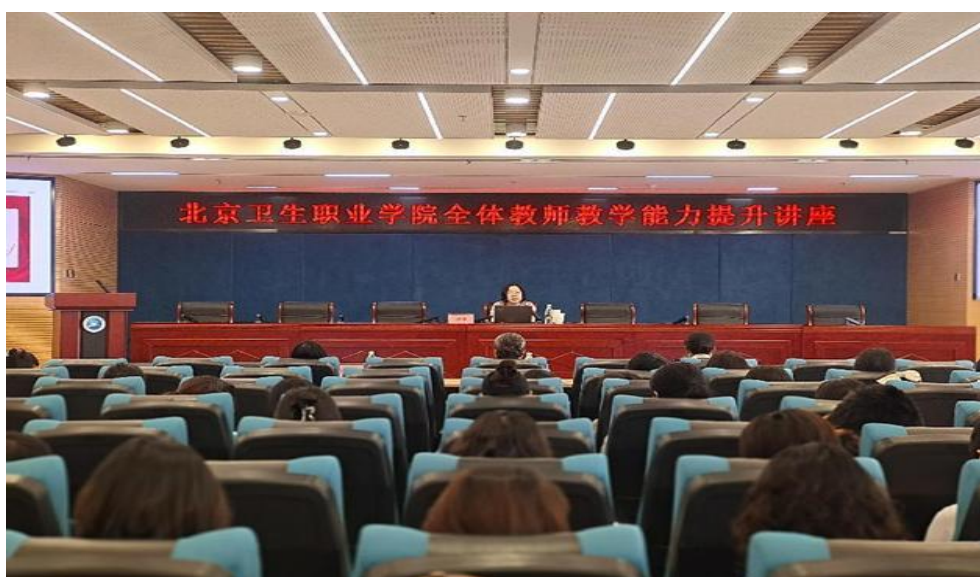
图 6-2 薛教授开展教学能力提升专题讲座

为深化教学改革，推进学校专业群建设，教师发展中心于 5 月 29 日邀请了天津医学高等专科学校护理学院院长薛梅到校，举办了主题为“深化三教改革，推进专业群高质量发展”的讲座。副校长王梅，莅临学校，跟岗研修的江西医学高等专科学校党委委员、副校长杨华，赣南卫生健康职业学院副院长曾琼，各系（部）主任，全体专任教师，实验教师以及部分教学科员等共计 250 余人参加此次活动。此次专业讲座使学校对专业群建设高质量发展的内涵有了更深入的了解，也为学校今后在培育更卓越的师资队伍和扎实推进专业群建设等方面指明了清晰的发展方向。