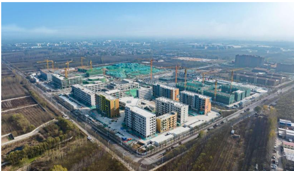
图 6-9 北京卫生职业学院新院区建设项目建设进展