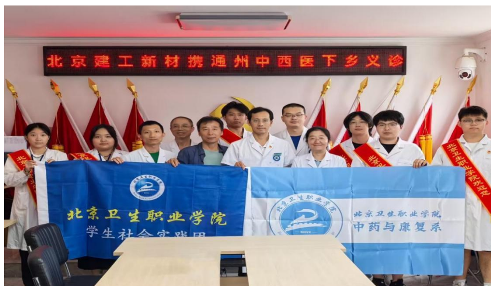
图 2-2 爱心义诊，情暖乡村

2024 年 8 月 31 日，北京卫生职业学院“服务百姓，幸福万家”社会实践团积极响应国家乡村振兴战略，充分发挥专业优势，深入北京郊区，组织策划“健康到家”义诊活动，与通州中西医结合医院携手为当地村民提供了包括健康咨询、疾病筛查、科普讲座在内的全方位医疗服务，耐心细致地为村民解答健康疑问，普及疾病预防知识，引导村民树立健康的生活方式和就医观念，累计服务三百余名患者，取得显著成效。