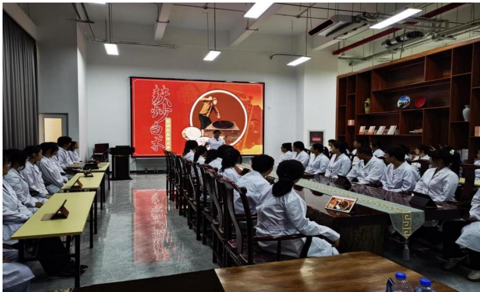
图 5-2 中药学专业师生在企业生产实地开展课程教学