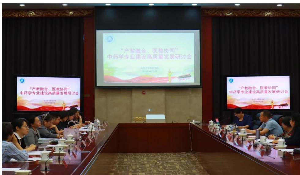
图 1-5 “产教融合、医教协同”中药学专业建设高质量发展研讨会

药大健康产业，在对中医药行业企业及毕业生调研分析的基础上，形成中药学专业与产业契合度调研报告，邀请行业企业专家开展职业能力分析，重构课程体系，组织完成三年制中药学专业人才培养方案修订和专家论证，产教融合做新的人才培养方案，从整体设计层面提升专业与产业契合度；以 2 门在建北京市职业院校精品在线课程建设项目为引领，校企共建课程教学资源、课程标准，充分吸纳行业企业专家参编 5 本新型活页式教材，持续提升优质课建设与行业企业契合度；持续拓展校企合作数量、途径和范围，成为全国中药制药行业产教融合共同体理事单位，新增河北蔺氏盛泰药业有限公司等 5 家合作企业，企业为师生技能大赛训练提供支持、开展医教协同与行业技术研讨交流等，校企合作育人提升人才培养质量，有效保障中药学专业特色高水平专业建设任务的稳步实施。