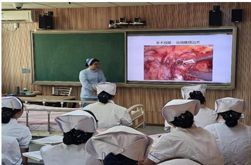
图 6-5 骨干教师公开课