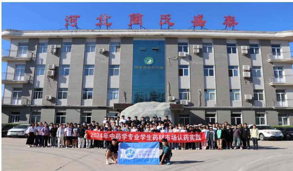
图 2-3 中药学专业学生在河北简氏盛泰药业有限公司参观学习