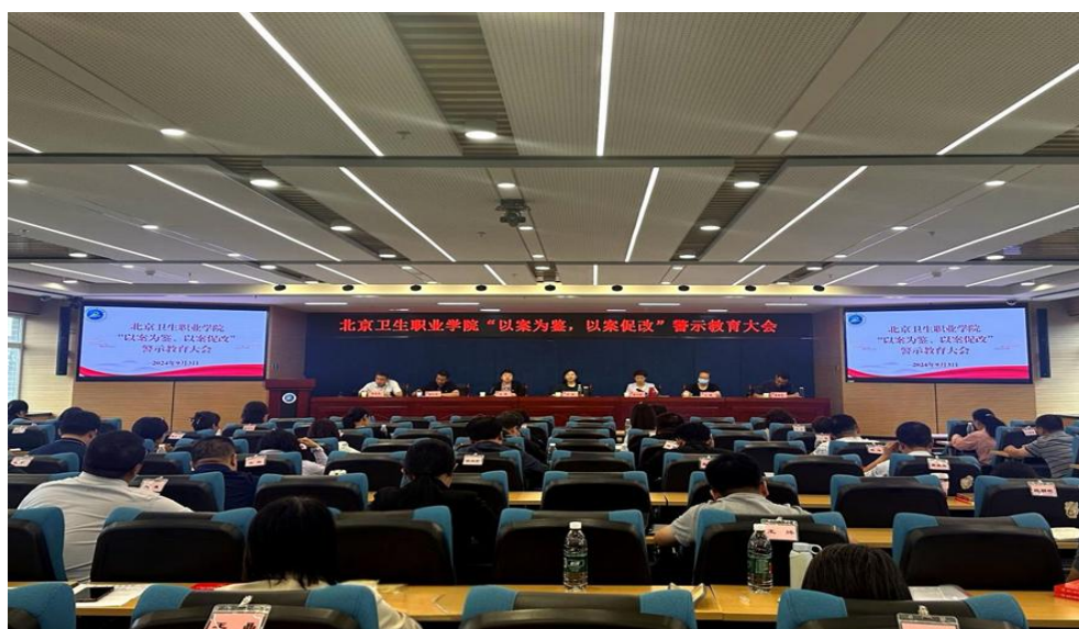
图 6-1 以案为鉴、以案促改”警示教育大会

结合两次会议精神，对广大干部职工提出要求：一是结合学校实际加强以案为鉴、以案促改力度，主动举一反三、认真查摆问题；二是全体党员干部要时刻保持警醒，深入学习习近平总书记关于全面加强党的纪律建设的重要论述，落实好党纪学习教育要求；三是学校各级党组织和职能部门要切实履行纪律建设主体责任，深化开展纪律教育监督，不断增强党内监督合力，共同推进落实学校党委全面从严治党相关要求，为学校高质量发展提供坚强地纪律保障。