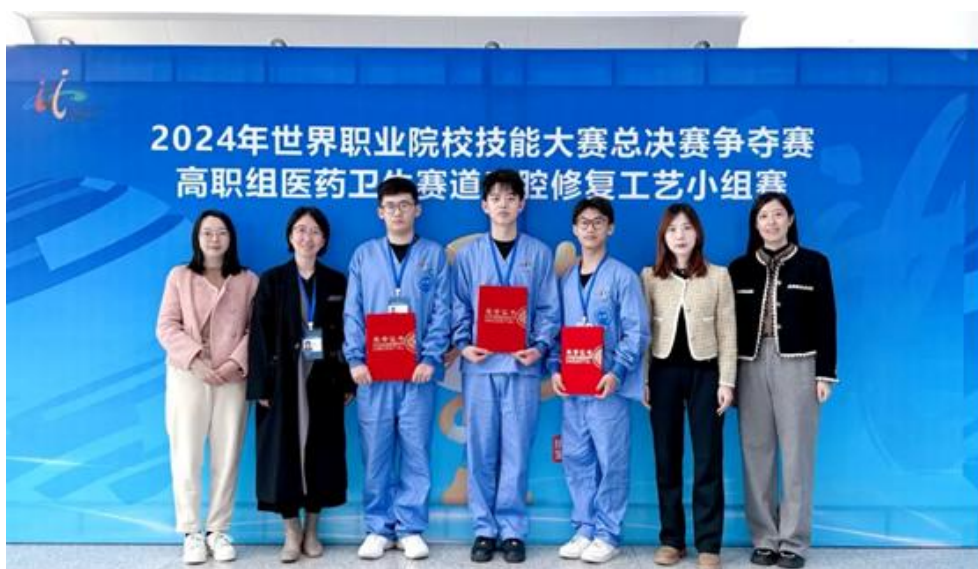
图 1-4 2024 年世界职业院校技能大赛总决赛争夺赛

北京卫生职业学院组织口腔医学技术专业参加 2024 年世界职业院校技能大赛总决赛争夺赛医药卫生赛道口腔修复工艺赛项，学生团队选取“上颌前牙口腔数字化椅旁即时美学修复设计”项目。该项目聚焦口腔数字化前沿技术，致力于实现上颌前牙美学修复的即时性与精准性。通过多学科知识综合运用，展现口腔医学技术专业学生对新技术的掌握和创新思维，促使学生积极探索口腔数字化，培养了其团队协作与沟通能力，为未来职业发展奠定坚实基础。学生高质量完成技能操作与现场讲解，专业技能熟练且规范，创新解决技术难题，尽显专业风采。本次获奖既是北京卫生职业学院专业建设成果的体现，也是对学生专业技能和综合素质的认可，为高质量人才培养奠定了坚实基础。