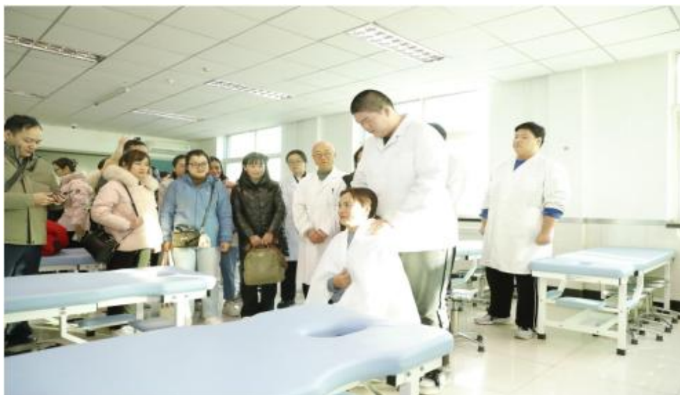
图 4-1 越南传统医院健康促进与治疗培训班

行实地参观了我校中药与康复系康复推拿实训室、作业治疗实训室、生命科学馆、校园文化墙、中药标本馆等，考察交流团对中国中医药文化兴趣浓厚，饶有兴致地体验了康复推拿、作业治疗、中药鉴别等项目，三方就未来如何在中医药领域开展合作进行座谈交流。此次考察交流增进了两国传统医药文化的交流，推动两国传统医学界的相互认知与合作，将有效推动学校与越方、西苑医院建立有效的合作交流机制，携手打造“健康丝绸之路”，助力共建“一带一路”。