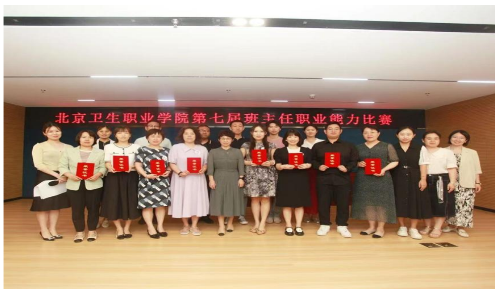
图 1-2 北京卫生职业学院第七届班主任职业能力比赛

素材。二是严把入口，严格选聘新班主任。根据招生计划制定《2024 级新班主任选聘工作方案》，选择政治素质过硬、责任心强、工作热情高的人员聘为 2024 级新班主任，保证了队伍的先进性和战斗力。开展了校系二级培训工作，使其顺利接班上岗。三是以赛代训，促进业务水平提升。组织学校第七届班主任职业能力竞赛；推选班主任参加 2024 年北京市中等职业学校班主任能力比赛，二等奖和三等奖各一人。组织开展学生教育管理案例征集评比活动。四是考核评优，积极选出先进典型。开展 2023-2024 学年班主任满意度测评、考核和评优工作；召开年度评优表彰大会，表彰先进，树立典型，促进良好师德师风。