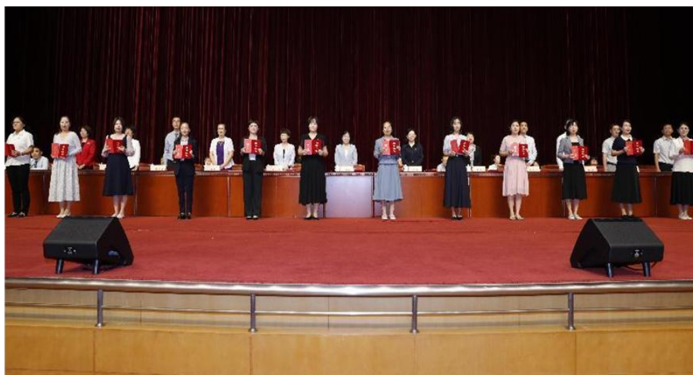
图 6-3 开学典礼对十佳教师、十佳教育工作者进行表彰

按照《北京卫生职业学院十佳优秀教师、十佳优秀教育工作者评选办法》，经过前期发布评选方案、各部门积极申报、职能处室审核申报材料，顺利完成学校第四届“双十佳”评选。通过评选，充分调动了教师和教育工作者的积极性，激励广大教师和教育工作者投身教育事业，提升教师和教育工作者的综合素质。