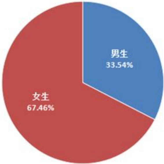
图 1-10 毕业生男女比例情况