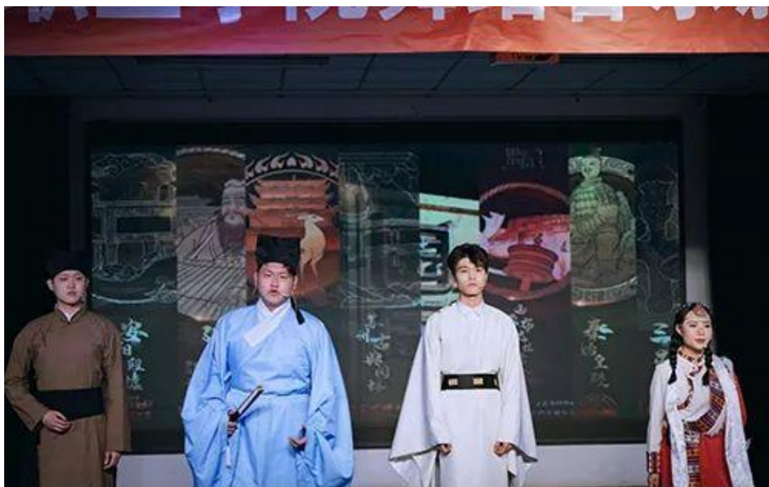
图 9：同学们表演情境朗诵《与你同行》