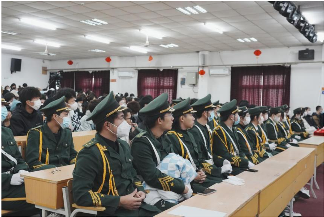
图 5：北艺传媒召开 2023 届毕业生顶岗实习工作会议

此外，北艺传媒一直鼓励学生进行学历深造，拓宽就业面。2023 年 5 月，北京市 2023 年“专升本”录取工作全面结束，北京艺术传媒职业学院推荐参加专升本考试学生被北京联合大学、北京城市学院等本科高校录取，录取率达 62%，成绩喜人。这次专升本考试取得佳绩，充分展示了北艺传媒学生良好的综合素质和学习能力，是学校不断加强内涵建设、深化教学改革、完善育人机制、加强学风建设成效的集中体现，也为北艺传媒学子们将来学历再深造、高层次就业提供强大的竞争力。