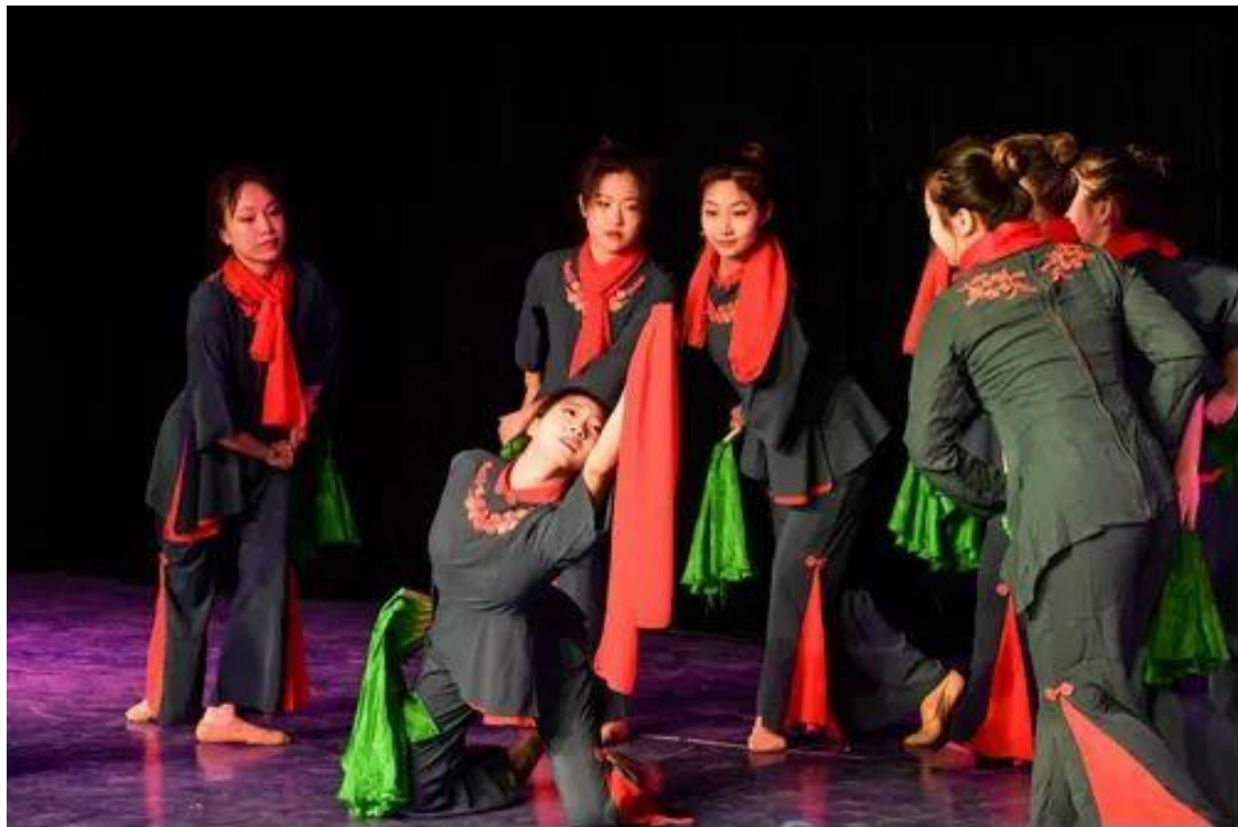
图 8：同学们表演胶州秧歌舞蹈《映山红》