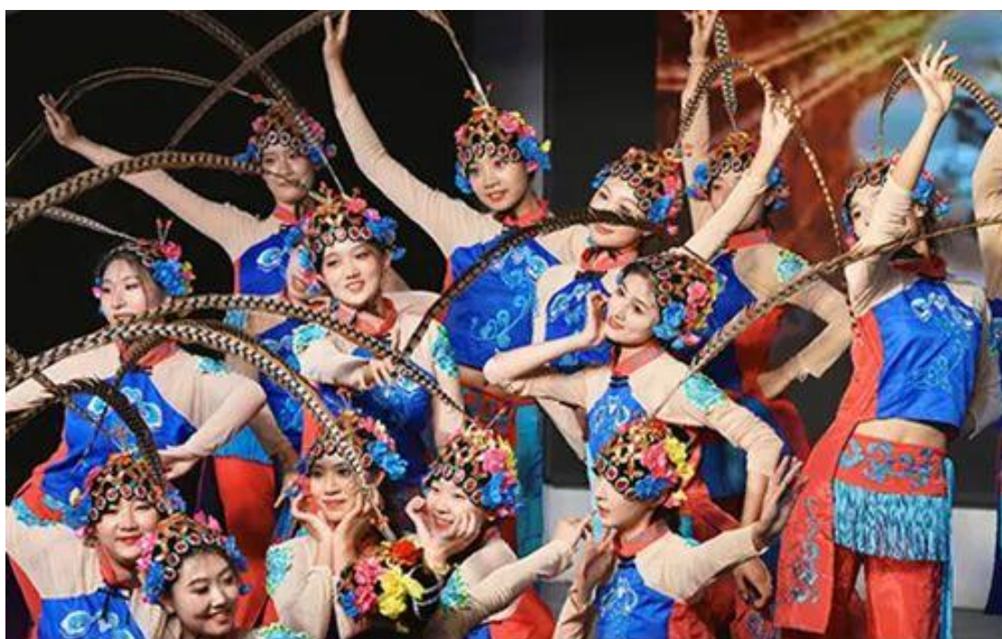
图 10：同学们表演古典舞《俏花旦》