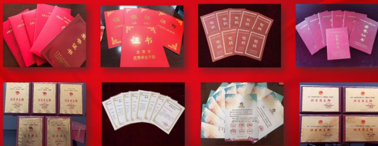
学校社会实践活动多次受到市委宣传部、市委教育工委、 首都文明办、团市委等单位的表彰