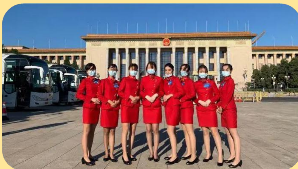
图 15：参加抗击新冠肺炎疫情表彰大会礼仪接待工作

2020 年 9 月 8 日上午 10 时，全国抗击新冠肺炎疫情表彰大会在北京人民大会堂隆重举行。我校财经与管理学院空中乘务专业 8 名青年志愿者，代表学校参加了此次抗击新冠肺炎疫情表彰大会的礼仪接待工作，现场见证光荣时刻，向抗疫英雄致敬。我校志愿者主要负责各省代表团的礼仪接待、道路指引工作。8 名志愿者分别负责 8 个省份 9 个代表团的服务工作。通过 4 天的服务，志愿者们不仅感受到国家在遇到困难时勇敢无畏的力量，更从心底产生一种强烈的荣誉感和自豪感。这次礼仪服务在他们心中种下一颗为国效力、为国服务、为国争光的种子。