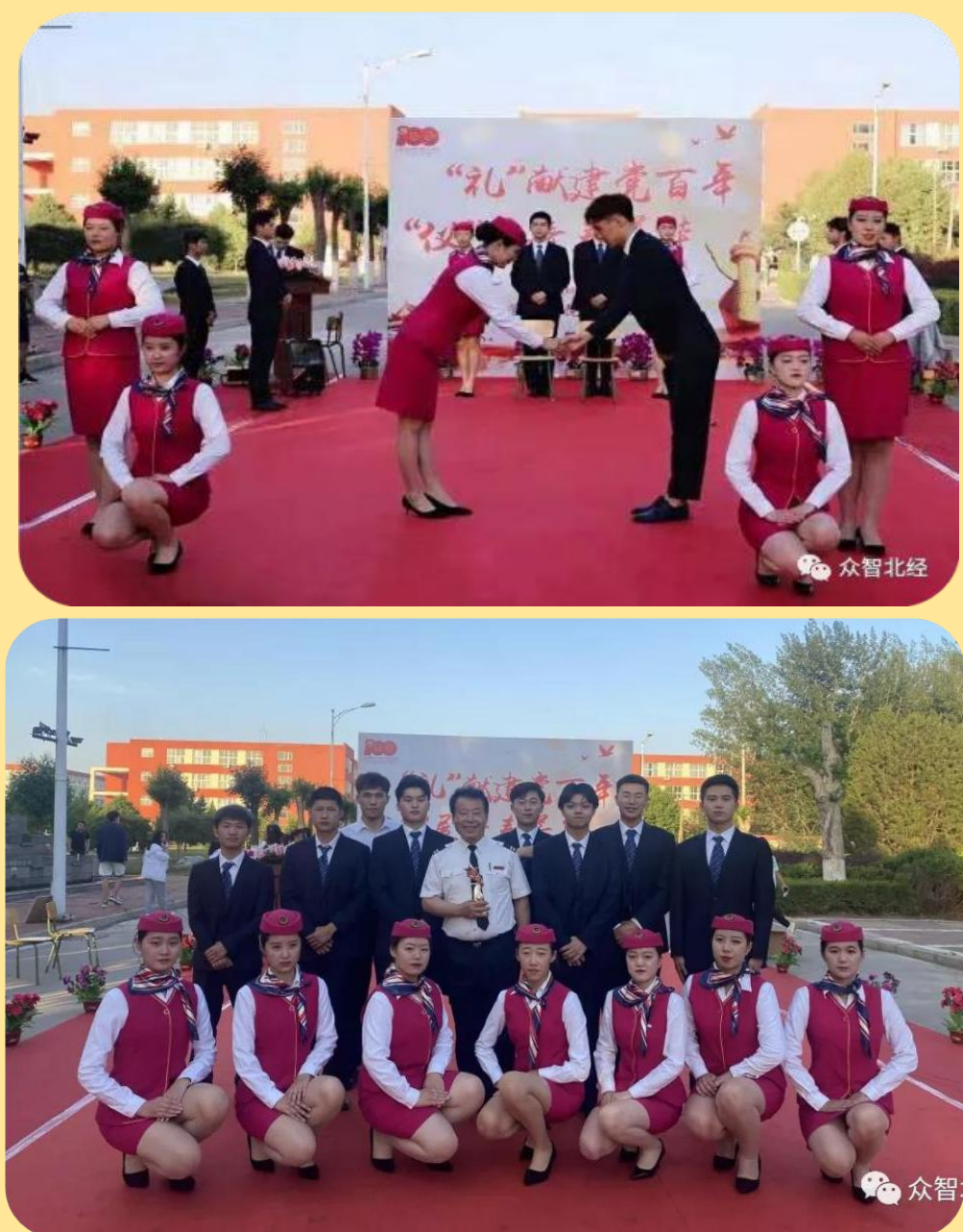
图 48-49：主题礼仪技能大赛

百年，‘仪’展青春芳华”主题礼仪技能大赛。古人云“礼者敬人也”，礼仪是一种待人接物的行为规范，也是交往的艺术。此次礼仪展示大赛分为四个方面，分别对称呼、容仪、基本礼仪技巧、基本服务礼仪进行考核。对于该学院空中乘务、酒店管理与数字化运营专业的学生来讲，以后大多会进入服务行业工作，服务行业中礼仪技巧显得尤为重要。譬如迎宾、引导、颁奖以及为宾客奉茶送水等，也许上述各环节只是他们工作中的一件小事，但是能在小事中注重细节，那么就能证明你是个拥有良好礼仪的人，从而为自己在合作对象心目中大大加分。