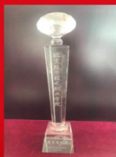
2018年“助学·筑梦·铸人” 主题宣传活动优秀组织奖