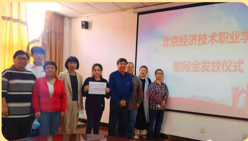
图 20：水火无情人有情——记我校为武 XX 同学发放慰问金

其资助 1000 元。武 XX 同学感谢学校领导和老师们的关怀，心中倍感温暖与感动，今后会奋力前行，不断努力，做到无愧于学校、无愧于青春，成为一个有价值的人、有益于社会的人。