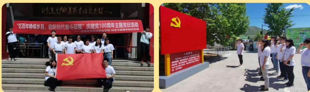
图 52-57：各支部迎建党一百周年主题党日活动