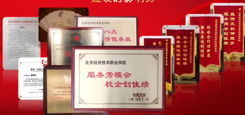
接收到了多家企事业单位送来的表扬信、锦旗和牌匾