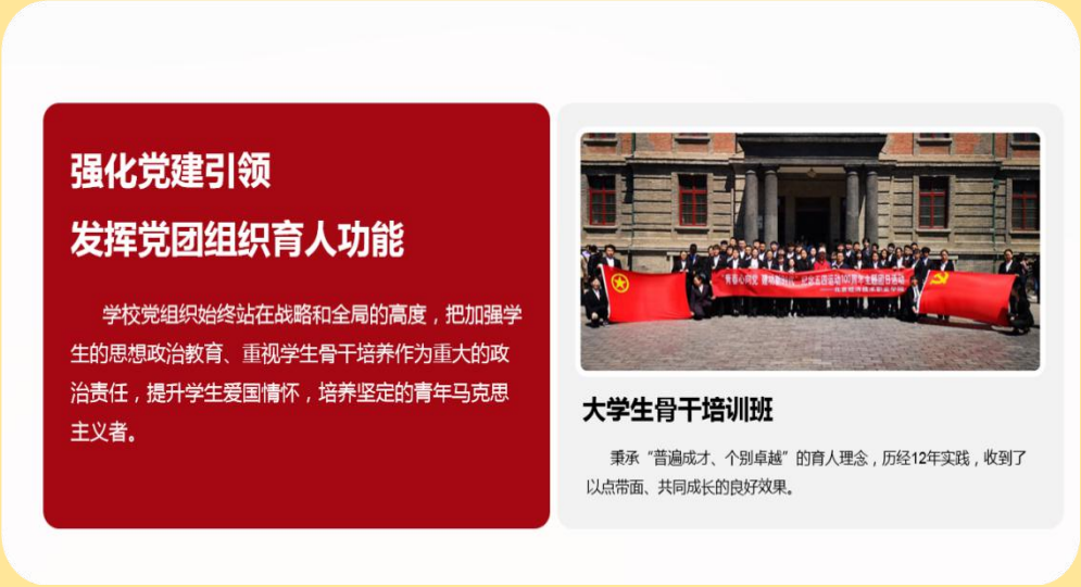
图 22：大学生骨干培训班

学校党组织始终站在战略和全局的高度，把加强学生的思想政治教育、重视学生骨干培养作为重大的政治责任，以党校、团校为依托，以大学生骨干培训班为重点，提升学生爱国情怀，培养坚定的青年马克思主义者。“大学生骨干培训班”启动至今，秉承“普遍成才、个别卓越”的育人理念，已招收学员十二期，历经 12 年实践，收到了以点带面、共同成长的良好效果。