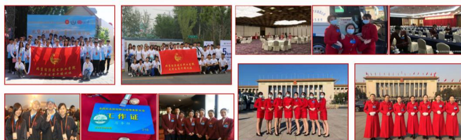
学校志愿服务以“热爱祖国、奉献社会、锤炼人生”为宗旨， 将志愿服务融入育人过程，培养了一批又一批有理想、有本领、有担当的志愿者团队

学校志愿服务以“热爱祖国、奉献社会、锤炼人生”为宗旨，将志愿服务融入育人过程，培养了一批又一批有理想、有本领、有担当的志愿者团队。在全国两会、国庆、世园会、全国抗击疫情表彰大会、全国劳模大会等国家重要活动中，在全国上下众志成城疫开展的情防控工作中，我校学生以高度的责任感参与了志愿服务工作，展现了昂扬向上、奋发有为的精神风貌，赢得了有关单位的充分肯定。