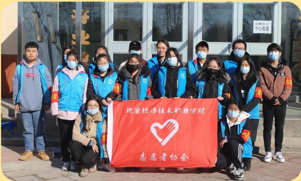
图 19：志愿者助力校园常态化疫情防控