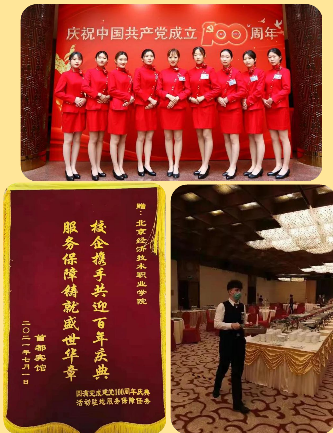
图 16-18：践行红色初心 锤炼服务品质 献礼建党百年