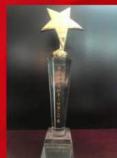
“首届首都资助育人优秀工作者”