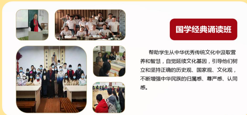
图 28：国学经典诵读班

对祖国悠久历史深厚文化的理解和接受是爱国主义情感培育和发展的重要条件。为此，2016年3月学校设立了国学经典诵读班，至今已连续举办了9期，该班由校内外导师共同参与指导，帮助学生从中华优秀传统文化中汲取营养和智慧，自觉延续文化基因，引导他们树立和坚持正确的历史观、国家观、文化观，不断增强中华民族的归属感、尊严感、认同感。