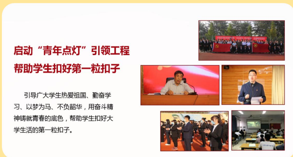
图 24：“青年点灯”引领工程

2017年9月，我校启动了“青年点灯”引领工程，通过开学第一课、国旗下一讲、第一次班会、第一次主题团日等系列“第一课”活动，引导广大学生热爱祖国、勤奋学习、以梦为马、不负韶华，用奋斗精神铸就青春的底色，帮助学生扣好大学生活的第一粒扣子。