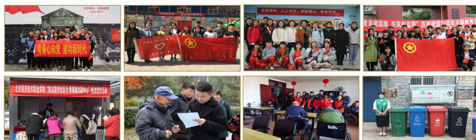
深入企业、社区、农村、社会机构，了解民生、调查社情、感受国情 培养立足基层、扎根群众、勇于担当的素质，锻炼服务人民、奉献国家的本领。

学校利用学生课余时间，组织学生开展丰富多彩的社会实践活动，例如青春心向党建功新时代主题活动、使命在肩奋斗有我主题活动、青年大学习活动、红烛行动、支教活动等，鼓励和引导学生积极参与社会实践，深入企业、社区、农村、社会机构，了解民生、调查社情、感受国情，培养立足基层、扎根群众、勇于担当的素质，锻炼服务人民、奉献国家的本领。