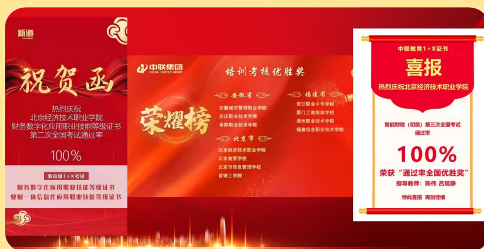
图 11：1+X 考试祝贺函、荣耀榜、喜报

我校大数据与会计专业在 1+X 证书试点工作中迈出了一大步，把 1+X 智能财税和 1+X 财经数字化证书与专业人才培养方案深度融合，建立了课证融通和模块化教学的尝试，为我校学生实训技能操作训练，提升职业技能素养树立了典范。在 2020 年 11 月 1 日的智能财税职业技能初级证书考试中，我校 25 名参加考试的学生全员通过，中联教育集团为此还发来喜报！在 2020 年 12 月 6 日的财经数字化中级证书考试中，我校 35 名参加考试的学生全员通过，新道科技也发来喜报祝贺！