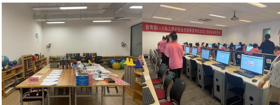
图 15 “1+X 幼儿照护”职业技能等级证书考核

基础上，研究确定已经纳入教学的和将来能够在教学中完成的 1+X 证书等级标准内容，并转化为专业（核心）课程纳入专业课程体系，根据证书要求着手制定专业课程标准，对接职业岗位，推进课证融通的课程体系改革，加强课程建设。