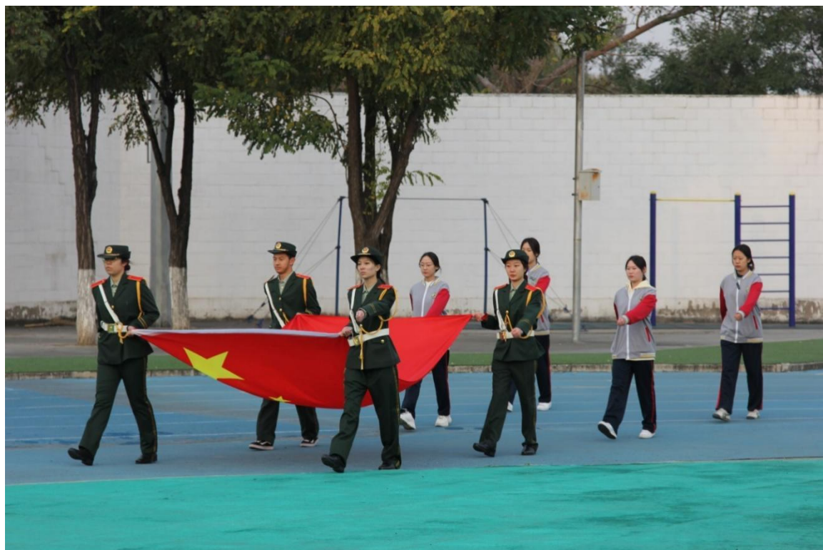
图 6 宿舍情况