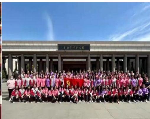
图 5 参观香山革命纪念馆