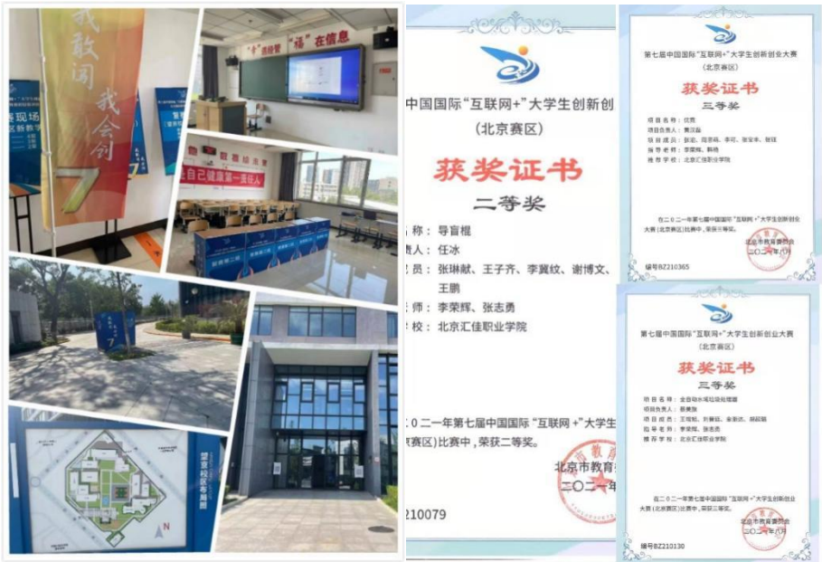
图 9 互联网+创新创业大赛获奖

第七届中国国际“互联网+”大学生创新创业大赛北京赛区职教赛道已于 7 月 11 日圆满落幕。我院人工智能工程师学院李荣辉老师积极组织师生参加了比赛。经过组委会专家们的严格审核，提交北京市教委审批，最终我校获得了一个二等奖和一个三等奖的优异成绩。