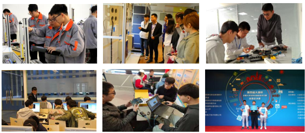
12 场 教 模