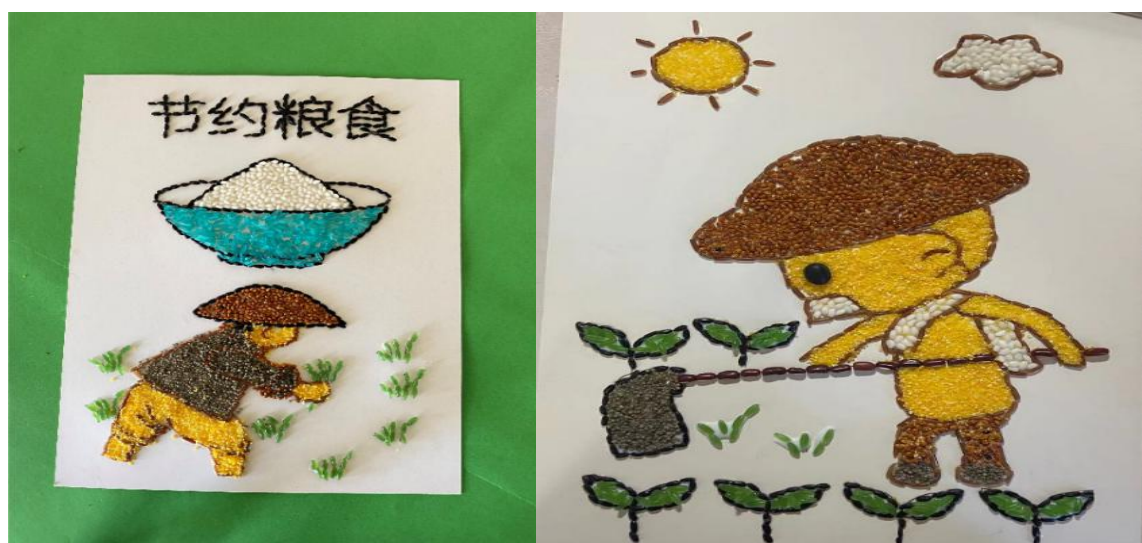
图 1 学生们自己动手制作的宣传画

学院团委结合“世界粮食日”，面向全校师生开展了“节粮爱粮”主题教育活动。在此次活动中，有部分同学表示这是自己第一次知道有这样的纪念日，也使不少同学将“节粮爱粮”的观念付诸于自己的日常生活之中。通过这次主题教育活动，使同学们增进了对“世界粮食日”以及世界粮食现状的认识与了解，面对全世界粮食供应日益短缺这样的事实，作为当代大学生更应承担起节约粮食，爱惜粮食的社会责任，同时呼吁大家节约粮食，拒绝浪费，反思一粥一饭的来之不易。“节粮爱粮”不仅仅是一种口号，我们希望它是一种情结，铸与我们每人的心中，将自己的言辞付诸于实践之中，自觉做到节约粮食，从我做起。