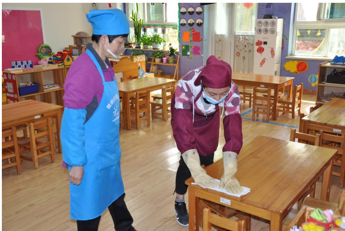
图 10 跟岗实习-拜师仪式

（2）影视动画专业群采用“项目引领，任务驱动”工作室人才培养模式：将真实项目引入教学过程，通过完成典型的工作任务，培养学生的职业素质，提高学生的职业技能，根据完成任务的质量评价学生学习的成效。根据影视动画专业群各专业工作室的教学特点，引领教研团队坚持实训与大赛相结合，教学成果丰硕，近年来学生获奖一百多项。