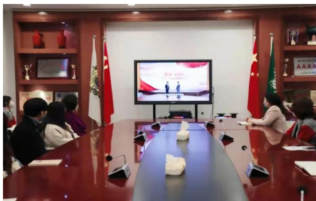
图 4 党史学习

我院现有在校学生 1504 人，递交入党申请书的人数达 435 人，现有学生党员 8 人，隶属于学生党支部。在学院工作中，学生党支部发挥了基层党组织的战斗堡垒作用，大学生党员是学院学生中的骨干力量，成为学院学生中最具感召力、凝聚力和影响力的优秀群体。学院党委会定期组织学生党员、入党积极分子开展形式多样的为学习、宣传、教育活动。