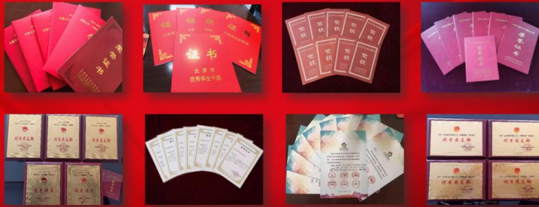
学校社会实践活动多次受到市委宣传部、市委教育工委、 首都文明办、团市委等单位的表彰