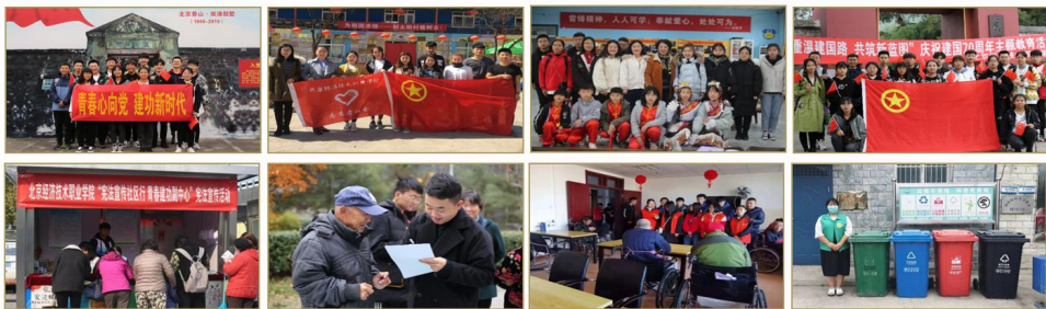
深入企业、社区、农村、社会机构，了解民生、调查社情、感受国情 培养立足基层、扎根群众、勇于担当的素质，锻炼服务人民、奉献国家的本领。

学校利用学生课余时间，组织学生开展丰富多彩的社会实践活动，例如青春心向党建功新时代主题活动、使命在肩奋斗有我主题活动、青年大学习活动、红烛行动、支教活动等，鼓励和引导学生积极参与社会实践，深入企业、社区、农村、社会机构，了解民生、调查社情、感受国情，培养立足基层、扎根群众、勇于担当的素质，锻炼服务人民、奉献国家的本领。