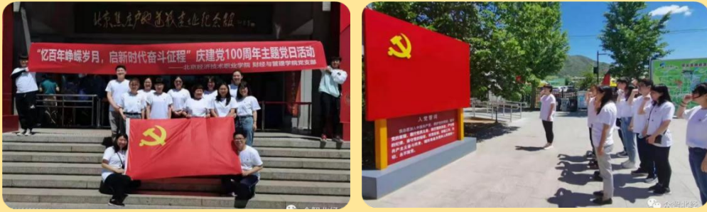
图 52-57：各支部迎建党一百周年主题党日活动