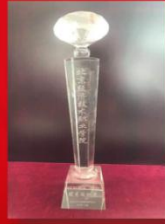
2018年“助学·筑梦·铸人” 主题宣传活动优秀组织奖