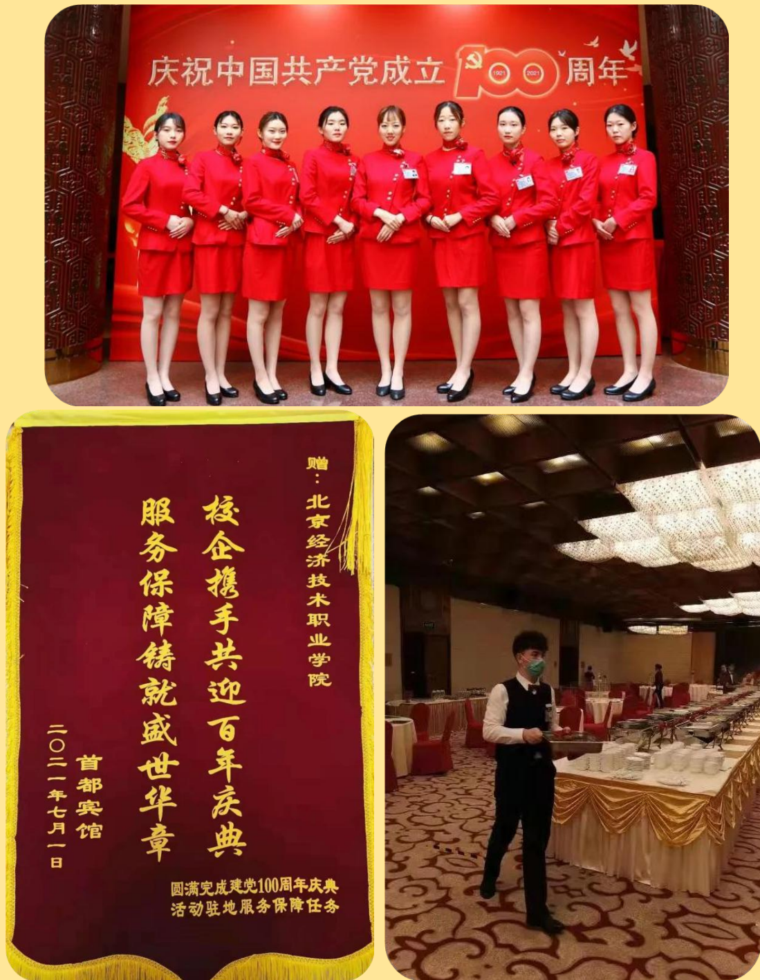
图 16-18：践行红色初心 锤炼服务品质 献礼建党百年