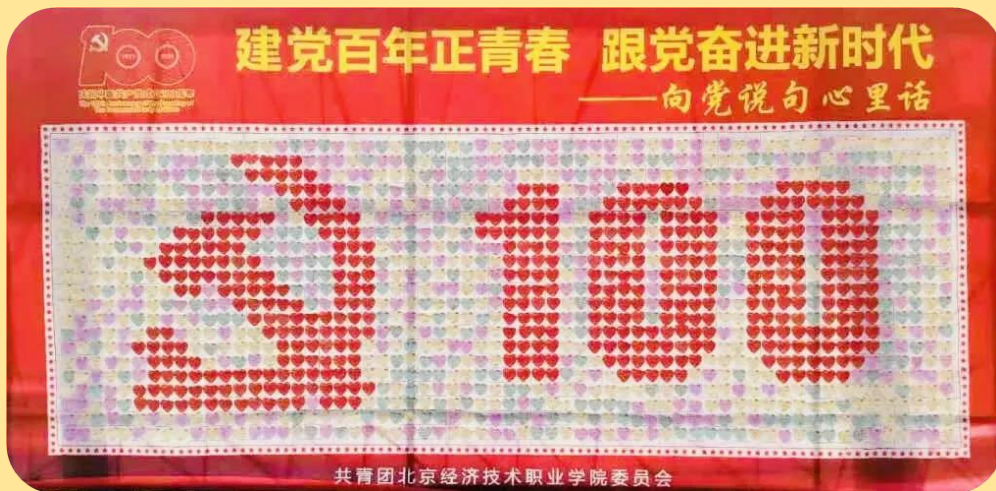
图 14：“向党说句心里话”主题活动

为庆祝建党 100 周年，进一步深化学校党史学习教育。在党的百年华诞到来之际，学校党总支、校团委组织号召各党支部、团支部开展“学党史 强信念 跟党走”——“向党说句心里话”活动，全体党员、团员通过一句句朴实的话语、一段段暖心的文字，对党的百年华诞送去祝福。学校党政领导与 1400 余名师生共同完成了这堂“卡片上的思政课”，演绎了一场属于北经院师生的“红色表白”。