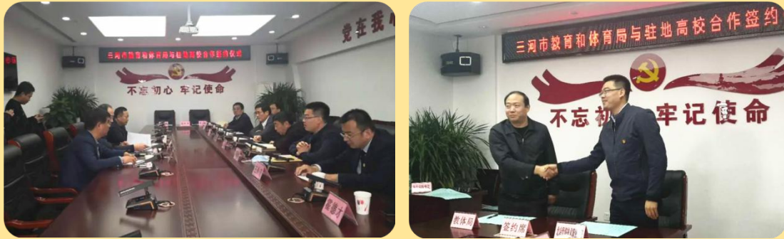
图 60-61：我校与三河市教育和体育局签订支教协议