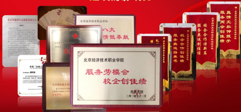
接收到了多家企事业单位送来的表扬信、锦旗和牌匾