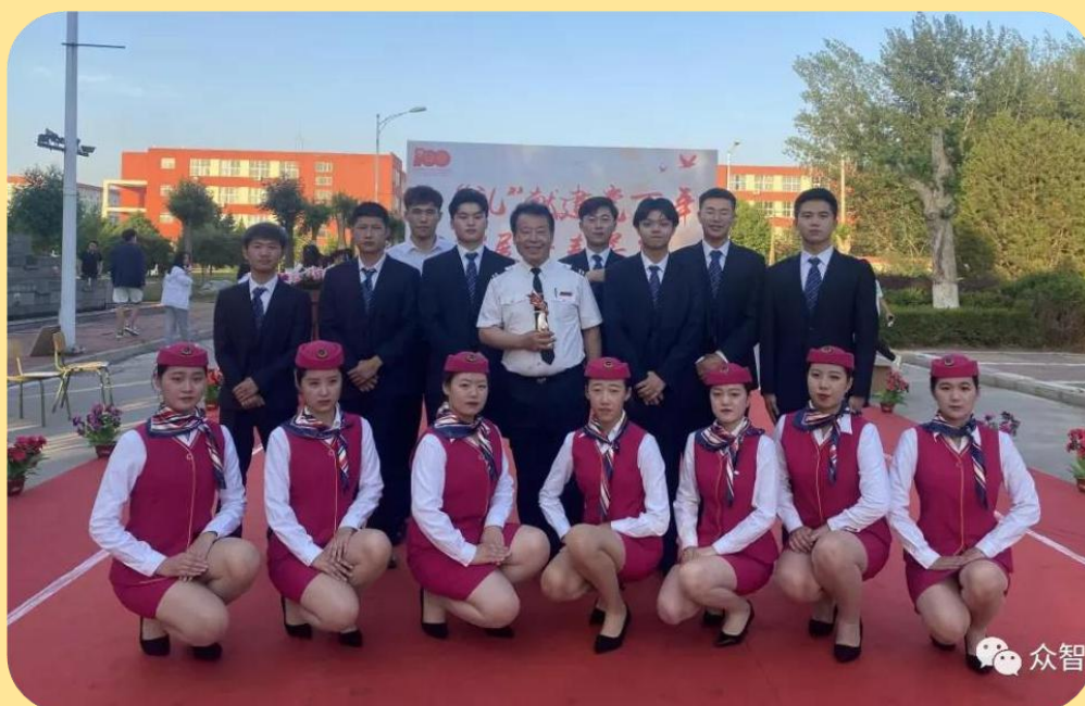
图 48-49：主题礼仪技能大赛