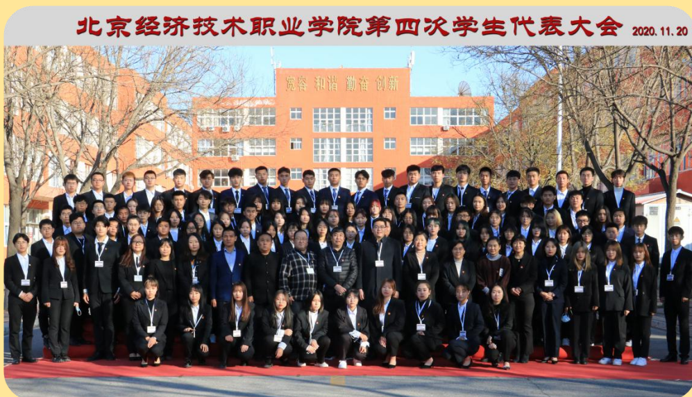
图 13：北京经济技术职业学院第四次学生代表大会

为认真贯彻习近平总书记重要讲话精神，特别是对青年学生工作的重要指示，深化我校学生会改革。2020年11月20日，我校第四次学生代表大会在礼堂召开。