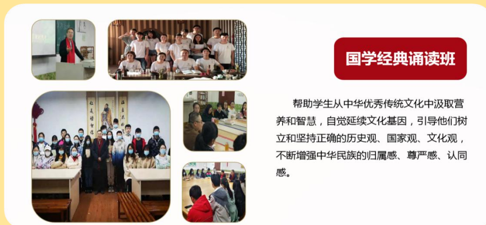
图 28：国学经典诵读班

对祖国悠久历史深厚文化的理解和接受是爱国主义情感培育和发展的条件。为此，2016年3月学校设立了国学经典诵读班，至今已连续举办了9期，该班由校内外导师共同参与指导，帮助学生从中华优秀传统文化中汲取营养和智慧，自觉延续文化基因，引导他们树立和坚持正确的历史观、国家观、文化观，不断增强中华民族的归属感、尊严感、认同感。