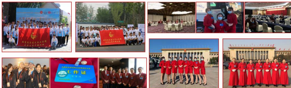
学校志愿服务以“热爱祖国、奉献社会、锤炼人生”为宗旨， 将志愿服务融入育人过程，培养了一批又一批有理想、有本领、有担当的志愿者团队

学校志愿服务以“热爱祖国、奉献社会、锤炼人生”为宗旨，将志愿服务融入育人过程，培养了一批又一批有理想、有本领、有担当的志愿者团队。在全国两会、国庆、世园会、全国抗击疫情表彰大会、全国劳模大会等国家重要活动中，在全国上下众志成城疫开展的情防控工作中，我校学生以高度的责任感参与了志愿服务工作，展现了昂扬向上、奋发有为的精神风貌，赢得了有关单位的充分肯定。