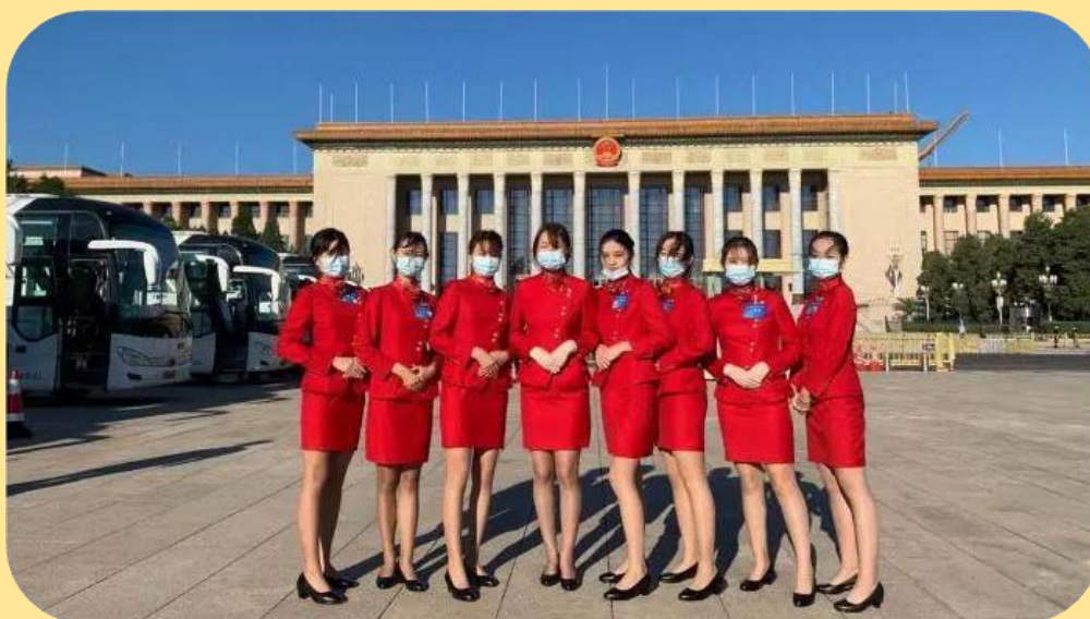
图 15：参加抗击新冠肺炎疫情表彰大会礼仪接待工作

2020 年 9 月 8 日上午 10 时，全国抗击新冠肺炎疫情表彰大会在北京人民大会堂隆重举行。我校财经与管理学院空中乘务专业 8 名青年志愿者，代表学校参加了此次抗击新冠肺炎疫情表彰大会的礼仪接待工作，现场见证光荣时刻，向抗疫英雄致敬。我校志愿者主要负责各省代表团的礼仪接待、道路指引工作。8 名志愿者分别负责 8 个省份 9 个代表团的服务工作。通过 4 天的服务，志愿者们不仅感受到国家在遇到困难时勇敢无畏的力量，更从心底产生一种强烈的荣誉感和自豪感。这次礼仪服务在他们心中种下一颗为国效力、为国服务、为国争光的种子。