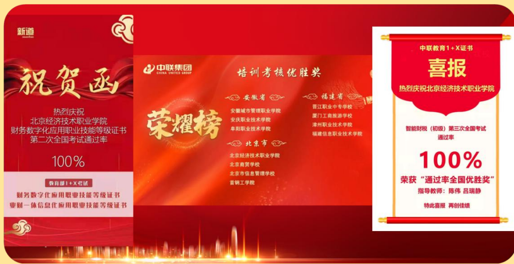
图 11：1+X 考试祝贺函、荣耀榜、喜报

我校大数据与会计专业在 1+X 证书试点工作中迈出了一大步，把 1+X 智能财税和 1+X 财经数字化证书与专业人才培养方案深度融合，建立了课证融通和模块化教学的尝试，为我校学生实训技能操作训练，提升职业技能素养树立了典范。在 2020 年 11 月 1 日的智能财税职业技能初级证书考试中，我校 25 名参加考试的学生全员通过，中联教育集团为此还发来喜报！在 2020 年 12 月 6 日的财经数字化中级证书考试中，我校 35 名参加考试的学生全员通过，新道科技也发来喜报祝贺！