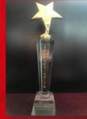
“首届首都资助育人优秀工作者”