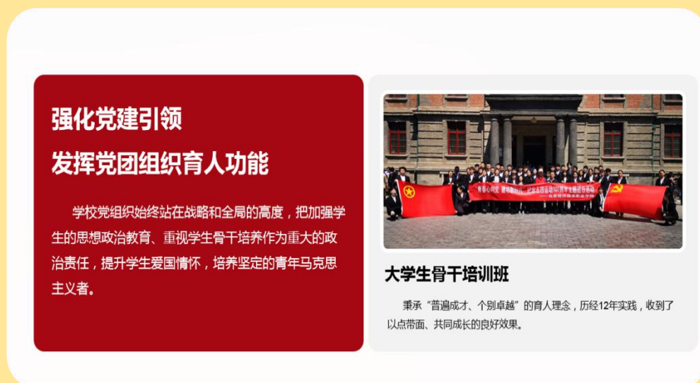
图 22：大学生骨干培训班

学校党组织始终站在战略和全局的高度，把加强学生的思想政治教育、重视学生骨干培养作为重大的政治责任，以党校、团校为依托，以大学生骨干培训班为重点，提升学生爱国情怀，培养坚定的青年马克思主义者。“大学生骨干培训班”启动至今，秉承“普遍成才、个别卓越”的育人理念，已招收学员十二期，历经12年实践，收到了以点带面、共同成长的良好效果。