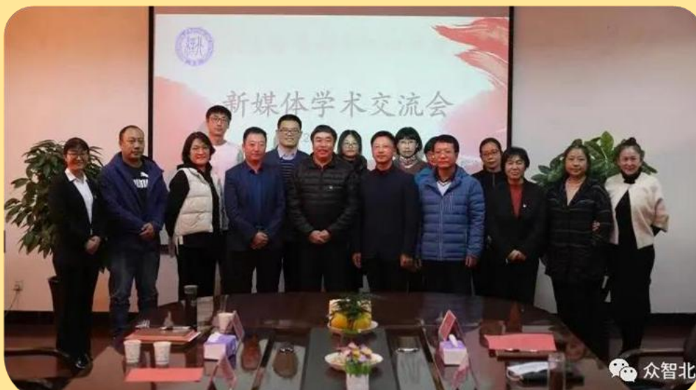
图 21：新媒体学术交流会