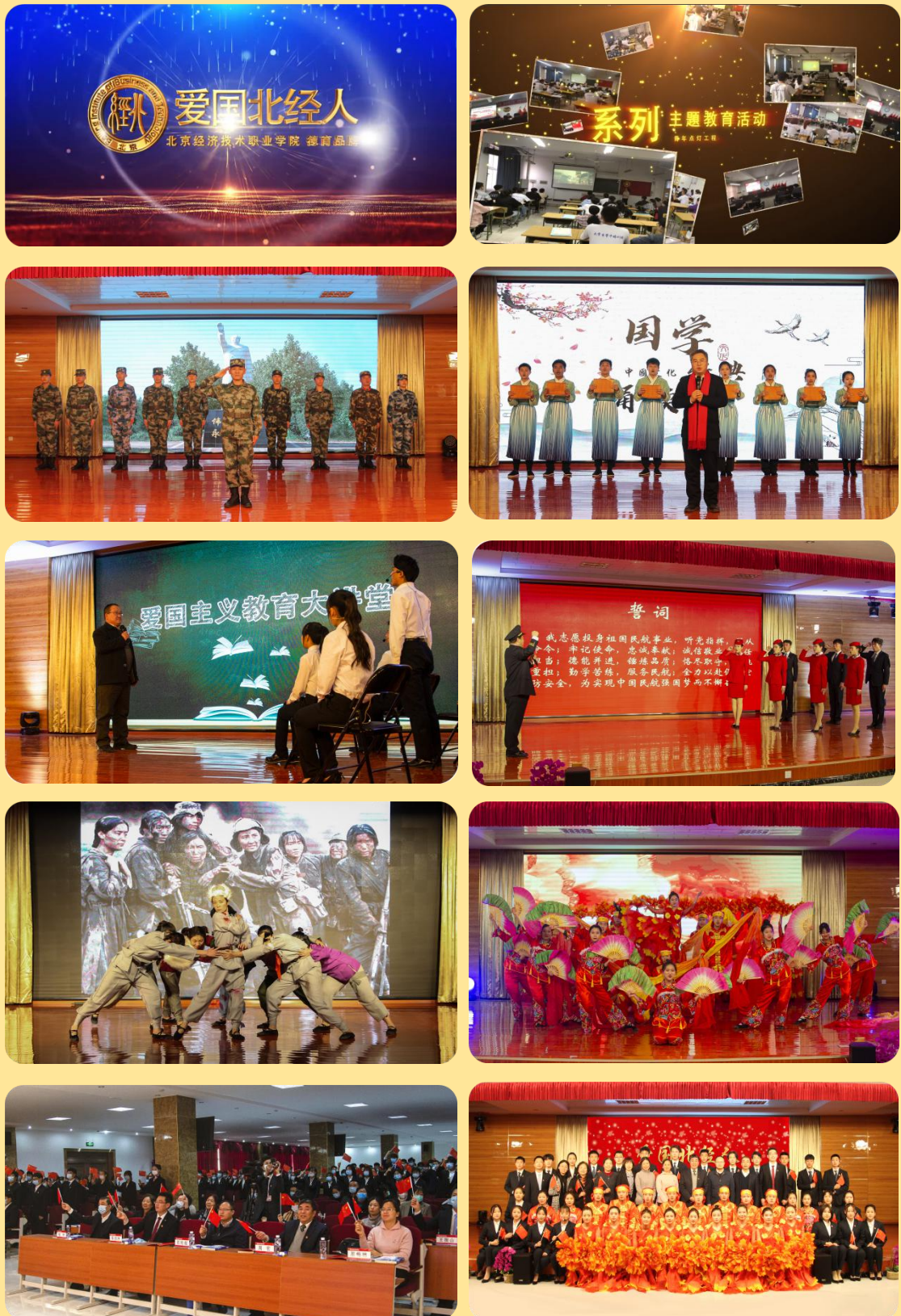
图 1-10：“爱国北经人”德育品牌建设部分活动图片