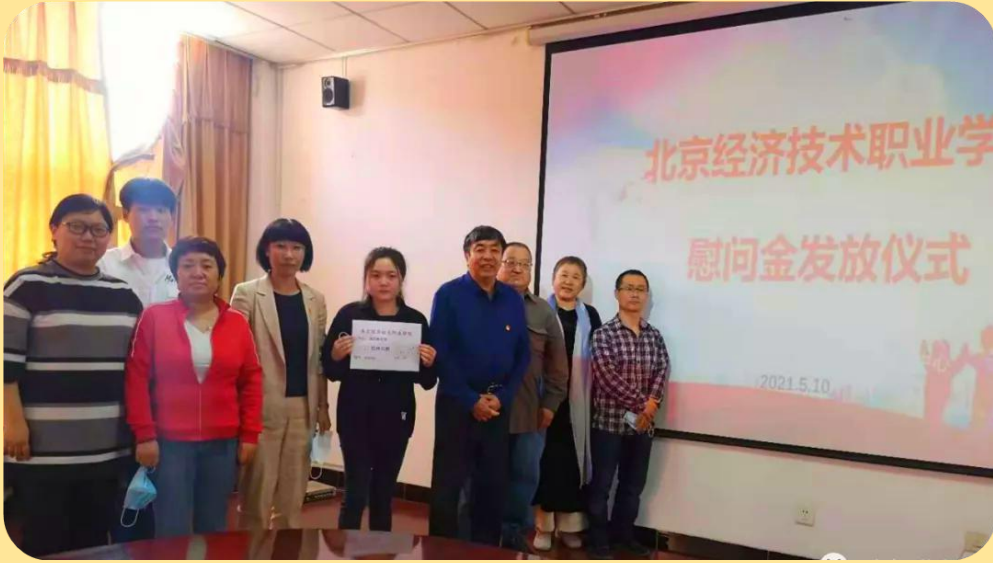
图 20：水火无情人有情——记我校为武 XX 同学发放慰问金

其资助 1000 元。武 XX 同学感谢学校领导和老师们的关怀，心中倍感温暖与感动，今后会奋力前行，不断努力，做到无愧于学校、无愧于青春，成为一个有价值的人、有益于社会的人。