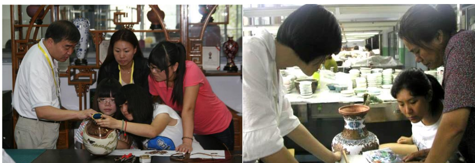
图2 国家级工艺大师钟连盛现场传授景泰蓝传统技艺、青年教师到珐琅厂深入实践学习

此外企业骨干技术人员还深入学校艺术设计专业建设，参与制定专业人才培养方案，建立专业课程体系，扶持中青年教师，参与开发核心课程及实践教材建设，企业每年为学校培养不少于1位老师，安排为期半年的全脱产专业实训，每位参与培训的老师不仅在景泰蓝工艺技术方面得到学习提高外，还了解到企业文化和企业管理理念，收集到许多宝贵素材资料，分析后将可运用于校内的实践教学案例中。