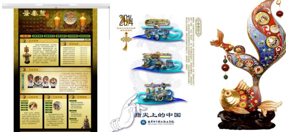
图17学生创作的《景泰蓝》网站