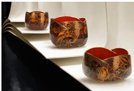
图6 景泰蓝产品系列设计 《花启·藏语》设计者：徐彬 (教师)