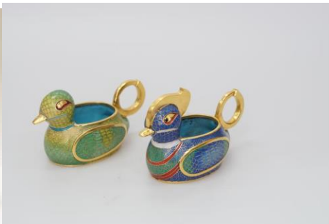
图7 景泰蓝产品设计《鸳鸯烛台》 (学生项目小组)