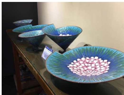
图11 景泰蓝产品系列设计《融合》、 《美好生活》 设计者：段岩涛(教师)