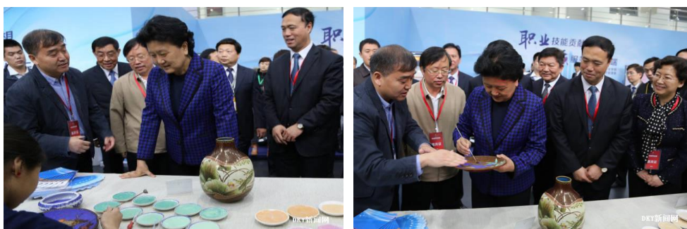
图13 刘延东同志驻足观看我校学生安琪现场点蓝，并亲自尝试点蓝

在首届“职业教育活动周”上，工作室首席设计师钟连盛大师及两名学生代表学校参加了此次活动，以“现场制作、大师亲传，塑造民族文化遗产创新职业人”为展示主题，现场进行了传统景泰蓝部分工艺的技艺展示。