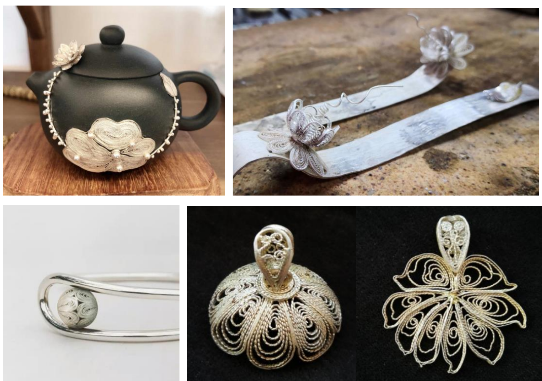
图16 教师花丝镶嵌培训成果

此外企业充分利用北京文化中心的政策优势和资源禀赋优势，同时与学校配合发挥学校人才聚合优势，2019年、2020年连续开办“非遗项目花丝镶嵌技艺传承国培师资班”共计培训北京市相关院校教师近百人，每期举办3周，培训主要由基础、实践、拓展交流三部分组成，通过熟悉工艺基础知识、工艺、工具；花丝制作备料、化料；通过拔丝、搓丝、饹丝、花丝轮廓造型、填花丝、填花丝花瓣、金工筛料桶制作、焊接花丝球、吊环瓜子扣以及散件儿的组装、抛光等工艺进行花丝球及花丝戒指的制作；最后通过学员们花丝自由创作实践，每位学员都创作了三至五件作品，并进行了培训班的作业汇报展，所创作的作品受到了培训大师及参观者的一致好评。