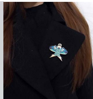
图8 景泰蓝产品设计《珞琅莎燕胸针》 (教师指导学生设计)