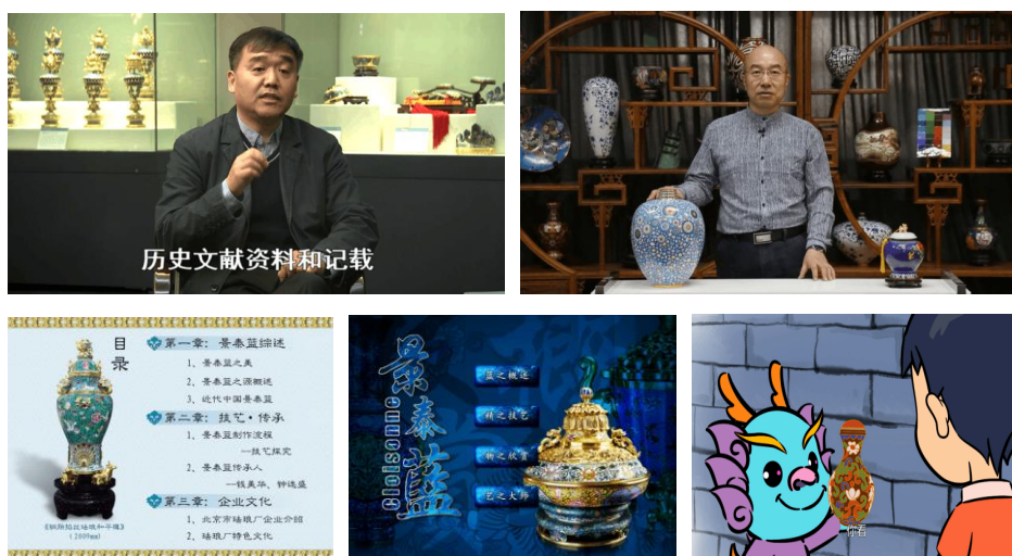
图18 学校师生开发的《景泰蓝》微课及动画产品