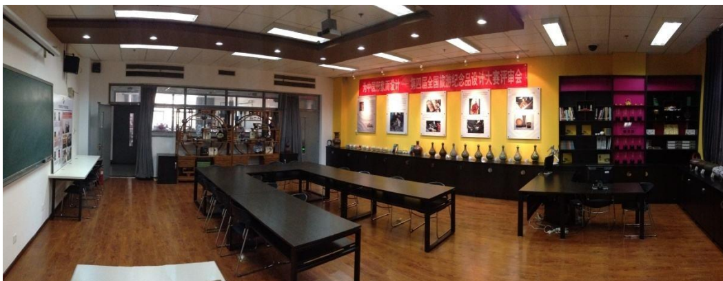
图1 景泰蓝工艺美术大师工作室

此外企业骨干技术人员还深入学校艺术设计专业建设，参与制定专业人才培养方案，建立专业课程体系，扶持中青年教师，参与开发核心课程及实践教材建设，企业每年为学校培养不少于1位老师，安排为期半年的全脱产专业实训，每位参与培训的老师不仅在景泰蓝工艺技术方面得到学习提高外，还了解到企业文化和企业管理理念，收集到许多宝贵素材资料，分析后将可运用于校内的实践教学案例中。