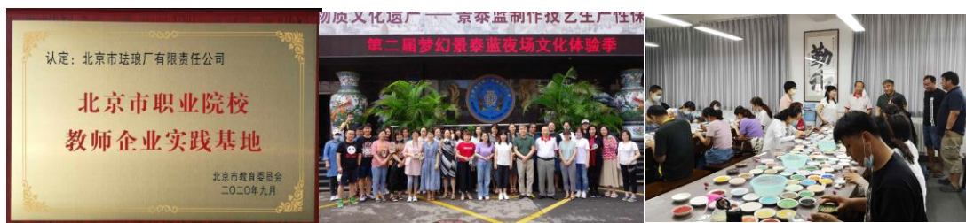
图15 教师企业实践基地为教师提供技能培训

2020年企业在学校的支持申报下正式成为北京市艺术设计“双师型”教师培养培训基地，并为学校40多位专任老师开办了两期《景泰蓝制作工》技能培训。