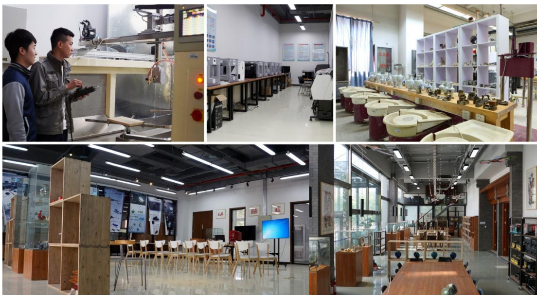
图3 国家级职业教育装饰艺术设计实训基地

随着双方合作的深入，2013年5月企业针对学院多个工作室现有空间和功能区分配不合理，不能有效地为教学及实训提供服务，建议优化整合校内外专业实训基地资源，协助学院积极申报了《2013年中央财政支持的职业教育民族文化遗产创新——装饰艺术设计专业（群）实训基地建设项目》，最终学校项目获得上级批复，央财和北京市财政共同投入资金300万。建设了全新的包含实践教学、传承技艺、研究开发、社会培训与鉴定、学术交流与作品展示等六个方面功能的实训基地，并在2015年投入使用。